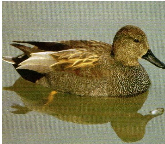
Slika 10. Patka kreketaljka (Mustapić, 2004.)

Patka kreketaljka ( Anas strepera ) je ugrožena gnjezdarica i nije lovna divljač. Obitava na otvorenim stajaćim ili sporotekućim eutrofnim (bogatim organskom produkcijom) nizinskim vodama s bogatom obalnom vegetacijom (trska, rogoz). Mužjak je prepoznatljiv po pretežito jednoličnom sivom ruhu s kestenjastim krilnim pokrovnim perima i crnim nadrepkom i podrepkom. Ženka slični ženki divlje patke (gluhare), ali je manja, sivkastija, s kraćim i sitnijim kljunom. U letu se ističe bijeli trbuh (u gluhare je smeđ) i crno-bijelo zrcalo (u gluhare plavo). Nešto su manje od gluhara, teže od 0,5 do 1,1 kilograma. Mlade su ptice slične ženkama, ali su pera na leđima i bokovima riđe obrubljena. Najduži životni vijek zabilježen u prirodi jest 13 godina (Mustapić, 2004.).