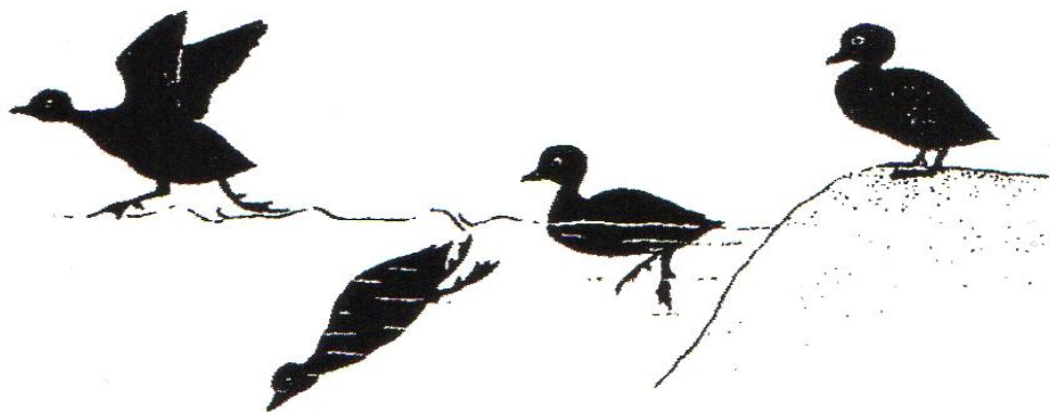
Slika 14. Siluete patke ronilice (Mustapić, 2004.)