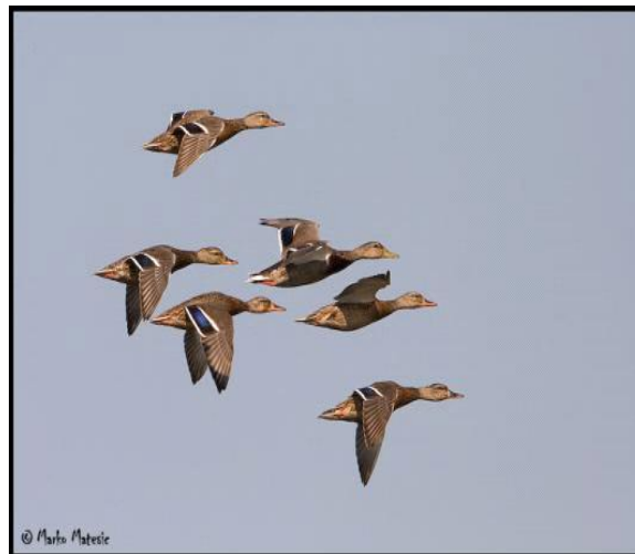
Slika 3. Migracije divljih pataka

Divlje patke žive u velim skupinama tj. jatima i radi toga se smatraju izrazito društvenim pticama. U svoje jato prihvaćaju sve pripadnike iz porodice pataka. U rezervatima i na ostalim mjestima gdje nije uznemiravana, ova je ptica aktivna i danju. Let divlje patke je brz i postojan. Tijekom migracija, njihov let poprima oblik slova V. Međutim, kod ptica koje su tijekom migracija uznemiravane, ova formacija nije konstantna već se od jedne bare do druge kreću u velikom jatu ili u isprekidanim redovima. Međutim, one također povremeno migriraju tijekom razdoblja duže zime kako bi pronašle zaklon duž nezaleđenih tokova velikih rijeka. Pridružuju im se jata ptica selica iz nordijskih zemalja koje se u kolovozu počinju spuštati u toplije krajeve. Migracije dosežu vrhunac koncem listopada, a povratak započinje tijekom siječnja ili veljače. (Durantel, 2007.).