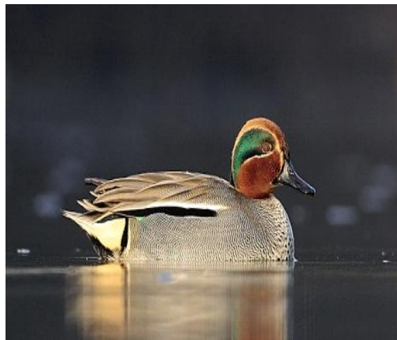
Slika 8. Patka kržulja – mužjak

( https://hr.wikipedia.org/wiki/Kr%C5%BEulja ).