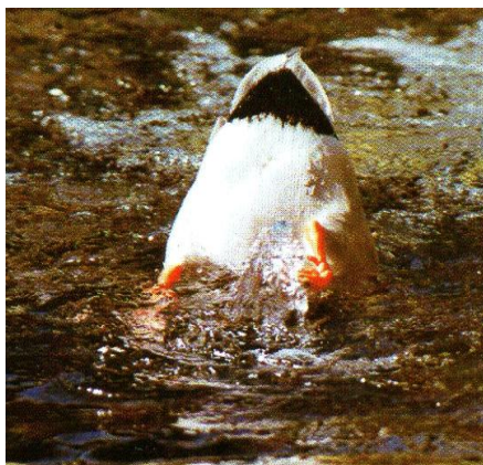
Slika 4. Patka plivarica u potrazi za hranom (Mustapić, 2004.)

Patke plivarice hrane se s površine vode ili da zarone samo prednjim dijelom tijela koji im je dovoljan da pronađu hranu. Navedena činjenica vodi nas u spoznaju kako se radi o patkama koje zapravo ne rone već imaju dovoljno velik vrat da uz malo zaronjeni prednji dio tijela uspiju doći do željene hrane. Ponekad se zna dogoditi da rone, ali to je samo u iznimnim situacijama, odnosno kada se osjećaju ugrožene i da ne mogu poletjeti.