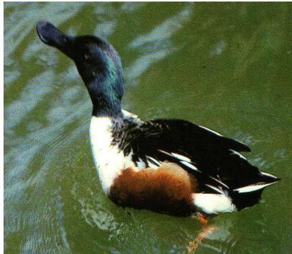
Slika 12. Patka žličarka (Mustapić, 2004.)

Patka žličarka ( Anas clypeata ) je do početka 20. stoljeća bila gnjezdarica Kopačkog rita. Danas kao preletnica i zimovalica obitava u cijeloj Hrvatskoj, ali je malobrojna i ugrožena, osobito zimi. Zadržava se na otvorenim stajaćim eutrofnim (bogatim organskom produkcijom) nizinskim vodama, obično s razvijenom obalnom vegetacijom. Društvene su, drže se u manjim jatima, obično od 20 do 30 ptica. Među svim patkama kljun žličarke je najprilagođeniji filtriranju vode: gornji i donji dio kljuna opremljeni su poput vlasi finim nitima, na kojima se zadržavaju hranjive čestice, dok voda izlazi van. Stoga se pretežito hrani planktonskim račićima, ali i sitnim mekušcima, kukcima i njihovim ličinkama, sjemenkama i komadićima bilja. Hranu prikuplja dok polako pliva i širokim kljunom sa same površine, ili uronjenim kljunom ili glavom, grabi vodu skupa s hranom. (Mustapić, 2004.).