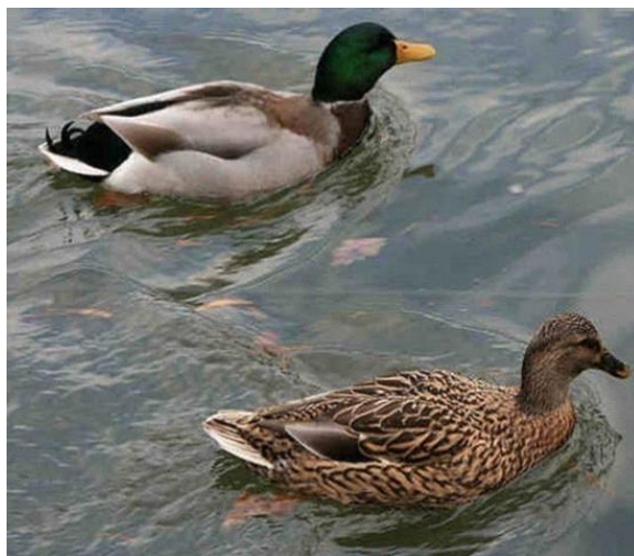
Slika 1. Ženka i mužjak divlje patke gluhare (Durantel, 2007.)

Divlje patke su jedna od najbrojnijih i najrasprostranjenijih skupina među lovnim vrstama ptica. Obitavaju na raznolikim tipovima vodenih staništa, od plitkih močvara, gdje su najbrojnije, do jezera, od potoka i kanala do velikih rijeka. Sve patke za mitarenja tijekom ljeta gube sva letna pera i oko mjesec dana ne mogu letjeti (Mustapić, 2004.). Divlje patke gluhare slove za najpoznatijeg pripadnika skupine plivačica. Za mužjake je karakteristično da za vrijeme parenja perje na glavi imaju sjajno zelene boje s bijelom prugom oko vrata, perje po tijelu je svijetlo sive boje, dok ispod vrata i na vratu dominiraju pera crne boje. Boja nogu je izrazito narančasta, a kljun je žuto zeleni. Ženke se razlikuju od mužjaka po izgledu, a nerijetko ih se smatra i neuglednijima od mužjaka. Razlika između perja ženke i mužjaka divlje patke prikazana je na Slici 1.