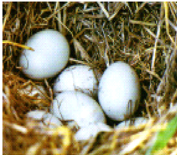
Slika 7. Gnijezdo s jajima patke gluhare (Mustapić, 2004.)

Patka gluhara nalazi se na cijelom području Republike Hrvatske, ali ipak najviše obitava u nizinskom dijelu. Jedan dio patki gluhara su selice, za razliku od polovine koja se odnosi na stanarice. One koje su selice znaju doći i na iznimno velike udaljenosti, kao što je primjerice sjeverna Afrika. U našoj zemlji najviše patki gluhara može se zapaziti tijekom jeseni.