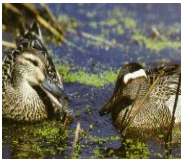
Slika 9. Patka pupčanica – ženka i mužjak (Mustapić, 2004.)

Patke pupčanice ( Anas querquedula ) obitavaju na prostorima močvara, a u razdoblju selidbe mogu se pronaći po rijekama i barama. Nešto je krupnija i izduženija od kržulje, mase 250 - 550 grama. Visoko čelo glavu joj čini uglatijom. Mužjak je lako prepoznatljiv po uočljivoj, širokoj i dugoj bijeloj nadočnoj pruzi. Lice je u mladih i ženki, nasuprot kržulji, isprugano, svijetlim mrljama na osnovu dužeg i šireg kljuna, nedostaje im bijela oznaka na osnovi repa vidljiva u kržulje. U letu se ženke i mlade sa sigurnošću mogu prepoznati po uočljivoj kombinaciji zelenog zrcala, s gornje u donje strane omeđenog podjednakim bijelim prugama i plavosivim prednjim dijelom krila odozgo. Najduži je zabilježeni vijek u prirodi deset godina (Mustapić, 2004.).