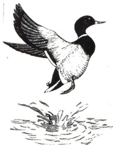
Slika 5. Uzlijetanje s vode patke plivarice (Mustapić, 2004.)

Patke plivarice razlikuju se od pataka koje rone po tome što su lakše građe, te su samim tim i vitkije. Lakša građa tijela doprinosi lakšem letu. Pri polijetanju patke plivarice odbace se nogama i nakon toga odmah polete bez dodatnog zatrčavanja po vodi (Slike 5. i 6.).