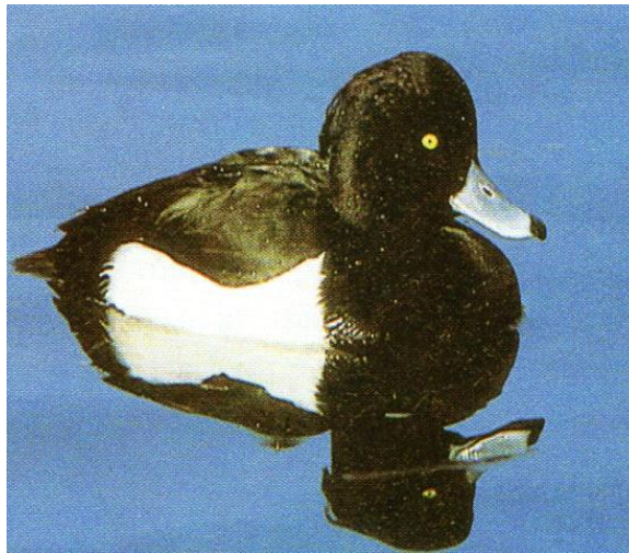
Slika 16. Patka krunasta (Mustapić, 2004.)

Patka krunasta ( Aythya fuligula ) je patka srednje veličine. Ubraja se u lovnu skupinu pataka ronilica koje se love od 1. rujna do 31. siječnja. Njihova populacija je jako velika, otprilike milijun jedinki. Staništa u kojima se krunasta patka gnijezdi su močvare i jezera u kojima je izrazito bogata vegetacija. Osim toga, patka krunasta može se naći u drugim područjima, primjerice u obalnim lagunama ili čak u ribnjacima.