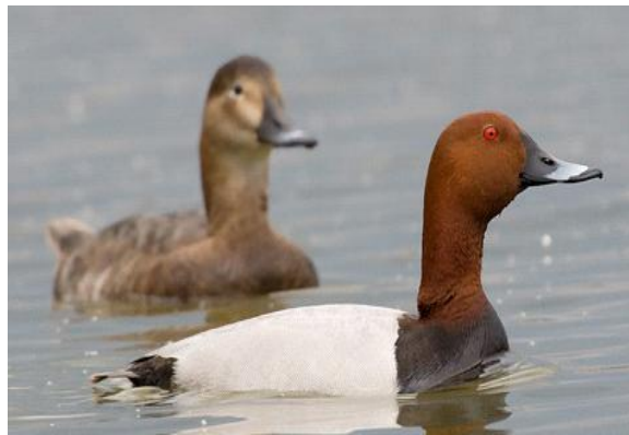
Slika 15. Glavata patka

U Hrvatskoj je od svih pataka ronilica najzastupljenija glavata patka ( Aythya ferina ). Hrani se vodenim biljkama, mekušcima, vodenim kukcima i manjim ribama. Najčešće u potragu za hranom kreće noću. Društvena je, zimi formira velika jata, u kojima se često nalaze i druge vrste pataka, kao što je krunasta patka, a poznato je da se s tom patkom ponekad križa. Staništa za vrijeme sezone parenja su joj močvare i jezera s metrom ili malo više dubine. Gnijezdi se širom Europe, te u Aziji. Selica je, prezimljuje se na jugu i zapadu Europe.