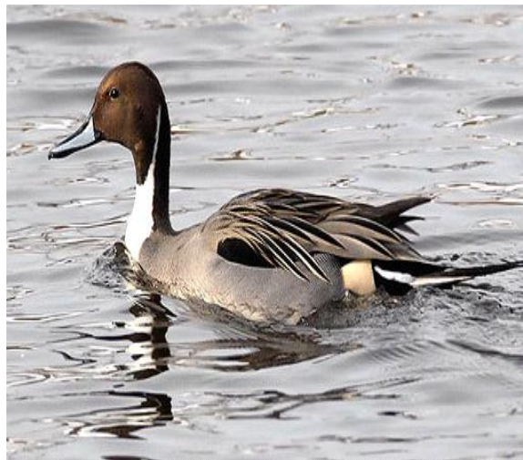
Slika 11. Patka lastarka

Ova vrsta u Republici Hrvatskoj nije lovna divljač.