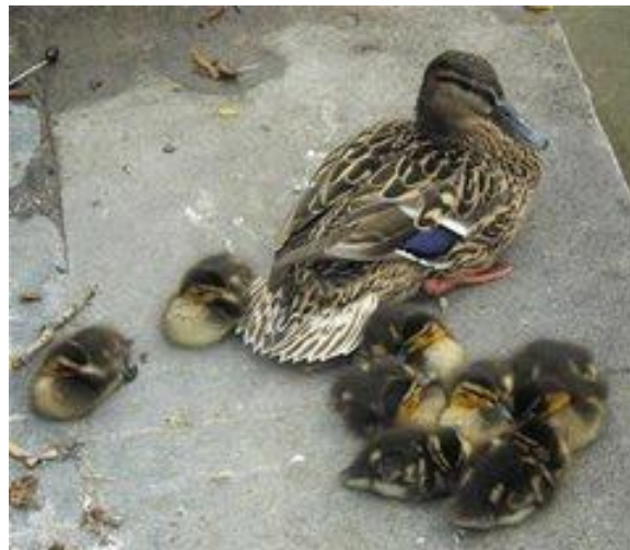
Slika 2. Majka patka s pačićima

Mužjak i ženka postaju parom u listopadu tako da mužjak pokazuje svoje perje ženki, što je poznato pod nazivom šepurenje. Na početku siječnja par odlazi u izolaciju gdje mužjak ima zadaću da brani područje na kojem se nalaze od možebitnih uljeza. Za pravljenje gnijezda zadužena je ženka. Gnijezdo može biti na zemlji, na nekom povišenom mjestu ili pak između obalne vegetacije. Jaja su zelenkaste boje i ima ih osam do dvanaest. Kada ženka ide u potragu za hranom na jaja stavlja perje kako ne bi bila izložena grabežljivcima. Inkubacija traje od 26 do 29 dana, nakon čega dolazi do izlaska pačića iz jajeta. Pačići se u gnijezdu zadržavaju kratko, svega nekoliko sati i onda odlaze s majkom na plivanje. Budući da su pačići mali i još uvijek nisu sposobni braniti se od grabežljivaca izloženi su brojnim opasnostima. Neki od grabežljivaca koji predstavljaju opasnost za pačiće su lisica, štika, tvor, ali i mnogi drugi. Zbog čestih napada grabežljivaca na pačiće smrtnost je relativno velika. Pačići koji navršše dva mjeseca nazivaju se poletarcima jer u to vrijeme počinju letjeti. Divlja patka obično nese jaja samo jednom godišnje, rijetko dva puta. U slučaju da gnijezdo bude uništeno onda se zna dogoditi da se divlje patke prijevremeno gnijezde.