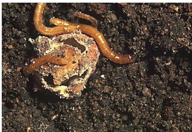
Slika 13. Žičnjak

Zaštita: Primjena insekticida prije sjetve ili sadnje, ako je prag štetnosti od 3 do 5 žičnjaka na m 2 .