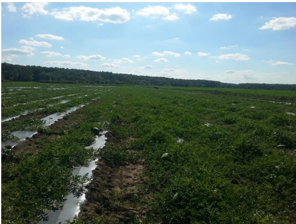
Slika 20. Lubenica na Pz. Golijat