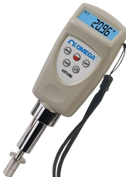
Slika 7. Penetrometar (pseno.hr)

Vrijeme berbe je kada dinja dostigne punu zrelost, a određuje se na osnovu lakoće odvajanja plodne drške od ploda ili pomoću penetrometra. Penetrometar mjeri čvrstoću ploda na temelju otpornosti prema prodiranju u tkivo (slika 7.). Dinja ne povećava sadržaj šećera nakon berbe kao drugo voće stoga tijekom berbe treba biti oprezan da se ne bere ranije. Kad se plod lako odvaja od drške dinja je zrela. Ovisno o sorti i načinu uzgoja, prinos dinje kreće se od 15 do 40 t/ha.