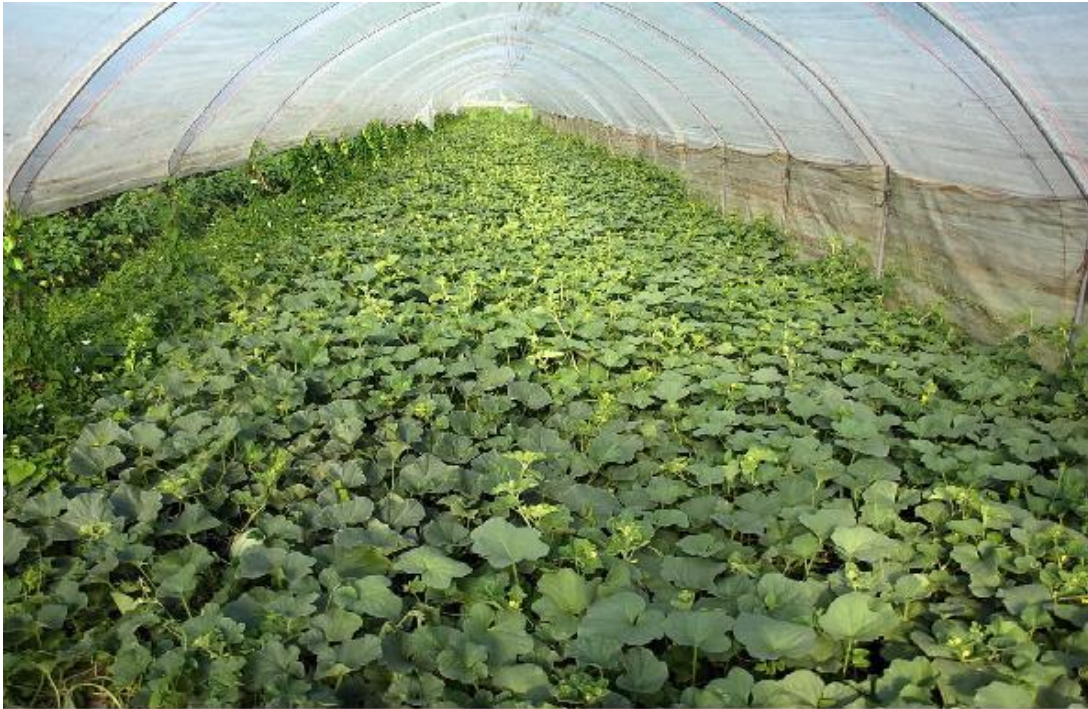
Slika 6. Proizvodnja lubenice u plasteniku ( www.agroportal.hr )

Najisplativija je rano proljetna proizvodnja u plastenicima i staklenicima, koja može biti horizontalna ili vertikalna (slika 6.). Poslije lubenice tlo ostaje čisto te je time pogodno za uzgoj drugih kultura. Sjetva presadnica se odvija krajem siječnja i nakon 30 do 35 dana biljke su spremne za presađivanje. Ista je priprema tla kao i za proizvodnju na otvorenom. Nakon sadnje biljke je potrebno dobro zaliti. Temperatura tijekom sunčanog perioda treba biti od 22 do 24°C, a noću od 15 do 17 °C. Tijekom vegetacije je potrebno regulirati rast lubenice, tako da se ostave 2 do 3 loze, a vrh se zakine iza trećeg list posljednjeg ploda, odnosno trećeg ploda. Oprašivači (bumbari i pčele) su neophodni za vrijeme cvatnje te je poželjno stavljati košnice ili bio-bumbar u staklenike ili plastenike.