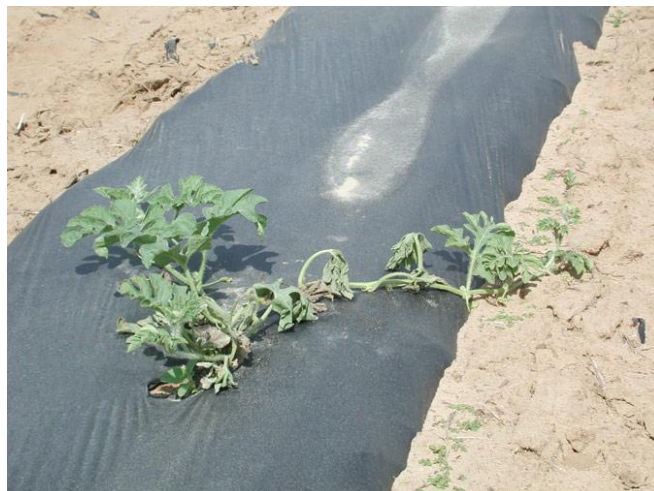
Slika 8. Venuće (extension.entm.purdue.edu)

Gljiva preživljava na zaraženim biljnim ostacima. Nakon njihova raspadanja dospijeva u tlo, gdje može preživjeti i više od 10 godina. Prokljale hlamidospore, mikrokonidije i makrokonidije iz tla su izvor primarnih infekcija koje nastaju na meristemskom vrhu korijena, kroz pukotine nastale pri rastu sekundarnih korijenčića ili kroz rane nastale od mehaničkim djelovanjem.