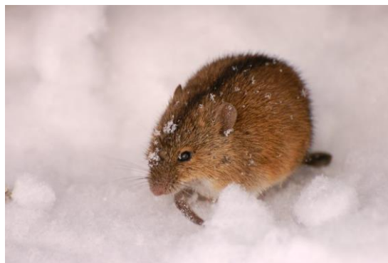
Slika 15. Prugasti poljski miš

Suzbijanje rodenticidima u obliku mamaca koje treba stavljati u aktive rupe glodavaca.