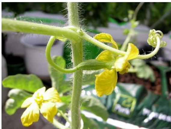
Slika 3. Cvijet lubenice

Cvijet: Cvjetovi su pojedinačni, intenzivno žute boje (slika 3.). Otvaraju se u jutarnjim satima i cvjetaju samo jedan dan. Neoplođeni ženski cvjetovi ostanu otvoreni više dana. Indentični su cvjetovima ostalih tikvenjača. Lubenica je stranooplodna bilja pa oprašivanje vrše kukci, prije svega pčele.