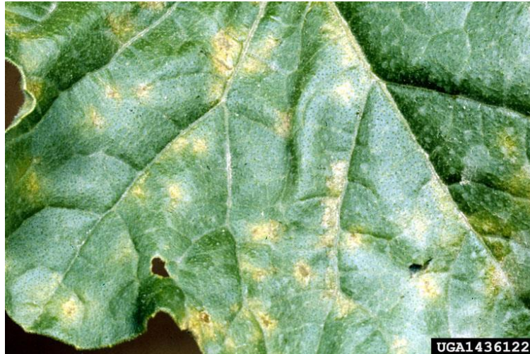
Slika 12. Plamenjača na listu dinje

Sjetvu treba obaviti na parcelama na kojima prošle godine nisu rase biljke iz porodice tikvenjača, treba sijati relativno otporne hibride, upotreba fungicida.