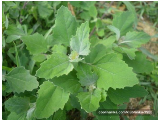
Slika 18. Loboda

Suzbijanje: Primjenom neselektivnih herbicida