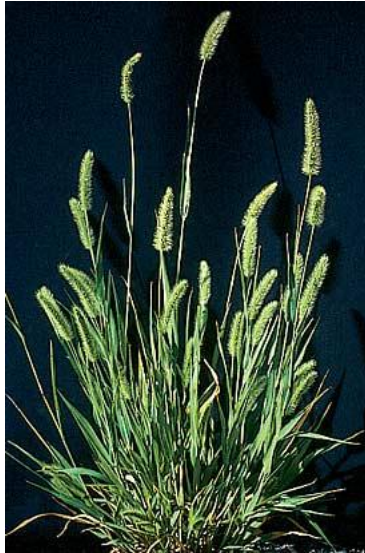
Slika 19. Zeleni muhar

Suzbijanje: mogućnost suzbijanja mehaničkim, kemijskim i biološkim mjerama.