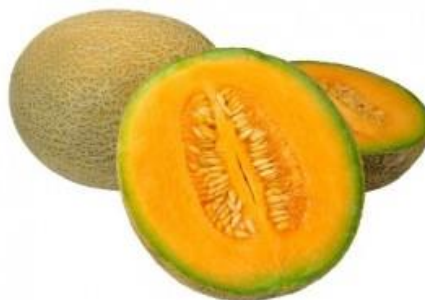
Slika 2. Dinja

Dinja ( Cucumis melo ) je jednogodišnja biljka takođe podrijetlom iz Afrike, a pripada porodici Cucurbitaceae ili bundeve (slika 2.). U Kini je bila poznata već 1000 godina p.n.e. Prema Bibliji kada su Izraelci napustili Egipat i s Mojsijem četrdeset godina lutali pustinjom, žalili su za svojom omiljenom hranom, posebice dinjom. Slike iz gradova Herkulanuma i Pompeja (79.g.) upućuju na to da su i Rimljani poznavali dinju ( www.coolinarka.com ).