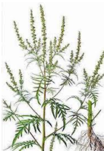
Slika 16. Ambrozija