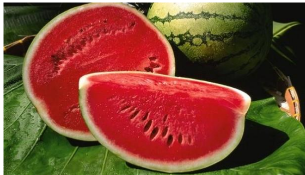
Slika 1. Lubenica

Lubenica je vrlo stara kultura, koja je u Egiptu bila vrlo cijenjena, što potvrđuju i tragovi iz egipatskih grobnica starih više od 4000 godina (slika 1.). Porijeklom je iz središnje Afrike, a s vremenom se širila na Bliski istok, Kinu, Indiju i Europu. Divlji oblici lubenice mogu se naći u južnoj Africi, u pustinji Kalahari, gdje ljudima služi kao hrana i piće. Lubenica se u svijetu uzgaja na više od 3 milijuna hektara s prinosom od gotovo 80 milijuna tona, što je najviše od uzgajanog povrća uopće. Proizvodnja lubenica u Republici Hrvatskoj je u stalnom porastu, a proizvodi se na otvorenom polju, u plastenicima i kombinirano (Parađiković, 2009.).