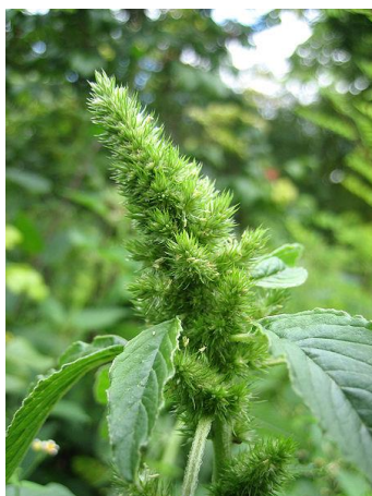
Slika 17. Šćir

Suzbijanje: agrotehničke mjere daju dobre rezultate u suzbijanju štira, a one obuhvaćaju, održavanje ujseva u čistom stanju pljevljenjem, upotrebu čistog sjemena za sjetvu, okopavanjem, primjenom herbicida.