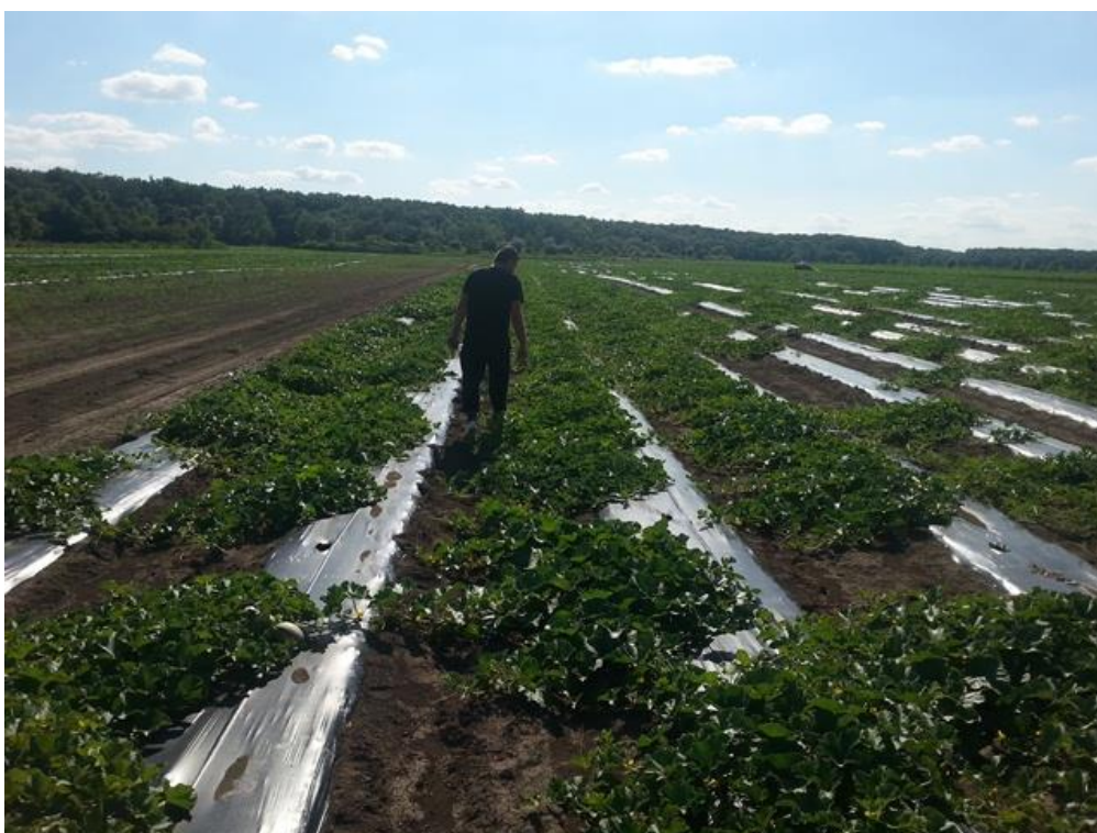
Slika 21. Dinja na Pz. Golijat