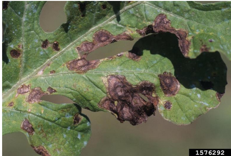
Slika 9. Crna pjegavost lista lubenice