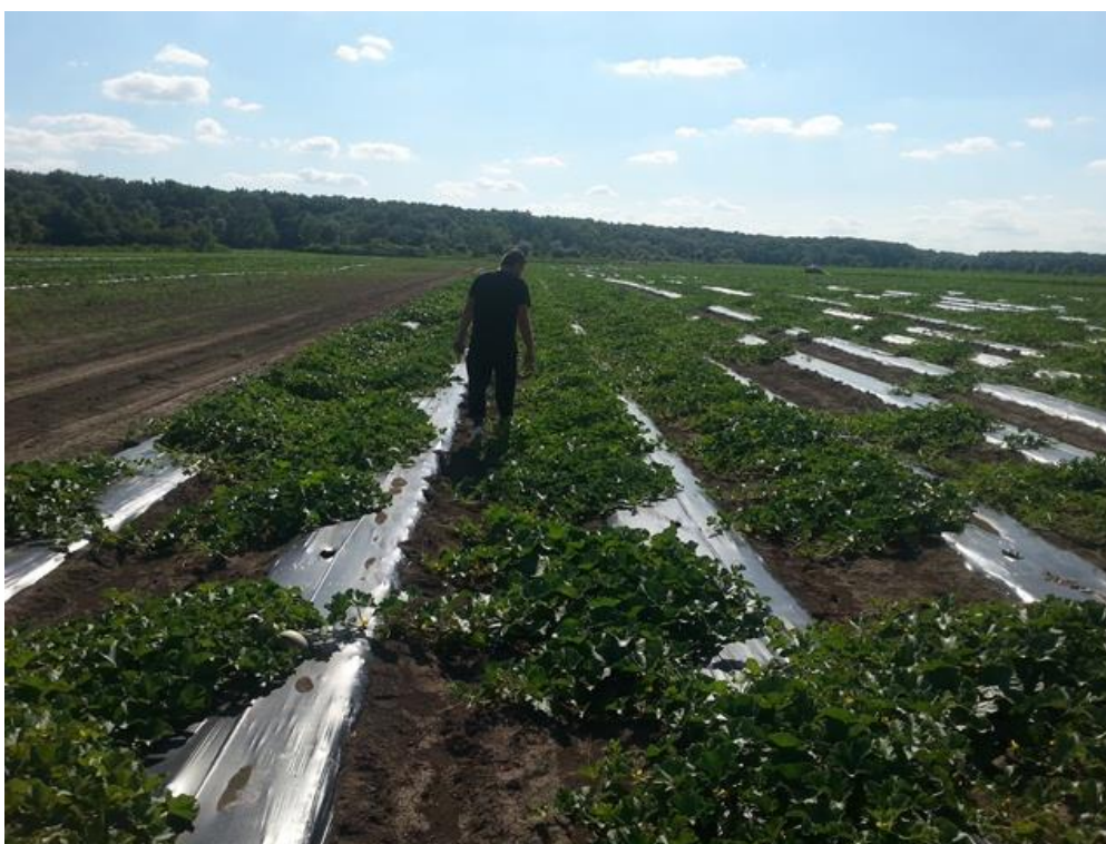
Slika 21. Dinja na Pz. Golijat