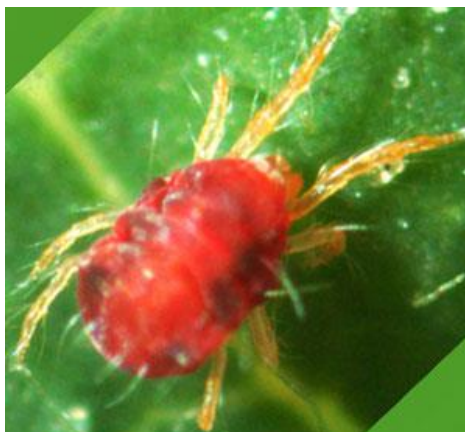
Slika 14. Koprivin crveni pauk

Mehaničkim (uništavanje korova), i kemijskim (primjena akaricida) putem.