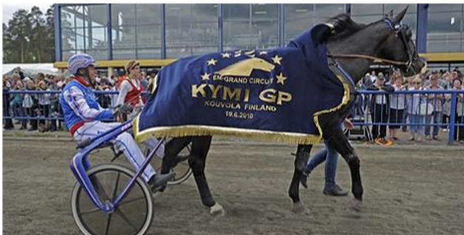
Slika 6. Pobjednik Kymi GrandPrix-a 2010

Amerike od strane finskih interesa) bio je drugi na Europskom prvenstvu za petogodišnjake prošle godine ( http://www.harasdestrotteurs.com.au/#!italian-trotting-stats/cz6j ).