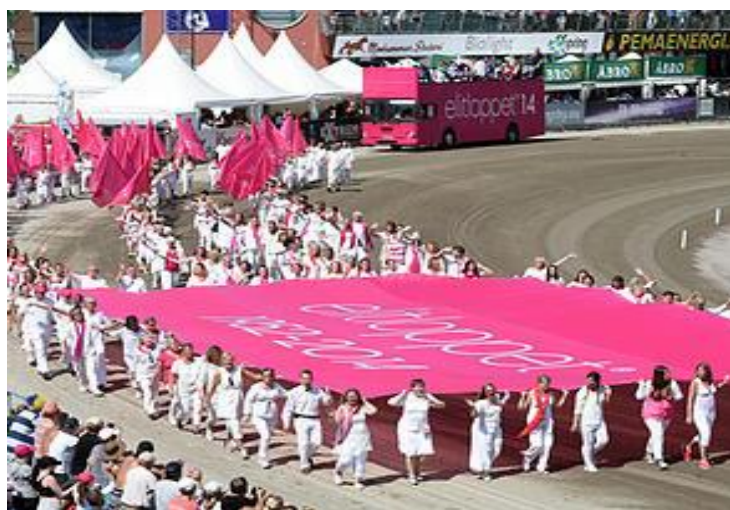
Slika 5. Elitloppet 2014.

dežurati pred vratima hipodroma, da bi kad se vrata ujutro otvore, pohrlili na tribinu rezervirati najbolja mjesta obučeni u majice švedske reprezentacije, sa zastavama u ruci i vikinškim šljemovima na glavi. Tako će naravno biti i ove godine. Preko 30-tak tisuća ljudi natiskat će se na jednom od najljepših svjetskih hipodroma da posvjedočivrhunskom trkačem danu koji će okupiti praktički sve najbolje konje i vozače iz najjačih kasačkih nacija na svijetu, SAD-a, Kanade, Francuske, Italije, Njemačke, Finske i naravno domaćina Švedske, a "poslastica dana" bit će kao i uvijek dvije kvalifikacijske utrke i veliko finale Elitloppet, kad će cijela Švedska zastati na dvije minute i pozdraviti novog prvaka.