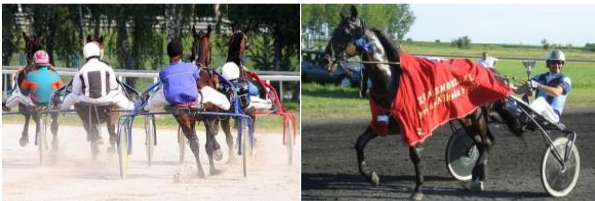
Slika 10. i 11. Sulke ( http://cavalier-noir.org/category/sport/kasacke-utrke-sport/ )

Opremu za kasačke trke sačinjavaju sulke i bagi, zaprežni pribor i zaštitna oprema za konje. Sulke (engl. Sulky) su veoma laka kolica na dva gumena kotača. Tipova sulki ima veoma mnogo. Na američkim sulkama tipa Houghton, osovine kotača pričvršćene su na dvokrake viljuške koje se jednim krakom nastavljaju na nosač rukunica, a drugim pričvršćuju na same rukunice. Rukunice su od drva i duge oko dva metra. Svojim nešto produženim zadnjim dijelom pričvršćene su za nosač rukunica. Sjedište vozača je pričvršćeno za gibanj, postavljen na produženom dijelu rukunica ili je pričvršćeno za jednu prečku bez gibanja. Otprilike jedan metar od svog zadnjeg kraja, rukunice su spojene prečkom, na kojoj je s gornje strane blatobran s donje strane su metalni oslonci za noge vozača. Na sredini i na prednjem dijelu rukunica, sa svake strane su po tri kožne alke preko kojih se sulke spajaju sa hamom.