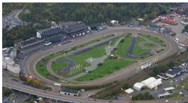
Slika 9. Trkača staza( http://www.sportskiobjekti.hr/default.aspx?id=217 )

Što se tiče tehnike izvođenja utrka, postoje one koje se puštaju auto-startom kada svi konji startaju iza startnog automobila u vožnji sa iste distance i handicap utrke gdje se koji puštaju „iz gume“ s pojedinih distanci ovisno o postignutim vremenima ili zaradi, a da bi svi imali jednaku šansu u utrci( http://www.sportskiobjekti.hr/default.aspx?id=217 ).