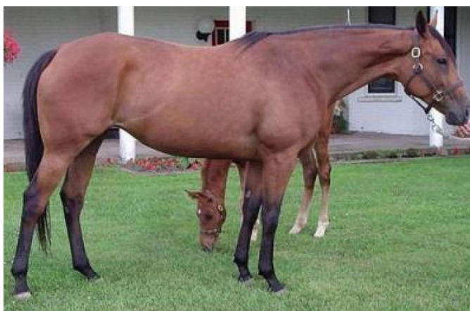
Slika 15. Francuski kasač

Po izgledu kasači su jako slični i samo su male razlike među njima. Francuski kasač ima dugu glavu ravnog profila, dugi vrat, izražen greben, čvrsta leđa dobrog spoja, mišićave sapi, izraženi zglobovi. Uglavnom se javljaju u kestenastoj ili riđoj boji, izdržljivi su energični ali nemaju potpuno stabilan karakter. Osim za kasačke utrke, ovi se kasači koriste rjeđe i u preponskom jahanju. Veliki utjecaj ostavljaju na kasače u Njemačkoj, Italiji, Nizozemskoj i drugim europskim državama.Francuski se kasači uzgajaju samo u čistoj krvi i služe za rasplod ( http://blog.dnevnik.hr/print/id/1624728245/francuski-kasac.html ).