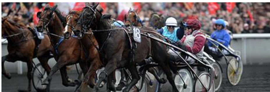
Slika 4. Ready Cash osvaja Prixd'Amerique

U čast ulaska Sjedinjenih Američkih Država u Prvi Svjetski rat, od 1920. godine posljednje nedjelje u siječnju održava se ova najprestižnija utrka na svijetu. U srcu Vinsenskog parka nalazi se hipodrom Vinsent „hram“ kasača ( http://www.kasackenovine.com/prix-d%E2%80%99amerique-2012-pariz/ ), koji je ujedno i jedanaesti okrug Pariza. Na klasičnoj duljini od 2700 metara utrukuje se osamnaest najboljih, a pobjednik dobiva nagradu od milion eura.