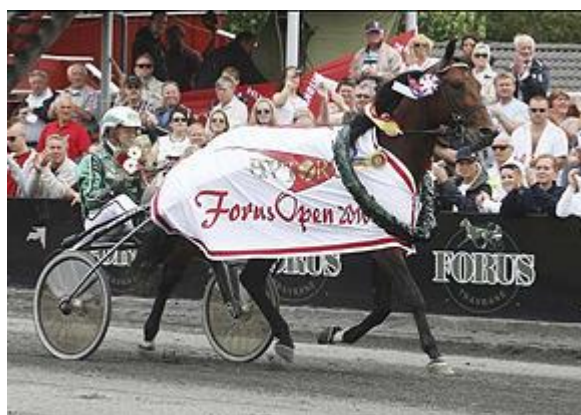
Slika 7. Pobjednik Forus Open-a 2010

U Norveškoj je aktivno zapošljavanje mladih u kasačkom sportu kroz utrke ponija. Više od 1 000 djece i adolescenata su licencirani za sudjelovanje u utrkama ponija. Sport na višoj razini podupire tek nešto više od 200 profesionalnih trenera i 1 503 profesionalna vozača te oko 50 naučnika i 600 amaterskih vozača ( http://www.harasdestrotteurs.com.au/#!italian-trotting-stats/cz6j ). Glavni zadatak Norveške kasačke udruge je očuvanje konja u Norveškoj financiranjem iz dobitaka od oklada. Promet kladenja u Norveškoj je porastao 31,67% u posljednjih 5 godina , sa 388 miliona eura na 512 miliona eura.