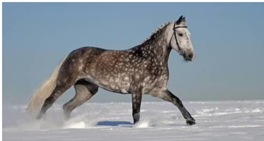
Slika 14. Orlov kasač

Orlov kasač spada u kategoriju lakih toplokrvnih konja, to je jedna od najpoznatijih i najstarijih pasmina konja u Rusiji. Oni nisu toliko brzi kao francuski kasači, ali su masivniji, robusniji i izdržljiviji te je njihov kas impresivniji. U Rusiji je iznimno cijenjen i kao lokalnih pasmina. Pasminu je formirao grof Orlov sa ciljem dobivanja vrhunskog trkaćeg konja. To je zaprežni konj te se većinom koristi za utrke jednosjeda i troike. Visine je od 155 do 162 cm, a najčešće su sive, crne i smeđe boje. Ima kratak i brz korak sa izraženom akcijom koljena. Glava mu je grubljeg izgleda s vidljivim utjecajem arapskih konja, vrat dug i blago povijen, a greben nije toliko izražen, noge su duge i elegantne ( http://konj.forumotion.net/t16-orlov-trotter-orlov-kasac ). To je konj elegantnog izgleda, vatrenog temperamenta i ugodne naravi.