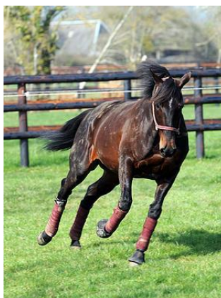
Slika 3. Ready Cash - najbolji kasački konj svih vremena sa osvojenih 5.71 milijuna dolara ( http://www.harasdestrotteurs.com.au/#!/trotting-in-europe/c1nb6 )

Nema dovoljno utrka za sva dobra grla proizvedena u Francuskoj. Međutim, jednom kada ste kvalificirani, postoje utrke za vaše starosne skupine i klasu za lijepu novčanu nagradu, od dvije godine starosti sve do desete godine starosti, kada konj više nije podoban za utrke na Francuskom tlu ( http://www.harasdestrotteurs.com.au/#!/trotting-in-europe/c1nb6 ).