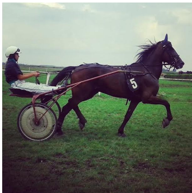
Slika 2. Kasač vuče sulke( http://www.kasackenovine.com/wp-content/uploads/2015/09/3.jpg )