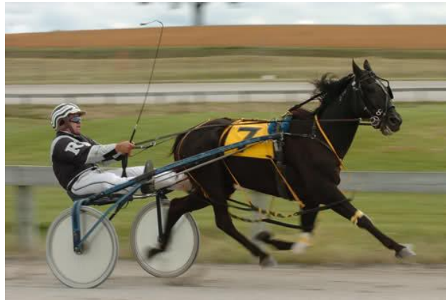
Slika 13. Američki kasač( http://equus.board-directory.net/t10-americki-kasac )

dorati, vranci i alati. Kasači imaju posebno kretanje: trkači kas obilježen dugim i glatkim pokretima ili korak su najvažniji načini kretanja, koraci nisu produženi tj. ne smiju preći u kenter ili galop. Ova se pasmina najviše koristi u kasačkim trkama dok se ne koristi kao preponaš iako bi mogao imati uspjeha i u tom sportu zbog svog izdašnog karaktera ( http://equus.board-directory.net/t10-americki-kasac ).