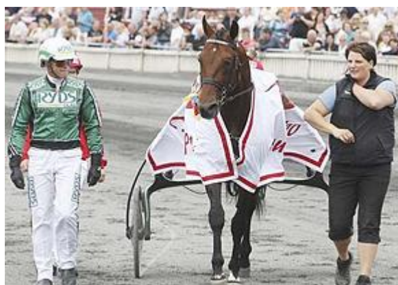
Slika 12. Oprema vozača kasačkih utrka

Oprema vozača sastoji se od vozačke kape ili šljema, vozačkog dresa, cilindra, vozačkih cipela te biča. Sivi cilindar nose takmičari vozači – amateri na takmičenju zaprega. Vozačke kape su u kombinaciji sa bojom dresa, one označavaju registriranu boju dresa trkače štale. Vozački dres može biti isti kao dokejski, a može se nositi izvan hlača. Boje vozačkog dresa također se registriraju. Bičeva ima različitih već prema njihovoj namjeni. Bič za kasačke trke je jednostavan, dug do 1,10 m.