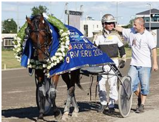
Slika 8. Pobjednik CharlottenlundRacetrack-a 2013

Konjičkim sportom u Danskoj upravlja Danska Središnja kasačka Federacija. Svake godine organizira se više od 2 000 zaprežnih utrka na 8 staza, 5 od njih je posvećeno kasu. Dane BilgerJorgensen osvojio je svjetsko prvenstvo u vožnji 1989.g. te dvadeset godina poslije – 2009.g., a prošle godine bio je prvak Danske sa 142 pobjede, ispred Knud (Monstera), Rene Kjaerai braće Jull – Jeppea i Steena ( http://www.harasdestrotteurs.com. ). Ukupno, Danska ima 68 profesionalnih trenera i 334 profesionalna vozača te imaju jednu od najvećih skupina amatera u Europi sa 844 registrirana vozača.