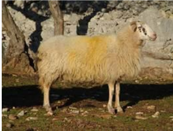
Slika 8. Krčka ovca