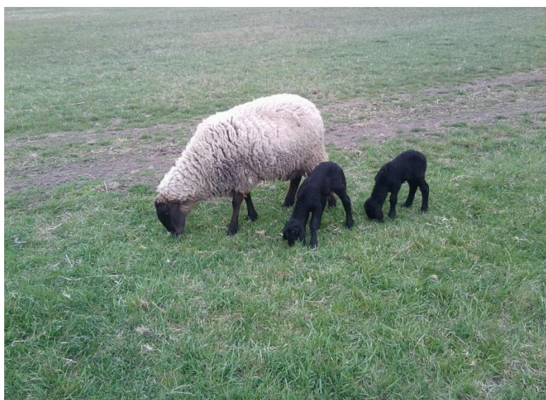
Slika 5. Ovca i janjad cigaja pasmine