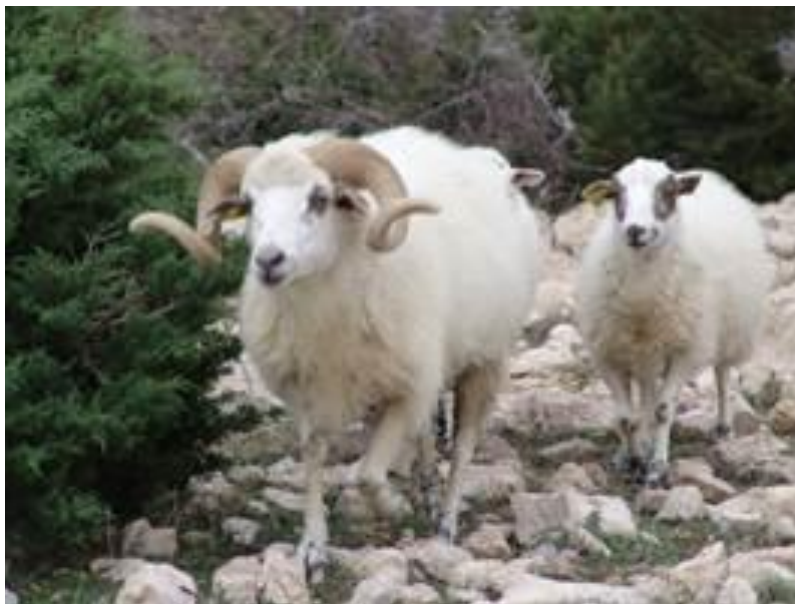
Slika 9. Ovan i ovca paške pasmine