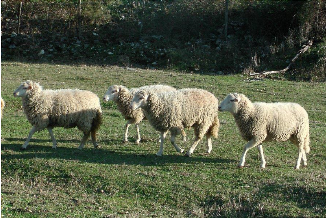
Slika 1. Dubrovačka ruda