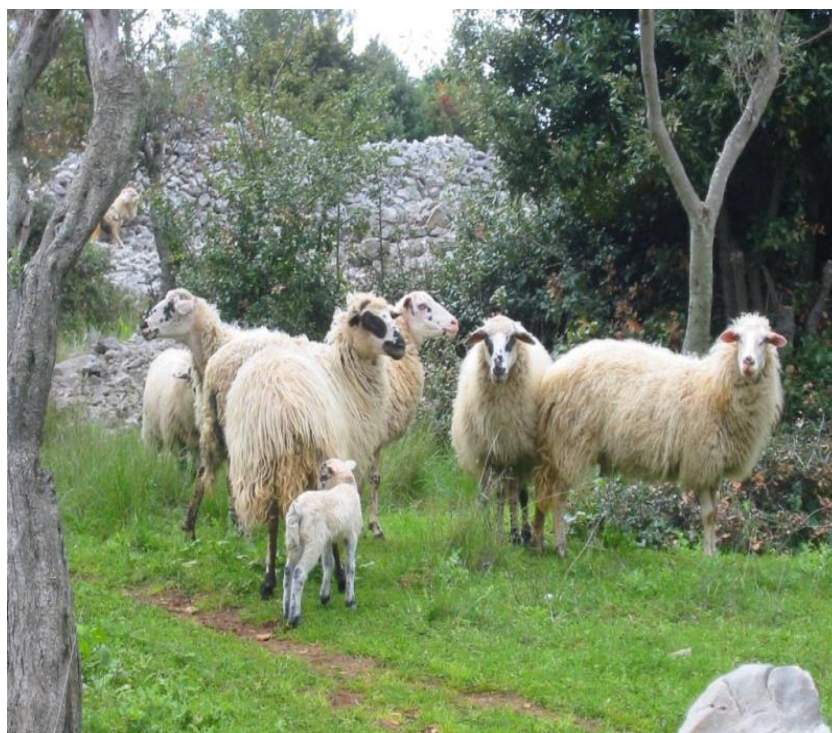
Slika 7. Creska ovca

Veličina populacije procjenjuje se na oko 15000 čistokrvnih creskih ovaca. Posljednjih godina ova pasmina je izrazito izložena napadima divljači, no ipak populacija blago raste što nam govore podaci iz upisnika uzgojno valjanih grla te je vidljivo iz tablice 9. da je od 2011. do 2013. populacija uzgojno valjanih ovaca porasla sa 912 na 995.