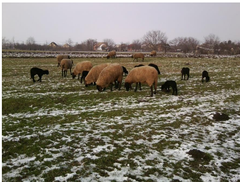
Slika 4. Zimska ispaša ovaca i janjad cigaje