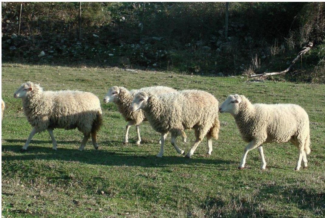
Slika 1. Dubrovačka ruda