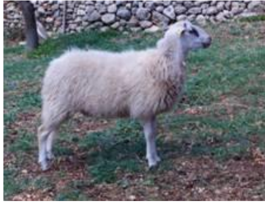
Slika 6. Rapska ovca