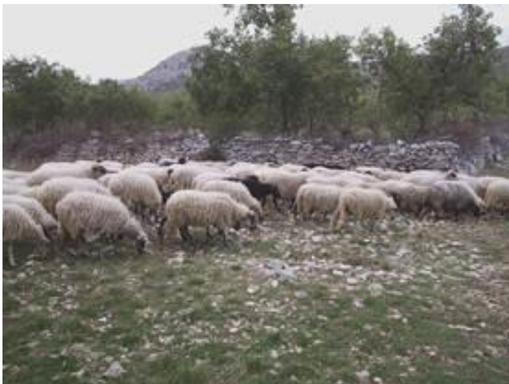
Slika 12. Dalmatinska pramenka