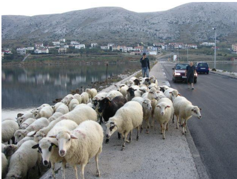
Slika 10. Paške ovca pri povratku s paše