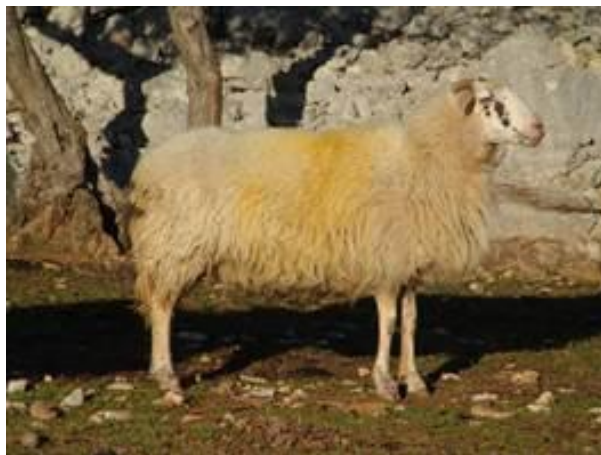
Slika 8. Krčka ovca