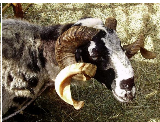
Slika 3. Ovan istarske pasmine