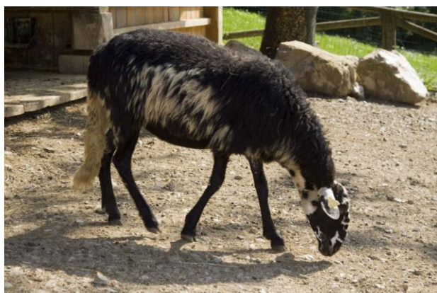
Slika 2. Istarska ovca