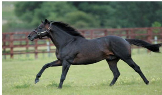
Slika 12. Shareef Dancer

Kao trkači konj Shareef Dancer(Slika 12.) izvodi skromno počevši pet utrka, postavljanjem 3-1-0 rekorda, zaradio je 246.463 $.( http://www.horsecollaborative.com/most-expensive-horses-ever-sold/ )Prateći njegovu natjecateljsku karijeru kupio ga je Emir od Dubai za 40 milijuna $ u 1983. Zahvaljujući korijenima Northern Dancer, od Shareef Dancera se očekivalo da će biti prvoklasan pastuh. Shareef Dancer je imao vrlo uspješnu i profitabilnu karijeru kao oca, uzgojni konj u čijoj kombinaciji dobitak prelazi više od 2 milijuna $.