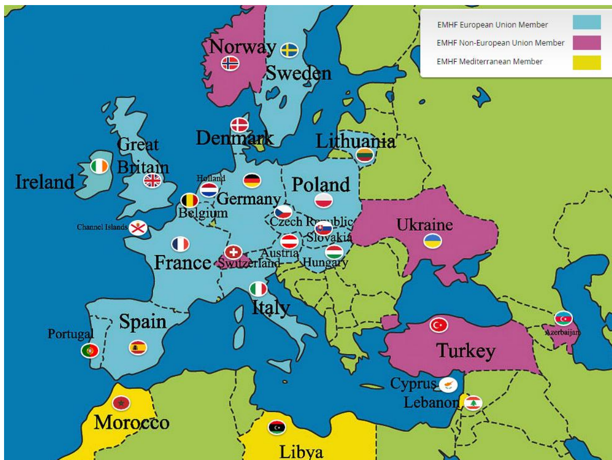
Slika 18. Europska i mediteranska Federacija konjičkih utrka

Europska i mediteranska Federacija konjičkih utrka (engl. European & Mediterranean Horseracing Federation. ( http://www.euromed racing.eu/ ) EMHF je osnovana kako koordinator promicanje utrka punokrvnih konja u regiji, kako bi poduprli svoj ugled i zaštitili svoj integritet, i razvijali odnose između institucija odgovornih za razvoj ovog sporta. EMHF je dio Vlasti Međunarodne federacije konjičkih utrka.