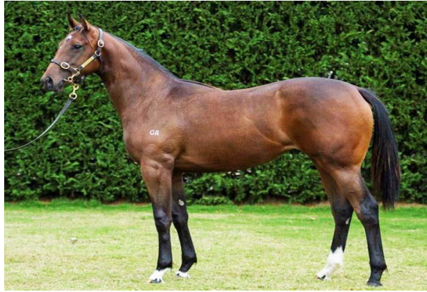
Slika 11. Fusaichi Pegasus, najskuplji trkači konj

( http://www.horsecollaborative.com/most-expensive-horses-ever-sold/ )