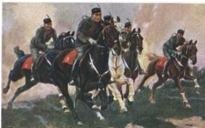
Slika 1. Natjecanje vojnika i oficira u Varaždinu 1887.godine ( http://cavalier-noir.org/zivot-stil/1-dio-varazdin-povijest-konjickog-sporta/ )

Natjecali su se oficiri i vojnici i to u nekoliko kategorija.( Rijavec 2014.) (Slika 1.)Danas se u Hrvatskoj održavaju dvije međunarodne utrke u Zagrebu i jedna u Sinju.