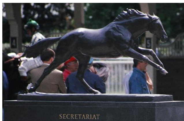
Slika 8. Spomenik Secretariatu u Belmont parku (Traulović,2009.)

Jedan od najslavnijih galopera svih vremena je Secretariat. 9.lipnja 1973.godine u Belmontu proglašen je za najboljeg trkačkog konja svih vremena. Na trkačkoj stazi Belmont Parka u New Yorku, osvojio je Belmont Stakes, posljednju utrku za američku Triple krunu i to sa 31 dužinom prednosti. Pobijedio je u 16 od 21 utrke u svojoj kratkoj karijeri koja je trajala 16 mjeseci, od nagrada je zaradio 1.333. 000 dolara.(Slika 8.)