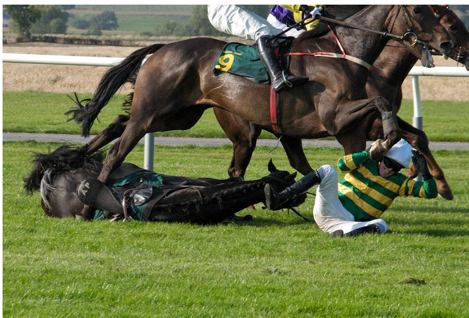
Slika 17. Jockey Tony McCoy pada s konja.

Konji se također suočavaju s opasnostima u utrkama. 1,5 konja umirena svakom 1000 startu u SAD-u. Američki Jockey Club u New Yorku procjenjuje da je oko 600 konja uginulo na trkalištima tijekom 2006. godine, Jockey Club u Hong Kongu izvijestio daleko manju brojku od 58 konja na 1000 startova. Nagada se da su lijekovi koji se koriste u konjskim utrkama u SAD-u koje su zabranjene drugdje su odgovorni za višu stopu smrti u SAD-u. ( http://abcnews.go.com/Sports/Story?id=2857650&page=3 )