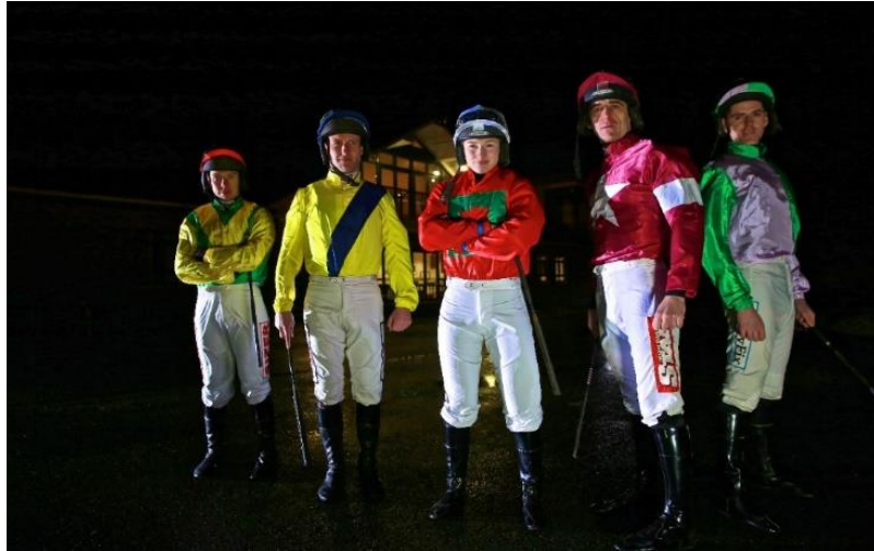
Slika14. Oprema jockeya