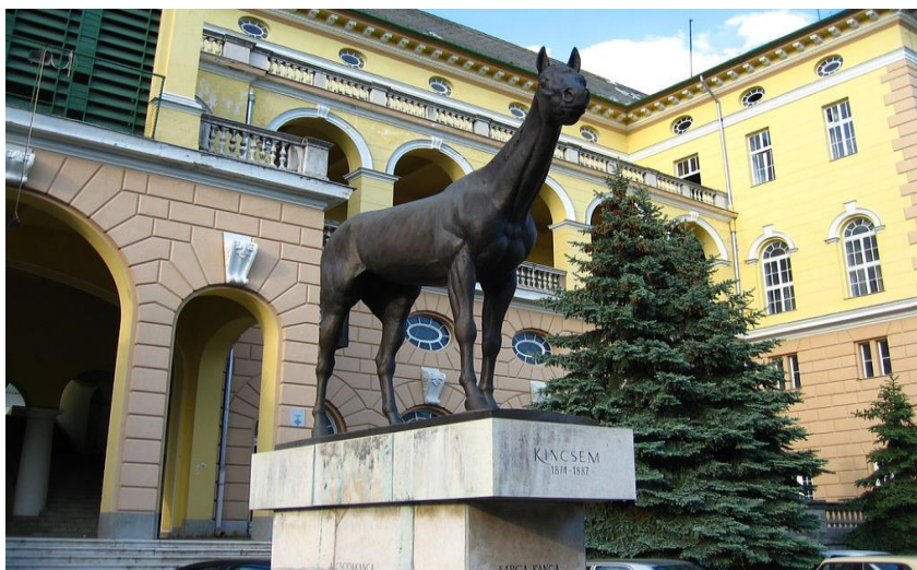
Slika 10. Statua u prirodnoj veličini , Kincsem park, Budimpešta ( https://en.wikipedia.org/wiki/Kincsem#/media/File:Statue_of_Kincsem.JPG )

Lagunu iz Srbije, oždrebljenu 1938. Godine u Italiji, mnogi smatraju najboljim konjem svih vremena. Zbog toga što je sve utrke dobivala u sprintu start-cilj.(Traulović i sur.,2009.)