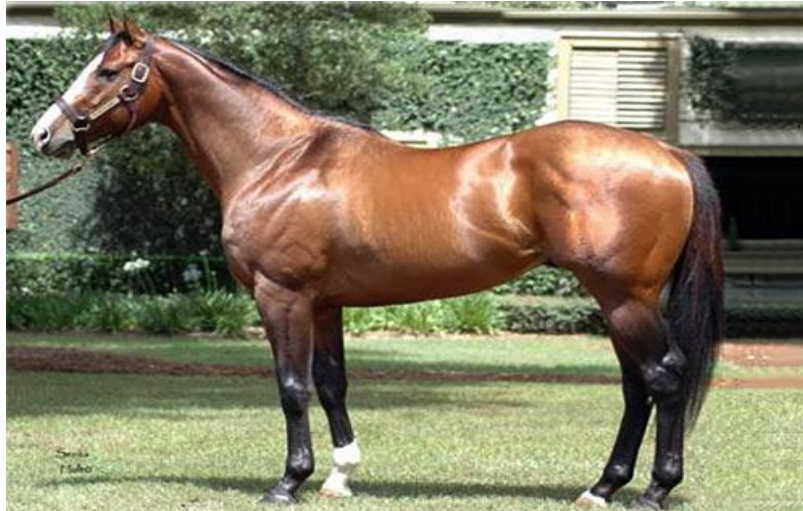
Slika 13. Green Monkey

Monkey je neuspješan, samo se natjecao u tri utrke prije mirovine a završni ništa boljim rezultatom od trećeg u utrci iako je bio favorit za pobjedu. Njegova zarada tokom karijere iznosi oskudnih 10.440 $. Otkad je napustio takmičenja, konj živi na Floridi, kao rasplodni pastuh uz naknadu od 5.000 $.