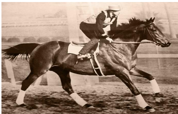
Slika 9. George Woolf na Seabiscuitu

Seabiscuit (23 svibnja 1933 - 17. svibnja 1947) bio šampionski punokrvni trkaći konj u Sjedinjenim Američkim Državama (Wikipedia/Seabiscuit, 2015.). Seabiscuit je imao nesretan početak njegove trkaće karijere, ali je postao simbol nade za mnoge Amerikance tijekom Velike depresije. Seabiscuit je protagonist filma Charlesa Howarda koji se zove Seabiscuit: Lost Documentary (1939); Shirley Temple film : Priča o Seabiscuit (1949); knjiga, Seabiscuit: An American Legend (2001) Laura Hillenbrand; a filmska adaptacija Hillenbrand knjige, Seabiscuit (2003), je bio nominiran za Oscara za najbolji film.(Slika 9.)