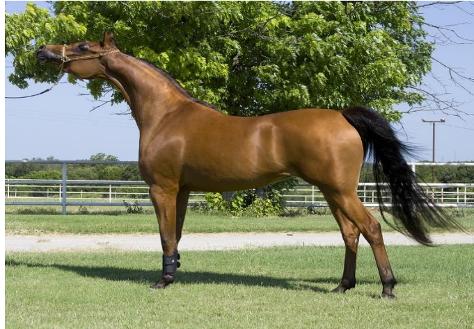
Slika 6. Arapski Punokrvnjak

( https://upload.wikimedia.org/wikipedia/commons/5/54/Halterstandingshotarabianone.jpg )