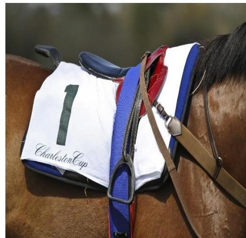
Slika 15.i 16.a) Oprema za konja glaposkim utrkama b) Galopsko sedlo

( http://visual.merriam-webster.com/images/sports-games/equestrian-sports/horse-racing-turf/jockey.jpg ,