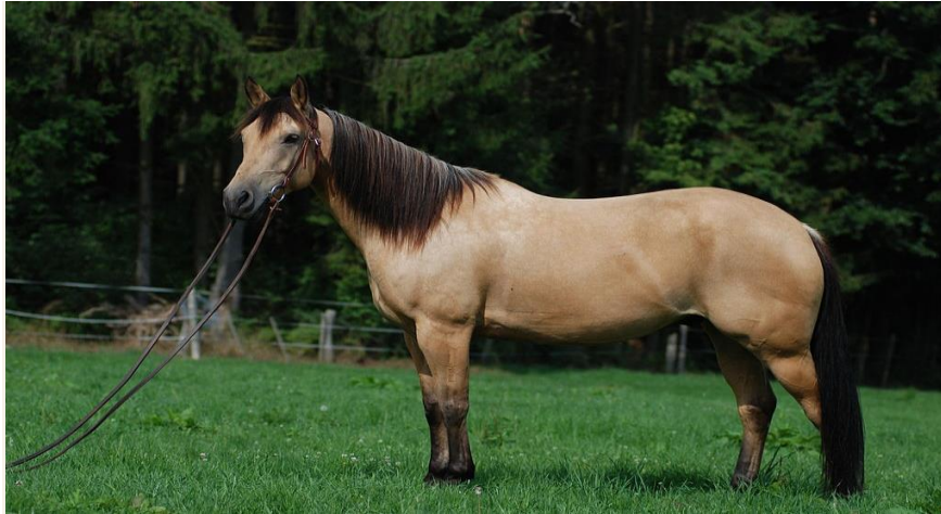
Slika 7. Quarter