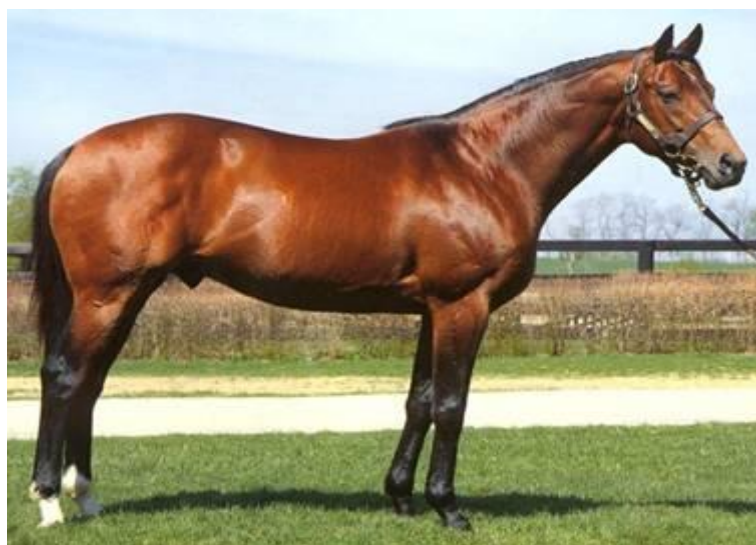
Slika 5. Engleski punokrvnjak

Drugu skupinu čine Non-Thoroughbred grla (NTB), tj. grla koja nisu registrirana u neki od priznatih nacionalnih registara i čiji roditelji također nisu u nekom od priznatih registara. U Hrvatskoj ovu populaciju čine grla vezana na uzgoj bivše Jugoslavije. (Slika 5.)