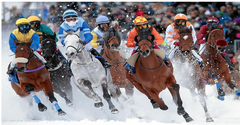
Slika 3. Galopske utrke na snijegu

Održavaju se u nekim sjevernijim zemljama (Finska, Švedska, Norveška) gdje služe kao dopuna redovnom ispitivanju konja u utrkama. (Flander, 1975.) Na njima se utrkuju engleski punokrvnjaci u starosti 3 do 10 godina održavaju se na hipodromima ili na stazama pripremljenim u tu svrhu. Pravila i uvjeti za utrke su isti kao i kod ravnih galopskih utrka, najčešće ih jašu profesionalni jahači, ali postoje i utrke za amatere. Glop na snijegu znatno je teži jer snijeg umanjuje brzinu, i zahtjeva od konja puno veći napor i odličnu fizičku kondiciju. Postignuto vrijeme u ovim utrkama je znatno manje nego u onima na travnatim ili pješčanim stazama iste dužine. Da bi se izbjeglo klizanje konja i spriječilo skupljanje snježnih naslaga, konji se potkivaju s posebnim potkovama. Oprema konja i jahača je jednaka kao i u ostalim galopskim utrkama. (Slika 3.)