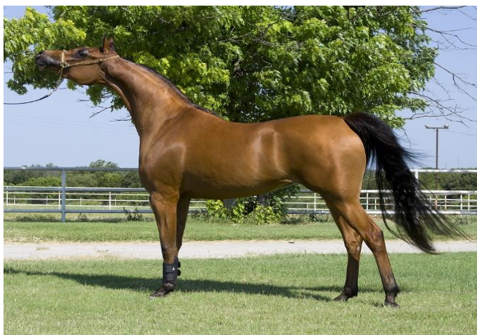
Slika 6. Arapski Punokrvnjak