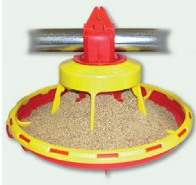
Slika 10. Automatska hranilica za piliće ( http://www.profarm.hr/fotografije/hranjenje_pojenje_perad/XL100NG.jpg )