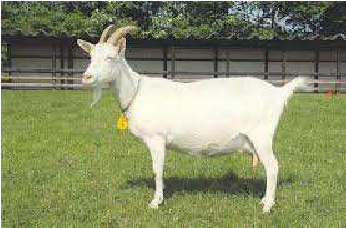
Slika 1. Sanska koza (www.google.com)