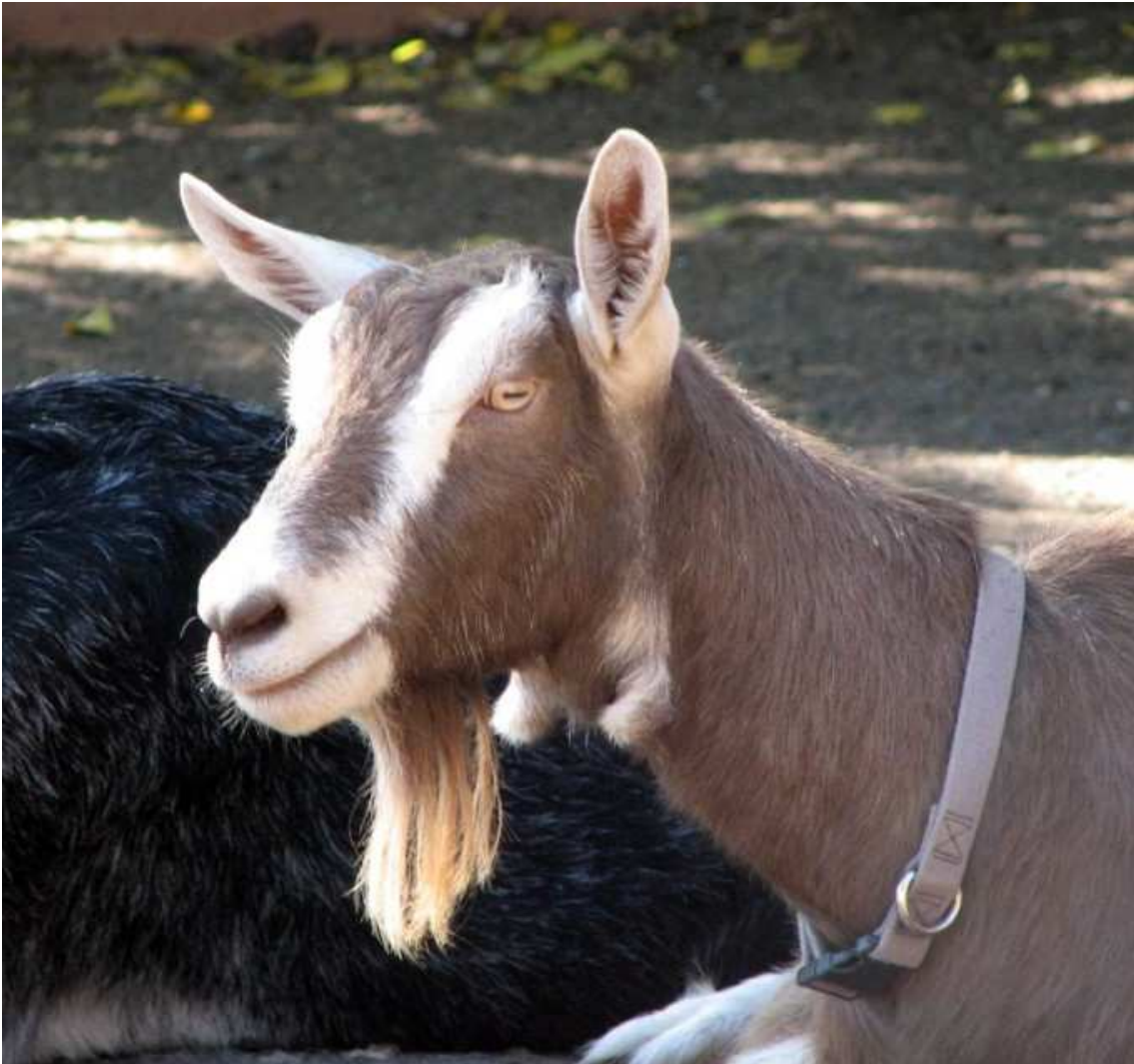
Slika 3. Toggenburška koza

300 dana koze proizvedu 700-800 kg mlijeka s 3,2 % mliječne masti i 3% bjelančevina. Odlikuj se dobrom plodnošću. Pasminski standard je od 1,77 do 1,89 jaradi u leglu (Metzger, 1964.)