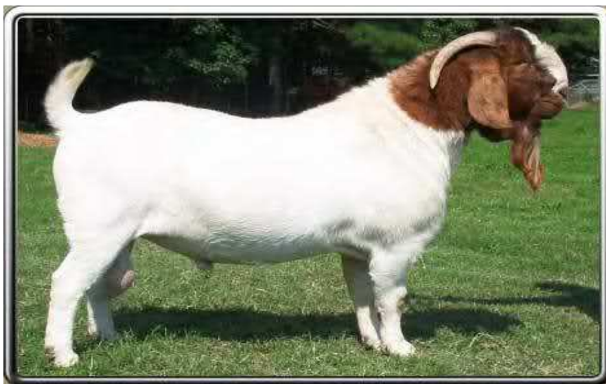
Slika 4. Burska koza (www.google.com)

Jarad od poroda, kada ima tjelesnu masu od 3,5 do 4,0 kg, prosječno dnevno prirasta 200 do 250 grama te pri odbiću postiže tjelesnu masu od 12 do 14kg. Jarad prispjeva za klanje s oko četiri mjeseca, odnosno s tjelesnom masom od 30 do 35 kg.