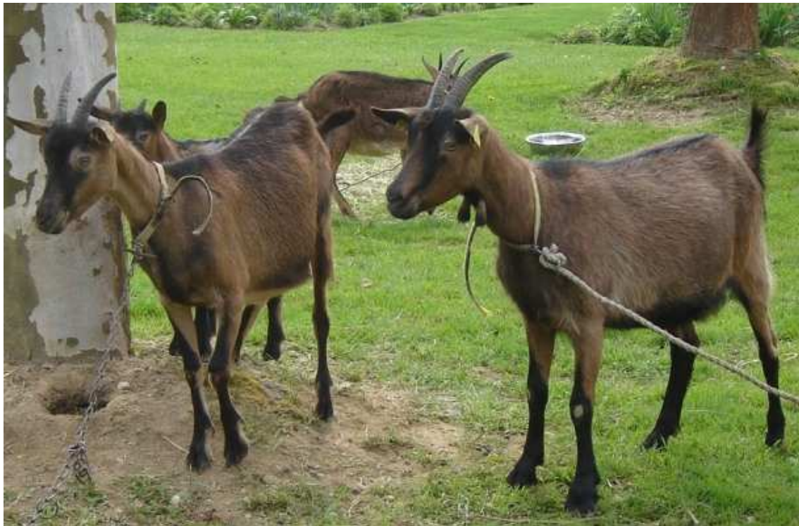
Slika 2. Alpska srnasta koza