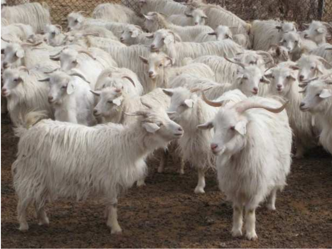
Slika 5. Kašmirska koza