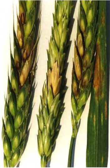
Slika 3. Palež klasa pšenice uzrokovana s Fusarium graminearum ( https://blogs.cornell.edu )