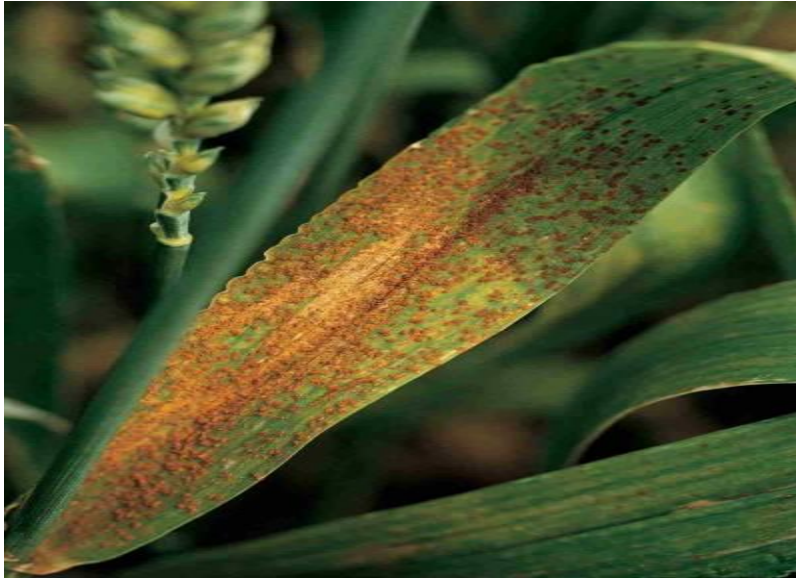
Slika 7. Puccinia recondita ( http://www.bayercropscience.ro/ )