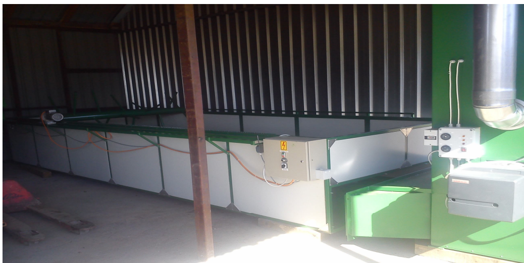
Slika 4. - Slika pogona za ekstrakciju