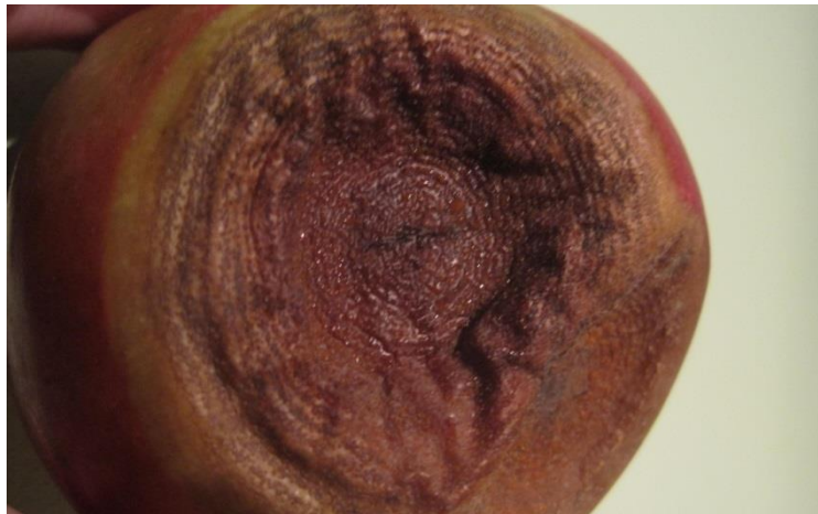
Slika 7. Gorka trulež plodova jabuke

Colletotrichum spp. ( Gloeosporium spp. ) ili gorka trulež plodova je gljiva koja predstavlja glavni problem kod skladištenja i čuvanja jabuke. Ova gljiva ima širok areal rasprostranjenosti i raširena je gotovo u svim uzgojnim područjima jabuke. Zaraza jabuke ovim parazitom nastaje tijekom vegetacije, većinom dva mjeseca pred berbu, no simptomi se očituju tek nakon skladištenja. Gorkoj truleži pogoduje obilna i učestala kiša. Simptomi na uskladištenim plodovima se pojavljuju u vidu svjetlo smeđih okruglih pjega, koje kasnije poprimaju tamnije smeđu boju. Pjege se većinom pojavljuju na bočnoj strani ploda, a pjege se s vremenom povećavaju i postaju utonule u sredini. Nakon što pjege dostignu 2 cm, na njihovoj površini se pojavljuju plodonosna tijela koja su kružno raspoređena po površini pjege i u obliku su sitnih točkica, što predstavlja tipični simptom ovog parazita (Slika 7.). U vlažnim uvjetima iz kože izbijaju nespolna plodišta – acervuli, iz kojih nadalje izlaze spore u crvenkasto-narančastoj sluzastoj masi. Ispod pjege se nalazi tkivo svjetlosmeđe boje, gorkog okusa i mekano, po čemu je gljiva i dobila ime. Gljiva uglavnom prezimljava u mumificiranim plodovima u nasadima ( www.vinogradarstvo.hr ).