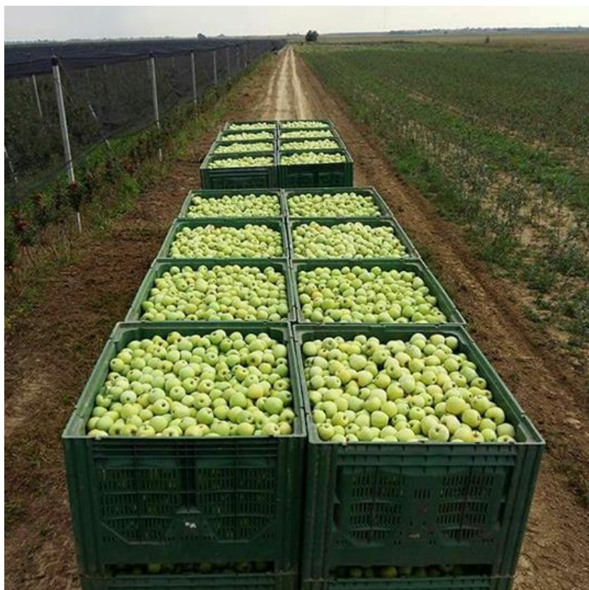
Slika 13. Jabuka na Primorac obrtu