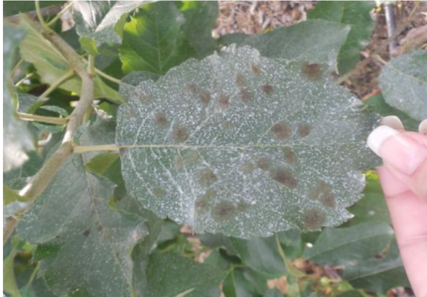
Slika 2. Mrljavost lista (Izvor: Primorac, I. 2014.)

Pjege na peteljckama ploda i lista su iste ili slične. Simptomi na cvjetovima obično se pojavljuju kao male, tamno zelena mrlje, a simptomi su vidljivi na cvjetnoj stapci, listićima čaške i čaški. Može doći do otpadanja cvjetova što rezultira manjim prinosom (Vaillancourt i sur. 2005.).