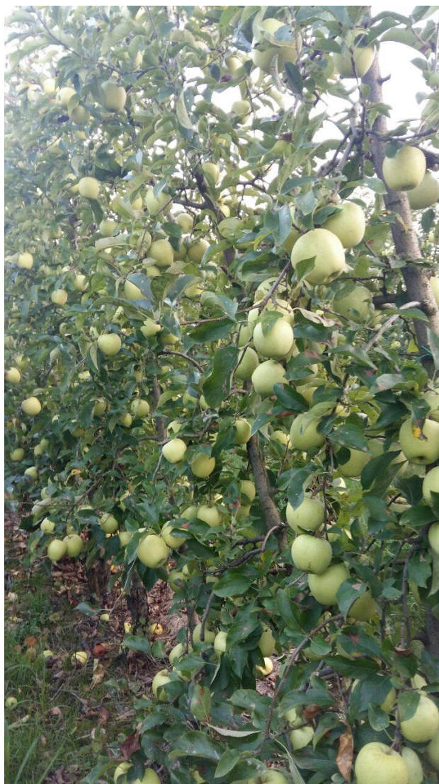
Slika 1. Jabuka na Primorac obrtu

Cilj ovog rada bio je pratiti pojavu bolesti u 2016. godini na Primorac obrtu u Vođincima te poduzeti odgovarajuće mjere zaštite u skladu s propisima integrirane zaštite bilja kako bi se osigurao što veći prinos uz što bolju kvalitetu ploda.