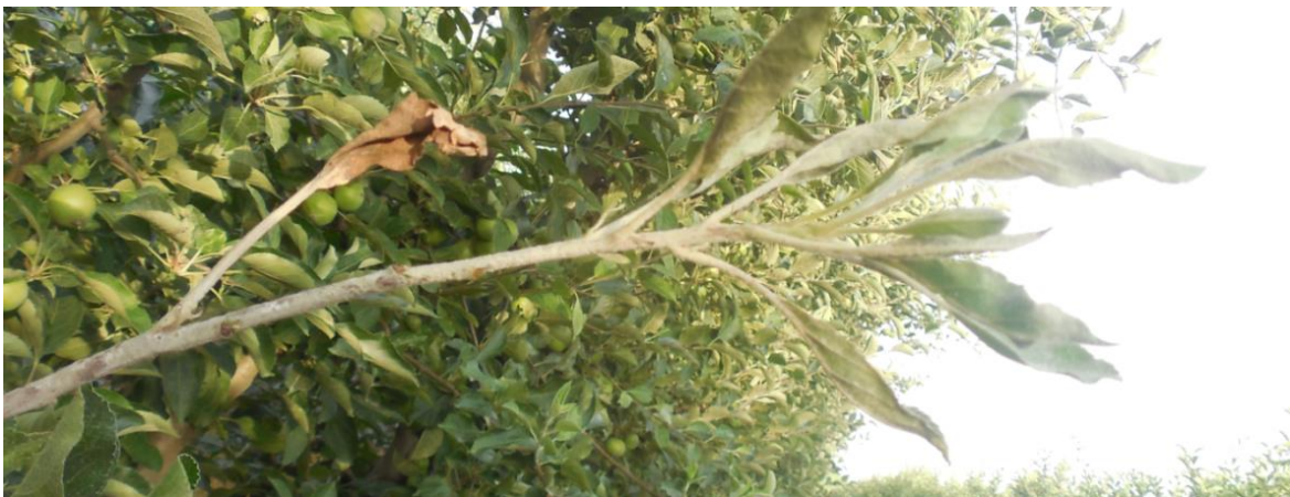
Slika 4. Pepelnica na listovima