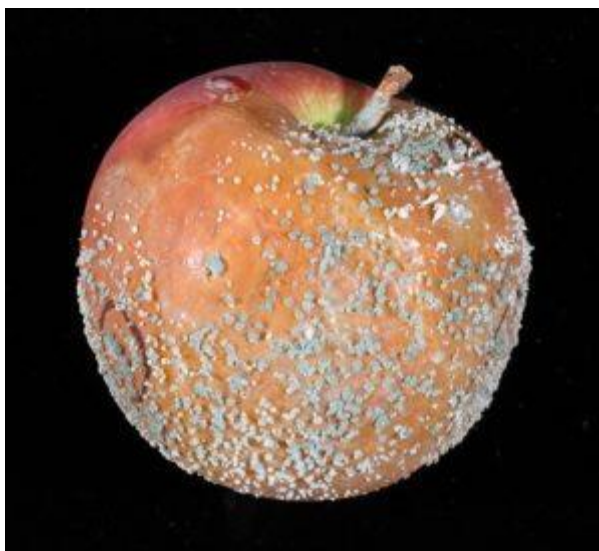
Slika 8. Meka trulež jabuke

Penicillium expansum Link ili meka trulež plodova se razvija u skladištu na mjestima oštećenja od udaraca, štetnika i dr. Pjege su u početku vodenaste, tamnije crvenkasto-smeđe ili svjetlosmeđe boje te je bolesni dio oštro odijeljen od zdravog. Unutar lezija se pojavljuju bijele nakupine koje s vremenom postaju zelenkasto-plave kada spore sazriju (Slika 8.) ( www.vinogradarstvo.hr ).