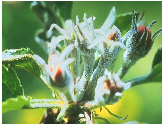
Slika 5. Pepelnica na cvjetovima

Cvjetovi razvijeni iz zaraženog cvjetnog pupa su zelenkasti i lapovi su im pepeljasti, latice zaostanu u rastu, ostaju vrlo malene i imaju zelenkastu boju s malenim uškama, pa se u takvim cvjetovima prašnici i tučak jače ističu (Slika 5.). Ti cvjetovi više ne mogu razviti plod jer su sterilni. Infekcije ploda su sekundarne infekcije i one se ostvaruju ili kod zametanja ploda ili dok je još plod sitan. Na plodovima se javlja mrežasta nekroza koja umanjuje kvalitetu plodova (Slika 6.) (Cvjetković, 2010.).