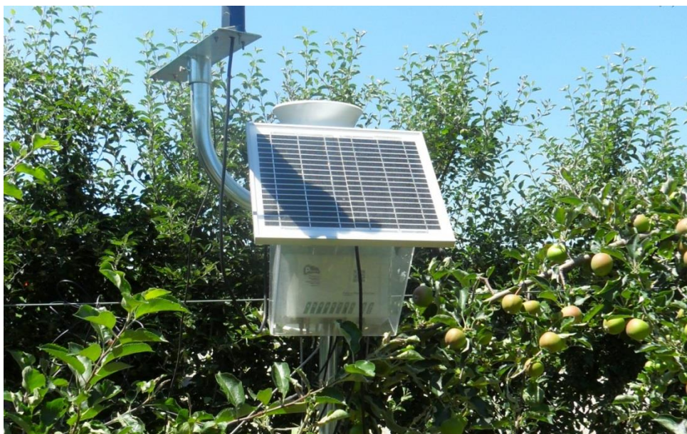
Slika 14. Pinovala Meteo-stanica