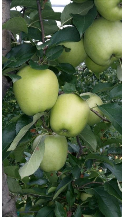
Slika 12. Jabuka na Primorac obrtu