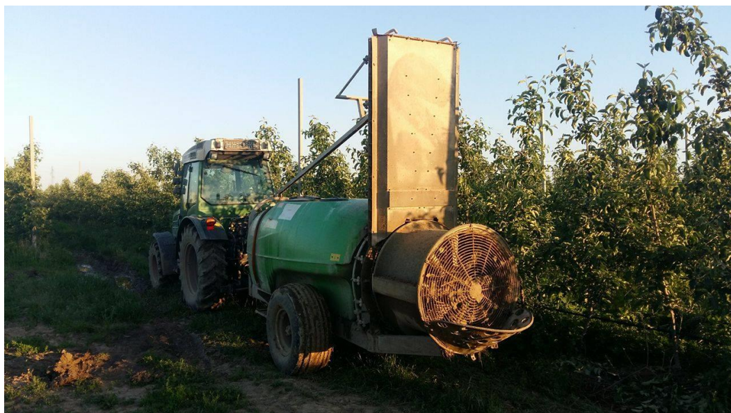
Slika 10. Tretiranje voćnjaka