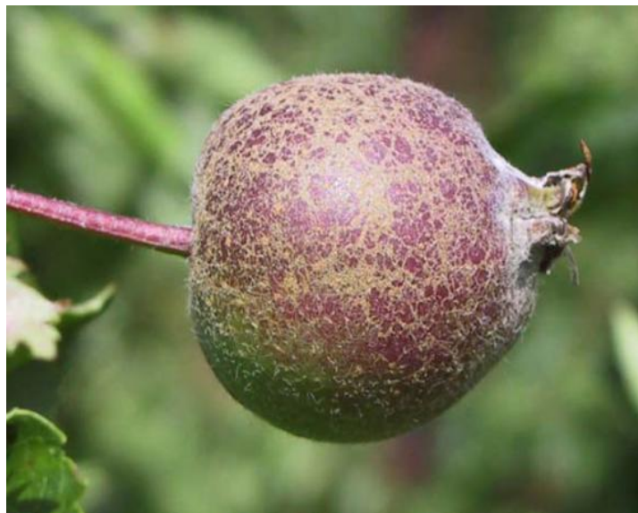
Slika 6. Mrežavost plodova