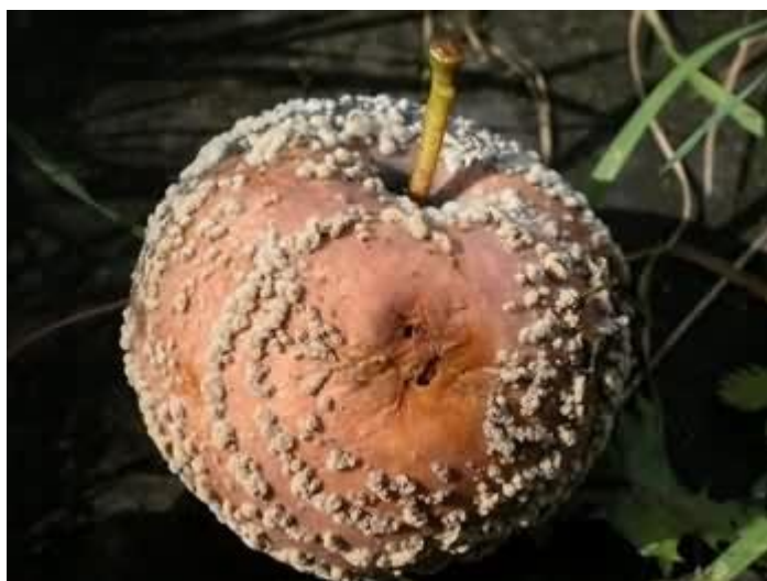
Slika 9. Tipični koncentrični krugovi na zaraženom plodu

Gljivica prezimi u plodovima kao micelij te se u proljeće iz micelija razvijaju jastučići koji sadrže konidije koje se pomoću vjetra, kiše ili insekata prenose na mlade i zrele plodove uzrokujući male i smeđe lezije koje postepeno prekrivaju cijelu površinu kože ploda. Nakon prezimljenja na mumificiranim plodovima mogu nastati apoteciji s askusima i askosporama. Askospore mogu obaviti primarne zaraze, ali je formiranje apotecija, askusa i askospora rijetko pa je konidijski stadij puno značajniji. Konidije kliju u začetak micelija koji prodire u plod najčešće kroz rane. Gljiva raste intercelularno, uzrokuje maceraciju i posmeđenje napadnutog tkiva. Sekundarnu zarazu vrše konidije koje nastaju na plodovima koje su primarno zaraženi, a primarnu zarazu vrše konidije prošlogodišnjih mumificiranih plodova. Najčešći napad je u lipnju i srpnju (Cvjetković, 2010.).