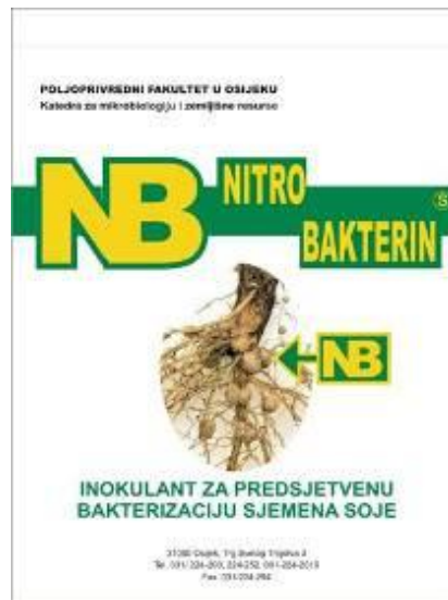
Slika 8. Nitrobakterin