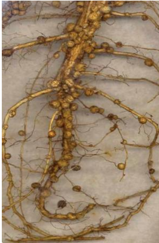
Slika 2. Kvržice na korijenu soje