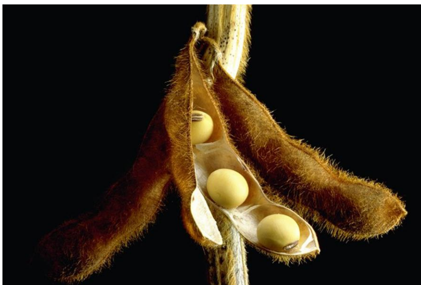
Slika 6. Zrela mahuna soje