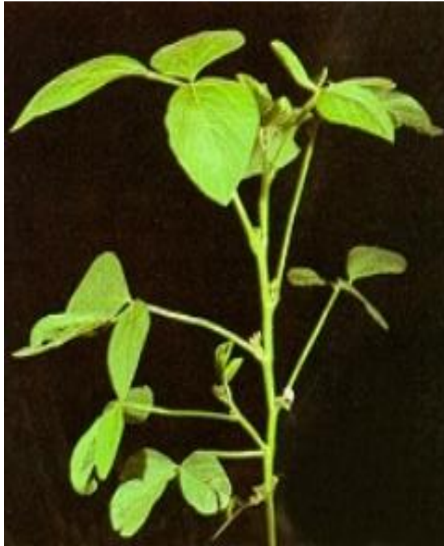
Slika 3. Stabljika soje na početku cvatnje

više, što je važno u žetvi, jer niže grane imaju mahune formirane niže, a to povećava gubitke pri žetvi.