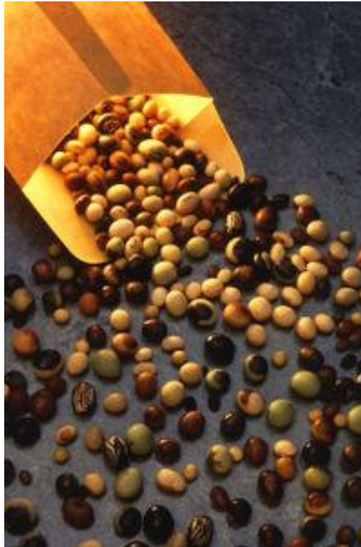
Slika 7. Zrno soje