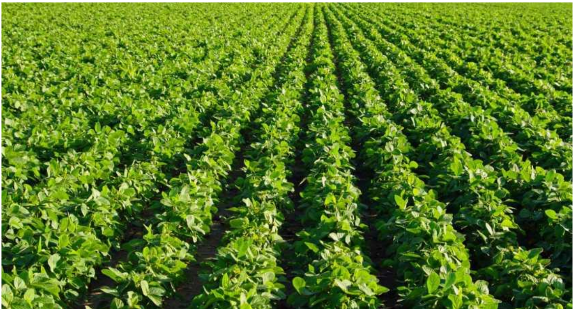
Slika 1. Polje soje

Soja, Glycine max (L.) Merrill, kao ratarska kultura porijeklom iz Kine, uzgaja se više od četiri tisuće godina. Na Slici 1. prikazano je polje soje. Ova kultura pripada redu Fabales , porodici Fabaceae ili Leguminosae (mahunarke ili lepirnjače), podporodici Papilionatae , rodu Glycine . Porodica se na hrvatskom jeziku naziva “mahunarke” zbog ploda mahune ili “lepirnjače” prema izgledu cvijeta nalik na leptira. Vrsta Glycine max obuhvaća veći broj podvrsta, koje predstavljaju geografske skupine. One su se formirale u različitim dijelovima dosta širokog areala rasprostranjenosti, što znači da su formirane u različitim uvjetima klime i tla. Značaj i važnost soje ogleda se u kakvoći njezinog zrna (visok sadržaj ulja i bjelančevina) te je iz tih razloga jedna od važnijih uljnih i bjelančevinastih kultura u svijetu.