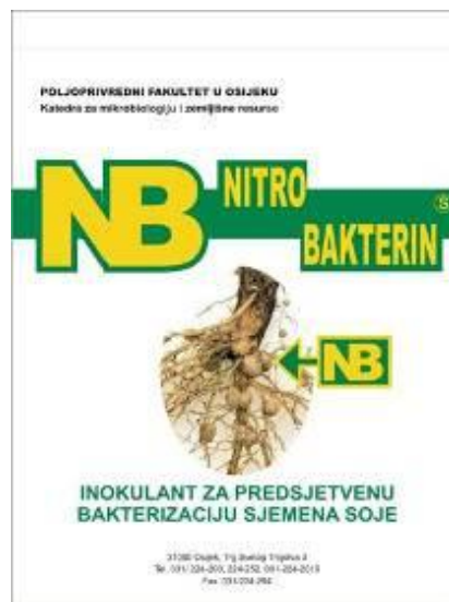
Slika 8. Nitrobakterin