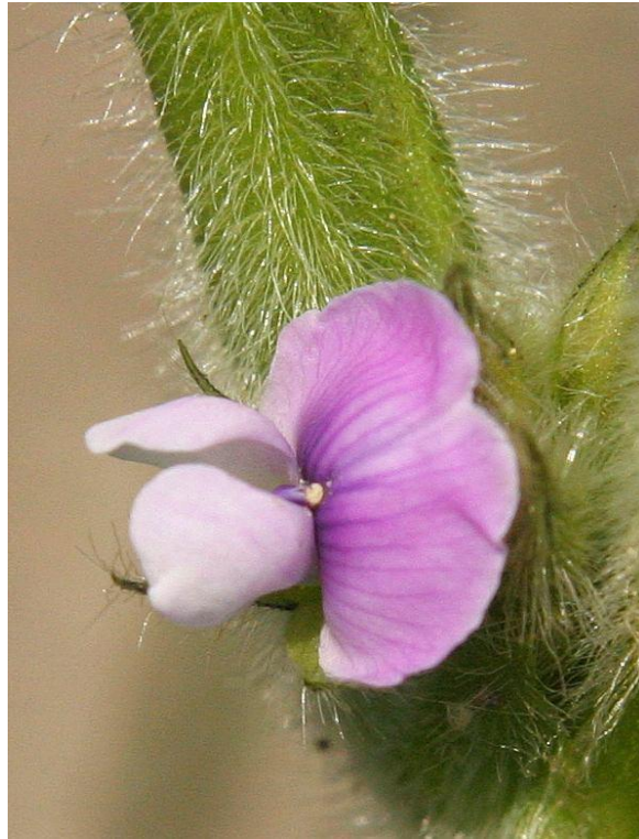
Slika 5. Cvijet soje