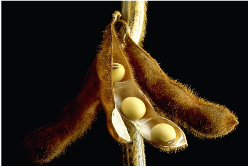
Slika 6. Zrela mahuna soje