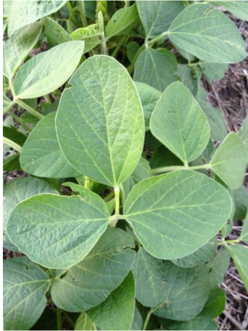
Slika 4. List soje

Niže odnosno patuljaste sorte često imaju tamnozelenu boju i pri samom kraju vegetacije. Pri fazi zriobe listovi postaju žuti te otpadnu kod većine sorata. Kod nekih kasnih sorata listovi zadržavaju zelenu boju i ne otpadaju.