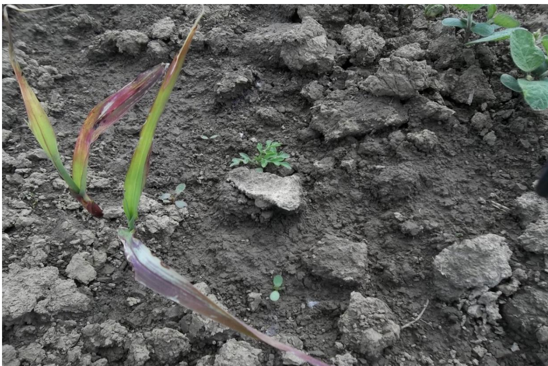
Slika 7. Utjecaj herbicida djelatnih tvari dimetenamid-p + pendimetalin i herbicida djelatnih tvari bentazon + imazamoks na S. halepense