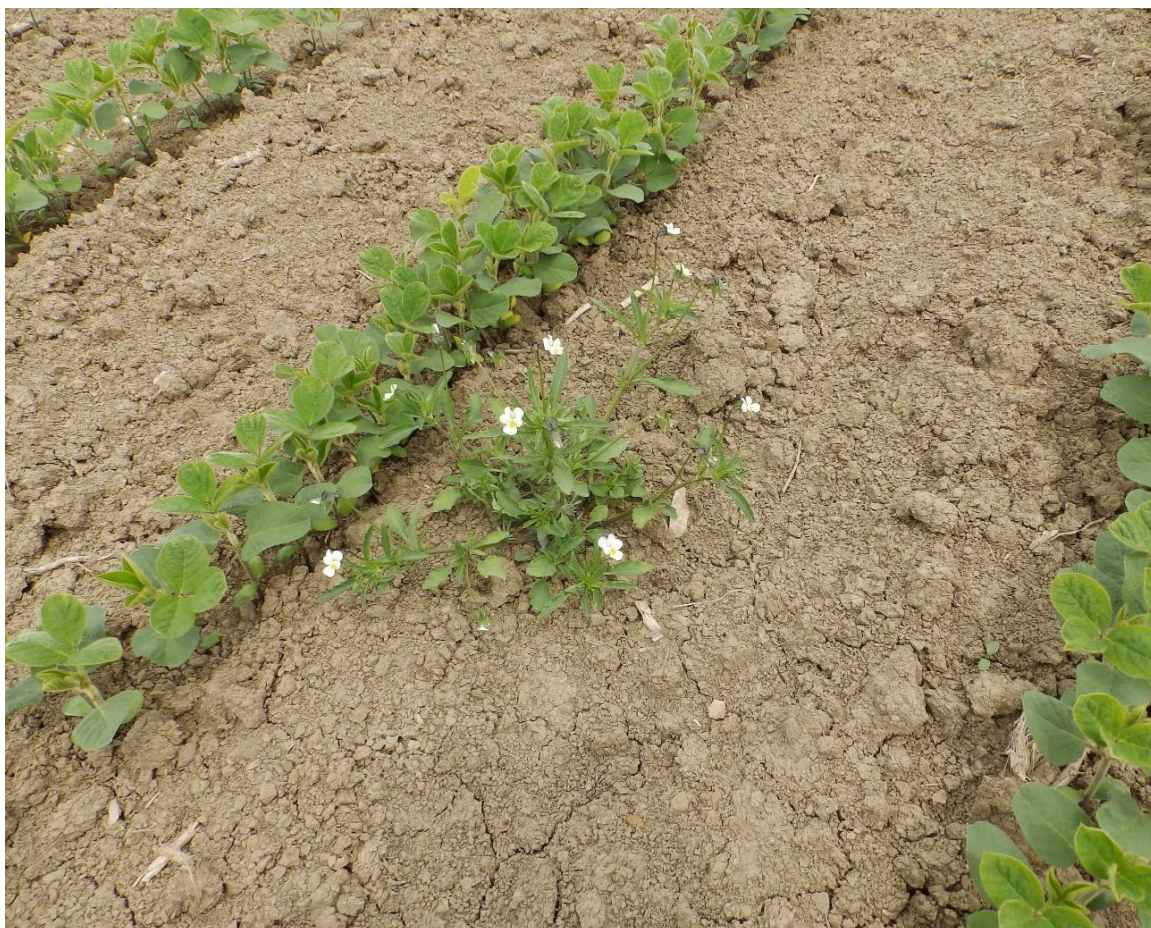
Slika 5. V. arvensis u usjevu soje, Cerna 2016.