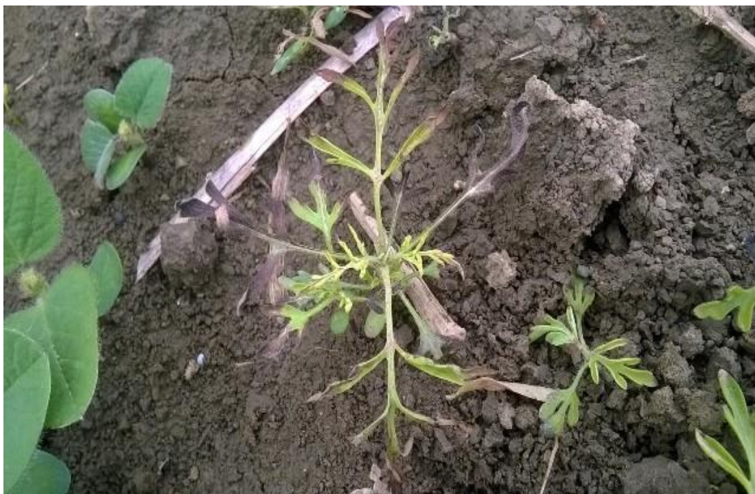
Slika 6. Utjecaj herbicida djelatnih tvari dimetenamid-p + pendimetalin i herbicida djelatnih tvari bentazon + imazamoks na A. artemisiifolia L.

Različit utjecaj herbicidnih varijanata zabilježen je i na uskolisne korovne vrste. U tretmanu s punom dozom herbicida djelatnih tvari dimetenamid-p + pendimetalin i herbicida djelatnih tvari bentazon + imazamoks postignuta je visoka kontrola S. halepense i to 93,3% (slika 7.). Primjena smanjene doze herbicida djelatnih tvari dimetenamid-p + pendimetalin i herbicida djelatnih tvari bentazon + imazamoks postigla je manju učinkovitost te smanjila broj jedinki S. halepense za 76,8% odnosno 53%. Slični rezultati postignuti su i kod jednogodišnjih uskolisnih korova. Najveća učinkovitost postignuta je pri primjeni pune doze herbicida djelatnih tvari dimetenamid-p + pendimetalin i herbicida djelatnih tvari bentazon + imazamoks koja je suzbila korovne vrste D. sanguinalis , E. crus-galli i S. glauca za 100%, 95,5% odnosno 89,8%. Niža učinkovitost postignuta je pri primjeni smanjene doze herbicida djelatnih tvari dimetenamid-p + pendimetalin i herbicida djelatnih tvari bentazon + imazamoks koja je suzbila navedene korove za 81,9%, 58,9% odnosno 65%. Najniža učinkovitost pak zabilježena je u tretmanu s herbicidom djelatne tvari bentazon + imazamoks.