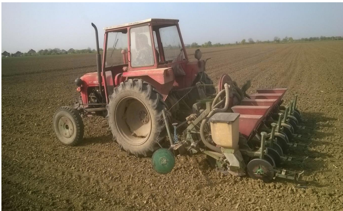
Slika 1. Sjetva soje, traktor IMT 539 i sijačica OLT PSK

Poljski pokus proveden je na proizvodnim površinama obiteljskoga poljoprivrednoga gospodarstva „Pažur Anica“ u selu Cerna koje se nalazi u Vukovarsko- srijemskoj županiji Republike Hrvatske. Pokus je postavljen prema slučajnom bloknom rasporedu u tri ponavljanja. Tijekom jednogodišnjeg istraživanja istraživana je učinkovitost pre-emergence i post-emergence herbicida i njihovih kombinacija na korove i prinos soje. Korištena je sorta soje Poljoprivrednog instituta Osijek, Ika (grupa zriobe 0-I) koja se odlikuje visokim i stabilnim prinosom. Predkultura usjevu soje bio je kukuruz. Nakon žetve kukuruza obavljeno je usitnjavanje žetvenih ostataka te zimsko oranje. Gnojidba je obavljena 30. ožujka 2016. rasipanjem mineralnog gnojiva NPK 15-15-15 u dozi 300 kg/ha. Prvi prohod traktorom Landini Ghibli i sjetvospremačem IMT obavljen je 01. travnja 2016. Priprema tla za sjetvu obavljena je 04. travnja 2016. s dva prohodna traktorom John Deere 6900 i sjetvospremačem Ada Agromerkur. Sjetva soje sorte IKA u količini 120 kg/ha obavljena je 06. travnja 2016. (slika 1.) traktorom IMT 539 i sijačicom OLT PSK.