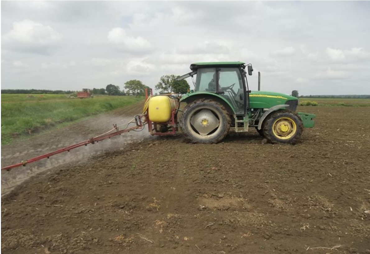
Slika 2. Apliciranje herbicida, traktor John Deere 5725 i prskalica MIO Standard