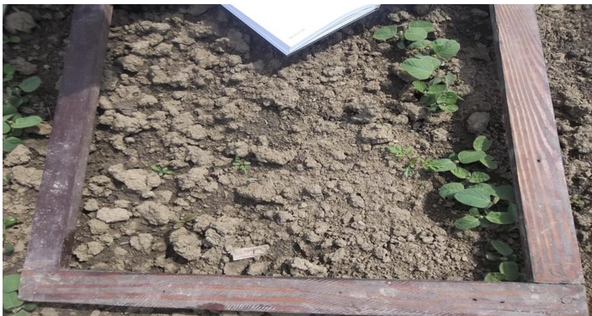
Slika 3. Prebrojavanje korova u usjevu soje