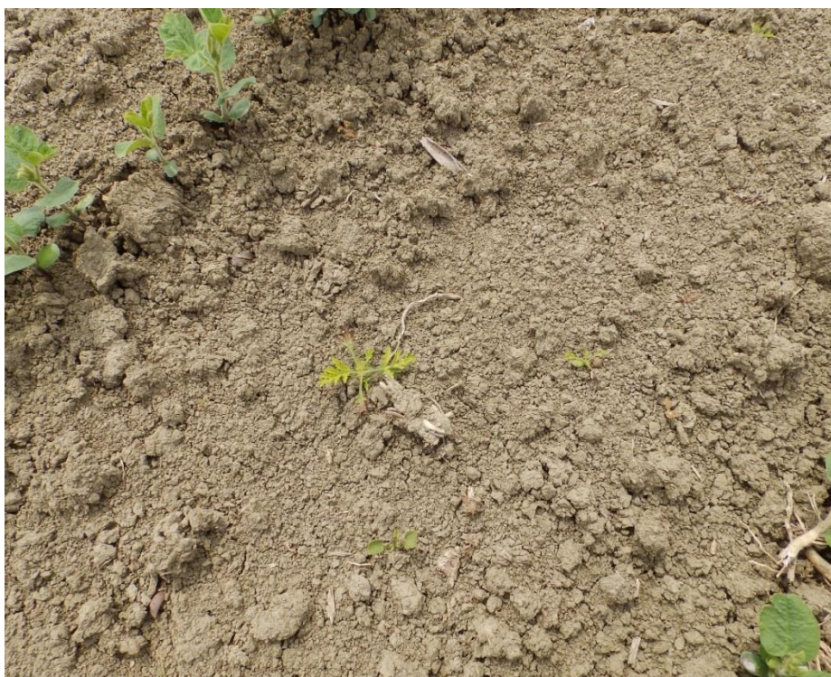
Slika 4. A. artemisifolia u usjevu soje, Cerna 2016.

Iz analize indikatorskih vrijednosti vrsta s obzirom na temperaturu (T) može se uočiti jednaka brojčana zastupljenost vrsta iz skupina T4 i T5. Ove skupine karakteriziraju vrste ( E. crus – galli , S. halepense ) rasprostranjene izvan izrazito kontinentalnih područja i vrste kojima imaju širok areal rasprostranjenosti u nižim područjima srednje Europe.