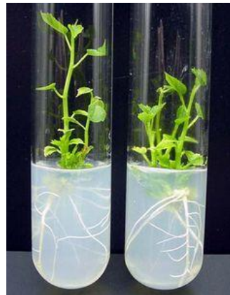
Slika 1. Prikaz hranjive podloge u kulturi tkiva

Iako je važno da je hranjiva podloga svaki put ista, tvari čiji sastav može varirati je najbolje izbjegavati ukoliko je moguće, iako se ponekad postižu bolji rezultati njihovim dodavanjem (George, 2008.).