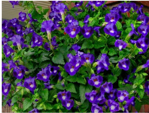
Slika 6. Torenija ( Torenia fournieri L.)

Nedostatak kalcija u biljkama rezultira slabim rastom korijena te tamnjenjem i uvijanjem rubova apikalnog lišća, često popraćeni prestankom rasta i odumiranjem vrha izbojka.