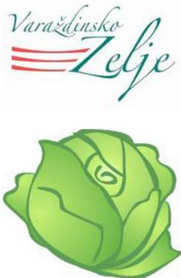
Slika 11. Logo Varaždinskog zelja koje proizvodi obitelj Cafuk

Izvor: http://www.savjetodavna.hr/savjeti/17/440/varazdinsko-zelje-na-eu-sortnoj-listi/