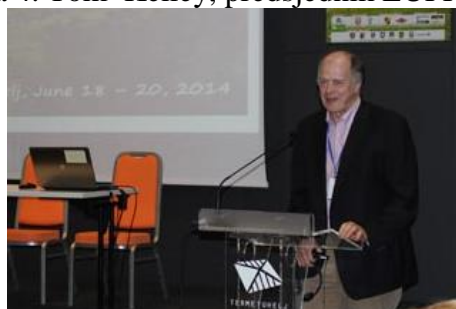
Slika 4. Tom Kelley, predsjednik EUFRAS-a

Zadnji predgovor održao je Tom Kelley, predsjednik EUFRAS-a. On je zaključio da nikada prije izazovi s kojima se suočava poljoprivreda nisu bili toliko zahtjevni i da nikada nije ni bilo toliko mogućnosti. Istaknuo je kako se ljudi iz različitih dijelova Europe ujedanjuju kao poljodjelci, savjetnici i kao europski građani kako bi učili jedni od drugih i bolje se nosili s izazovima proizvodnje poljoprivrednih i prehrambenih proizvoda i energije. Smatra kako posebnu vrijednost ove konferencije predstavlja raznolikost zastupljenih organizacija i pojedinaca, njihove strukture, modela financiranja i različitih operativnih aktivnosti.