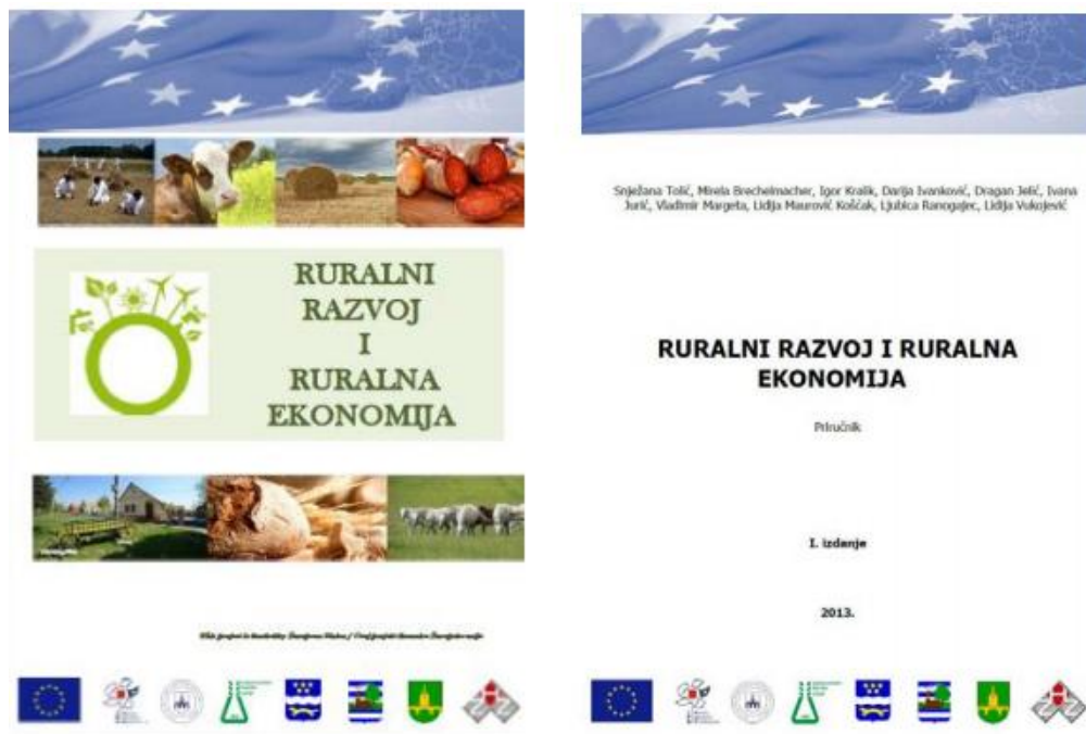
Slika 9. Naslovnica priručnika „Ruralni razvoj i ruralna ekonomija“