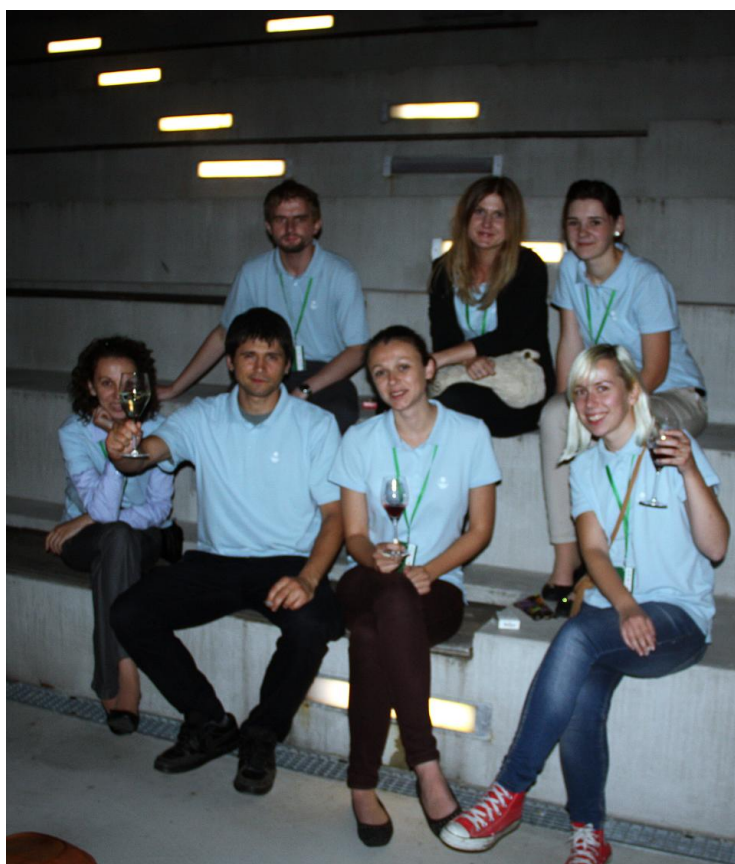
Slika 14. Studenti volonteri u zadnjoj večeri kongresa