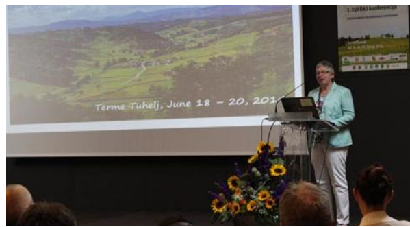
Slika 3. Edda Albers, predsjednica IALB-a

Smatra kako će baš Republika Hrvatska kao domaćin kongresa dati važne informacije o poljoprivredi u Jugoistočnom dijelu Europe i kako je ovo važan korak naprijed u poljoprivredi cijele Europske Unije.