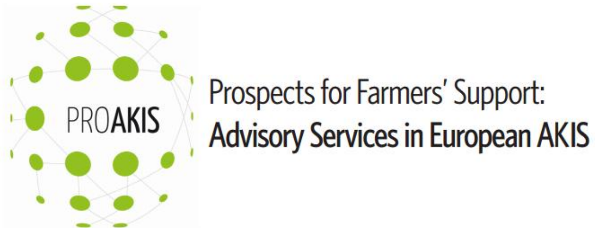
Slika 7. Logo i značenje skraćenice „PRO AKIS“ projekta