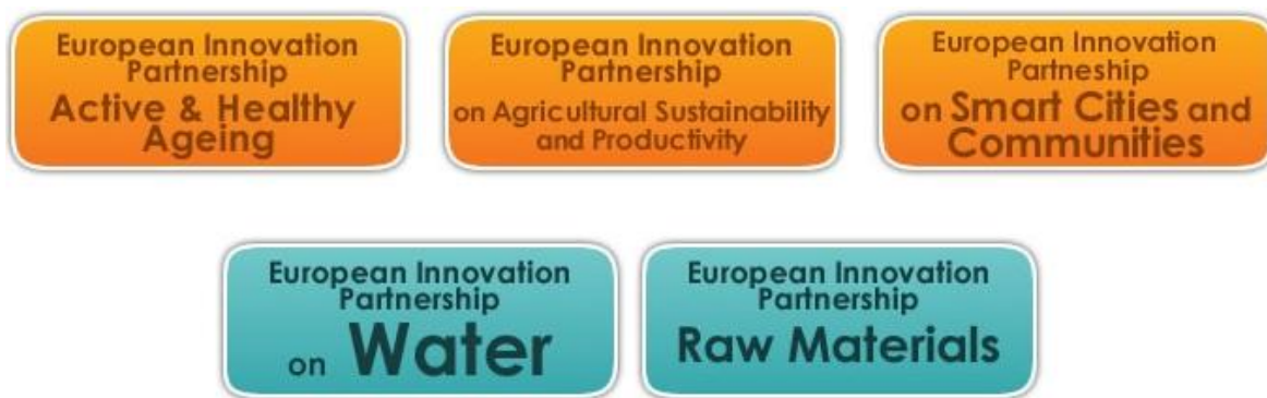
Slika 6. Područja djelovanja EIP AGRI partnerstva