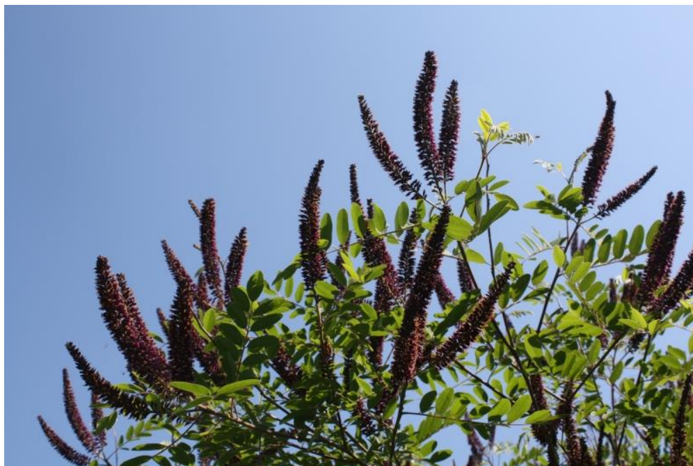
Slika 12. Amorpha fruticosa L.- biljka u cvatu

U Hrvatskoj je rasprostranjena najviše po sjeverozapadnom i istočnom dijelu zemlje. Pojavljuje se u priobalju uz rijeku Cetinu. Zastupljena je na Mljetu i Kvarneru. U međuriječju Save, Drave i Dunava se proširila toliko da često ometa prirodnu obnovu šuma hrasta lužnjaka i poljskog jasena (Alegro i sur., 2010.).