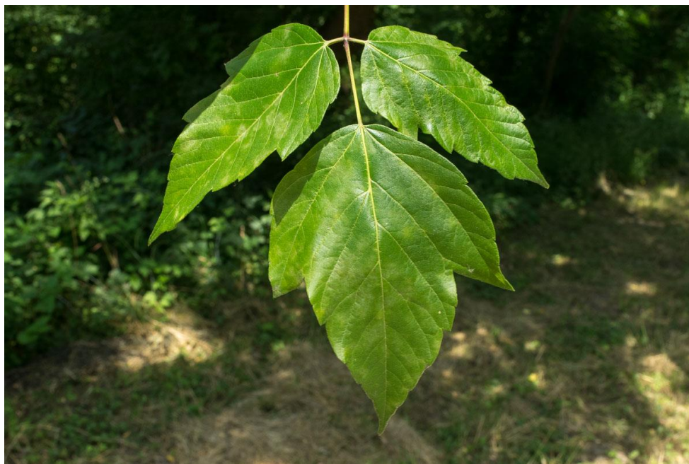
Slika 2. Acer negundo L. - list

Javor je uspravno listopadno drvo koje može narasti i do 25 m visine (Hulina, 2011., Nikolić i sur., 2014.). Često je znatno niži i različitog oblika. Dvodomna je biljka koja ima snažno deblo i široku krošnju. Listovi su nasuprotni, 13-20 cm dugi i neparno-perasto sastavljeni od 3-5 jajastih liski. Liske su cjelovitog ruba ili su nepravilno nazubljene. Duge su 8-12 cm, a široke 2-4 cm, te su dlakave na gornjoj strani (Slika 2.). Vršna liska ponekad ima tri režnja. Cvjetovi su žutozelene boje, jednospolni, ili rjeđe dvospolni. Biljka cvjeta prije pojave listova u ožujku i travnju. Ženski cvjetovi su u obliku dugih, visećih grozdova (Hulina, 2011.). Muški cvjetovi formiraju gornje (Nikolić i sur., 2014.). Cvjetovi se sastoje od 5 lapova, dok latice nedostaju. U muškom cvijetu se nalazi 4 do 6 prašnika crvenkaste boje na dugim filamentima. Ženski cvjetovi imaju nadraslu plodnicu građenu od 2 plodna lista. Ova se biljka oprašuje vjetrom, a ponekad i kukcima. U rujnu i listopadu razvijaju se mnogi plodovi (oraščići) koje raznosi vjetar i do 250 m od matične biljke. Sjemenka je ovalna i zelena, a s klijanjem počinje u proljeće. Kod ove biljke moguće je i vegetativno razmnožavanje korijenskim izdancima.