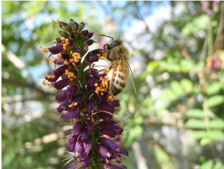
Slika 11 . Amorpha fruticosa – medonosna biljka

Amorfa se, osim sjemenkama, razmnožava i vegetativno podzemnim podancima. Ova biljna vrsta živi u simbiozi s bakterijama koje vežu elementarni dušik iz zraka i tako obogaćuju tlo dušikom. U pčelarstvu je vrlo cijenjena medonosna biljka (Slika 11.). Iz njezinih plodova možemo ekstrahirati ulje (Franjić i Škvorc, 2010.).