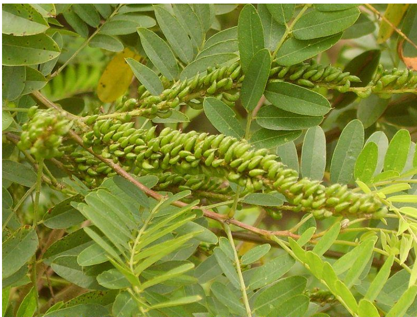
Slika 10. Amorpha fruticosa L. - mlade mahune

Amorfa cvjeta od travnja do lipnja. Brojnim cvjetovima i nektarom privlači kukce oprašivače (Bačić i Sabo, 2007.). Nakon oprašivanja i oplodnje iz nadrasle plodnice razvija se 6 - 9 mm duga, žljezdasta mahuna (Slika 10.).