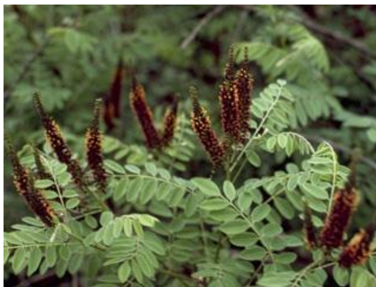
Slika 14. Amorpha fruticosa L.- razvijenost u šumi

Za kontrolu širenja ove biljke primjenjuju se mehaničke metode. Odrezani ili iskopani biljni dijelovi moraju se odlagati na sigurno mjesto, s obzirom na to da se i iščupane biljke neko vrijeme mogu vegetativno razmnožavati. Primjenjuje se i pokretanje kontroliranih požara. Često puta jednokratno uklanjanje nije dovoljno jer se amorfa ponovo pojavljuje iz očuvanih podzemnih dijelova na istom mjestu. Samo opetovano uklanjanje može dovesti do trajnog nestanka. Najučinkovitija kontrola, uz sve negativne sekundarne učinke, predstavlja tretman herbicidima (npr. glifosat).