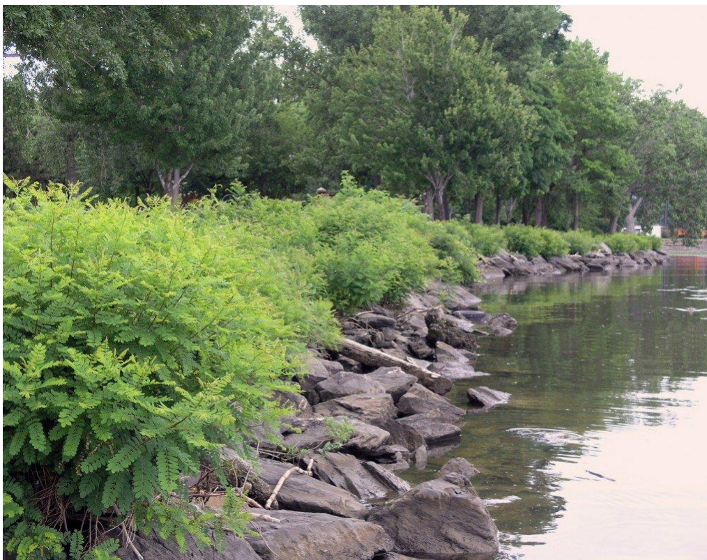
Slika 13. Amorpha fruticosa L. - riječni nasip

Svojim brzim razmnožavanjem amorfa utječe na šume koje se nalaze uz rijeke otežavajući im razvoj. Nastanjuje područja uz prometnice, poplavna područja i riječne nasipe (Slika 13.). Raste znatno brže od autohtonih šumskih vrsta te preraštavanjem i zagušivanjem može dovesti do propadanja mladih šumskih sastojina.