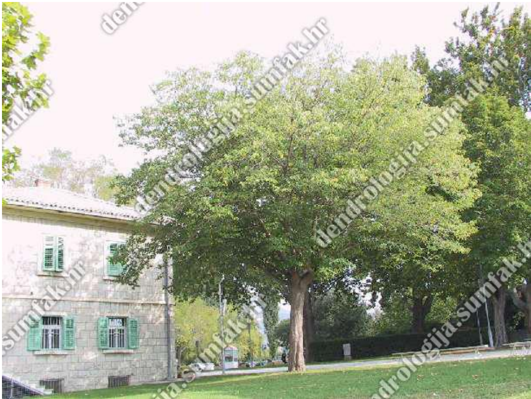
Slika 17. Broussonetia papyrifera (L.) Vent. – drvo dudovca u Dalmaciji

U Hrvatskoj je rasprostranjena samo u primorskom dijelu Hrvatske, odnosno od sjevernog primorja pa do južne Dalmacije (Slika 17.). Uzgaja se u nekim parkovima i arboretumima u kontinentalnoj Hrvatskoj.