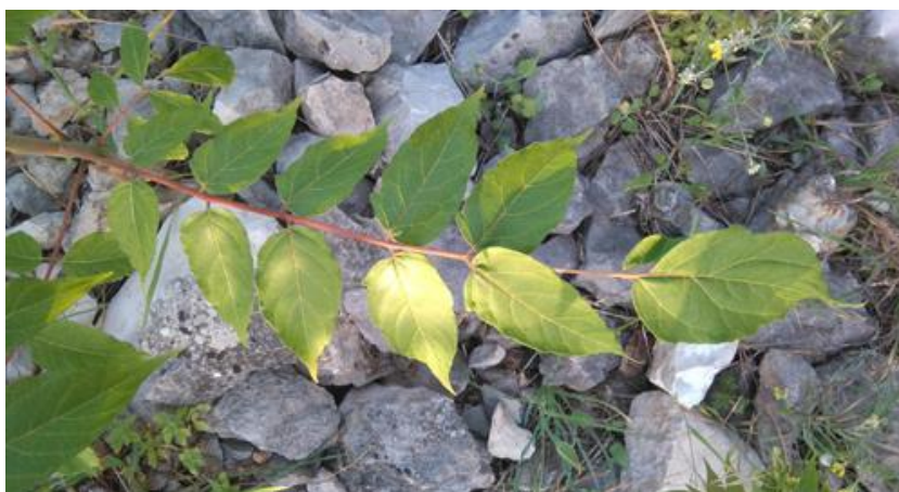
Slika 7. Ailanthus altissima (Mill) Swingle – pajasen u Dalmaciji