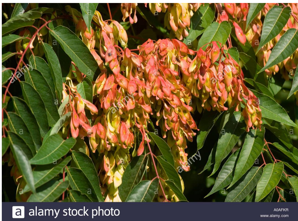
Slika 6. Ailanthus altissima (Mill) Swingle - list

Pajasen je brzorastuće, razgranato, listopadno stablo koje naraste do 25 m visine (Nikolić i sur., 2014.). Promjer debla može biti i do 1,5 m. Kora je debela i svijetlosiva koja starenjem puca. Listovi su naizmjenično raspoređeni. Dugi su oko 60 cm. Sastavljeni su od 10 do 40 liski. Sitni žutozeleni (poslije crvenkasti) cvjetovi skupljeni su u 40 cm duge metličaste cvatove (Slika 6.) koji se razvijaju od svibnja do srpnja. Vrsta je dvodomna (Hulina, 2011.). Muški cvatovi nešto su uočljiviji jer sadrže više cvjetova od ženskih, a ispuštaju jak miris kojim privlače oprašivače. Plodovi su dvostruko okriljeni oraščići koji se na stablu zadržavaju najčešće do idućega proljeća. Pajasen proizvodi veliku količinu plodova. Svi dijelovi biljke, osobito listovi i cvjetovi, imaju karakterističan neugodan miris. Nakon što mu u jesen otpadne lišće, na mladim izbojcima ostaju ožiljci u obliku srca. Ova se biljka može razmnožavati i vegetativno podzemnim podancima, adventivnim pupovima i fragmentima korijena. Živi do 50 godina (Franjić i Škvorc, 2010.).