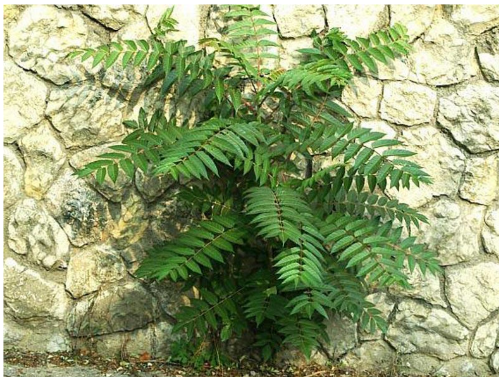
Slika 8. Ailanthus altissima (Mill) Swingle – pajasen raste iz kamena

Pajasen se većinom širi uz prometnice. Javlja se i unutar makija u mediteranskom području, zatim uz šumske putove, poljoprivredna zemljišta, unutar naseljenih mjesta, u okućnicama, te odlagalištima smeća i otpadima (Slika 8.).