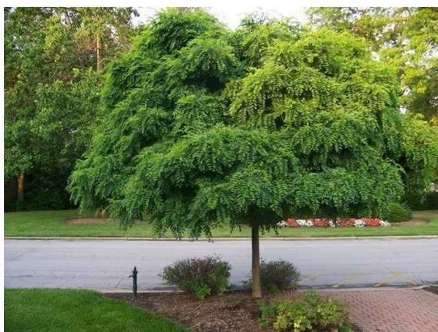
Slika 19. Robina pseudacacia L.- drvo

Bagrem je unesen namjerno kako bi se koristio za ogrjev, te kao tvrdo i trajno građevno drvo. Njegovom sadnjom kontrolira se erozija tla, osobito na kritičnim i antropogeniziranim područjima. Koristi se kao parkovno drvo (Dubravec, 1996.), te za pošumljavanje opustošenih i opožarenih područja. Bagrem je vrlo dobra pčelinja paša (Bačić i Sabo, 2007.) (Slika 19.). Ova biljka je ime dobila po francuzu Jeanu Robinu (vrtlar na francuskom dvoru) koji je prvi nabavio sjemenke bagrema s američkog kontinenta.