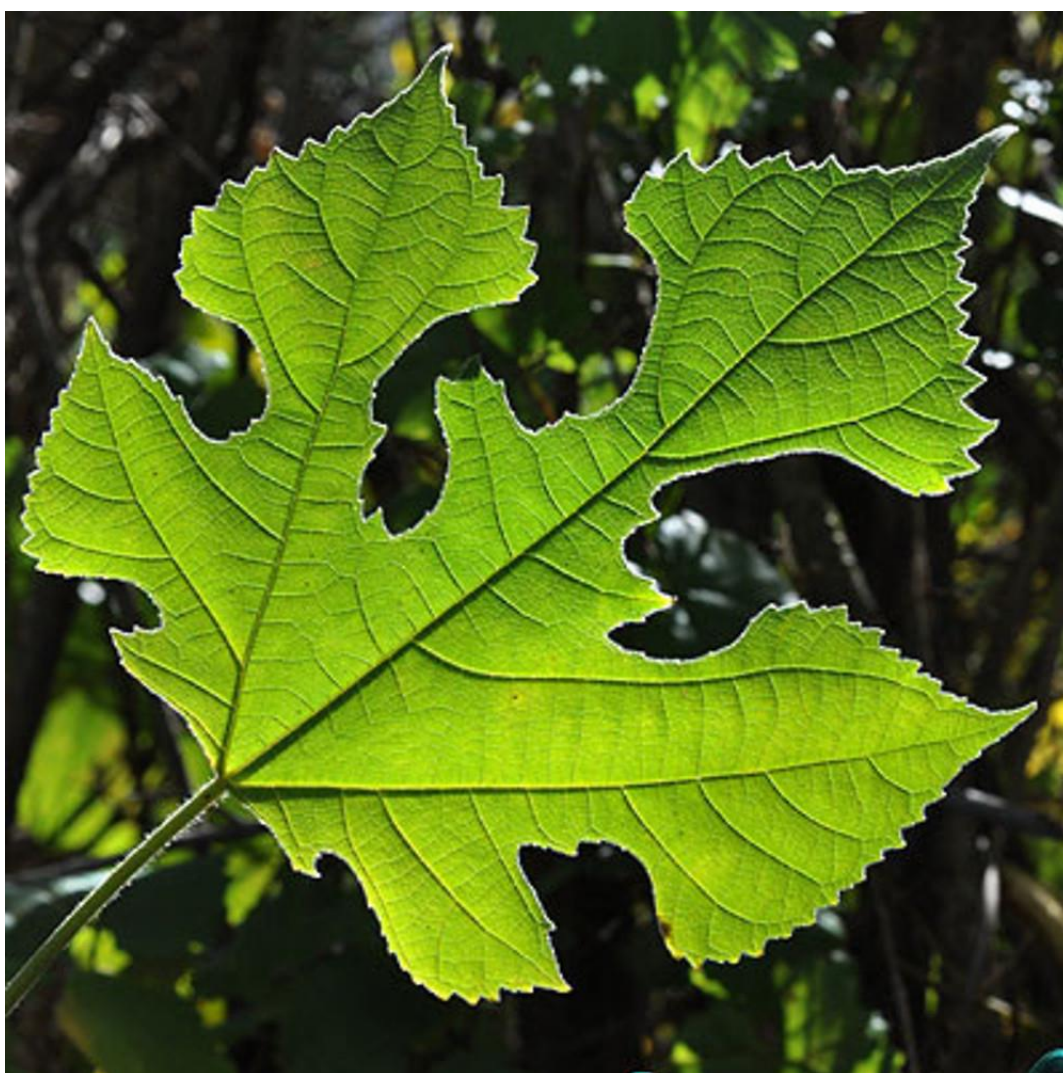
Slika 18. Broussonetia papyrifera (L.) Vent. - list

U Europu je ova biljka unesena namjerno, kako bi se uzgajala u botaničkim vrtovima. Smatralo se da pripada rodu dudova ( Morus ) budući da se nije znalo kako izgledaju plodovi. Naime, uzgajane su samo muške biljke. U jugoistočnoj Aziji je zavičajna vrsta, a na pacifičkim otocima je davno prisutna. Na tim područjima ima znatno veću kulturnu nego ornamentalnu vrijednost. Koristi se za izradu papira, tkanine i užadi (Slika 18.). Drvo je cijenjeno, a iz lika se dobivala tkanina (Franjić i Škvorc, 2010.).