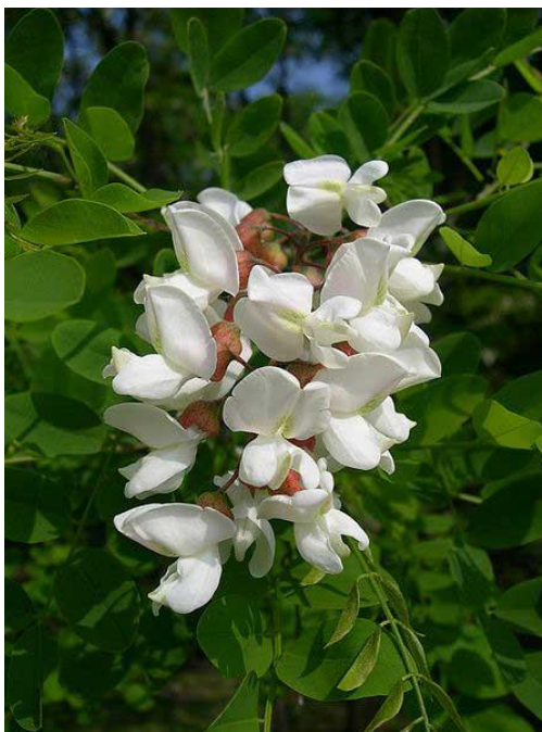
Slika 20. Robina pseudacacia L. – cvijet

Bagrem naraste do 25 m u visinu. Ima glatke, lomljive i trnovite grane s dosta rijetkom krošnjom. Korijenje je plitko, gusto i vrlo brzoga rasta. Korijenje bagrema ima mogućnošću fiksacije atmosferskog dušika. Kora je duboko izbrazdana. Listovi su dugi do 30 cm i neparno su perasti. Sastavljeni su od 9 - 17 jajastih liski cjelovitog ruba (Hulina, 2011.). Liske su tanke, duge 2 - 6 cm, a široke 1 - 3 cm. Lice liski je svjetlo zelene boje, dok je naličje sivozeleno. Palistići su preobraženi u jake trnove. Bagrem cvate u dugim, obješenim, grozdastim cvatovima sastavljenim od 15 - 20 cvjetova. Cvjetovi su bijele boje i mirišljavi (Slika 20.). Građa cvijeta karakteristična je za porodicu mahunarki. Vjenčić je građen od 5 slobodnih, nejednakih, bijelih latica. Ima 10 prašnika, od kojih je 9 međusobno sraslo prašničkim nitima u cijev, a jedan je slobodan. Plodnica je nadrasla i građena od jednog plodnog lista. Bagrem proizvodi mnogo nektara. Cvjeta od travnja do lipnja (Forenbacher, 1998.), a oprašuje se kukcima. Nakon oprašivanja razvija se plosnata, tamnosmeđa mahuna, obično s 4 - 10 sjemenki. Sjemenke su bubrežaste, maslinastozelene ili smeđe boje. Klijavost sjemenki nije velika. Bagrem se vrlo uspješno i brzo razmnožava vegetativno, korijenskim izdancima.