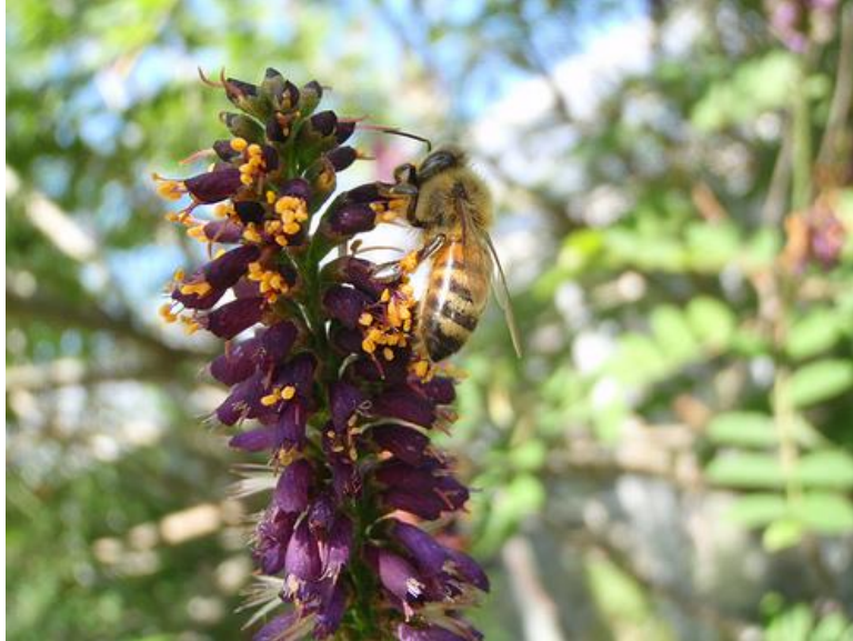
Slika 11 . Amorpha fruticosa – medonosna biljka

Amorfa se, osim sjemenkama, razmnožava i vegetativno podzemnim podancima. Ova biljna vrsta živi u simbiozi s bakterijama koje vežu elementarni dušik iz zraka i tako obogaćuju tlo dušikom. U pčelarstvu je vrlo cijenjena medonosna biljka (Slika 11.). Iz njezinih plodova možemo ekstrahirati ulje (Franjić i Škvorc, 2010.).