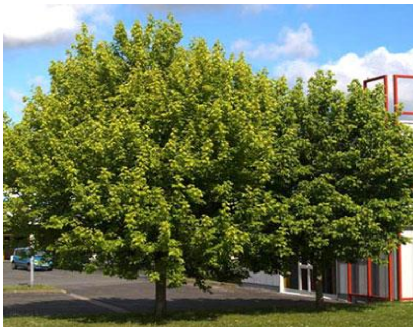
Slika 1. Acer negundo L.

Rasprostranjen je u sjeverozapadnoj i istočnoj Hrvatskoj i u Dalmaciji. Američki javor je namjerno unesena invazivna vrsta kao dekorativna biljka vrtova i parkova (Bačić i Sabo, 2007). Acer negundo koristi se kao parkovno drvo, zatim za ublažavanje erozije i zaštitu od vjetra. Sjemenke su važna hrana životinjama tijekom zime, dok pelud skupljaju pčele.