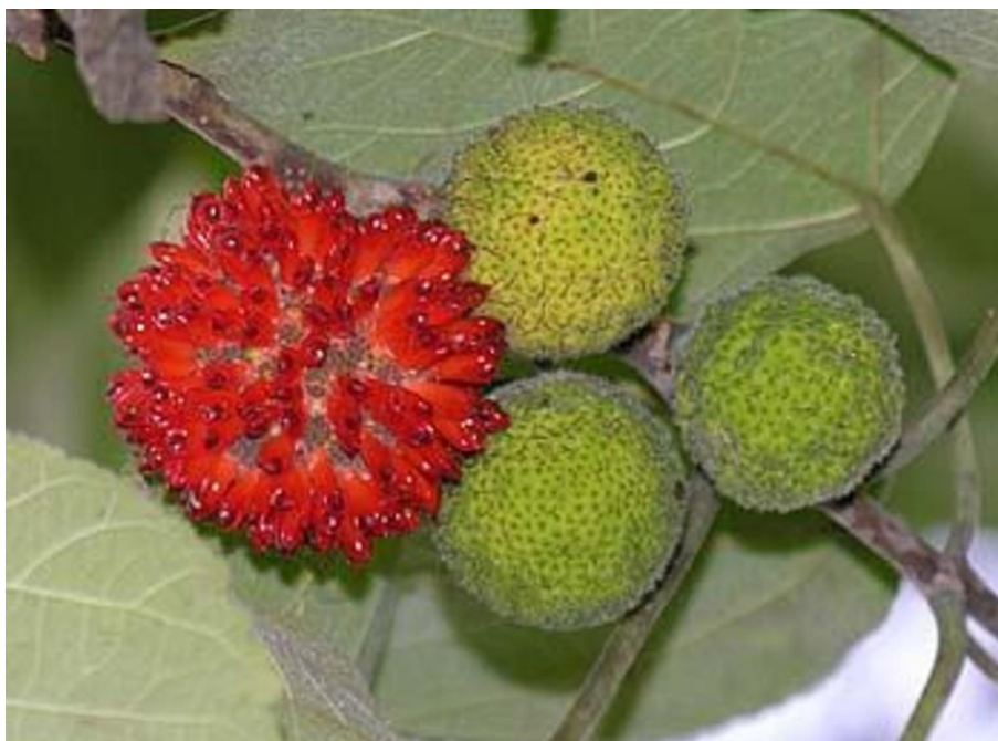
Slika 15. Broussonetia papyrifera (L.) Vent. – plod

U Europu je dudovac stigao u 18. stoljeću kao ukrasna biljka. Smatra se da je u Hrvatsku unesen u 19. stoljeću (primjerci u perivoj u Trstenu). Prirodno je rasprostranjen na području Azije (Koreja, Indija, Kina, Japan...) (Hulina, 2011.). Plodovi nisu jestivi (Slika 15.). U zemljama Azije uzgaja se kao industrijska biljka za dobivanje vlakna za izradu korpi, a drvo služi za izradu namještaja. Prije 2000 godina služila je za proizvodnju papira. Drvo je vrlo cijenjeno, iz lika se pravila tkanina, a iz jednogodišnjih izbojaka se proizvodio specijalni japanski papir. U područjima gdje se javlja u većem broju jedinki predstavlja veliki problem radi alergije koju izaziva pelud, a inače je opasna invazivna vrsta koja se dobro obnavlja iz panjeva i korijena.