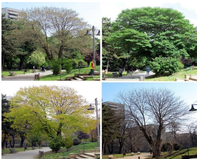
Slika 16. Broussonetia papyrifera (L.) Vent. – četiri godišnja doba

Japanski dud je listopadno drvo pravilne i guste krošnje, koje može narasti do 16 m visine. Korijenov sustav ove biljke je plitak i gust. Kora debela prvobitno je glatka, a kako drvo stari tako postaje višebojno isprugana (žutosiva, zelenkastosiva, kasnije sivocrna). Listovi su jednostavni, dugi do 20 cm, a široki do 15 cm (Nikolić i sur., 2014.). Na vrhu su listovi ušiljeni, dok su pri bazi zaobljeni. Lice plojke lista je tamnozeleno i hrapavo. Naličje lista je sivkasto i dlakavo. Peteljke listova su također dlakave i duge 3 - 10 cm (Hulina, 2011.). Listovi su poredani naizmjenično. Na mladim biljkama i obodu krošnje listovi mogu biti i nasuprotni te različitog oblika. Režnjevi listova podsjećaju na listove smokve. Biljka je dvodomna. Muške biljke imaju neugledne muške cvjetove s 4 prašnika. Ti muški cvjetovi su grupirani u 6 - 10 cm duge, viseće rese. Ženske biljke nose ženske cvjetove koji imaju jednostavno ocvijeće. Ženski cvjetovi skupljeni su u okruglastim i glavičastim cvatovima. Ljeti se iz njih razvija dudinja – okruglast skupni plod žute do crvene boje (Slika 15.). Plodovi nisu jestivi. Dudovac cvjeta tijekom travnja i svibnja (Slika 16.).