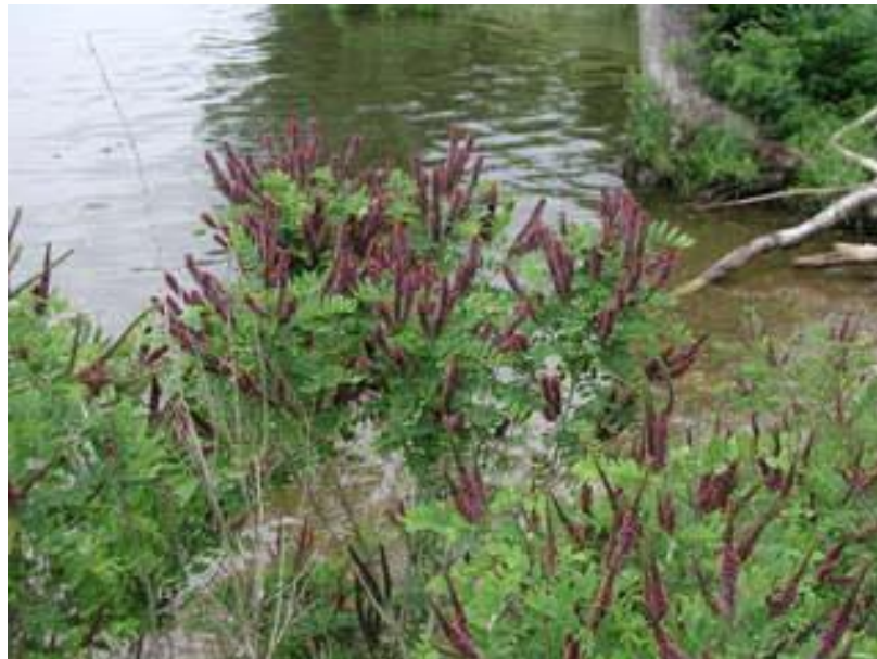
Slika 9. Amorpha fruticosa L.

Najčešće raste na vlažnim i neobrađenim područjima uz rijeke (Slika 9.), na povremeno poplavljenim mjestima i na drugim vlažnim površinama. Ponegdje se uzgaja kao vrlo značajna medonosna biljka.