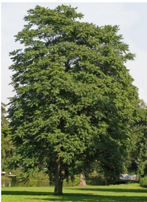
Slika 5. Ailanthus altissima (Mill) Swingle

Obični pajasen unesen je u Europu polovinom 18. stoljeća kao ukrasna biljka (Hulina, 2011.). Prema nekim autorima pogreškom zbog zamjene s vrstom Toxicodendron vernicifluum (Stokes) F. Barkley od koje se proizvodi lak za drvenu industriju. U Hrvatsku je stigao najvjerojatnije 1914. godine. Rasprostranjen je u Africi, SAD-u, Južnoj Americi, Aziji i Australiji. U Hrvatskoj ga pronalazimo u cijeloj zemlji, osobito duž obale i na otocima (Slika 5.). Uvezen je namjerno i koristimo ga kao ukrasnu biljku. U početku se upotrebljavao za pošumljavanje pjeskovitih staništa (Đurđevački pijesci), a sadio se i u drvodredima. Danas, posebno u primorskim područjima, predstavlja veliki problem jer se naglo širi i ugrožava autohtonu vegetaciju. Posebno je opasan jer luči alelopatske tvari.