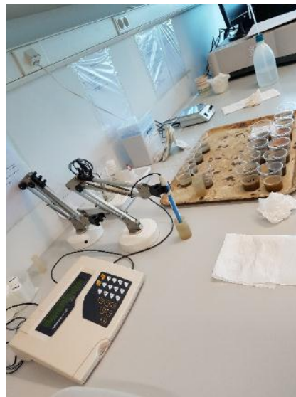
Slika 2. Mjerenje reakcije tla pomoću pH-metra