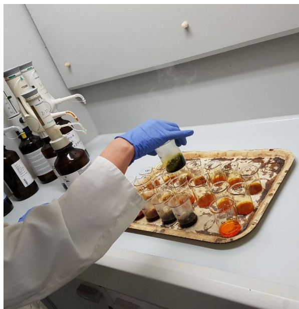
Slika 4. Mokro spaljivanje organske tvari tla otopinom K-bikromata