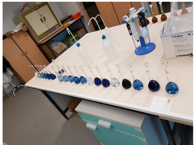
Slika 8. Kompleks plave boje