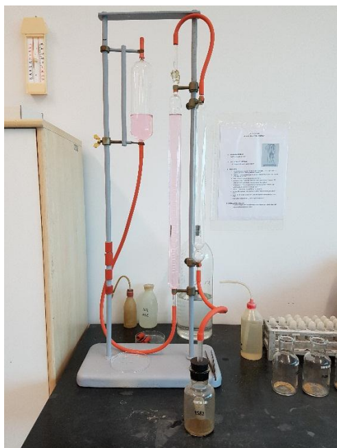
Slika 9. Određivanje sadržaja karbonata u tlu Scheiblerovim kalcimetrom