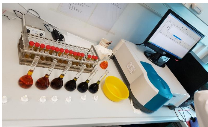
Slika 5. Spektrofotometrijsko određivanje organskog ugljika