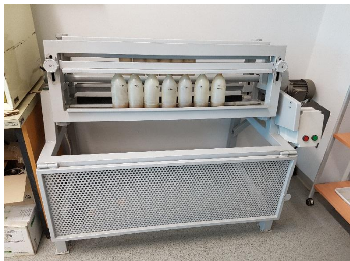
Slika 6. Mućkanje suspenzije tla na rotacijskoj mućkalici

Rezultati AL metode se izražavaju u mg P_2O_5 i K_2O na 100 g tla i predstavljaju količinu biljkama pristupačnih hraniva. Prema rezultatima AL metode, tla se dijele u različite klase opskrbljenosti fosforom i kalijem, od klase jako siromašnih tala (klasa A) do klase E, tj. tala jako visoke opskrbljenosti (Lončarić i sur., 2015.).