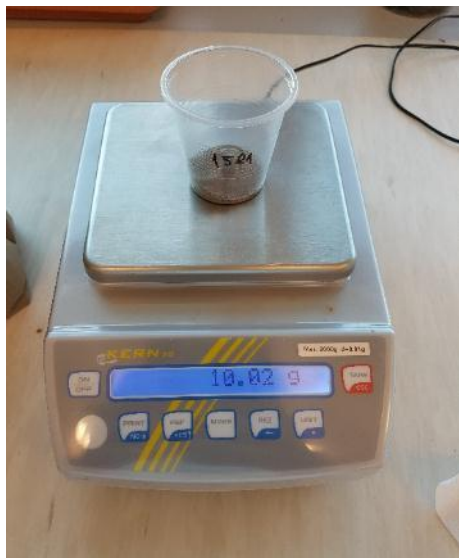
Slika 1. Odvagivanje 10 g uzorka tla

Postupak mjerenja pH-vrijednosti započinje odvagivanjem 10,0 g uzorka tla (slika 1.), na tehničkoj vagi, koji prenosimo u čašu od 100 ml (ISO, 1994.). Zatim je potrebno uzorak preliati s 25 ml deionizirane vode, odnosno 25 ml otopine KCl (mol/dm), te promiješati staklenim štapićem i ostaviti stajati 20 – 30 minuta. Za to vrijeme uzorke nekoliko puta promiješati staklenim štapićem. Na kraju, pomoću pH-metra koji je kalibriran pufernim otopinama za pH (pH 4, pH 7, pH 10), mjeri se pH reakcija tla (slika 2.).