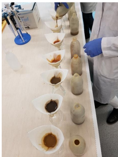
Slika 7. Filtriranje otopine kroz filter papir