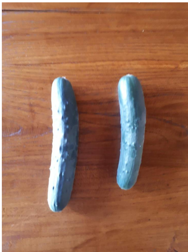
Slika 16. Prikaz plodova iz rjeđeg i gušćeg sklopa

Nije bilo razlika u udjelima netržišnih plodova između gušćeg i rjeđeg sklopa (Slika 16.). U gušćem sklopu je bilo više odbacivanja plodova, što je normalna pojava u biljnom svijetu, gdje biljka odbacuje plodove ili lišće uslijed stresa (manjak vode, visoke temperature, itd.).