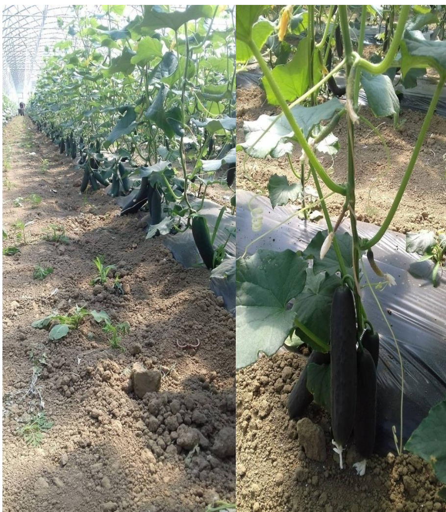
Slika 14. Početak plodonošenja

Prerasli i deformirani plodovi su odvojeni te im je utvrđen udio. Uočena je tendencija povećanja prinosa po jedinici površine kod rjeđeg sklopa.