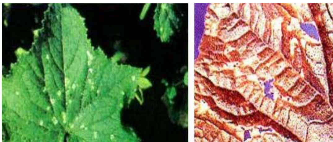
Slika 8. Uglata pjegavost lista krastavca

Pseudomonas syringae pv. Lacrymans / uglata pjegavost lista - za vrijeme toplog i vlažnog vremena naročito na površinama gdje se ne poštuje plodored može doći do bakterijskog oboljenja uglate pjegavosti lista (Slika 8.).