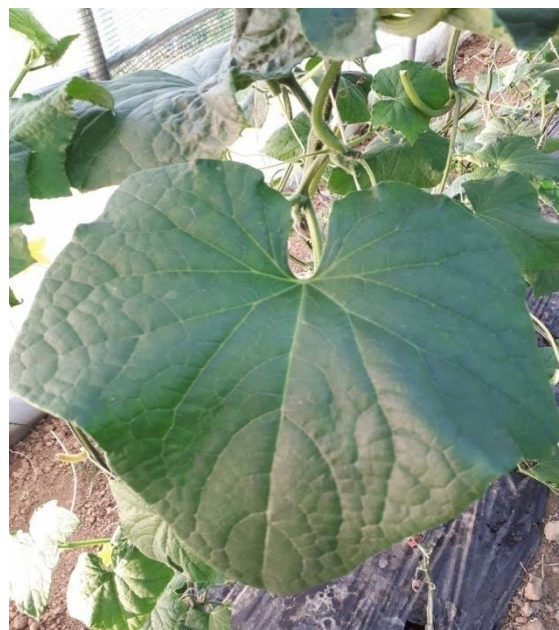
Slika 3. List krastavca