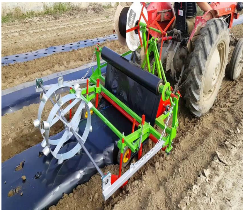
Slika 5. Strojno postavljanje crne polietilenske folije

Ovakav način uzgoja zahtjeva veća ulaganja, ali je zato sigurniji i bolji način proizvodnje, jer folija zadržava vlagu u tlu te sprječava rast korova, također nema kontakta nadzemnih dijelova sa tlom pa su manje infekcije bolestima čiji se uzročnici nalaze u tlu.