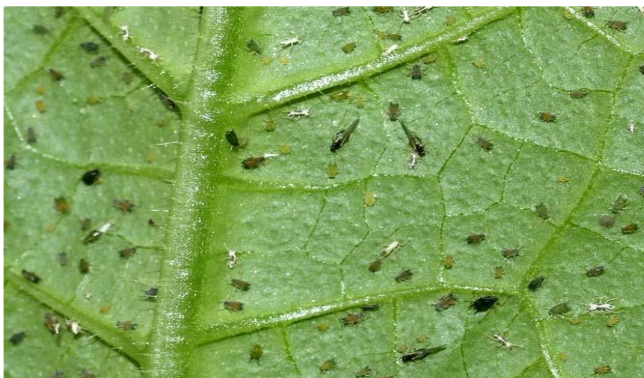
Slika 9. Lisne uši na naličju lista

Lisne uši su najznačajniji štetnici u proizvodnji krastavaca čiji napad je prepoznatljiv po uvijanju listova, a listovi su ljepljivi od medne rose koje izlučuju lisne uši (Slika 9).