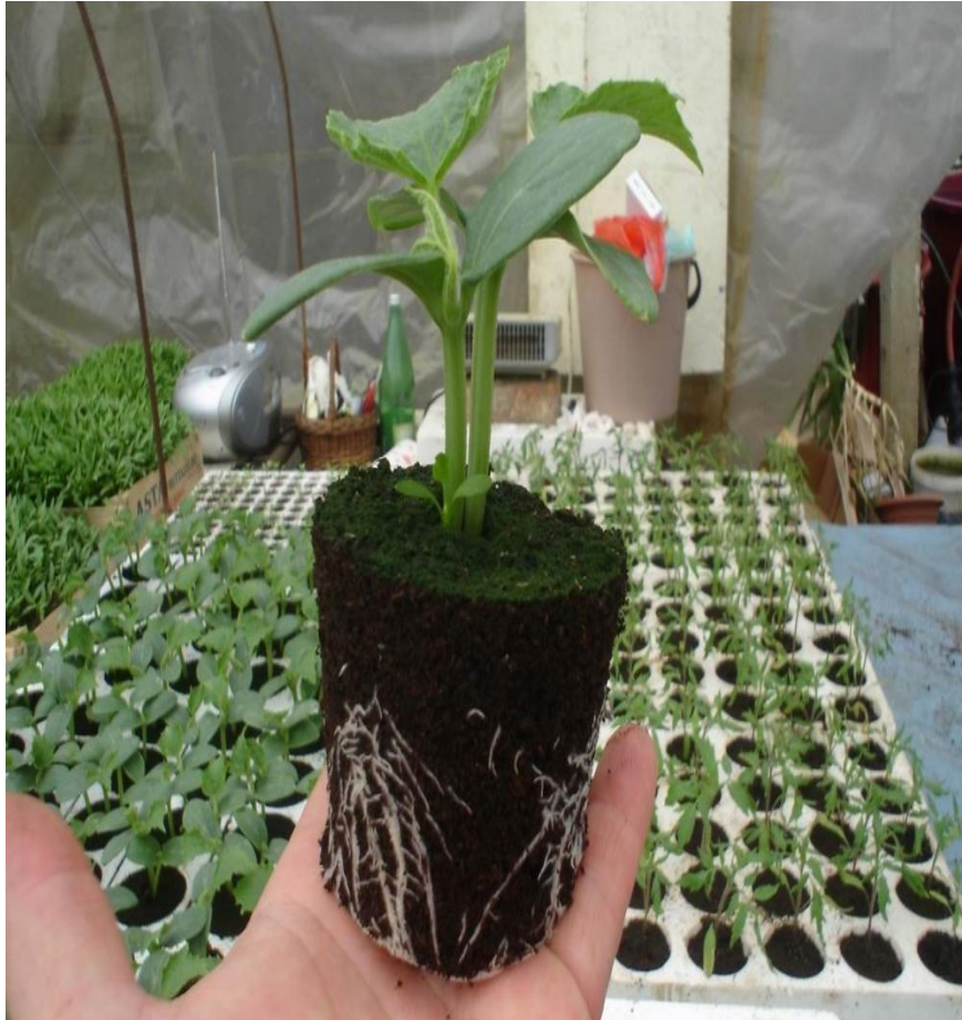
Slika 1. Presadnica krastavca

Korijen raste sporije od nadzemne mase pa je omjer korijena i nadzemne mase 1:10 do 1:20. Najviše raste površinski a u dubinu ide 40-50 cm (Slika 1.).