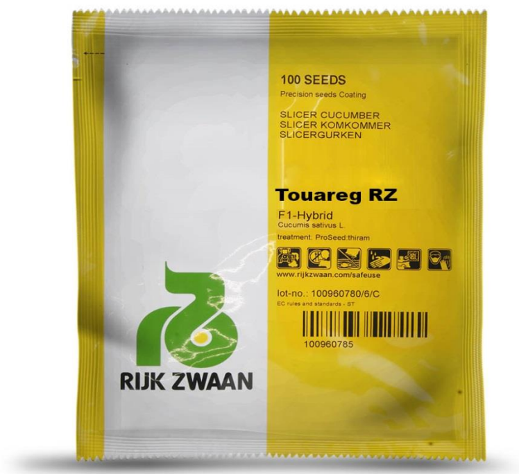
Slika 13. Kultivar krastavca

U istraživanju je korišten kultivar Touareg RZ F1 (Slika 13.), odnosno hibrid iz “blue-leafe” programa. Hibrid ima tamno lišće odličnog zdravstvenog stanja tijekom cijele sezone. Sami plodovi su duljine 21-24 cm. Pogodan za uzgoj u hidroponima.