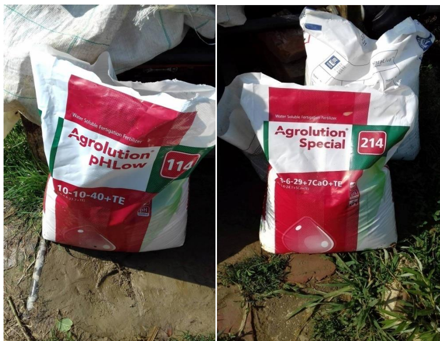
Slika 6. Prikaz vodotopivih gnojiva za prihranu