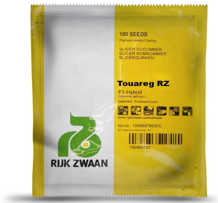
Slika 13. Kultivar krastavca

U istraživanju je korišten kultivar Touareg RZ F1 (Slika 13.), odnosno hibrid iz “blue-leafe” programa. Hibrid ima tamno lišće odličnog zdravstvenog stanja tijekom cijele sezone. Sami plodovi su duljine 21-24 cm. Pogodan za uzgoj u hidroponima.