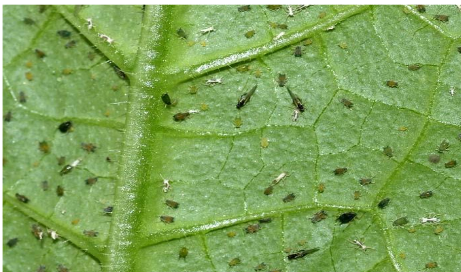
Slika 9. Lisne uši na naličju lista

Lisne uši su najznačajniji štetnici u proizvodnji krastavaca čiji napad je prepoznatljiv po uvijanju listova, a listovi su ljepljivi od medne rose koje izlučuju lisne uši (Slika 9).