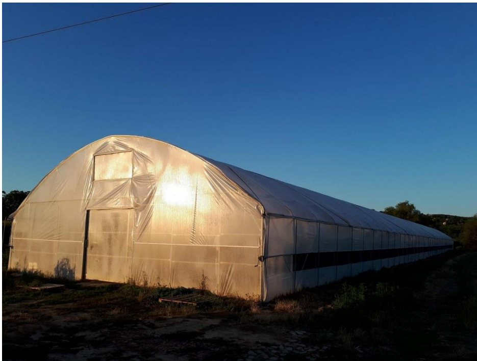
Slika 10: Platenik površine 1000 kvadrata

Gospodarstvo posjeduje 7 plastenika ukupne površine 5000 kvadrata, te na otvorenom polju 1ha. Od kultura uzgajaju se krastavci, zelena salata u plastenicima te na otvorenom polju tikvice. Sva zemlja je vlastita što je prednost gospodarstva.