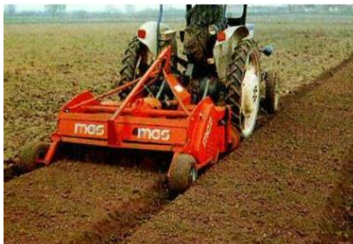
Slika 4. Priprema gredica sa sjetvu na golo tlo

Kod uzgoja na golom tlu ulaganja su znatno manja ali rizici su veći jer kod ovakvog načina uzgoja biljke su sklonije oboljevanju, a najveće probleme stvaraju korovi. Prinosi po jedinici površine su manji, kvaliteta plodova je lošija i plodovi su onečišćeni zemljom (Slika 4.).