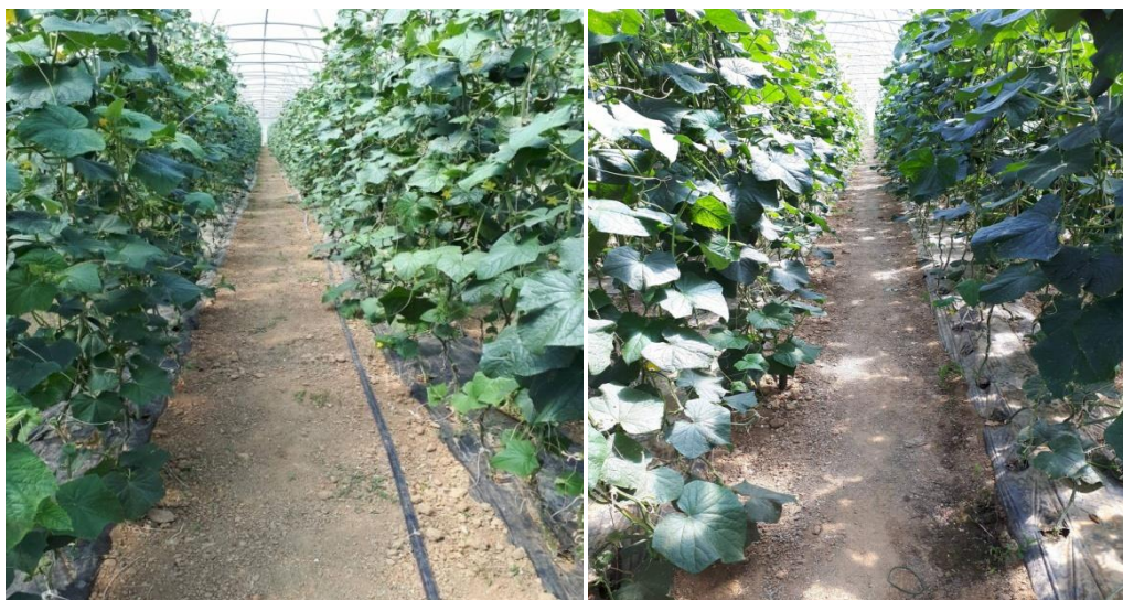
Slika 11. Međuredni razmak 120cm