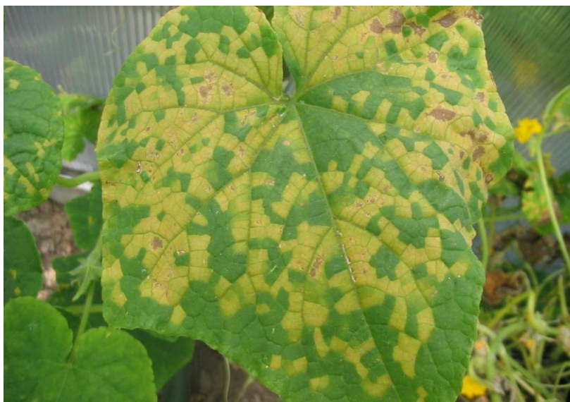
Slika 7. Plamenjača na listu krastavca