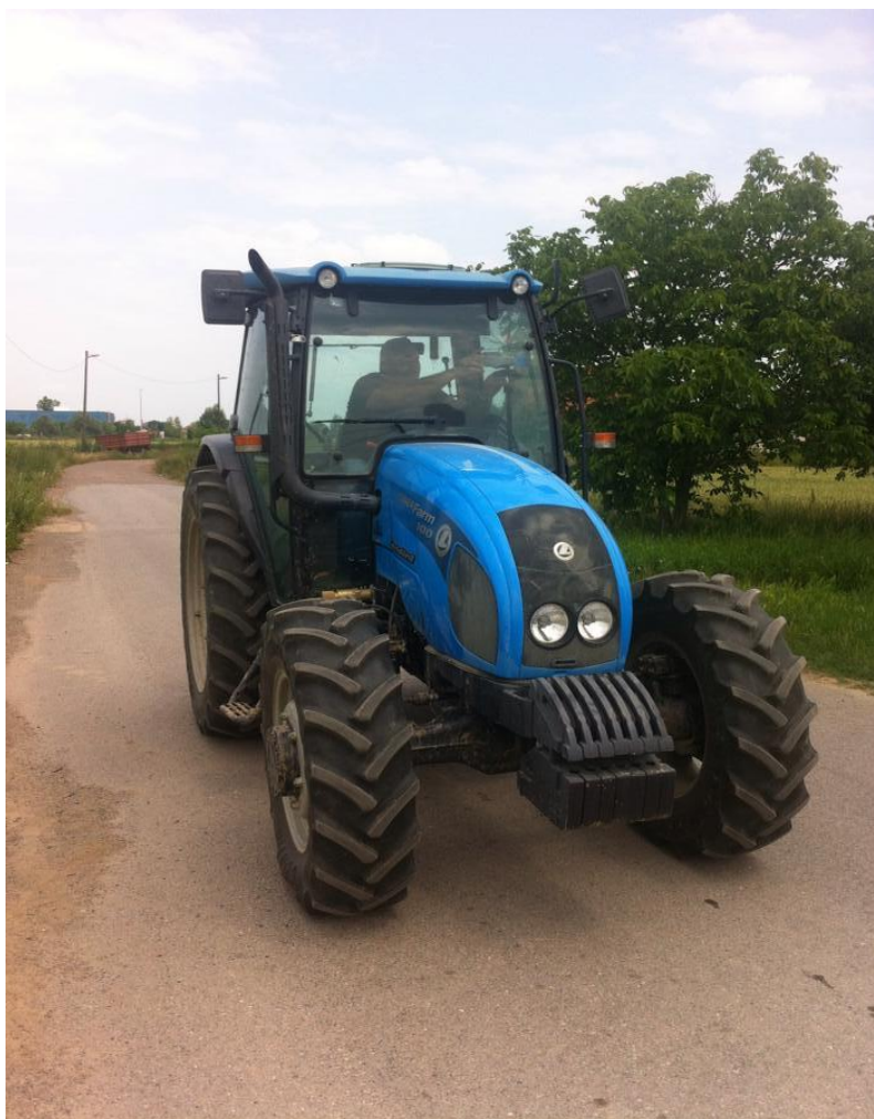
Slika 2. LANDINI POWERFARM DT 100A

Istraživanje je obavljano pri različitim agrotehničkim zahvatima buke na rukovatelja traktora pri različitim agrotehničkim zahvatima u odnosu na radne sate traktora provedeno je 2015. i 2016. godine na površinama Poljoprivredne i veterinarske škole u Osijeku. Mjerenje buke obavljeno je u skladu s propisanim normama HRN ISO 6396 koje se odnose na buku u unutrašnjosti kabine pri radu raspršivača i malčera. Razina buke mjerena je na traktoru LANDINI POWERFARM DT 100A (Slika 2.) koji je prilikom istraživanja 2015. godine imao 5800 radnih sati, a 2016. godine 6800 radnih sati.