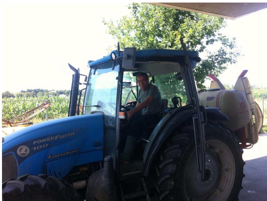
Slika 6. Raspršivač Agromehanika AGP 250