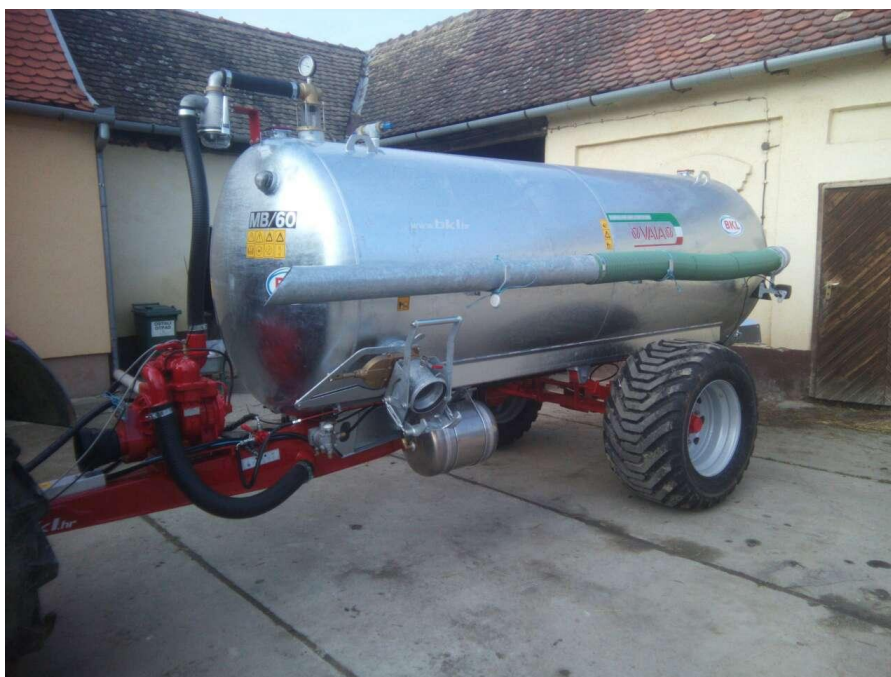
Slika 14. Cisterna Vaia 6200

Za iznošenje gnojnice i njezinu aplikaciju na poljoprivredne površine najviše se koriste cisterne koje moraju zadovoljiti zahtjeve za što manjim širenjem neugodnih mirisa, ako to nije zadovoljavajuće riješeno postupkom aeracije ili nekim drugim postupkom, i što manjim gubitkom hranjivih tvari iz gnojnice uz visoki radni učinak. S obzirom na način ostvarivanja tlaka potrebnog za aplikaciju, cisterne mogu biti izvedene s kompresorom ili s pumpom. Najviše su u primjeni cisterne čiji spremnik ima zapreminu od 2000 - 3000 l, iako se koriste i cisterne veće zapremine, preko 5000 l. Savjetodavna služba: Strojevi za gnojidbu, http://www.savjetodavna.hr/savjeti/19/531/strojevi-za-gnojidbu/ , 11.06.2017.)