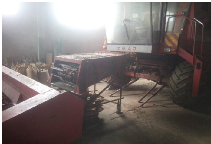
Slika 22. Priprema kombajna za žetvu

Emert i sur. 1995. navode da je prije početka rada potrebno izvršiti vizualnu kontrolu stroja te dotegnuti sve vijčane spojeve, a uočene deformacije ili oštećenja otkloniti. Sve prijenosnike pogona potrebno je prije početka rada provjeriti te ih po potrebi dotegnuti. Hederski stol ne smije biti oštećen, a uočene nedostatke potrebno je otkloniti. Tijekom rada potrebno je provjeriti letve bubnja te njezine vijke. Na podbubnju održavanje obuhvaća provjeru čistoće podbubnja. Vizualno kontrolirati odbojni biter, vizualno treba provjeriti slamotrese, te redovito provjeravati ležajeve na slamotresima. Sabirnu ravan potrebno je držati čistom, a gumene brtve na njoj moraju biti ispravne zbog manjeg rasipa. Provjeravati ispravnost svih spirala i svih prijenosa zrna. Mjere koje navode isti autori se provode na gospodarstvu.