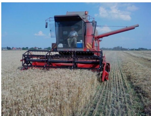
Slika 21. Kombajn „Zmaj 143“

Početak mjeseca svibnja kreće se s pripremom za žetvu ozimih kultura (ječam, pšenica) i kombajn mora biti spreman za žetvu do početka mjeseca lipnja. Priprema kreće od bubnja i podbubnja (korpa), skidanjem „blindi“, stavljanje podbubnja za ozime kulture, podešavanje broja okretaja bubnja, podešavanje zazora između bubnja i podbubnja, odnosno ulaz i izlaz žitne mase. Podešavanje uvlačnog kanala i kontrola letvi na uvlačnom kanalu. Na žitnom hederu vrši se izmjena tupih noževa i protunoževa. Podešava se i broj okretaja radijalnog ventilatora. Ukoliko su remeni ispucani, istrošeni ili istegnuti zamjenjuju se s novim remenima. Na kraju svih podešavanja i izmjena pristupa se cjelokupnom podmazivanju kombajna na mjesta koja su predviđena za podmazivanje. Ukoliko se primijeti da je pojedini ležaj u lošem stanju pristupa se izmjeni istog s novim ležajem. Na gospodarstvu se nakon svega kombajn pušta u rad u prazno, te ako je sve ispravno spreman je za žetvu. Ukoliko se dogodi kvar u toku žetve potrebno ga je odmah otkloniti.