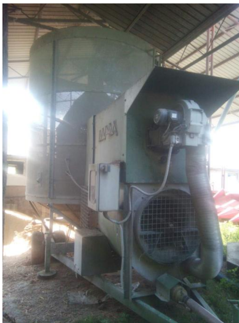
Slika 23. Sušara za žitarice ESFOR

Na OPG u Majdenić sušara za žitarice u 90 % slučajeva služi isključivo za sušenje kukuruza, a 10 % za sušenje soje. Sušara dobiva pogonom traktora Zetor Proxima 80 od priključnog vratila. Sušara ima vlastiti plamenik i koristi plavi dizel kao izvor topline za sušenje žitarica. Na OPG u sušara se uvijek nalazi na gospodarstvu.