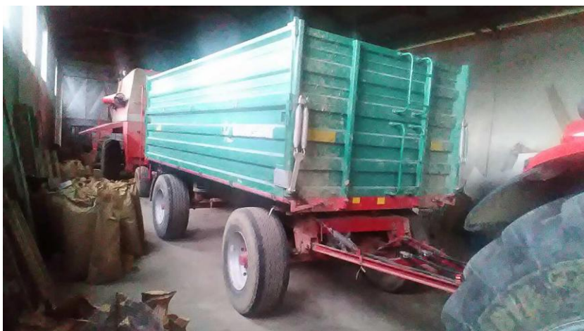
Slika 18. Prikolica Tehnostroj

Emert i sur. 1995. navode da je prije početka korištenja prikolice potrebno provjeriti vijke na kotačima i po potrebi ih doteguti, treba provjeriti tlak zraka u pneumaticima, voditi računa o podmazivanju ležajeva kotača, te provjeravati ispravnost gibnjeva. Provjeriti ispravnost cijevi i spojeva te stanje kočnih obloga kod prikolica s pneumatskim kočenjem. Potrebno je voditi računa o dozvoljenom opterećenju prikolice te nakon korištenja sanduk prikolice očistiti, a po potrebi i oprati, naročito nakon prijevoza kemijskih agresivnih tvari, kao što su mineralni i stajski gnoj. Mjere koje navode isti autori se provode na gospodarstvu.