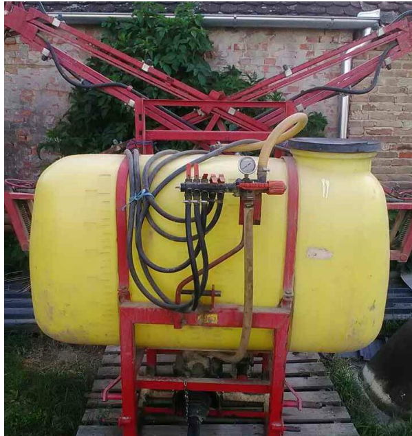
Slika 10. Prskalica MIO 612

podmazivanje litijevom masti Lis 2, kontrola regulatora pritiska, kontola zapornih slavina. Na prskalici je obavljena kontrola od strane Ministarstva poljoprivrede, 2016. godine. Na kraju godine obavlja se kompletno pranje prskalice, te ispuštanje vode iz svih dijelova prskalice. Nakon toga se garažira u skladištu u zatvorenom prostoru.