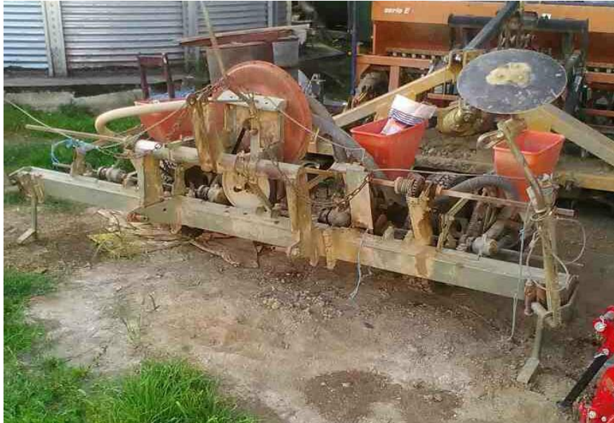
Slika 9. Sijačica PSK 4

regulatora pritiska. U zavisnosti od vremenskog perioda sjetve, obavlja se na dubini od 3-7 cm. Održavanje se sastoji od: podmazivanja svih rotirajućih dijelova litijevom masti Lis 2, podmazivanje pogonskih lanaca, po potrebi radi se skraćivanje lanca, izmjena plastičnih zubčanika ukoliko su napukli ili su se istrošili, podmazivanje pritiskajućih kotača i markira, kardana. Po potrebi radi se izmjena crijeva za protok zraka. Nakon sjetve slijedi čišćenje od zemlje, podmazivanje i garažiranje koje se obavlja u zatvorenom prostoru.