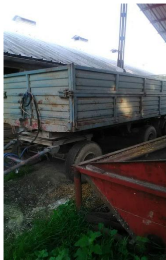
Slika 20. Prikolica Viševica Bribir

Uz veličinu gume vrlo je bitan i tlak u gumi, koji isto treba biti u skladu sa teretom kojeg guma nosi. Prekomjerno ili preslabo napuhavanje može biti neučinkovito ili čak opasno. Stoga, odvojite dovoljno pažnje tlaku vaših guma jer ne samo da odgovarajući tlak poboljšava radne performanse, nego omogućuje i uštedu goriva. (Izvor: Agroklub. Ratarstvo. Brinite se za vašu gumu i ona će za vas. https://www.agroklub.com/ratarstvo/brinite-se-za-vasu-gumu-i-ona-ce-za-vas/9709/ , 14.06.2017.)