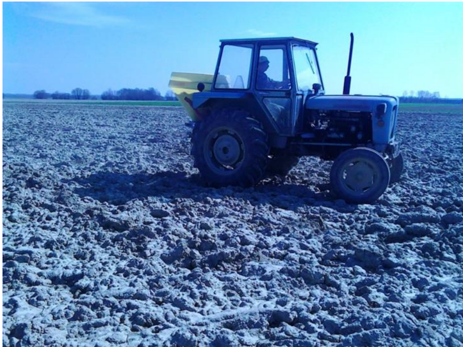
Slika 3. Traktor Rakovica 65

Traktor Rakovica 65 (slika 3.) ima četverocilindrični IMR motor, snage 46 kw, ima 6 brzina naprijed i dvije natrag, maksimalna brzina je 30 km/h, traktor je kupljen nov, 1988. godine. Traktor Rakovica na gospodarstvu obavlja agrotehničke operacije za obavljanje manjih poslova, transport repromaterijala do polja, aplikacija mineralnih gnojiva, sjetva kukuruza. Nakon rada slijedi čišćenje od zemlje, biljnih ostataka i prašine, te garažiranje u poluzatvorenom prostoru, odnosno nadstrešnici.