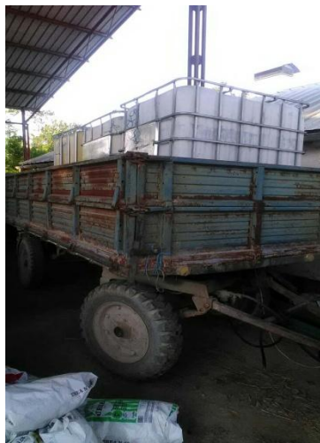
Slika 19. Prikolica Loznica