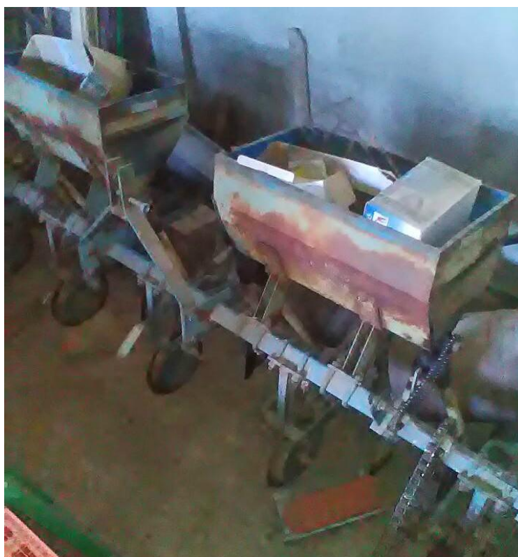
Slika 13. Kultivator OLT Orao

Kultivator OLT Orao (slika 13.) 4 reda nošena, mehaničkog tipa, međuredni kultivator obavlja razbijanje pokorice, podrezivanje korova između redova, prekidanje evaporacije, dodavanje mineralnog gnojiva, prozračivanje tla. Dubina kultivacije ovisi o vlažnosti tla, a širina kultiviranog dijela ovisi o visini usjeva. Prije početka rada radi se pregled naoštrenosti motičica, podmazivanje rotirajućih dijelova, podmazivanje pogonskog lanca, kontrola aparata za aplikaciju mineralnog gnojiva, te vizualni pregled cjelokupnog kultivatora. Nakon završetka rada slijedi čišćenje od zemlje i biljnih ostataka, te pranje spremnika za gnojivo i garažiranje se obavlja u zatvorenom prostoru.