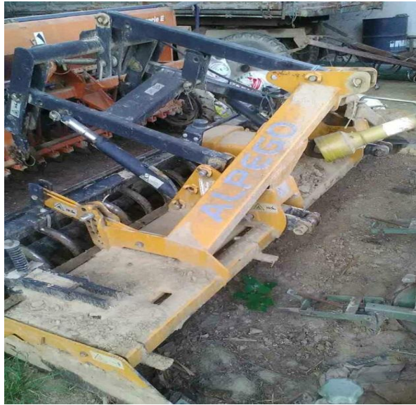
Slika 7. Roto drljača "Alpego"

nalazi se mazalica, a kompletan dio sa zupčanicima je u ulju, te se samo podmazuje pri njihovom radu. Na svakih 10 sati podmazuje se i kardan roto drljače, te paker valjak i kompletan hidrolift na kojem se također nalaze mazalice. Nakon sjetve slijedi čišćenje od zemlje, pranje i garažiranje u zatvorenom skladištu.