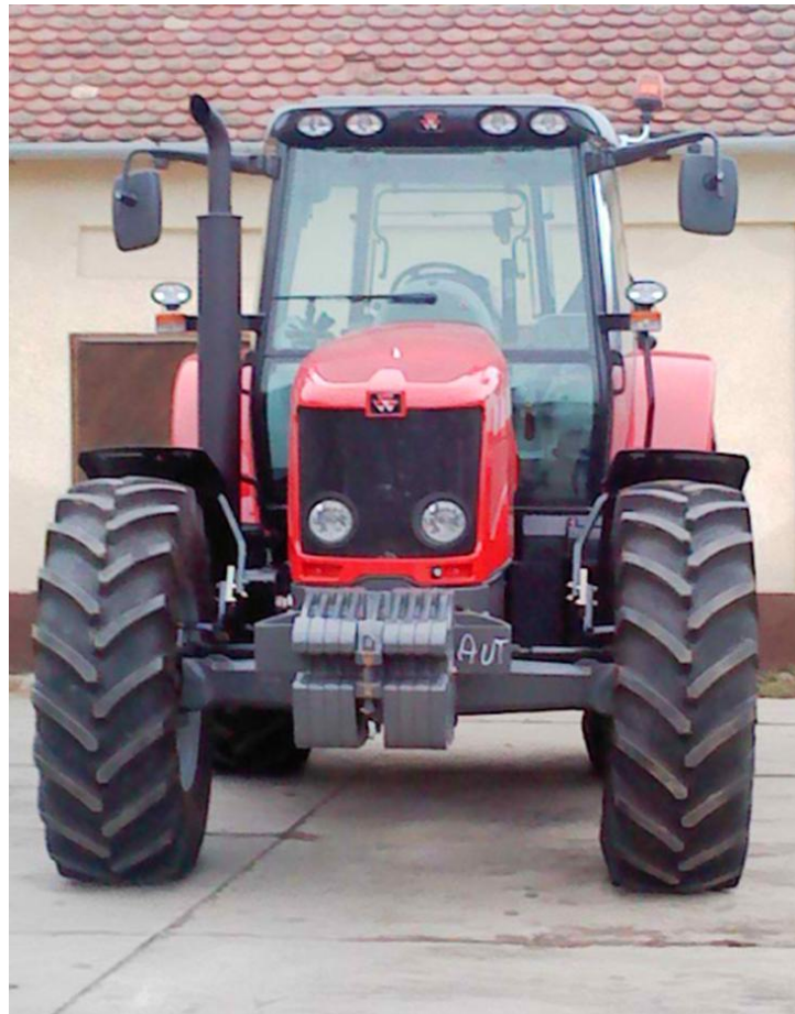
Slika 1. Traktor Massey Ferguson 6480

Dnevno održavanje traktora sastoji se od: ispirivanja hladnjaka motora, hladnjaka ulja, provjere mjerno kontrolnih instrumenata, provjere signalizacije, čišćenje pročistača zraka s kompresorom, čišćenje pročistača klime pomoću kompresora, provjere razine ulja u motoru, rashladne tekućine, vizualna kontrola kotača, zategnutosti spojeva, vijaka, remenja, provjere razine ulja u hidraulici.