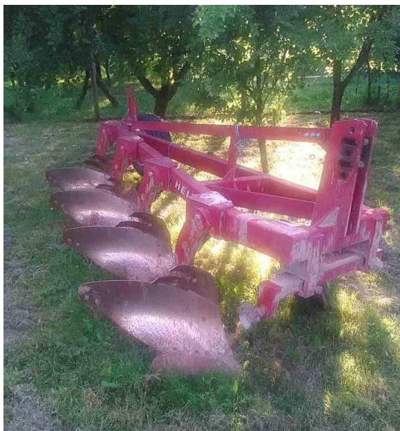
Slika 4. Plug "Helti Spertberg"

Emert i sur. 1995. navode da na plugu treba sve vijčane spojeve provjeriti, dotegnuti ili zamijeniti. Radne dijelove pluga očistiti od zemlje. Ukoliko plug ima diskosno crtalo podmazati ležaj. Tijekom oranja lemeš se troši pri čemu postaje tup te ima povećan vučni otpor, te se povećava potrošnja goriva traktora i pogoršava kakvoća rada. Zatupljeni lemeši se zamjenjuju novim. Tijekom rada potrebno je podmazivati plug prema naputku proizvođača, odnosno ležište gornje traktorske poluge i rukavci poprečne osovine. Mjere koje navode isti autori se provode na gospodarstvu.