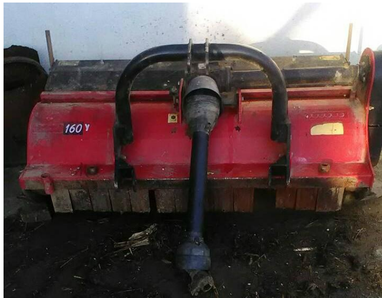
Slika 17. Malčer "Gramip"

Malčer "Gramip" (slika 17.) radni zahvat 160 cm, s Y noževima, nošenog tipa, s valjkom koji je ujedno i kotač za regulaciju visine. Kupljen je nov 2012. godine. Služi za usitnjavanje žetvenih ostataka kao što su slama pšenice, ječma, soje i kukuruzovine. Moguće je i malčiranje zelenih površina. Prije uporabe podmazuju se svi rotirajući dijelovi, pritežu vijci i matice na držačima Y noževa. Nakon uporabe slijedi kompletno čišćenje od ostataka zemlje i žetvenih ostataka, te vizualan pregled rotirajućih dijelova i pritezanje vijaka, te garažiranje u zatvorenom prostoru.