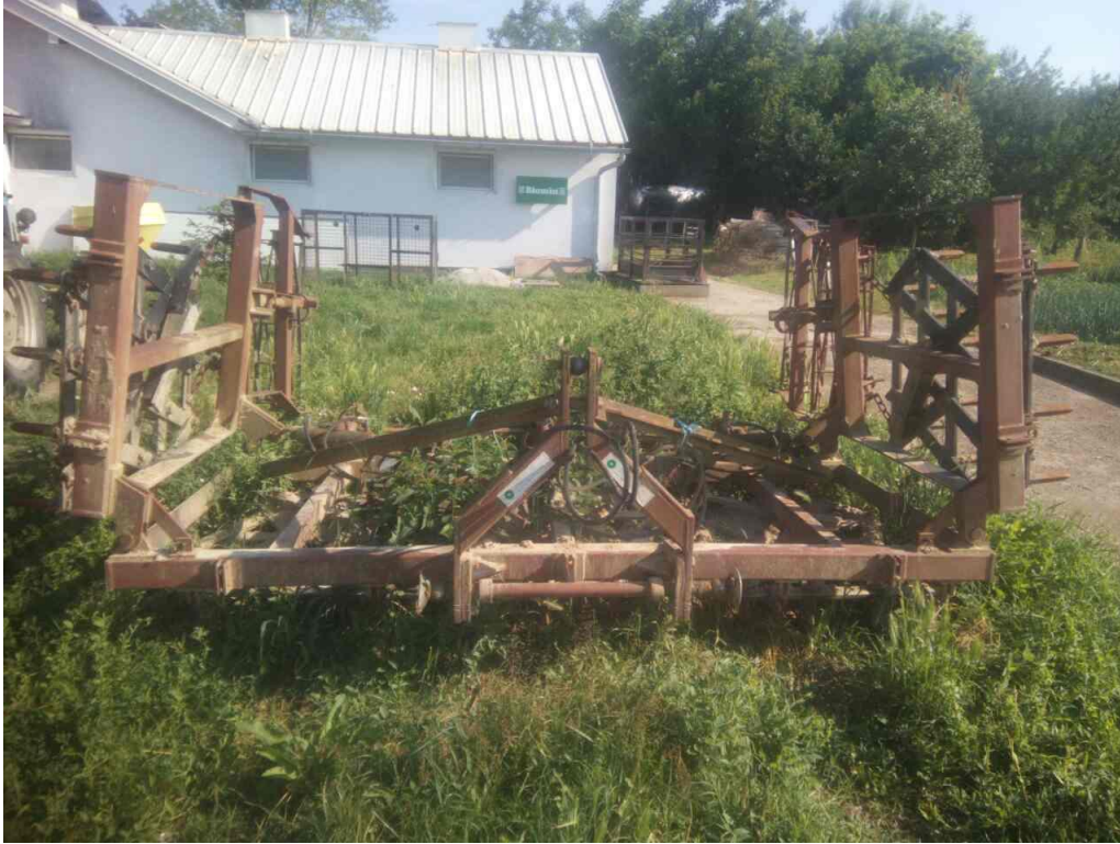
Slika 5. Teška drljača "Metalac"

Emert i sur. 1995. navode da za uspješan rad drljače krila moraju biti podešena tako da kada se postave na ravnu površinu vrhovi svih zubaca budu u istoj ravnini te kada se drljača povuče da razmaci između brazdica budu jednaki. Potrebno je provjeriti učvršćenost svakog zupca za okvir kao i naoštrenost vrhova zupca. Oštećene zupce treba zamijeniti ili popraviti, a tupe naoštriti. Mjere koje navode isti autori se ne provode na gospodarstvu.