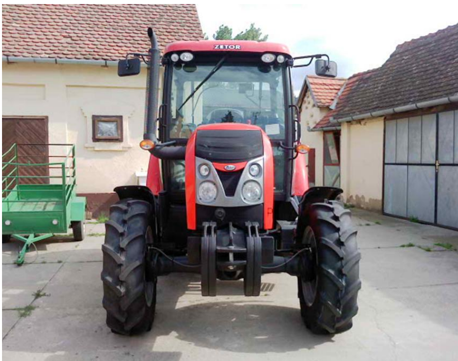
Slika 2. Traktor Zetor Proxima 80

Tjedno održavanje traktora Zetor Proxima 80 sastoji se od: čišćenja pročistača zraka, ispirivanje hladnjaka motora, pranje i odmaščivanje traktora, pranje stakla kabine, podmazivanje prednjeg mosta i zglobova kotača prednje vuče, podmazivanje priključnog vratila prednje vuče, ispirivanje pročistača za hlađenje/grijanje kabine.