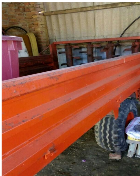
Slika 15. Raspodjeljivač stajnjaka Tehnostroj

Raspodjeljivač krutog stajnjaka Tehnostroj (slika 15.) nosivosti je 4 t, širina aplikacije je 6 m. Raspodjeljivač je u najmu prilikom korištenja, a je proizveden 1984. godine. Ima 4 vertikalna bubnja. Stajnjak se donosi beskonačnom trakom do uređaja za razbacivanje. Beskonačna traka s lancem pogon dobiva od priključnog vratila traktora. Ona se pogoni preko zupčanika, zaporke i ručice s podesivim polumjerom. Beskonačna traka pokreće se u razmacima srednjom brzinom od 0,4 do 1,2 m/min. Prije početka rada kontrolira se tlak u kotačima, podmazivaju se svi rotirajući dijelovi i pogon zupčanika, te se podmazuje kardan. Nakon završetka rada slijedi kompletno pranje raspodjeljivača stajnjaka. Garažiranje se obavlja u poluzatvorenom prostoru.