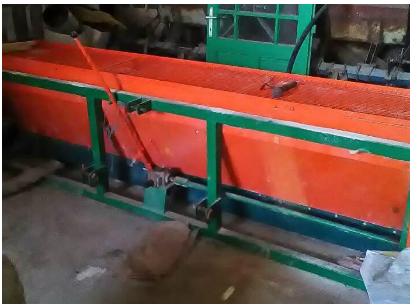
Slika 12. Raspodjeljivač kalcija

Kalcizator (slika 12.) tvrtke "Metal-co", mehaničkog nošenog tipa, zahvata 3m, pogon dobiva od priključnog vratila traktora. Kapacitet spremnika je 800 kg, s dva unutarnja mješača i mehaničkim otvaranjem zasuna. Količina kalcizacije ovisi o brzini traktora i otvoru zasuna. Na ovaj način kalciziramo s oko 3 t/ha Holcim agrocal prah. Prije početka rada podmazuje se kardan te rotirajući ležaji i pogonski lanac. Nakon završetka rada slijedi kompletno pranje kalcizatora te garažiranje koje se obavlja u zatvorenom prostoru.