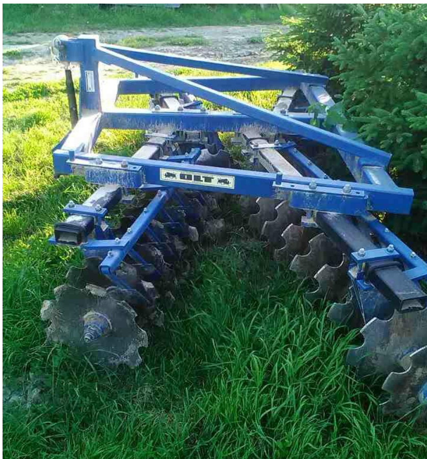
Slika 6. Tanjurača OLT Vuka 34

Emert i sur. 1995. navode da prije početka rada s tanjuračem je potrebno provjeriti zategnutost vijčanih spojeva, podmazivanje ležajeva te provjeriti stanje tanjura. Oštećene tanjure treba zamijeniti, a tupe naoštriti. Potrebno je provjeriti ispravan položaj strugača zemlje s tanjura. Kod vučenih tanjurača voditi računa o pneumaticima i tlaku zraka u istima. Mjere koje navode isti autori se provode na gospodarstvu.