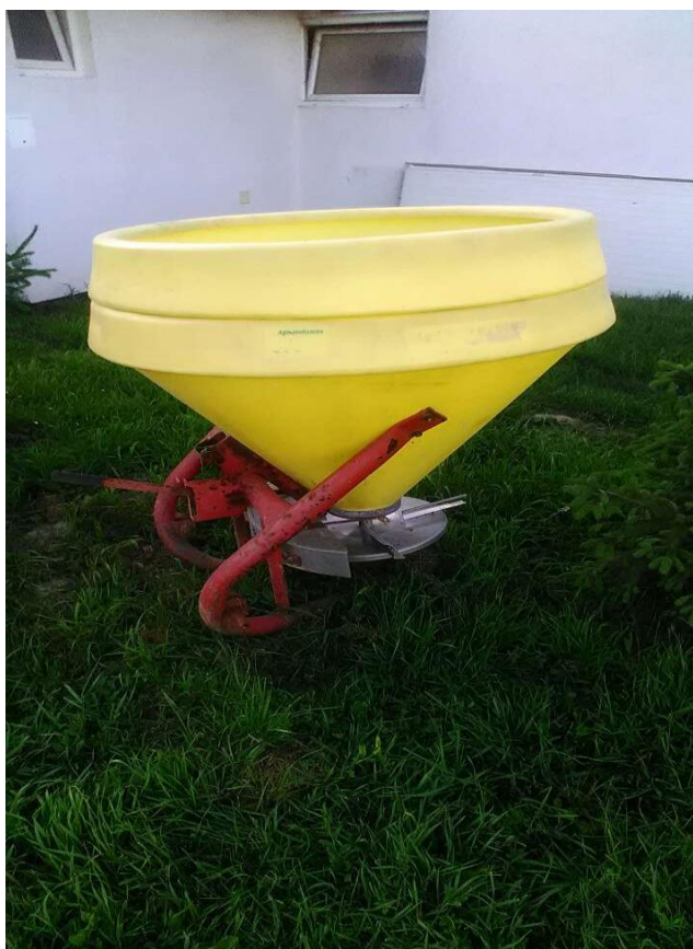
Slika 11. Raspodjeljivač mineralnog gnojiva

Emert i sur. 1995. navode da zbog korozivnog djelovanja na metalne dijelove rasipača ali i opterećenja rasipača za vrijeme transporta je potrebno punjenje rasipača gnojivom obavljati na polju prije početka rada. Preporučuje se nakon završetka rada kompletno očistiti rasipač. Mjere koje navode isti autori se provode na gospodarstvu.