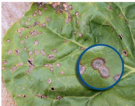
Slika 1. Simptomi pjegavosti lista šećerne repe