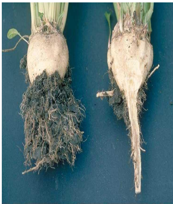
Slika 11. Zaražen korijen šećerne repe