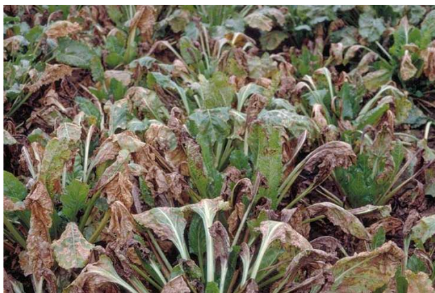
Slika 4. Usjev šećerne repe zaražen sivom pjegavosti lista

Siva pjegavost je proljetna bolest i odgovaraju joj temperature od 18 – 22 °C. Sivu pjegavost ne treba suzbijati fungicidima, jer se prestane razvijati kada dođe ljetno vrijeme, a šećerna repa nadoknadi gubitak lisne mase. Siva pjegavost lista se sporije razvija i manje djeluje na prinose korijena i sadržaj šećera (Bažok i sur., 2015.).