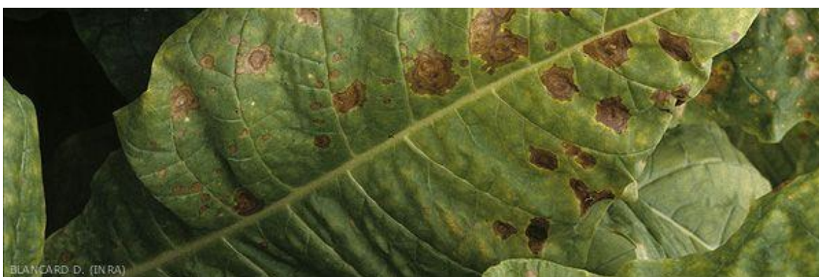
Slika 7. Koncentrična pjegavost lista šećerne repe

Bolest uzrokuje ju gljiva Alternaria alternata , zahvaća starije lišće u vidu okruglih smeđih pjega, u kojima su vidljivi koncentrični krugovi. Uglavnom se uočava pred kraj vegetacije, ali ne uzrokuje štete (Bažok i sur., 2015.).