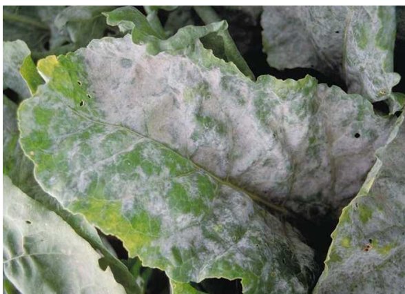
Slika 5. Pepelnica na listu šećerne repe

Pepelnicu uzrokuje gljiva Erysiphe betae . Simptomi su sivo – bijele prevlake na licu i naličju listova. Razvoju pogoduju temperature od 25 – 30 °C i niska relativna vlažnost zraka. Pepelnica se pojavljuje kada i pjegavost lista, pa fungicidi kojima se tretira pjegavost lista, djeluju i na pepelnicu, jer njeni negativni učinci su znatno manji od pjegavosti lista. Tretiranje fungicidima samo ako su simptomi vidljivi na polovici lista, od više nasumično pregledanih listova (Bažok i sur., 2015.).