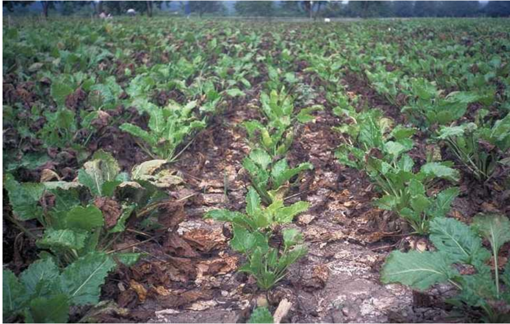
Slika 2. Usjev šećerne repe zaražen s pjegavosti lista