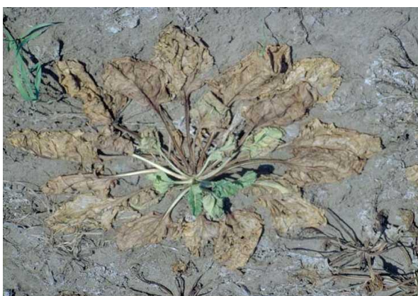
Slika 9. Smeđa trulež na listu repe