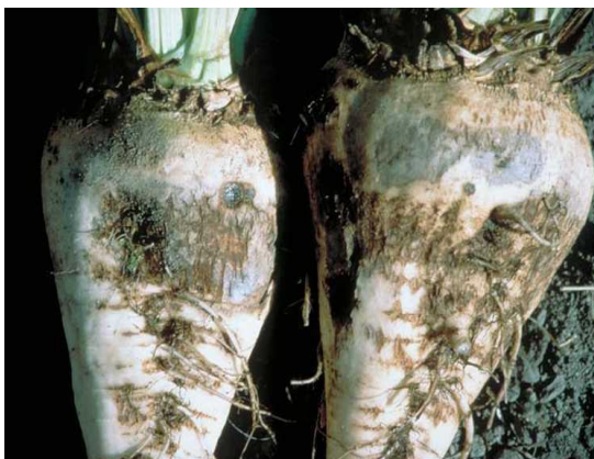
Slika 8. Smeđa trulež na korijenu repe

Gljiva koja je uzročnik bolesti živi u tlu i prezimljuje kao micelij na organskim tvarima u tlu. a njoj pogoduju visoke temperature od 25 – 30 °C. Simptomi smeđe truleži korijena vidljivi su kada je vruće i suho ljetno vrijeme. Listovi požute, a zatim se potpuno osuše i potamne. Na zaraženom korijenu, na presjeku možemo vidjeti trulo tkivo. Biljke pokušavaju stvoriti novo lišće, no do kraja sezone potpuno propadnu (Bažok i sur., 2015.).