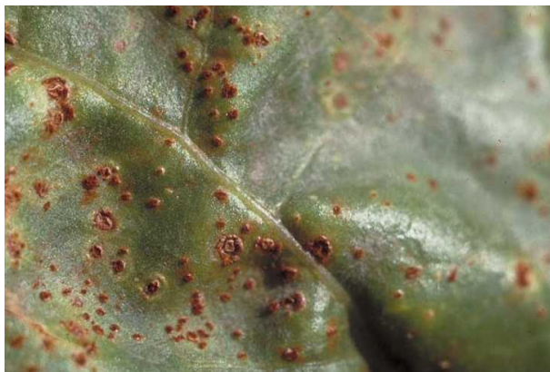
Slika 6. Hrđa na listu šećerne repe

Hrđu uzrokuje gljiva Uromyces betae , bolest možemo prepoznati po okruglim nakupinama, koje su ispunjene smeđim prahom. Njezina pojava u Hrvatskoj je rijetka i ne uzrokuje gospodarske štete. Primjena fungicida nije potrebna (Bažok i sur., 2015.).