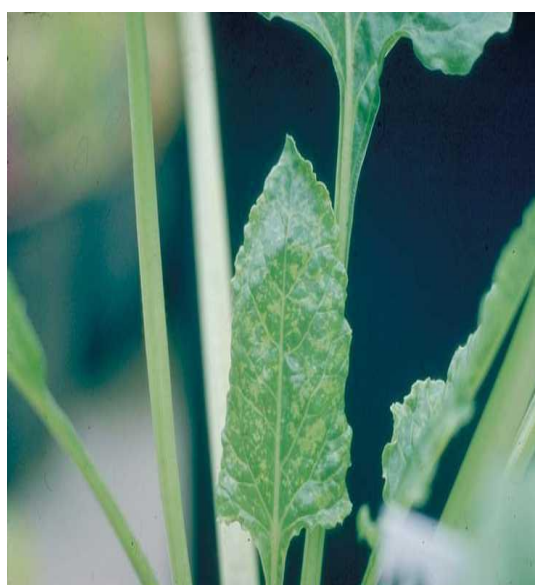
Slika 13. Virus mozaika šećerne repe