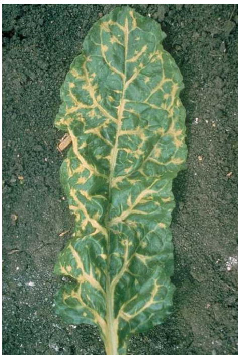
Slika 10. Kloroza na listu šećerne repe

Simptomi na mladim zaraženim biljkama vidljivi su kao zastoj u rastu. Simptomi su izraženiji, ako je parcela vlažnija. Na korijenu se uočavaju brojne korjenove dlačice, zbog toga se i naziva „bradatost“. Za zaštitu od rizomanije vrlo je bitno da se sjetva obavi u optimalnim rokovima, poštuje plodored, testira parcela na virusni inokulum i najvažnije od svega da se siju tolerantne ili djelomično otporne sorte (Bažok i sur, 2015.).