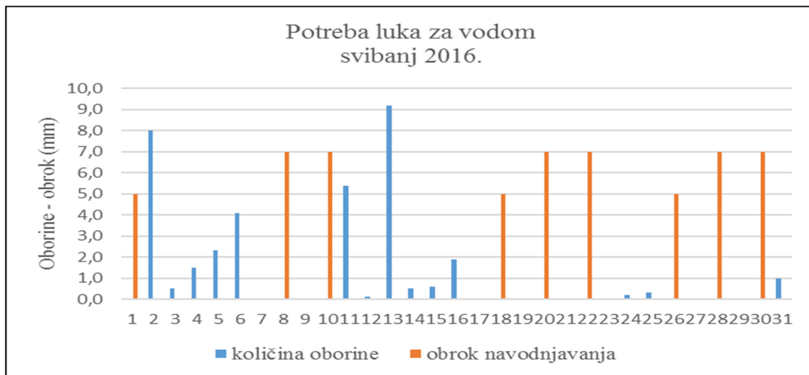
Slika 3. Oborine i navodnjavanje u svibnju 2016.

Količina oborina i obroci navodnjavanja tijekom mjeseca svibnja ukazuju na gotovo svakodnevnu manju količinu oborina do sredine mjeseca (Slika 3). Učestalije kišenje s kraja travnja (Slika 2) se nastavilo i početkom svibnja odnosno tijekom prvog dijela prve dekade u tom mjesecu.