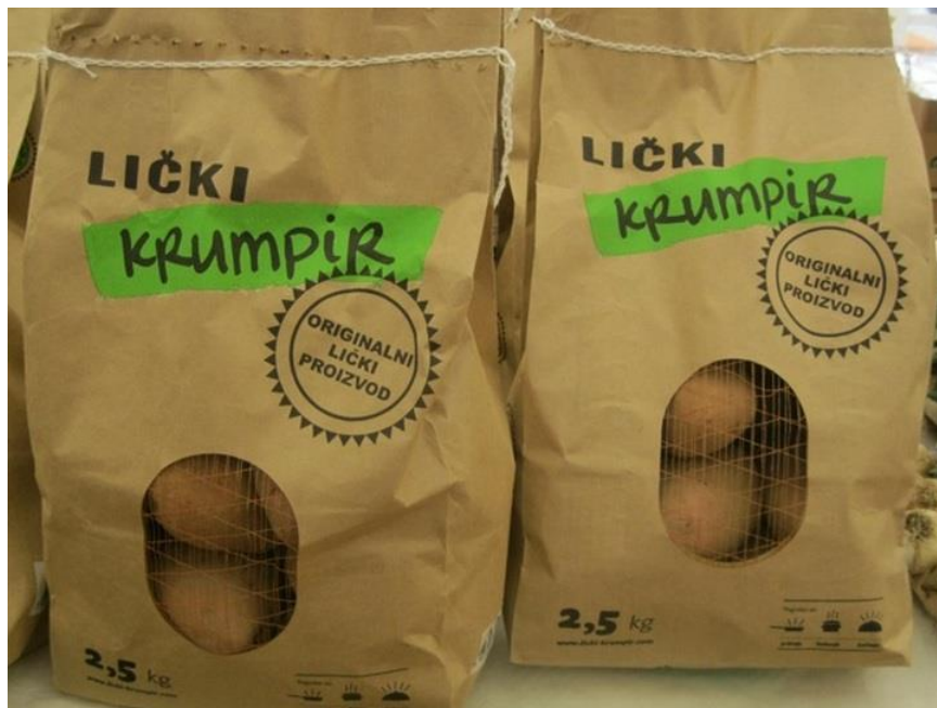
Slika 10. Lički krumpir ( http://alpedunavjadran.hrt.hr/emisija/13-11-2015/zasticen-kao-licki-krumpir/ )