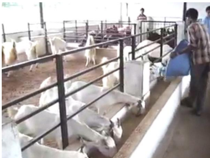
Slika 9. Stajski uzgoj koza

Stajski uzgoj – Pogodan kada ne raspolažemo poljoprivrednim površinama, kada imamo manjak radnika i kad nemamo uvjete za držanje koza na otvorenom. Prednost je ta što možemo primijeniti najsuvremeniju tehnologiju, mogućnost kontroliranja životinje (jarenje, bolesti, tjeranje itd.). Vrlo je važna uloga krepih krmiva za dobro izbalansiran obrok. Veličina stada kreće se od 30 do 100 grla.