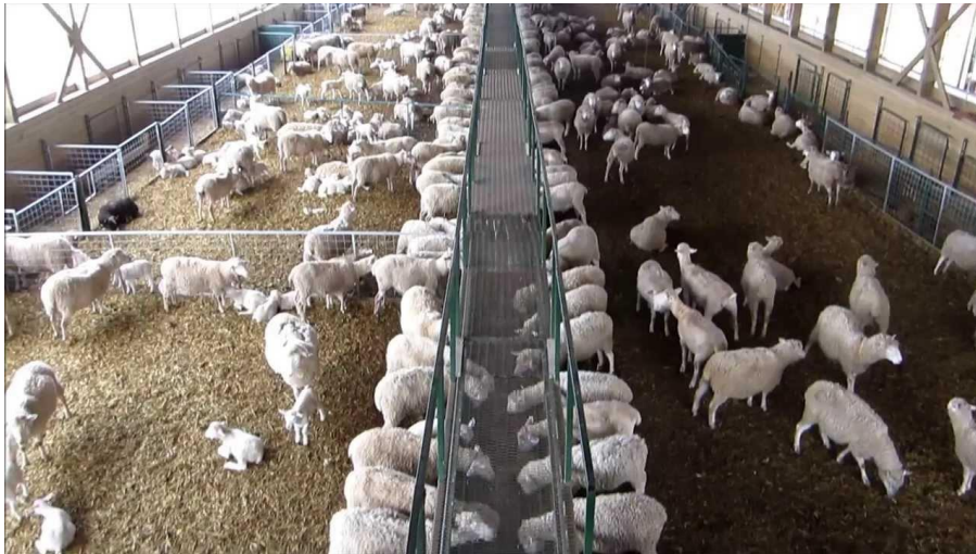
Slika 7. Intenzivan uzgoj ovaca

onim komercijalnim u vidu hranidbe, njege, zdravstvenoj zaštiti, uvjetima držanja i primjeni najnovijih znanja na području ovčarske proizvodnje. Ovaj sustav vrlo je kompleksan i zahtjevan u odnosu na ekstenzivan uzgoj, pogotovo ako se radi o čistim pasminama kojima je potrebna specijalni uzgoj, te vrlo mali broj uzgajivača uspijeva provesti ovaj sustav proizvodnje.