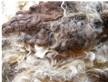
Slika 4. Kostrijet

Klase moraju imati više od 80% čistog vlakna i manje od 3% biljnih primjesa.