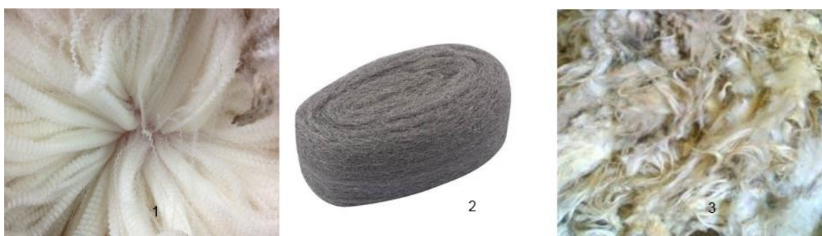
Slika 1. Fina vuna (1), Srednje fina vuna (2), Gruba vuna (3)

Mikronski rang vune se obično definira prema namjeni proizvoda. Vuna koja se koristi pri izradi odjeće je obično finija od vune korištene za unutarnji tekstil. Od 2008 vuna se više proizvodi zbog unutarnjeg tekstila nego vanjskog. ( http://www.iwto.org/wool-production , 23.8. 2017.)