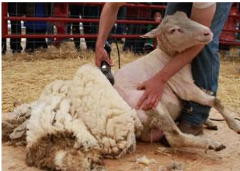
Slika 5. Šišanje ovce

Prvo razrađujemo plan šišanja gdje je potrebno razvrstati životinje po spolu, dobi i rasi, pripremiti životinje i odrediti načine šišanja. Zatim moramo odrediti vrijeme šišanja. Ovce i koze obično se šišaju jedanput godišnje u nekim zemljama i dva puta. Vuna šišana jedanput godišnje ima veću vrijednost na tržištu od one šišane dvaput. Šišanje se obično obavlja u ljetnim i proljetnim mjesecima, da se posao može što prije obaviti. Određivanje vremena šišanja bitno je i zbog proljetnog opadanja vune (linjanja), kako ne bi smo izgubili previše vune, što za posljedicu ima smanjene prinose. Uzročnik opadanja mogu biti i bolesti.