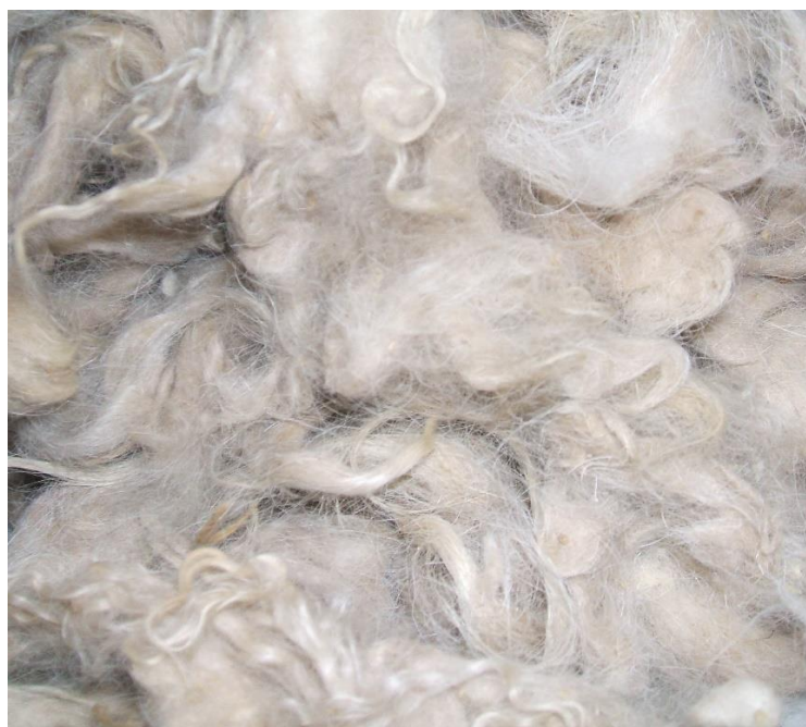
Slika 3. Kašmir vlakno

2. Kašmir vlakno – vlakno dobiveno od Kašmir pasmine koza, još se naziva Pashmina , čiji naziv potječe od sjeverno indijske regije Kašmir . Vlakno je izuzetno dobre kvalitete i namijenjeno je za izradu kvalitetnije i skuplje odjeće. Vlakno je fino i meko. Kao i kod Mohera najvažnije svojstvo jeste finoća. Za razliku od Mohera debljina vlakna je duplo manja, oko 13 – 16 mikrometara, a dužina nije veća od 6 cm, zbog toga je lošije od Mohera . Kašmir se pokazao kao bolji toplinski izolator u prosjeku tri puta više od ovčje vune.