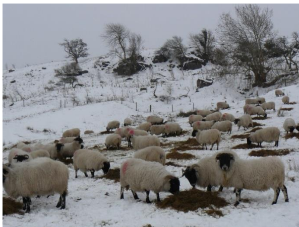
Slika 6. Ekstenzivan uzgoj ovaca

Ulaganja u proizvodnju su relativno niska, te se ovaj sustav svrstava u nomadsko ovčarstvo. Ekstenzivni sustavi danas nisu toliko zastupljeni kao nekad, međutim postoje države u čijim regijama se i danas uzgajaju na ovaj način. Neke od njih su: Francuska, Portugal, Rusija i Španjolska. Ovce se napasuju cijele godine, osim u vrijeme nepovoljnih vremenskih prilika.