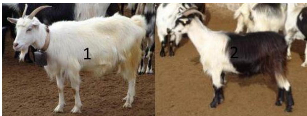
Slika 11. Hrvatske pasmine koza: 1. Hrvatska bijela koza, 2. Hrvatska šarena koza