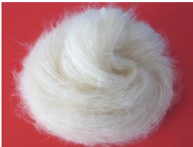
Slika 2. Moher

Angora koze se šišaju dva puta godišnje u proljeće i jesen, a neki proizvođači tvrde da se dvokratnim šišanjem povećava nastrig vune. Kao što je navedeno ranije, količina vune ovisi o dobi i spolu, pa tako jarci daju više vune od koza. Mioć i Pavić (2002) ustvrdili su da je u prosjeku 5,31 kg za jarce, a koze 3,29 kg, jarci su u dobi od 4 godine, a koze u dobi od 3 godine. Vlakna se nakon šišanja klasificiraju, peru i raščešljavaju, a time se odstranjuje masnoća vlakna.