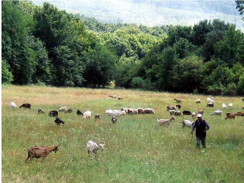
Slika 8. Ekstenzivan uzgoj koza