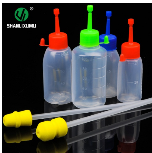
Slika 12. Bočica s kateterom za umjetno osjemenjivanje

Za proces umjetnog osjemenjivanja potrebna je bočica s razrijeđenim sjemenom i kateter za umjetno osjemenjivanje za jednokratnu ili višekratnu upotrebu. Kateter je cjevčica koja je napravljena od tvrde gume, dužine 45-55 cm, a na jednom kraju završava poput svrdla (kateter po Merloseu) ili olive (kateter po Šimuniću).