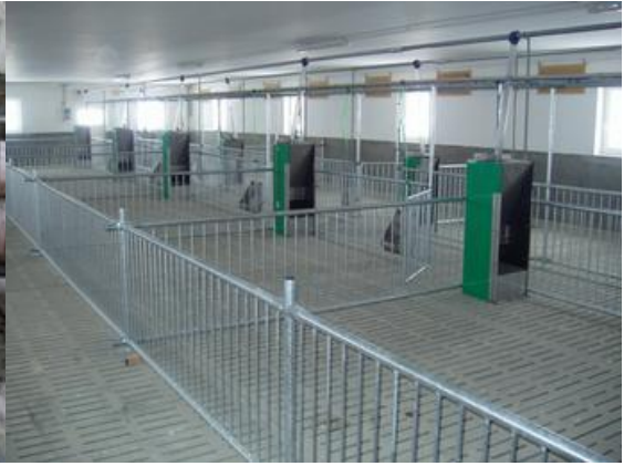
Slika 17. Čekalište

Izvor: ( https://www.butobu.rs/details/light/index.php?r=1950&usr=greengroup&naslov=Svinjogojstvo ) 02.07.2017.