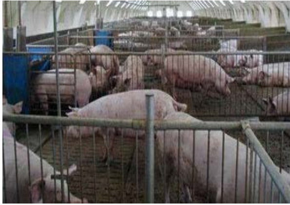
Slika 16. Čekalište