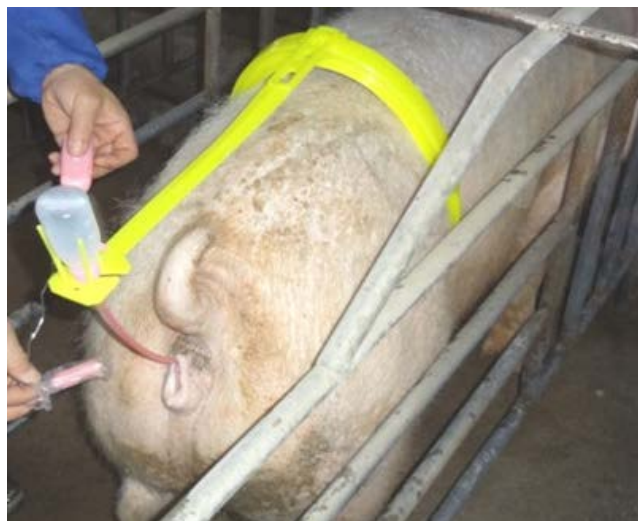
Slika 13. Umjetno osjemenjivanje

Izvor: ( https://www.alibaba.com/product-detail/Jiangs-Artificial-Insemination-Pigs-Framing_1725938662.html ) 18.06.2017.