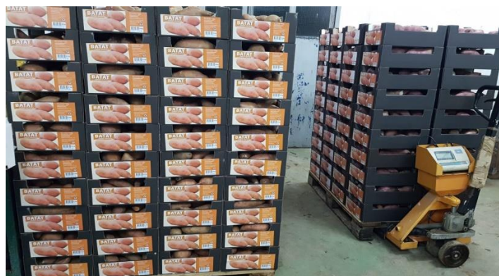
Slika 4. Skladištenje batata

Prinosi batat iznose od 3 do 5 kilograma po sadnici. Na dva hektara očekuje se oko 60 tona prinosa odnosno 240.000 kn, a za jedan hektar potrebno je 20.000 presadnica. Nakon 100 do 130 dana poslije sadnje obavlja se strojna berba batata. Nakon strojne berbe slijedi dorada i skladištenje.