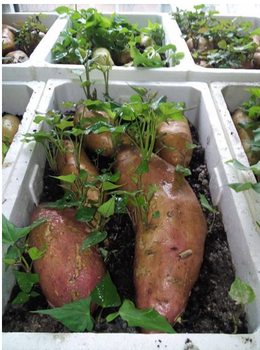
Slika 1. Presadnice u stiropornim kašetama