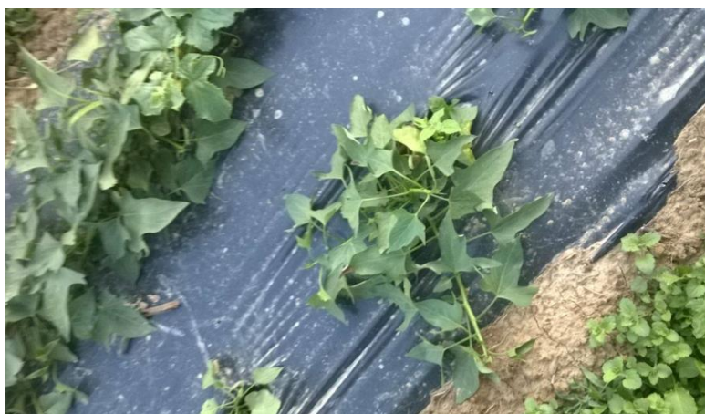
Slika 2. Presadnica na PE foliji

Sadnja na gospodarstvu obavlja se poslije opasnosti od prvih mrazeva, koriste se presadnice iz vlastite proizvodnje.