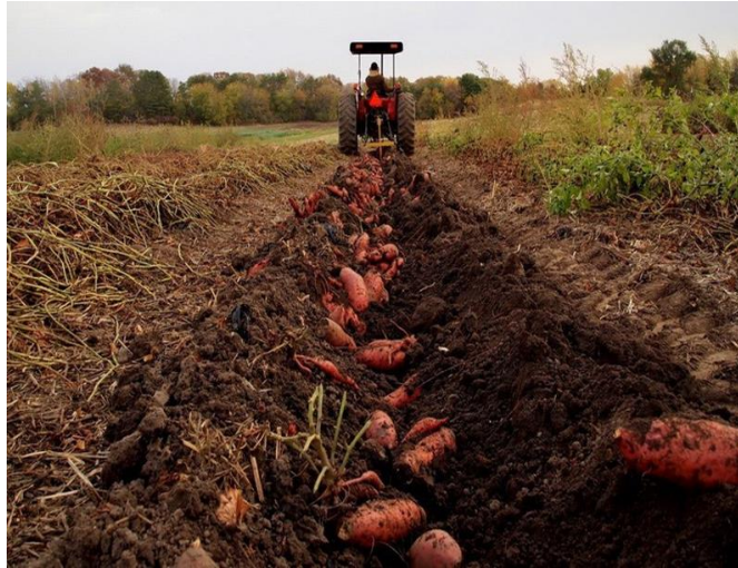
Slika 3. Vađenje batata

Batat dolazi u tehnološku zriobu 80 dana nakon sadnje, a provjerava se rezanjem vriježa, pri čemu se pojavljuje gusti bijeli sok. Korijen batata se može vaditi ručno ili strojno vadicom za krumpir. Razdoblje vađenja je od kolovoza do listopada i treba se obaviti prije mraza. Slijedeća slika prikazuje strojno vađenje batata vadicom za krumpir.