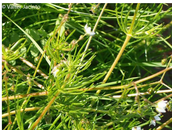
Slika 3. Poljska koljenika, Spergula arvensis L.