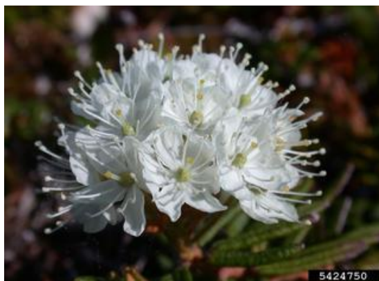
Slika 2. Divlji ružmarin, Ledum palustre L.