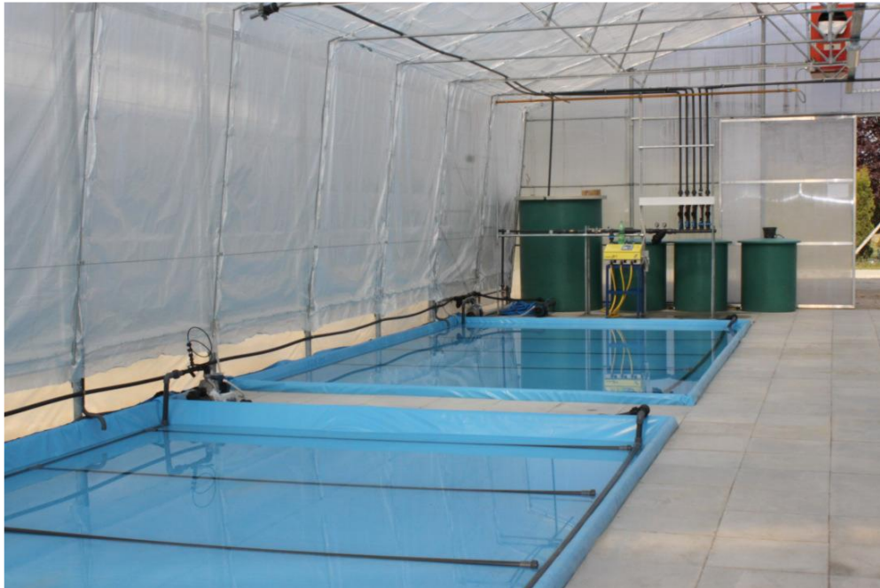
Slika 2. Bazen za hidroponski uzgoj

Nedostatak hidroponskog uzgoja je da za početak poslovanja potrebne velike količine ulaganja finansijskih sredstava prilikom nabave adekvatne opreme. Prikaz hidroponskog bazena na dolje navedenoj slici.