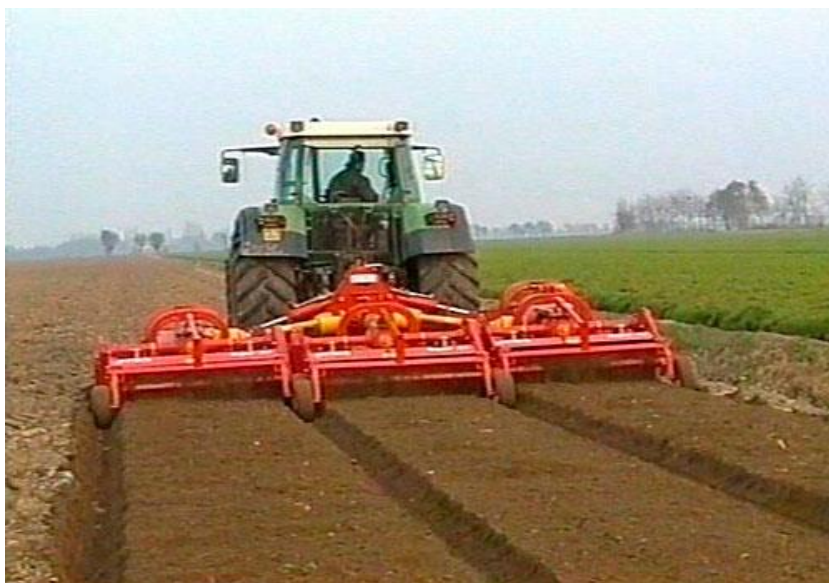
Slika 1. Priprema tla frezanjem