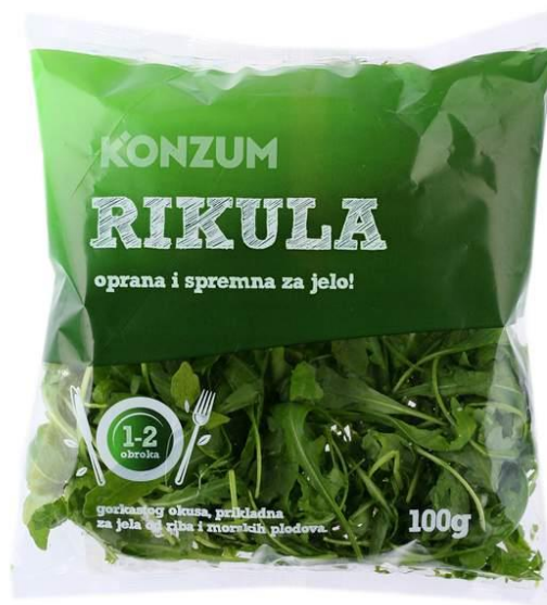
Slika 5. Pakirana rukola u trgovačkom lancu Konzum

Sljedeća slika prikazuje kako izgleda pakirana salata.