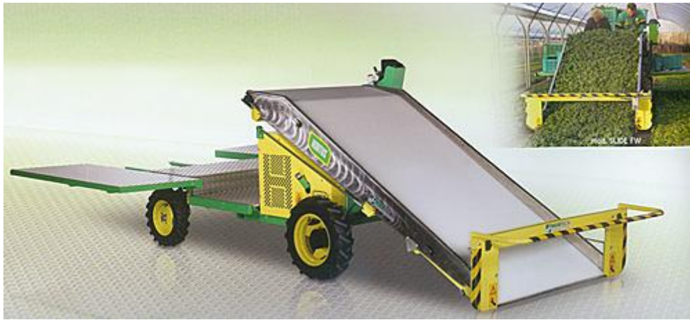
Slika 4. Stroj za branje rukole i matovilca

Na sljedećoj slici prikazan je stroj koji se koristi u berbi salate.