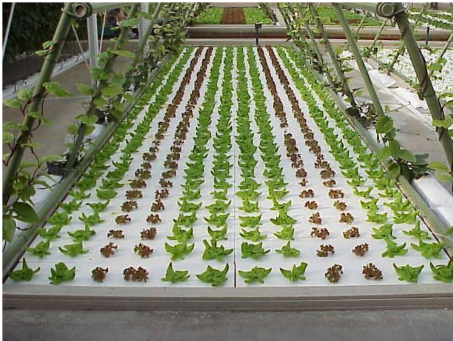
Slika 3. Prikaz hidroponskog uzgoja salate

Slijedi prikaz fotografije hidroponskog uzgoja salate.