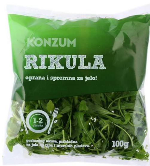
Slika 5. Pakirana rukola u trgovačkom lancu Konzum

Sljedeća slika prikazuje kako izgleda pakirana salata.