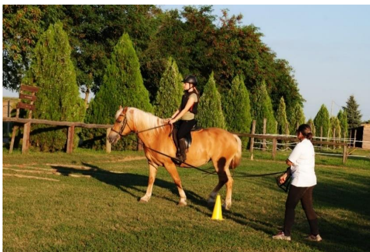
Slika 22. Lonžiranje konja i početnika

U razgovoru s vlasnicom konjičkog kluba „Eohippus“ saznao sam sve o tečajevima jahanja i osnovama rada s konjima. Tečaj jahanja traje 20 sati. Tijekom tog vremena polaznike se nauči osnovama jahanja. U osnove jahanja spada: pravilan položaj tijela, uravnoteženo držanje, prirodne komande, komande nogama, komande uzdama, premještanje težine, komande glasom, uzjahivanje, sjahivanje, zaustavljanje. Opuštenost je najvažniji aspekt pravilnog položaja, a to se odnosi na noge odnosno bedra i koljena.