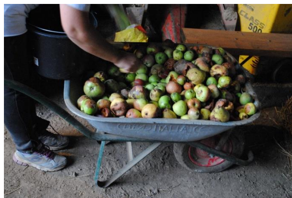
Slika 20. Jabuka za desert