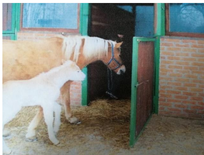
Slika 15. Haflingerska kobila sa ždrebetom