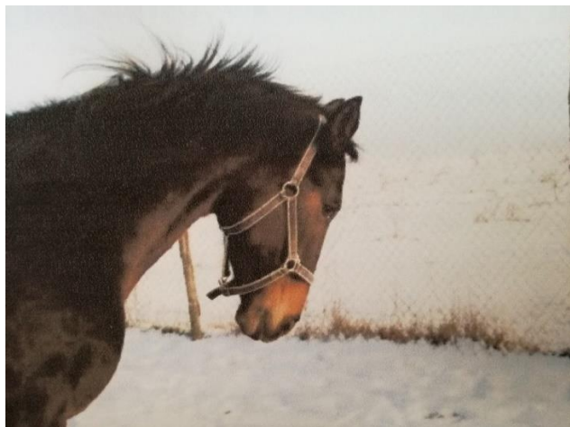
Slika 18. Hrvatski toplokrvnjak