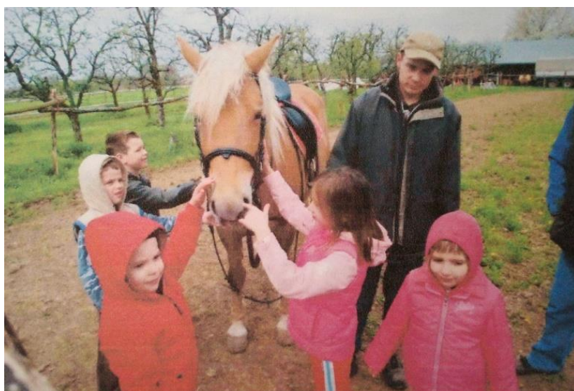
Slika 26. Dječja jahaonica

U dječjoj jahaonici sudjeluju djeca u dobi od 3 do 12 godina. Svako dijete provede na leđima konja 5 krugova u manježu te mogućnost osvajanja dodatnih krugova kroz različite igre, kao što je nabacivanje potkova na štap, skakanje u vreći, nošenje jaja u žlici i slično. Vrijeme čekanja termina jahanja djeca skraćuju različitim radionicama. Konji koji se koriste su haflingerke Lori i Lara, i one se koriste i u terenskom jahanju, što znači da su vrlo dobro utrenirane.