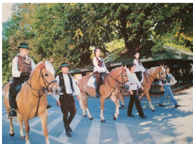
Slika 28. Dječje Vinkovačke jeseni u Vinkovcima