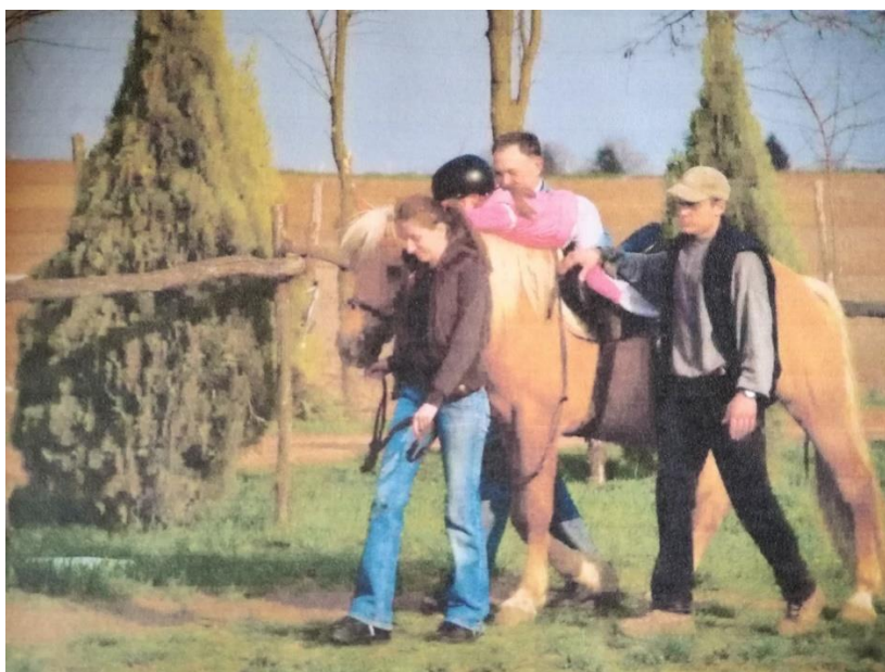
Slika 21. Terapijsko jahanje na konju haflinger

Terapijsko jahanje je pokazalo dokazanu metodu u pomaganju djeci s posebnim potrebama, fizičkim ili mentalnim poteškoćama, da razviju svoje vještine, kao i opće fizičko zdravlje. Razvijaju im se i gibaju mišići i poboljšava mentalno zdravlje. Konji su izrazito društvene životinje, pa su u tom pogledu vrlo slični ljudima. Imaju veliku sposobnost percepcije i održavanja osjećajući svaki signal našeg tijela. Hod konja ritmički i nježno pomiče tijelo jahača, od čega koristi mogu imati mnoge osobe s nekim fizičkim hendikepom. ( http://www.kk-eohippus.hr/ )