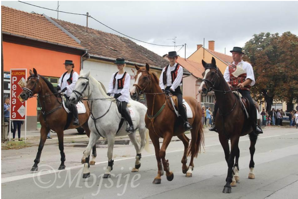
Slika 10. Vinkovačke jeseni - svečani mimohod (foto: Ante Lovrić, 2013.)