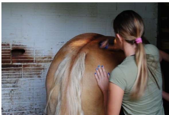
Slika 19. Timarenje konja prije treninga

U hranidbi konja se koriste voluminozna i koncentrirana krmiva, mineralne soli i vitamini. Od voluminoznih krmiva zimi se daje sijeno, a po ljeti se koristi paša koja ima najveću vrijednost, tj. konji su pušteni da slobodno pasu. Od koncentriranih krmiva koristi se ječam, zob, posije, sojina sačma i poslije se dodaje vitaminsko-mineralni premiks. Konjima je voda stalno dostupna, jer ako bi konja pojili samo dva puta dnevno, ožednio bi u jednom trenutku jer su stalno u pokretu, a ne bi imao vodu na raspolaganju. Kod održavanja također imamo njegu dlake, njegu grive i repa te njega kopita. Njega dlake je vrlo bitan čimbenik jer dok se konj timari, postiže se bolje odnos konja i osobe. Očistiti treba svaki dio konjskog tijela. Vrlo je bitno dobro očistiti mjesta na koje dolazi oprema kako ne bi nastali žuljevi ili rane. Također je važno kada se čisti konj, da se četka dovoljno pritisne. Ako je dovoljno toplo i ne puše vjetar, konja se može i okupati. Pribor koji se koristi za timarenje su: tvrda četka, mekana četka, metalna četka (češagija), četka za vodu, jež četka, krpa za brisanje, spužva, strugalica za znoj ili znojnica.