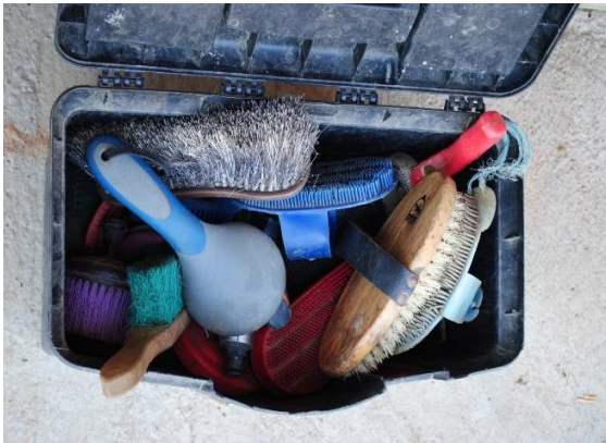
Slika 4. Četke za njegu konja

broj 0-10), kliješta sa zupcima koja služe za savijanje eksera. Konjima treba redovito čistiti boksove u kojima oni borave. Čisti se jednom dnevno, te ako je potrebno stavlja se nova slama. Za čišćenje boksa potrebno je imati kolica, vile, lopatu i metlu. Boks za konja treba biti po mogućnosti što veći, zbog njegovog kretanja.