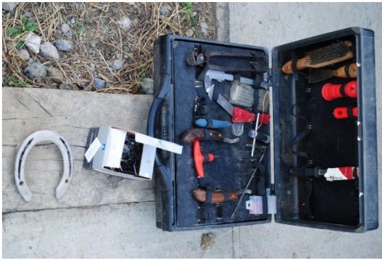
Slika 8. Pribor za potkivanje