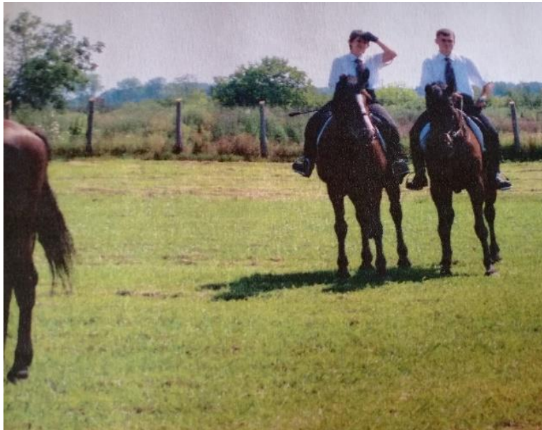
Slika 29. Listaj lipo stara – Tordinci, Manifestacija pored Vinkovaca