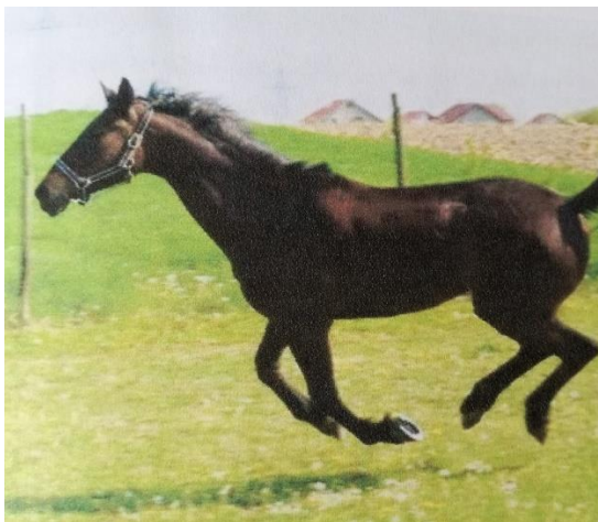
Slika 17. Hrvatski toplokrvnjak u galopu