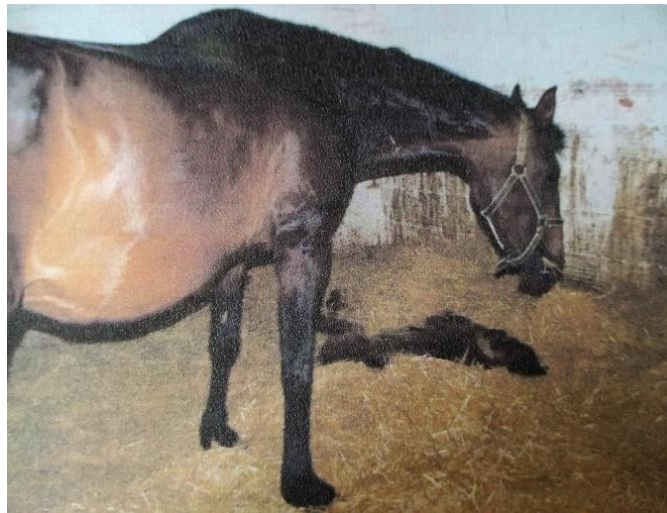
Slika 16. Hrvatska toplokrvna kobila sa ždrebetom

Najmlađi uzgojni tip, uzgaja se na području cijele Hrvatske, naročito u Slavoniji. Broj grla u Vukovarsko-srijemskoj županiji je 12, a broj vlasnika 10. Pripadaju tipu jahaćih konja, a koriste se i za turnirske jahačke sportove i rekreaciju. Glava im je plemenita, ravnog profila, vrat mišićav i dug, imaju izražen greben. Leđa su nešto kraća, a sapi dobro mišićave. Uglavnom je dorate boje, a u manjoj mjeri se može javiti i kao vranac, rjeđe kao siva, odnosno alat. Broj ovih konja je stalno u porastu i u Hrvatskoj ih ima oko 450 grla.