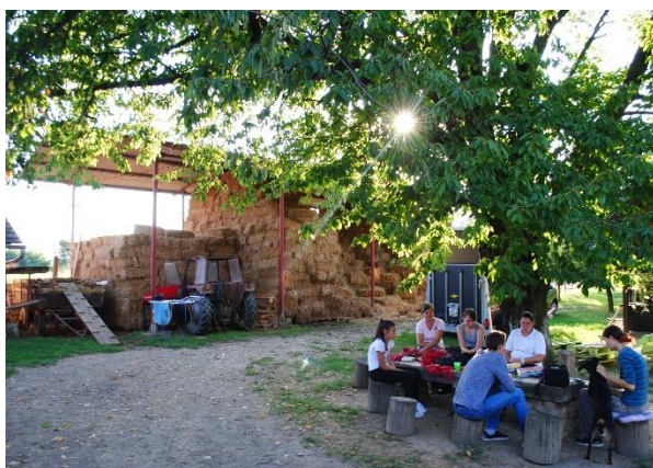
Slika 12. Odmor volontera

U razgovoru s vlasnikom konjičkog kluba „Eohippus“ klub je osnovan 19.06.2009. godine jer se pokazalo veliko zanimanje mladih pa i starijih osoba za konjički sport i konje. Trenutno u klubu ima oko 60 članova. Kako je svakodnevno rastao broj članova, bili su potrebni i novi konji. Ima 6 konja koji su posebno obučeni za rad s djecom. Glavna djelatnost kluba je općenito „tečaj jahanja“. Jahači tu uče o osnovama jahanja i konjogojstva. Nakon završenog tečaja jahanja, postoji mogućnost terenskog i sportskog jahanja te rekreacijskog jahanja. Nedjeljom u popodnevnim satima se održava „Dječja jahaonica“, gdje uče o osnovama rada s konjima. Zbog velikog broja djece s posebnim potrebama u Vukovarsko-srijemskoj županiji, od 01.04.2011. se počelo provoditi i terapijsko jahanje. Za te potrebe su nabavili rampu i dva konja haflingera.