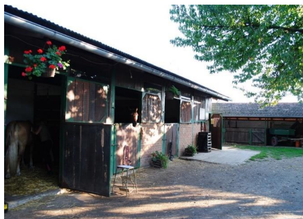
Slika 13. Vanjski boksovi za smještaj konja u Konjičkom klubu Eohippus