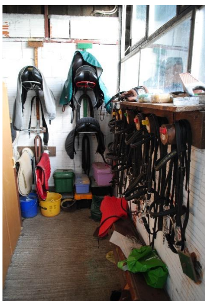
Slika 23. Oprema za jahanje