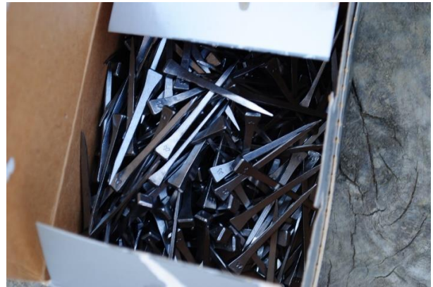
Slika 5. Čavli za potkovu