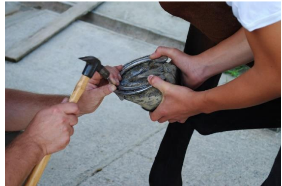
Slika 9. Pribijanje čavala na potkovu