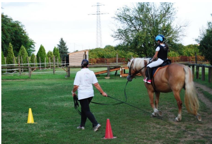
24. Obuka početnika u jahanju u KK „Eohippus“

Rekreativno jahanje slijedi nakon tečaja za jahače koji su postigli osnovne vještine. U Konjičkom klubu „Eohippus“ se obavlja dva do tri puta tjedno, ovisno o željama i potrebama pa i mogućnostima jahača. Obavlja se uvid o završenom tečaju jahanja. U rekreativno jahanje se uključuju djeca i odrasli. Provođi se u parkuru i uče osnove dresure. Voditelj jahanja cijeli sat trenira i korigira jahačeve greške.