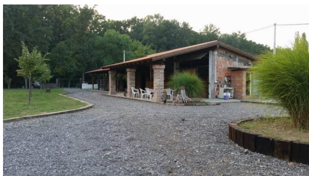
Slika 2. Prostori Konjičkog kluba Satir https://www.facebook.com