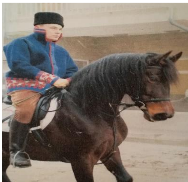
Slika 27. Pokladno jahanje u Vinkovcima

U ostale djelatnosti kojima se bavi KK „Eohippus“ su vožnja zaprega, posjete različitim manifestacijama kao što su: Vinkovačke jeseni, Listaj lipo stara (u Tordincima), pokladna jahanja u različitim mjestima i slične manifestacije. Različite aktivnosti Konjičkog kluba „Eohippus“ su prikazane na sljedećim fotografijama.