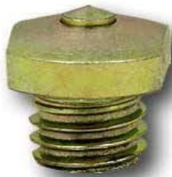
Slika 6. Štolne koje služe za manje sklizanje