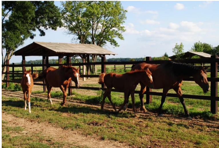
Slika 3. Kobile sa ždrebadi pasmine Trakehner

njemačke pasmine Trakehner. 17 grla su mlađe kategorije (ždrijebad, omice i omaci). Dva hrvatska posavca se koriste za terapijsko jahanje.