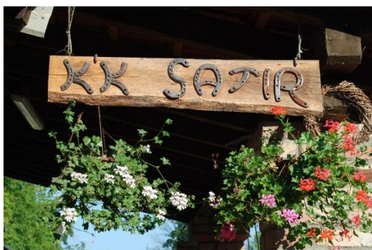
Slika 1. Reklamna ploča Konjičkog kluba Satir

Konjički klub „Satir“ je osnovan u ožujku 2003. godine na inicijativu više intuzijasta u želji razvijanja konjogojstva, konjičkog sporta, terapijskog jahanja te rekreacije i druženja ljubitelja konja. Budući da u našoj županiji (u odnosu na druge, prema postotku ukupnog broja stanovnika), nažalost, prednjačimo s brojem osoba s invaliditetom, želja je bila aktivno se posvetiti tom problemu. Iz toga je nastala ideja razvijanja i provođenja terapijskog jahanja osoba s posebnim potrebama.