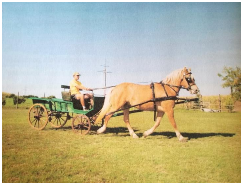
Slika 30. Trening u zaprežnim kolima