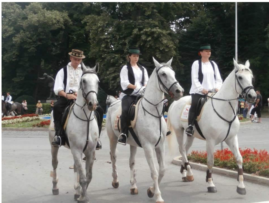
Slika 11. Đakovački vezovi 2013.