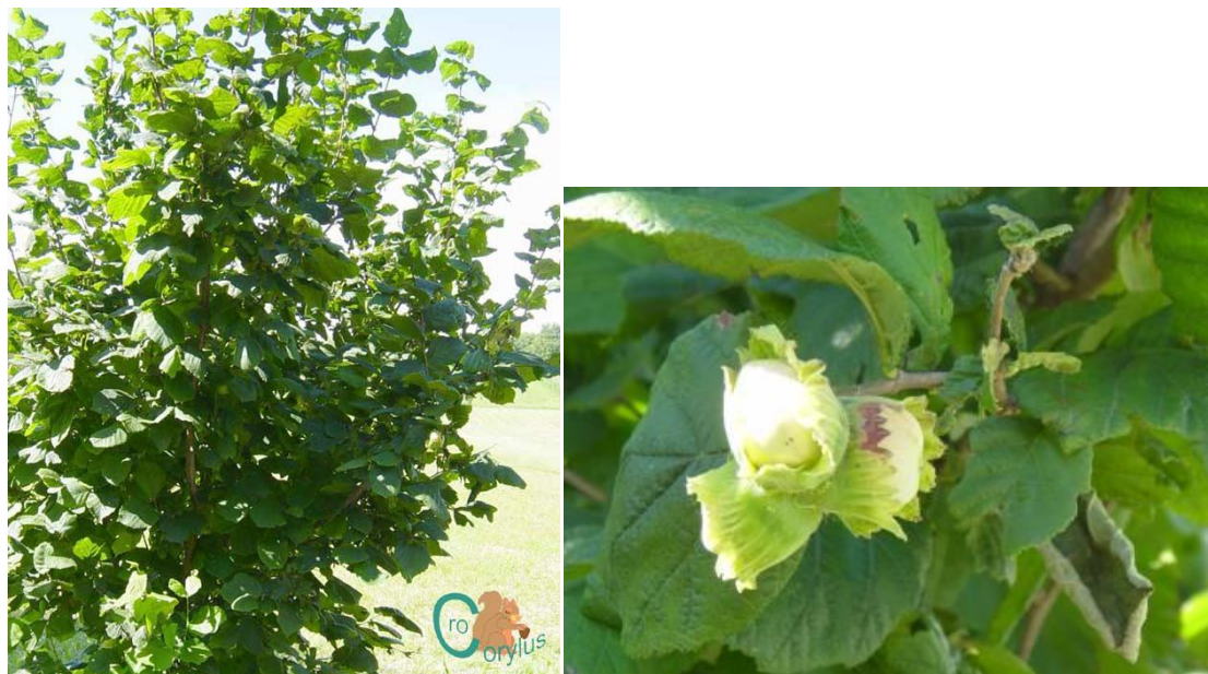
Slika 5.: Rimski lješnjak