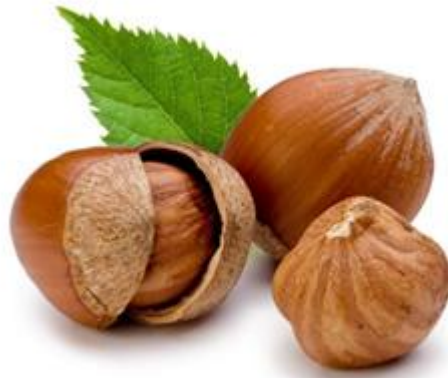
Slika 1.: Plod lijeske – lješnjak