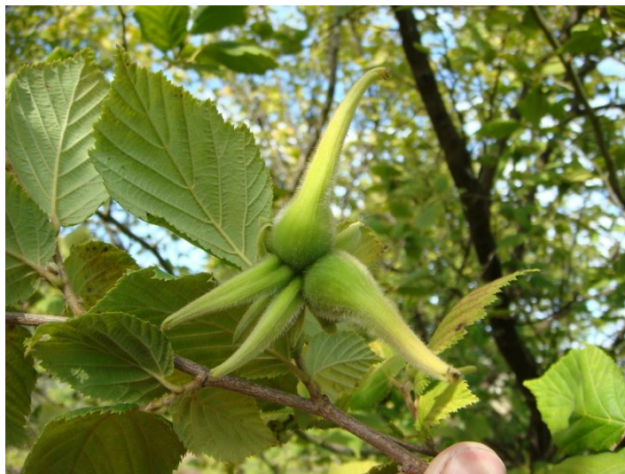
Slika 6.: Kljunasti lješnjak