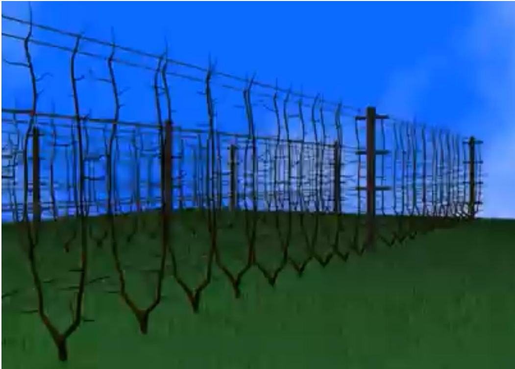
Slika 8.: Uzgojni oblik lijeske s krošnjom koja ima oblik uspravnog vretena na potpornju