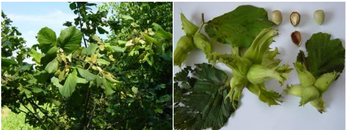
Slika 4.: Istarski dugi