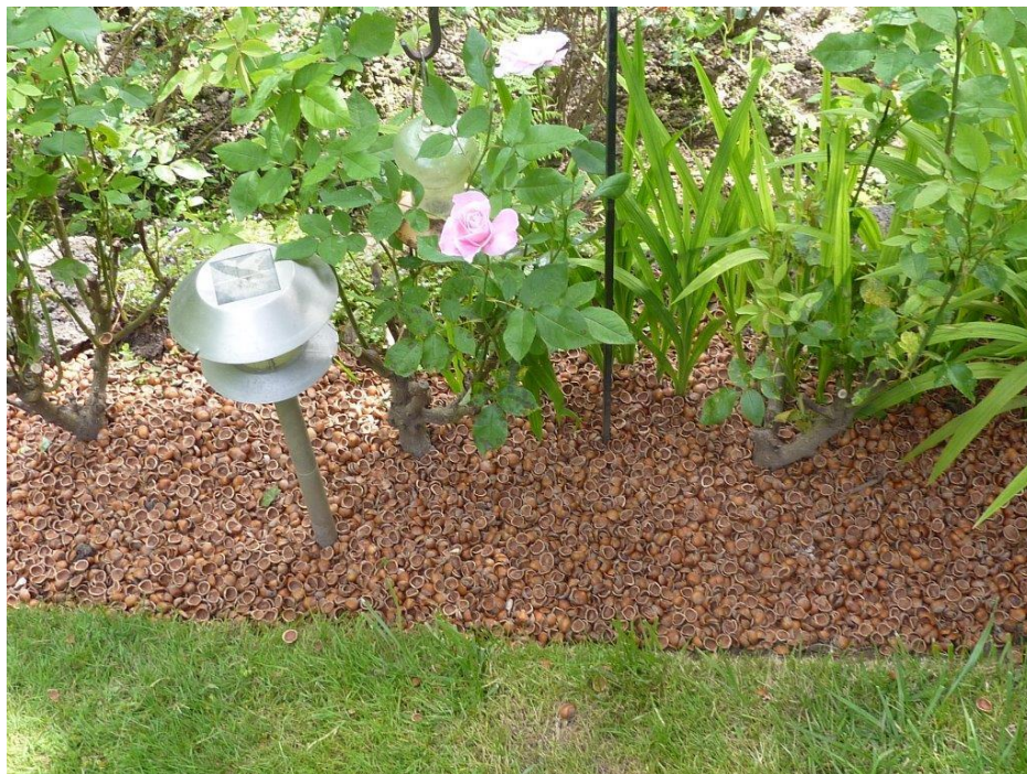
Slika 3.: Primjena ljuske lješnjaka