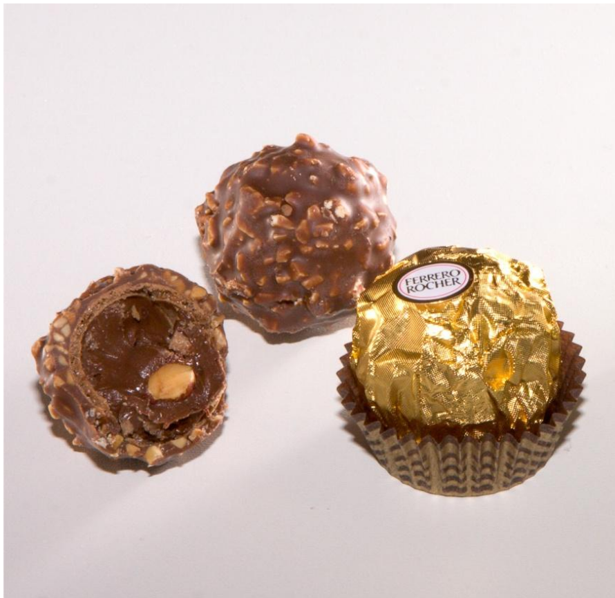
Slika 2.: Slastice od lješnjaka