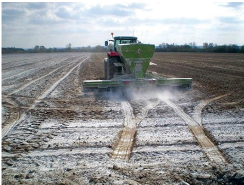
Slika 3. Kalcizacija

Analizom kemijskih značajki tala utvrđeno je da je reakcija tla jako kisela do kisela. U intenzivnoj ratarskoj i povrćarskoj proizvodnji u uvjetima navodnjavanja potrebno je održavati optimalnu reakciju tla, zbog raspoloživosti hraniva i mikrobiološke aktivnosti tla. Na ovim tlima potrebno je obaviti kalcizaciju s prosječnim dozama 10-15 t/ha \text{CaCO}_3 , ali obavezno je i izvršiti analizu tla za pojedine katastarske čestice kako bi se dobio pravi uvid u reakciju tla te odredila optimalna doza vapna za kalcizaciju. S obzirom na opskrbljenost tla hranivima istraživanom području utvrđena je siromašna opskrbljenost fosforom, dok je opskrbljenost kalijem jako velikog raspona. Na ovim površinama potrebno je provoditi pojačanu gnojdbu fosforom i kalijem, ali također na osnovu dodatnih kemijskih analiza tla za pojedine katastarske čestice do veličine 5 ha, a kod većih površina potrebno je uzeti uzorak na svakih 5 ha.