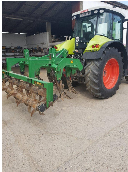
Slika 2. Podrivač za dubinsko rahljenje tla

Na osnovu rezultata terenskog i laboratorijskog istraživanja dubinsko rahljenje tla bi trebalo redovito provoditi na tlima kojima je nastanak zbijenog, slabije propusnog podoraničnog horizonta posljedica pedogenetskih procesa i učestale obrade na istu dubinu. Učestalost podrivanja ovisi o intenzitetu eluvijacije i trebao bi se na ovim tlima provoditi svakih 3-5 godina.