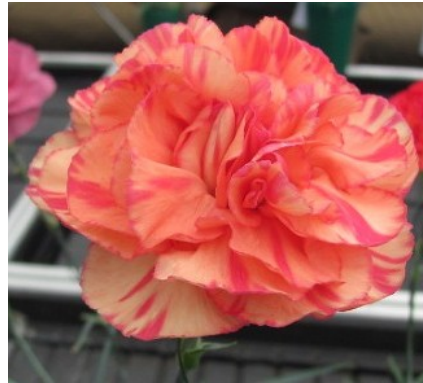
Slika 27. D. 'Sandra Neal'

https://c1.staticflickr.com/4/3766/9207617606_b4bc85a4ca_m.jpg