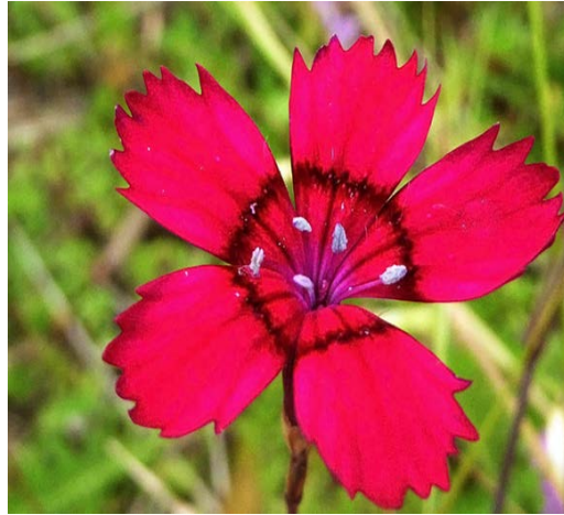
Slika 13. Dianthus deltoides

http://www.luontoportti.com/suomi/images/9408.jpg