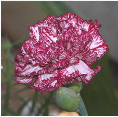
Slika 26. D. 'Forest Treasure'

https://c1.staticflickr.com/4/3766/9207617606_b4bc85a4ca_m.jpg