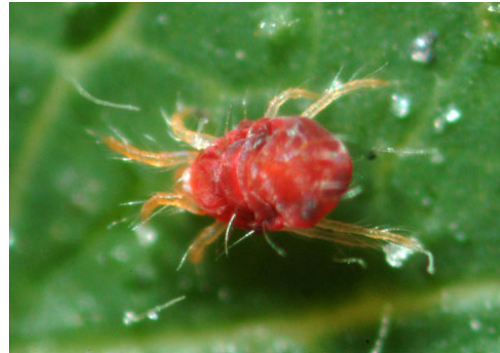
Slika 22. Tetranychus urticae

https://upload.wikimedia.org/wikipedia/commons/thumb/9/9f/Adult_deer_tick%28cropped%29.jpg/200px-Adult_deer_tick%28cropped%29.jpg