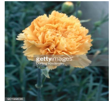
Slika 31. D. 'Valencia'

http://cvetopt.ru/data/23/43/101021153944.jpg