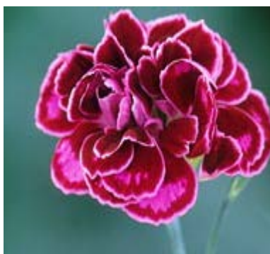
Slika 35. D. 'Laced Monarch'