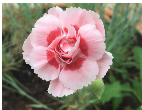
Slika 36. D. 'Doris'

http://dianthus.e-monsite.com/medias/images/laced-monarch.jpg