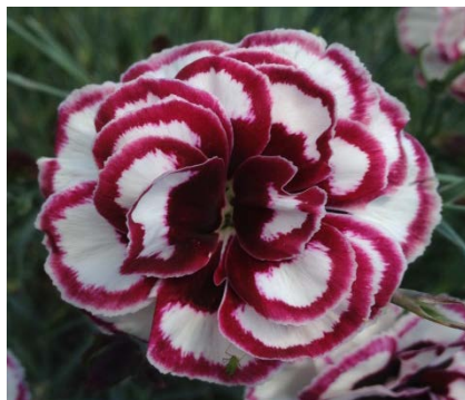
Slika 33. D. 'Dad's Favourite'

https://apps.rhs.org.uk/plants/electorimages/detail/RHS_WS_YD0013450_6982.J