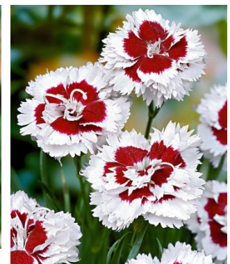
Slika 37. D. 'Alice'

https://a6adc47bb216dfe8a383-49bf67815854ec9e2c04a8f4abb9cbf5.ssl.cf3.rackcdn.com/images/products2/pl/00/00/07/81/pl0000078157_card_lg.jpg