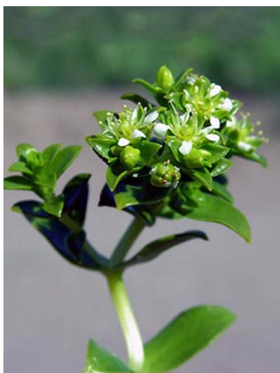
Slika 16. Honckenya peloides http://www.luontoportti.com/suomi/images/1535.jpg

promjenjivosti obale. Raste i na stijenama između kamenja, ali kraljevstvo su joj pješčane obale. Jedna je od najvažnijih biljaka na obali jer zadržava pijesak na mjestu. Njen razgranat korijen raste pod pijeskom i tako učvršćuje biljku u pijesak. Korijen proizvodi izdanke iz kojih rastu njihove grane. Ako je biljka zakopana u pijesak za vrijeme oluje iz njih mogu nastati i njihove grane. Stabilizira i gnoji tlo na kojem raste i tako pomaže zahtjevnijim obalnim biljkama. Ima dvospolne cvjetove, a nekad i jednospolne. Dvosplni funkcioniraju kao jednospolni jer nekad ne proizvodi pelud ili mu tučak nije u funkciji. Oprašuju ga insekti, a moguća je i anemohorija odnosno rasprostranjivanje vjetrom zbog jakog povjetarca na njihovom staništu, a učinkovito se širi korijenom (www.luontoportti.com).