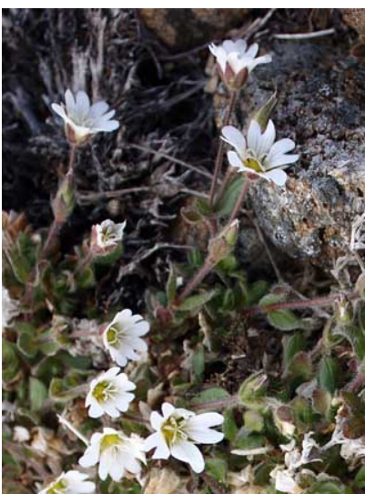
Slika 8. Cerastium nigrescens http://www.luontoportti.com/suomi/images/13940.jpg

Cerastium nigrescens (Slika 8. i 9.) raste na najsjevernijem čvrstom kopnu u Finskoj. Lako ga je odvojiti od drugih vrsta. Staništa su mu u vrlo hladnoj klimi. Raste na mokrim šljunčanim rubovima snježnih padina ili pored potoka nastalih otapanjem snijega. Biljke su često male i teško ih je zbog toga pronaći. Cvjetovi imaju 5 petala. Potoji i podvrsta Stelaria ( www.luontoportti.com ).