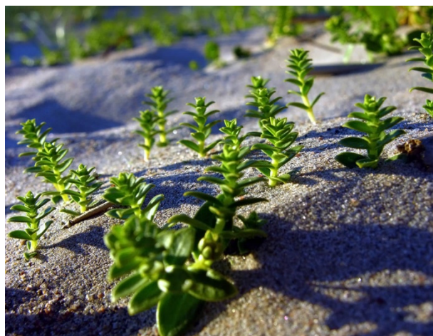
Slika 17. Honckenya peloides http://www.luontoportti.com/suomi/images/19850.jpg