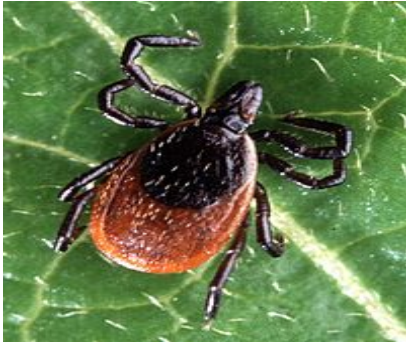
Slika 21. Acarina

https://upload.wikimedia.org/wikipedia/commons/thumb/9/9f/Adult_deer_tick%28cropped%29.jpg/200px-Adult_deer_tick%28cropped%29.jpg