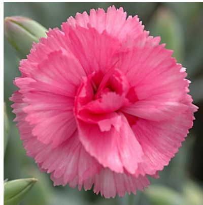
Slika 24. D. 'Lavender Clove'