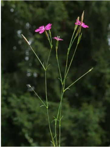
Slika 12. Dianthus deltoides