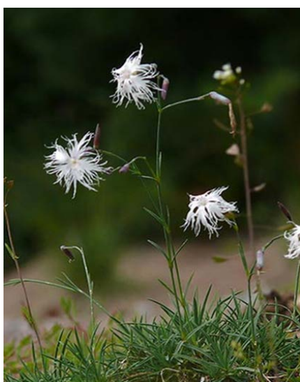
Slika 10. Dianthus arenarius

Dianthus arenarius (Slika 10. i 11.) ima predivne nijanse cvjetova koje su najjače u ljetu. Stanište posebno miriše ujutro i navečer. Vrsta vjerojatno privlači noćne leptire u vrijeme sumraka da ih opraše i također mogu biti prepoznatljivi po svojoj bijeloj boji. Promatranjem se može utvrditi da pripada istočnim podvrstama. Smatra se da se proširio u Finsku tijekom toplog perioda koji je uslijedio nakon ledenog doba i bio je rasprostranjeniji prije porasta šuma. Preferira gole riječne obale i granit. Danas je vrsta očuvana na pogodnim mjestima ali je jedna od finskih najrijeđih biljaka. Prijete joj okolišne promjene poput iskapnja šljunka. Biljka je iskoristila ljudsku aktivnost nastanjujući rubove cesta. Lijep je u vrtu, ali ga ne treba iskopavati/čupati u divljini nego kupiti sjeme ( www.luontoportti.com ).