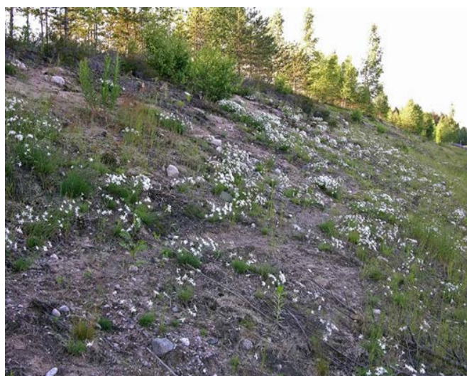
Slika 11. Dianthus arenarius http://www.luontoportti.com/suomi/images/5031.jpg

Dianthus deltoides (Slika 12. i 13.) je najcrveniji finški cvijet, a ponekad se u grupi mogu pronaći rozi i bijeli cvjetovi. Oprašuju ih dnevni leptiri a struktura cvijeta je prilagođena njihovom oprašivanju. Privlačni su ljudima pa u narodu postoji puno naziva za njih. Najbolje uspijevaju na suhim livadama s malim količinama dušika i niskom vegetacijom. Način rasta i duboko korijenje pomaže rastu na suhim mjestima i ima voštano lišće koje mu također pomaže kod suhoće. Na bogatijim područjima raste uz kamenje gdje uspijeva bolje nego neke veće vrste. Brzo se prorjeđuje kada mu stanište postane prenapučeno. Može rasti i u vrtu ( http://www.luontoportti.com/suomi/en/kukkakasvit/maiden-pink ).