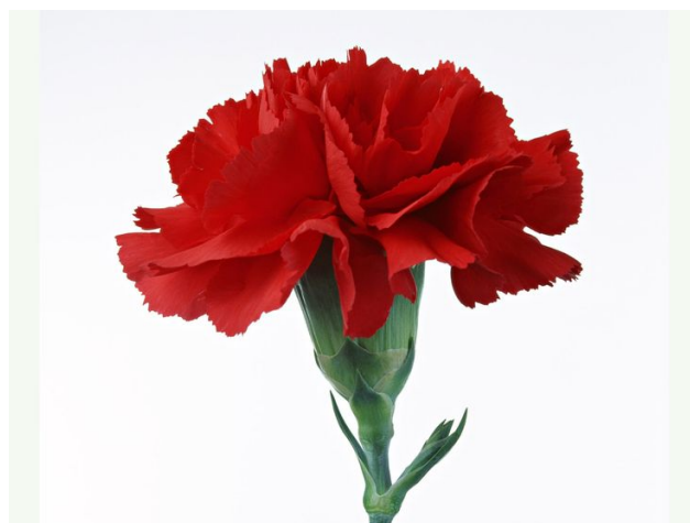
Slika 3. Cvijet karanfila ( Dianthus caryophyllus L.)