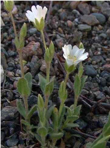
Slika 6. Cerastium alpinum http://www.luontoportti.com/suomi/images/10337.jpg

i raste uglavnom na nižem pojasu tundre. Također može biti pronađen daleko od padina najjužnije u centralnoj Finskoj. Na glavnom staništu na sjeveru biljke su skoro bez iznimke malog lišća te rastu samo na visoko alkalnom magnezijском silikatu ( www.luontoportti.com ).