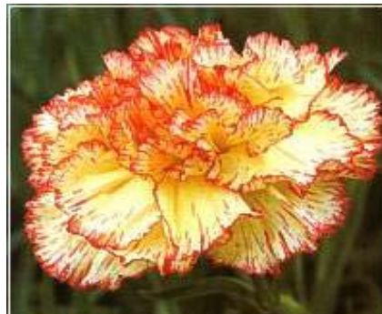
Slika 30. D. 'Clara'

http://3.bp.blogspot.com/-X9Wwrrw0WHE8/UazTTwX44oI/AAAAAAAAOwQ/kUQb1dj5SRM/s640/Passion+dianthus.JPG