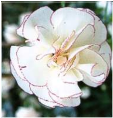
Slika 23. D. 'Eva Humphries'

http://cvetopt.ru/data/23/43/101021154645_sm.jpg