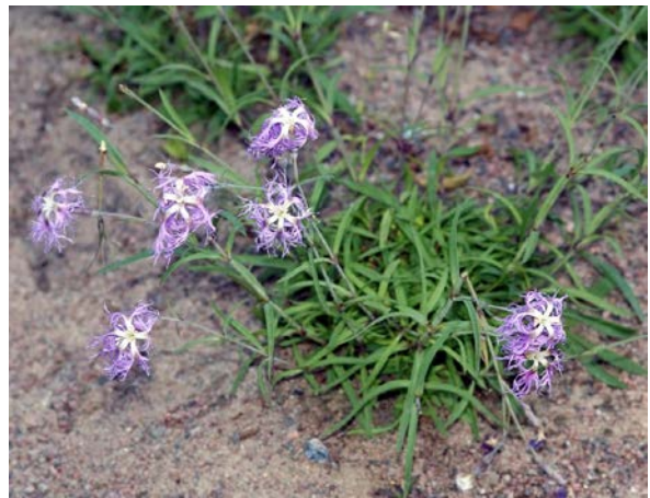
Slika 15. Dianthus superbus

http://www.luontoportti.com/suomi/images/25082.jpg