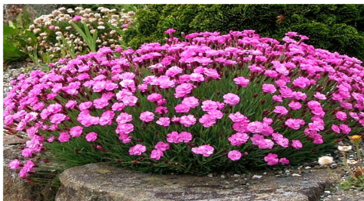
Slika 38. D. 'Pink Jewel'

http://users.actrix.co.nz/hokpines/diapijew.jpg