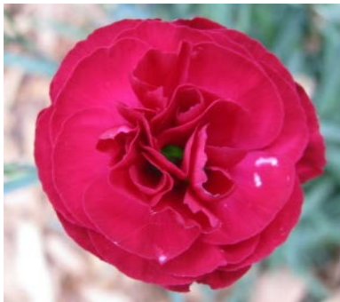
Slika 29. D. 'Nina'