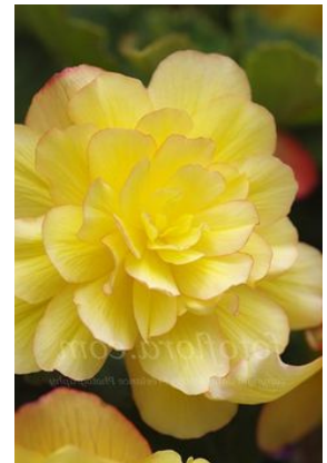
Slika 25. D. 'Aldridge Yellow'