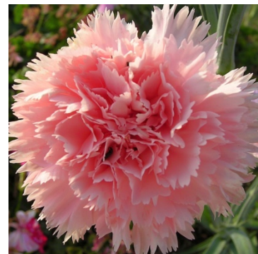
Slika 34. D. 'Emile Pare'

http://d13z1xw8270sfc.cloudfront.net/origin/147310/1447038818573_img_4180.jpg