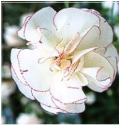
Slika 23. D. 'Eva Humphries'

http://cvetopt.ru/data/23/43/101021154645_sm.jpg