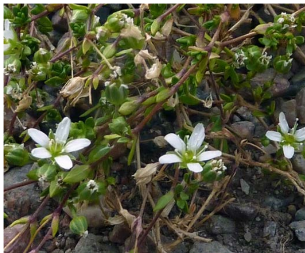
Slika 5. Arenaria norvegica http://www.luontoportti.com/suomi/images/17176.jpg

Cerastium alpinum (Slika 6. i 7.) raste u Kaavi i to je ugrožena vrsta kao i vrste u centralnom Laplandu. U Finskoj postoje tri podvrste: : ssp. alpinum , ssp. lanatum i ssp. glabratum . Jedna od druge se razlikuju u količini pokrova i njegovom rasporedu. Kroz vrijeme su bili označeni kao zasebne vrste, ali više nisu. Najčešće se podvrste pojavljuju zajedno ali međuoblici su učestali i linije podvrsta se određuju prema arbitraži (zaključku).