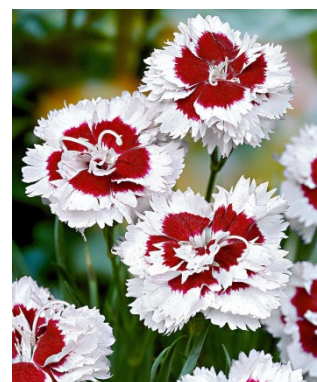
Slika 37. D. 'Alice'

https://a6adc47bb216dfe8a383-49bf67815854ec9e2c04a8f4abb9cbf5.ssl.cf3.rackcdn.com/images/products2/pl/00/00/07/81/pl0000078157_card_lg.jpg