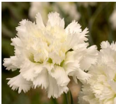
Slika 32. D. 'Mrs Sinkins'

https://apps.rhs.org.uk/plants/electorimages/detail/RHS_WS_YD0013450_6982.J