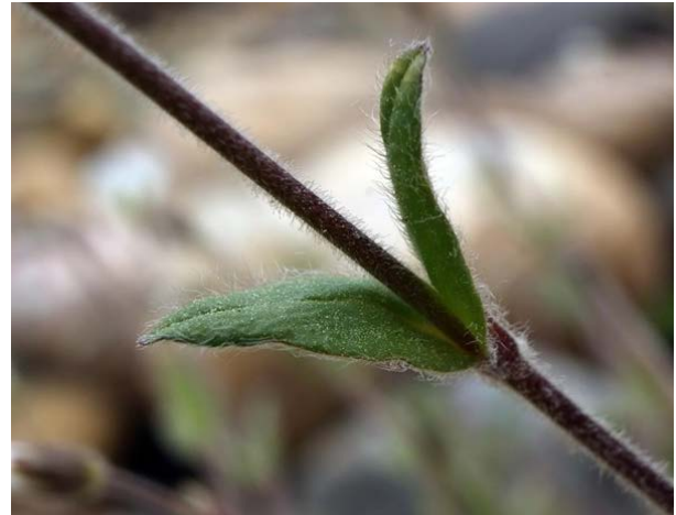
Slika 7. Cerastium alpinum http://www.luontoportti.com/suomi/images/10372.jpg

Cerastium nigrescens (Slika 8. i 9.) raste na najsjevernijem čvrstom kopnu u Finskoj. Lako ga je odvojiti od drugih vrsta. Staništa su mu u vrlo hladnoj klimi. Raste na mokrim šljunčanim rubovima snježnih padina ili pored potoka nastalih otapanjem snijega. Biljke su često male i teško ih je zbog toga pronaći. Cvjetovi imaju 5 petala. Potoji i podvrsta Stelaria ( www.luontoportti.com ).