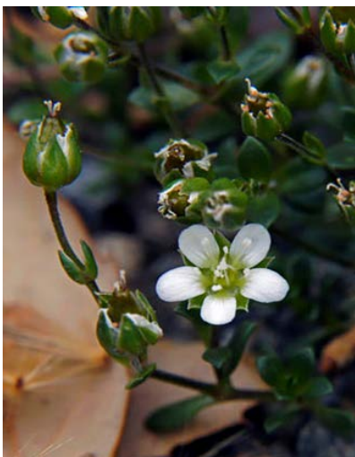
Slika 4. Arenaria norvegica http://www.luontoportti.com/suomi/images/17168.jpg

Arenaria norvegica : Mnoge male članove roza obitelji je teško identificirati, a Artički Sandword kako još nazivaju Arenariu norvegicu (Slika 4. i 5.) izgleda poput svojih bližih rođaka kao što je zaštićeni resast Sandword. Iako njegovo lišće nije mesnato i njegove peteljke su duže od srodnika. Obje vrste su vrlo rijetke. Artički raste uglavnom u tundri Saana i Malla na visini od 800m, dok resast raste duboko u šumskom pojasu na stjenovitim kanjonima Kuusamo i Salla ( www.luontoportti.com ).