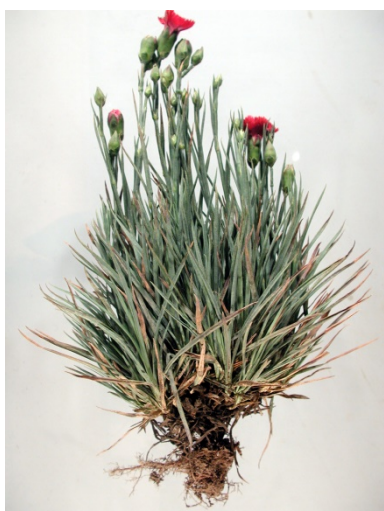
Slika 2. Korijen i list karanfila ( https://pnwhandbooks.org/sites/pnw-handbooks/files/plant/images/carnation-dianthus-caryophyllus-fusarium-wilt/dianthusfusariumcrownrot14-1402.jpg )

Cvjetovi se nalaze na cvjetnoj stapci i dvospolni su, često su mirisavi. Svaki cvijet karanfila je građen od kratke cjevaste baze i od obično 5 lapova, u obliku jednostavnog ocvjeća. Kultivari dvostrukih cvjetova imaju više od 60 latica. Latice su široke i nazubljenih rubova (Pejić, 2016.).