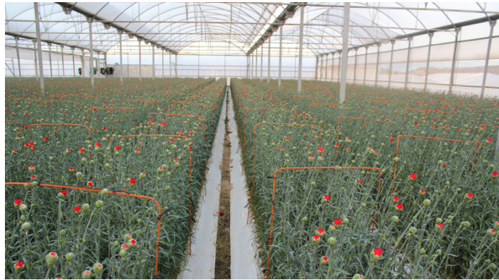
Slika 18. Proizvodnja karanfila u zaštićenom prostoru http://www.canaraflor.com/en/index_en.php?sec=produccion