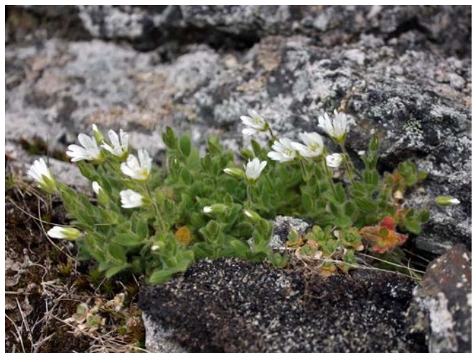
Slika 9. Cerastium nigrescens http://www.luontoportti.com/suomi/images/13959.jpg