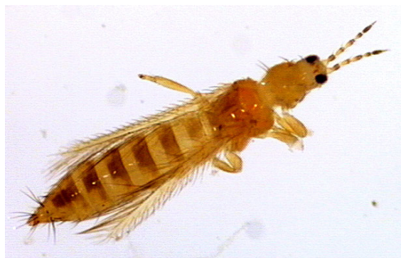
Slika 20. Frankliniella occidentalis

http://www.zrinjevac.hr/UserDocsImages/korisni%20savjeti/Vesna%20savjetuje/lisna-us.jpg