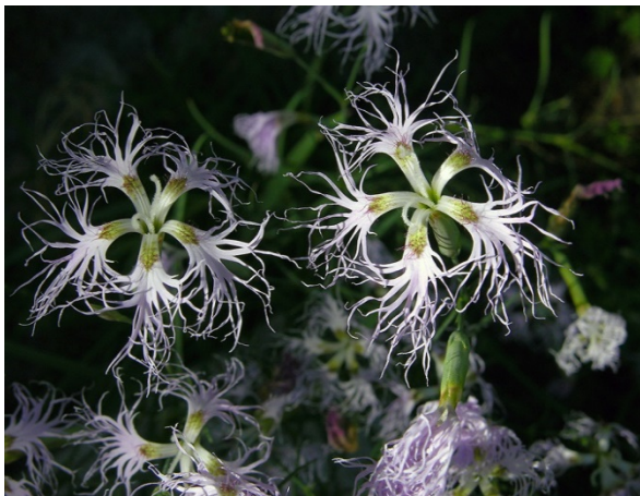
Slika 14. Dianthus superbus

Dianthus superbus (Slika 14. i 15.) je zaštićen južno od provincije Oulu. Njegov naziv bi u prijevodu značio božji cvijet, a ljepota cvjetova je privržena božici Afroditi. Miris mu je najjači noću kako bi privukao oprašivače. Nastanjuje pješčane obale, kalcifirane stijene, livade i bjelogorične šume, a također se uzgaja i u vrtovima kao ukrasna biljka ( www.luontoportti.com ).