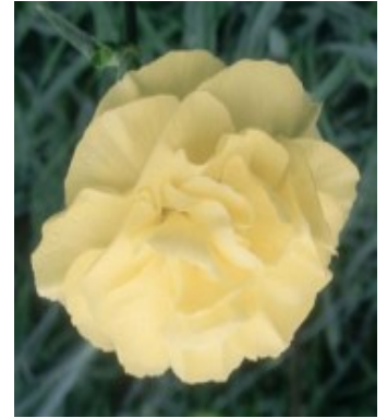
Slika 28. D. 'Golden Cross'

http://www.britishnationalcarnationsociety.co.uk/communities/0/004/009/251/990/images/4575722887_327x294.jpg