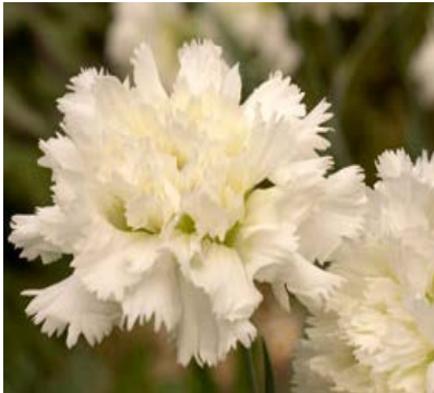
Slika 32. D. 'Mrs Sinkins'

https://apps.rhs.org.uk/plants/electorimages/detail/RHS_WS_YD0013450_6982.J