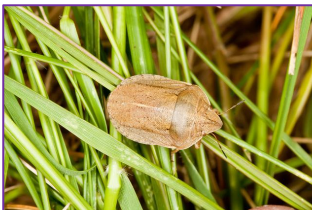
Slika 18. Austrijska stjenica ( Eurygaster austriaca Schrank)

Žitne stjenice koje možemo naći na usjevu: Eurygaster austriaca Schrank (Slika 18.), E. maura L., E. integriceps Put., Aelia acuminata L. (Slika 19.), A. rostrata Boh. Austrijska stjenica ( E. austriaca Schrank) je žutosmeđe boje, spljoštena tijela. Usni ustroj je za bodenje i sisanje (rilo). Sisanjem sokova prčinjavaju svijetložute mrlje i crne točke koje predstavljaju nekrozu tkiva. Na gornjoj strani prsišta ima štitić (scutellum). Ličinke su slične odraslama, pošto imaju nepotpunu preobrazbu. Ženke odlažu jaja s donje strane lista. Neke vrste žitnih stjenica izlučuju u biljke svoje fermente, od čega brašno postane gorko i neupotrebljivo. Imaju i žitne stjenice prirodne neprijatelje, pa se insekticidi primjenjuju samo kad je to opravdano. Uglavnom imaju jednu generaciju godišnje.