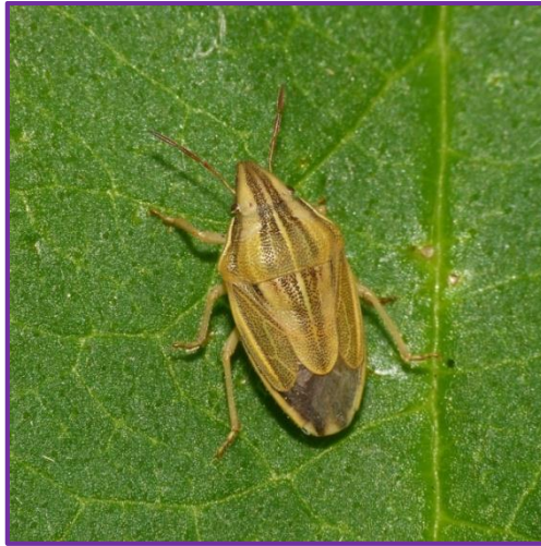
Slika 19. Žitna oštroglava stjenica ( Aelia acuminata L.)