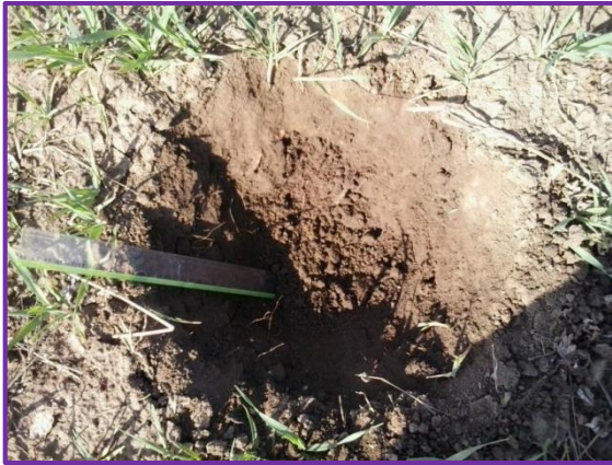
Slika 23. Iskopana jama