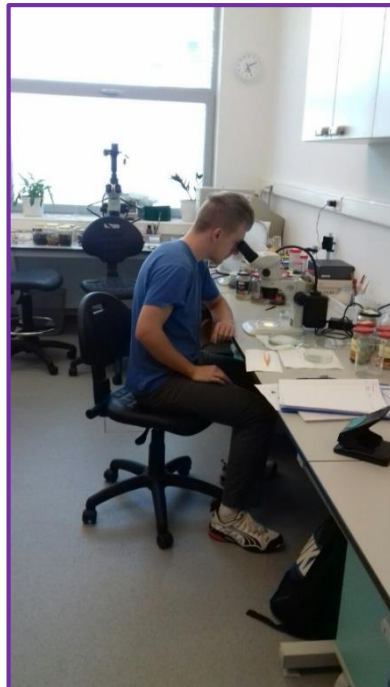
Slika 31. Determinacija i prebrojavanje jedinki

Determinacija i prebrojavanje jedinki (Slika 31.) su obavljani u laboratoriju za entomologiju Katedre za entomologiju i nematologiju Zavoda za zaštitu bilja Poljoprivrednog fakulteta u Osijeku. Korišteni su različiti determinacijski ključevi.