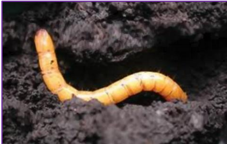
Slika 2. Ličinka Agriotes lineatus L.