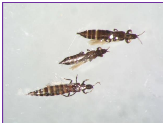
Slika 36. Thysanoptera sp. 1