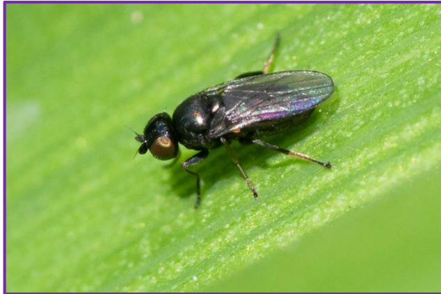
Slika 11. Imago švedske mušice