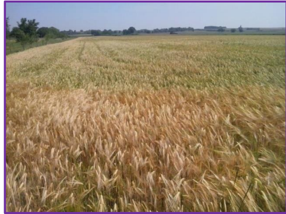
Slika 30. Parcela s ječmom prilikom ulova kukaca u lipnju