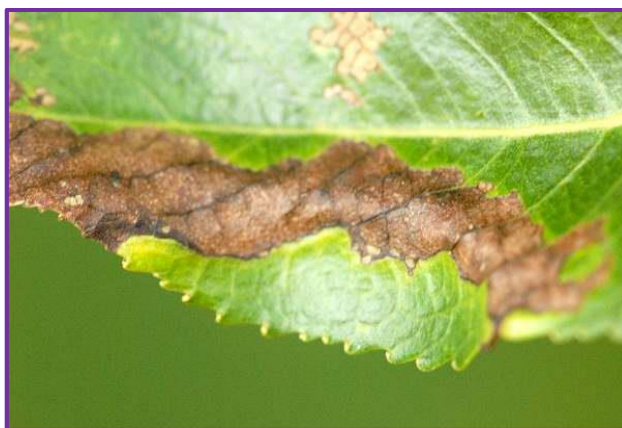
Slika 17. Simptom napada listnog minera