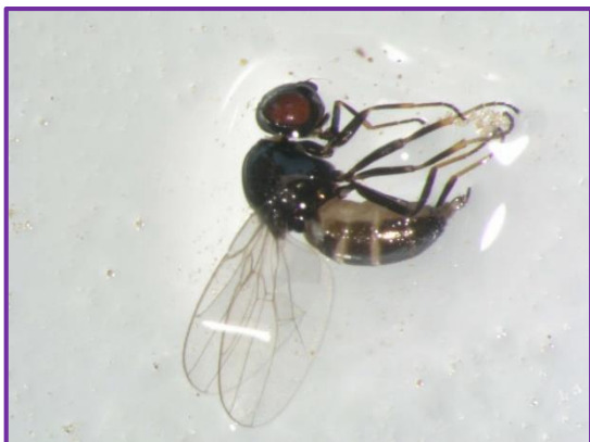
Slika 35. Diptera sp.

Druga vrsta resičara, morfološki najviše nalikuje vrsti Limothrips cerealium Hal. Ličinke i odrasli mogu pričinjavati štete sišući biljne sokove na zrnju žitarica ispod pljevica.