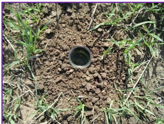
Slika 27. Lovna posuda