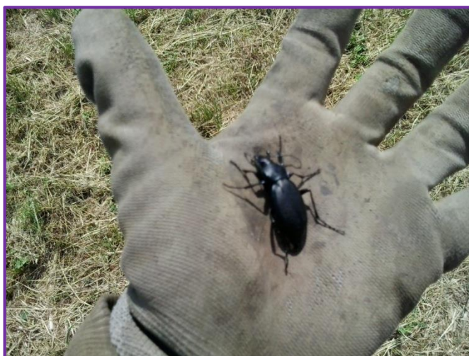
Slika 32. Kornjaš iz porodice Carabidae

Iz tablice 1 je vidljivo, da je metodom lovnih posuda ulovljeno 14 ličinki i 60 odraslih oblika (imaga) kukaca, te 2 stonoge, 36 pauka, 1 puž i 1 glodavac. Najviše je kukaca ulovljeno iz reda kornjaša (Coleoptera), od kojih su najviše zastupljeni pripadnici porodice Carabidae (Slika 32.), koji su korisni kukci. Iako je broj ulovljenih kukaca relativno velik, nijedne štetne vrste nema u većem broju, tako da nisu mnogo utjecali na prinos ječma.