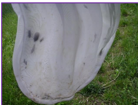
Slika 28. Kukci u entomološkoj mreži

Kukci nadzemnog dijela biljke lovljeni su pomoću entomološke mreže (Slika 28.). Vršilo se deset zamaha entomološkom mrežom na deset različitih mjesta na parceli. Uhvaćeni kukci stavljeni su u posudu s alkoholom. Posuda s alkoholom označena je s datumom pregleda i načinom ulova kukaca. Entomološka mreža je korištena u dva navrata, jednom u svibnju (06.05.) i jednom u lipnju (03.06.) (Slika 30.).