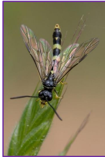
Slika 22. Imago pšenične ose vlatarice

Suzbijanje kemijskim putem je otežano, zbog toga što je ličinka skrivena unutar stabljike. Dobri rezultati dolaze primjenom agrotehničkih mjera (zaoravanje stništa).