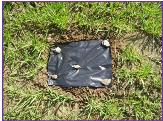
Slika 26. Zatrpana jama prekrivena folijom