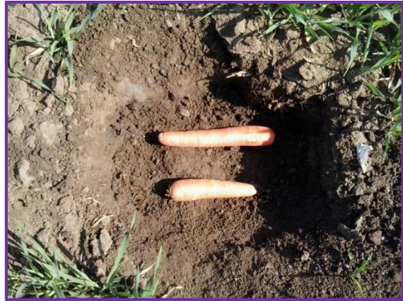
Slika 24. Jama s mrkvom