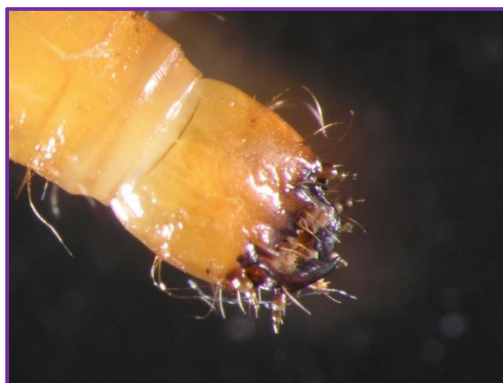
Slika 34. Usni ustroj žičnjaka

U tablici 3 su prikazani podaci o ulovu kukaca pomoću entomološke mreže. Ovom metodom je ulovljen najveći broj kukaca, što je i bilo očekivano. Ulovljeno je 38 ličinki i 215 odraslih oblika kukaca, 17 puževa i 5 pauka.