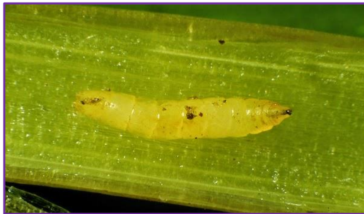
Slika 12. Ličinka švedske mušice