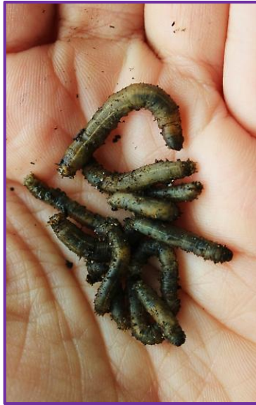
Slika 10. Ličinka livadnog komara