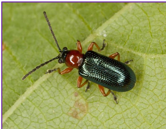
Slika 7. Imago žitnog balca

Iz porodice zlatica značajan štetnik je žitni balac ( Oulema melanopus L.). Imago (Slika 7.) je kornjaš plavkaste boje, crne glave i narančastog nadvratnjaka i nogu. Dug je 4-6 mm. Ličinka (Slika 8.) je žute boje i prekrivena sluzi. Štetne su i ličinke i imaga. Imago se hrani na listu progrizajući dijelove lista u vidu pruga. Ličinke se hrane samo epidermom lista, praveći bijele izdužene pruge. Imago prezimi u tlu i pojavljuje se u proljeće slijedeće godine. Ženka odlaže jaja na list kako bi tek izlegle ličinke bile blizu hrane i odmah počele s ishranom. Žitni balac može biti prisutan na cijeloj površini ili može napasti određena mjesta na oranici. Preventivna zaštita se sastoji od duboke jesenje obrade. Kod jačeg napada, koriste se insekticidi. Još se može koristiti parazitna osica Anaphes flavipes Forster kao prirodni neprijatelj žitnog balca.