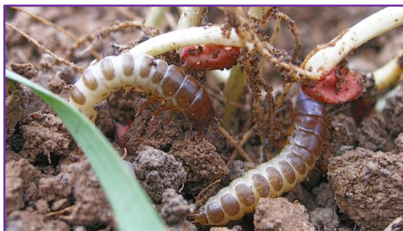
Slika 6. Ličinka žitarca crnog