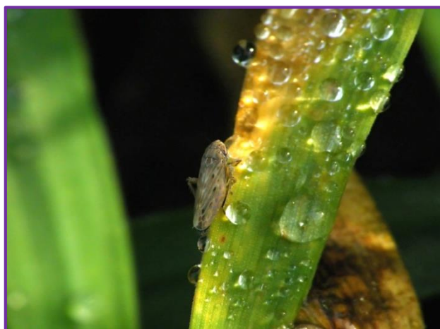
Slika 20. Žitni cvrčak

Tri vrste su štetnih cvrčaka najčešće: Deltocephalus striatus L., Cicadella sexnotata Fall. i Hardya anatolica Zach. Žitni cvrčci (Slika 20.) su veličine 4-5 mm. Štete rade i odrasli oblici i ličinke. Sišu sokove na vlasi i listovima, izazivajući žučenje i sušenje. Mogu napasti i klasove u vrijeme zriobe. Točkasti cvrčak ( C. sexnotata Fall.) je ujedno i prenositelj virusnih bolesti. Ženke rade i dodatne štete na listu leglicom pri odlaganju jaja. Ječam je tijekom cijele vegetacije izložen napadu cvrčaka. Mjere zaštite su agrotehničke i kemijske.