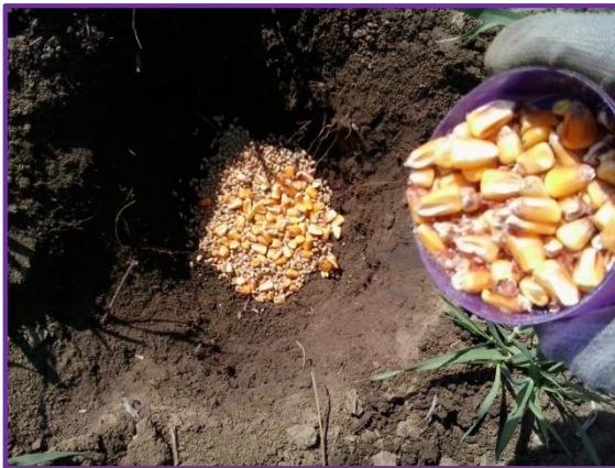
Slika 25. Jama sa zrnom kukuruza i pšenice