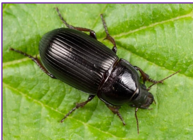
Slika 5. Imago žitarca crnog

Jedini štetni predstavnik ove porodice je žitarac crni ( Zabrus tenebrioides Goeze). Žitarac crni (Slika 5.) je kornjaš crne boje s tamnosmeđim ticalima i nogama. Dužine je do 18 mm. Ličinka (Slika 6.) je blijedožute boje, s tamnosmeđom glavom i prsištem, te sa smeđim pjegama na leđnom dijelu svakog članka abdomena (Ivezić, 2008.). Dužina tijela je oko 30 mm. Štete rade i imago i ličinka. Imago oštećuje zрно u klasovima, a ponekad pregrize klas i nastavlja ishranu na tlu. Ličinka ima jake čeljusti te se noću izlazi hraniti mladim lišćem. Ženke mogu odložiti do 100 jaja u tlo. Imago se javlja u lipnju. Zaštita je preventivna, a sastoji se u pridržavanju plodoreda i uporabi odgovarajućih insekticida. Vodi se računa o pragu odluke i pojavi ličinki.