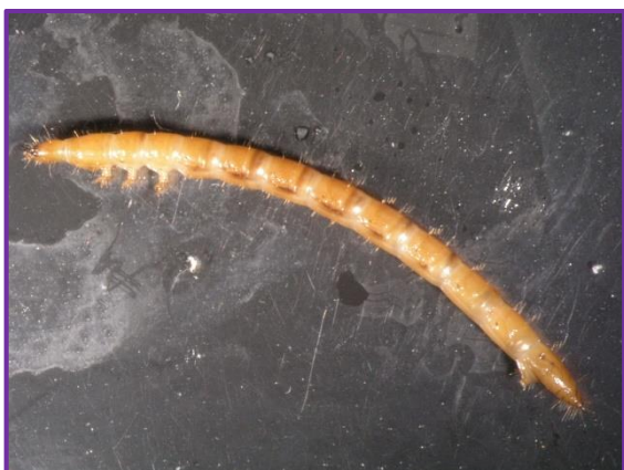
Slika 33. Žičnjak