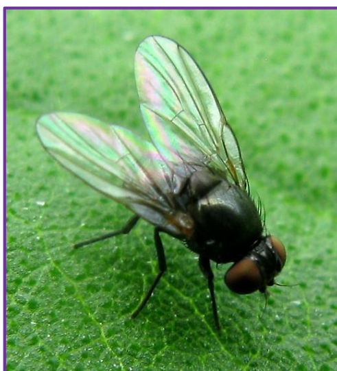
Slika 16. Imago lisnog minera

Nekoliko vrsta lisnih minera napada žitarice i radi štete ( Agromyza nigrella Rond., A.luteitarsis Rond., A.megalopsis Her.). Imago (Slika 16.) je sjajno crna muha. Ženka polaže jaja na vrh lista. Ličinka buši epidermu i hrani se tkivom između dvije epiderme, praveći takozvane mine (Slika 17.). Mine su prozirne i mogu se vidjeti ličinke, kao i njihov izmet. Nakon završenog razvoja, padaju na tlo gdje se kukulje. Imaju prirodnih neprijatelja, pa se insekticidi koriste s oprezom (da se ne naruši biološka ravnoteža).