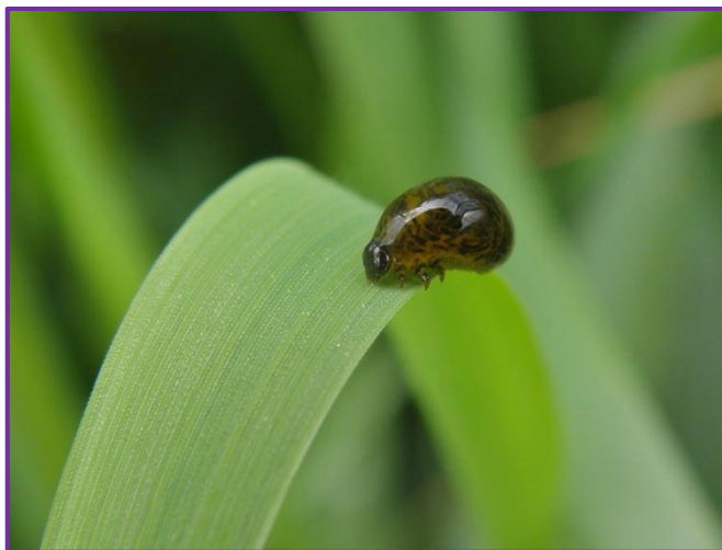
Slika 8. Ličinka žitnog balca