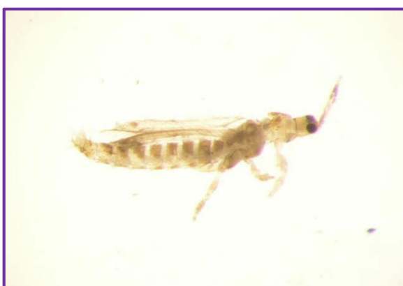
Slika 37. Thysanoptera sp. 2