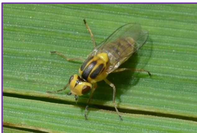
Slika 13. Žuta žitna mušica