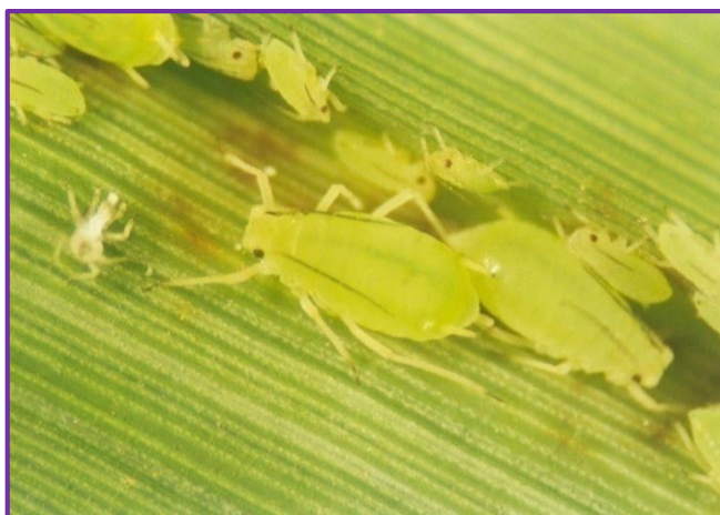
Slika 21. Pšenična lisna uš ( Schizaphis graminum Rond.)

Lisne uši su veoma značajni štetnici, jer prenose virusne bolesti. Odgovara im toplo i suho vrijeme. Prave štete sišući biljne sokove, te izazivaju slabljenje biljke i deformaciju tkiva. Štetni su i ličinka i odrasli oblik. Dijelimo ih na holociklične (imaju potpuni razvojni stadij) i anholociklične (nepotpun razvojni stadij). Mogu se hraniti na jednom domaćinu, onda su monoecijske, a ako se hrane većim brojem različitih biljaka onda govorimo o heterecijskim vrstama. Zobena lisna uš ( Macrosiphum avenae F.) napada ječam, pšenicu, zob, raž i trave koje se uzgajaju. Brzo i masovno se razmnožava. Raznih je boja, od zelene do crne. Prezimljava u stadiju jajeta. Nakon žetve seli se na samonikle žitarice i trave. Mlječikina lisna uš ( M. euphorbiae Th.) je holociklična uš koja napada preko 200 biljnih vrsta. Počinje se javljati već u jesen. Prenosi opasan virus strnih žita Barley Yellow Dwarf Virus (BYDV). Još se na ječmu može naći i pšenična lisna uš - Schizaphis graminum Rond. (Slika 21.). Problem s lisnim ušima se najčešće rješava kemijskim putem. Ukoliko ima predatora lisnih ušiju (božje ovčice) u većem broju, može se izbjeći zaštita.