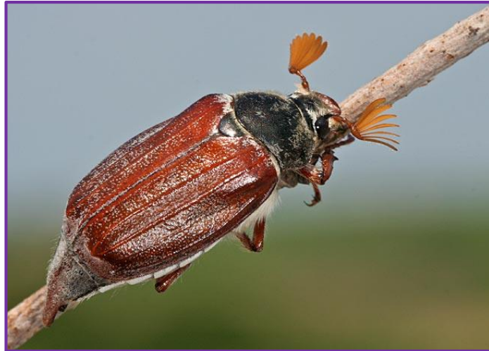
Slika 3. Imago hrušta

Razvoj generacije hrušta traje 3-4 godine, što ovisi o klimi tog područja. Hrušt prezimi u stadiju ličinke ili odraslog oblika, a pojavljuje se slijedeće godine u travnju i svibnju. Tada započinje s intenzivnom ishranom, nakon koje slijedi rojenje i parenje u šumi. Zatim ženke odlaze na oranice odlagati jaja, a ponekad mogu to činiti i tri puta godišnje. Ovaj štetnik napada kukuruz, šećernu repu, krumpir i druge kulture. Zaštita se sastoji od insekticida prihvatljivih za okoliš prije sjetve ili sadnje.