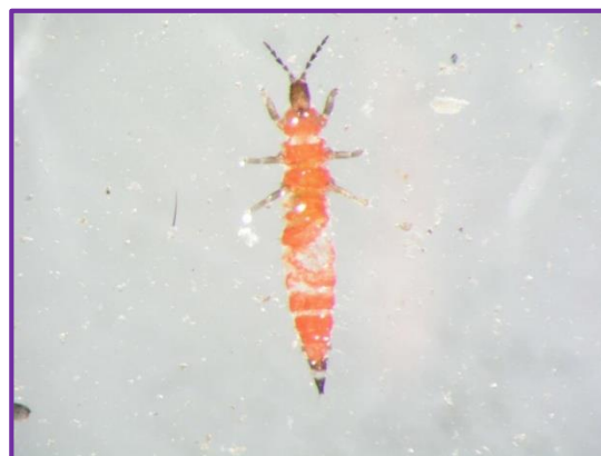
Slika 38. Thysanoptera sp. 3

U tablici 4 su prikazani rezultati ukupnog ulova kukaca. Ukupno je ulovljeno 58 ličinki i 280 odraslih oblika kukaca, te 68 jedinki drugih zooloških skupina. Populacije ulovljene entomofaune bile su niske, što ukazuje da proizvođač uspješno primjenjuje preventivne mjere kao što su plodored, agrotehničke mjere i odabir sorte ječma. Također, okolišni uvjeti su važni čimbenici za masovniju pojavu štetnika, a tijekom vegetacije u 2017. nisu utvrđeni stresni momenti niti ekstremi koji bi oslabili imunitet biljke i uzrokovali prenamnažanje štetnika.