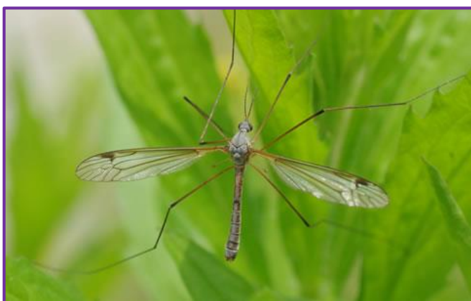
Slika 9. Imago livadnog komara

Tu spadaju livadni ( Tipula paludosa L.) i vrtni komar ( T. oleracea Meig.). Livadni komar (Slika 9.) ima tijelo prekriveno dlačicama. Ženke imaju nešto duže tijelo. Glava im završava rilom. Boje su svijetlosmeđe slično tlu. Ličinke (Slika 10.) su valjkaste i sive boje. Hrane se biljnim ostacima koji nisu razgrađeni i stvaraju humus. U proljeće napadaju mlade biljke i tako čine štete. Ženka može odložiti do 500 jaja. Ima jednu generaciju godišnje. Vrtni komar se morfološki vrlo malo razlikuje od livadnog. Ličinke rade štete hraneći se podzemnim dijelovima biljaka, ali i stabljikom neposredno iznad tla. Razlika u odnosu na livadnog je što ima dvije generacije godišnje, proljetnu i jesensku.