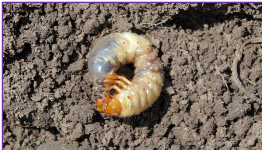
Slika 4. Grčica