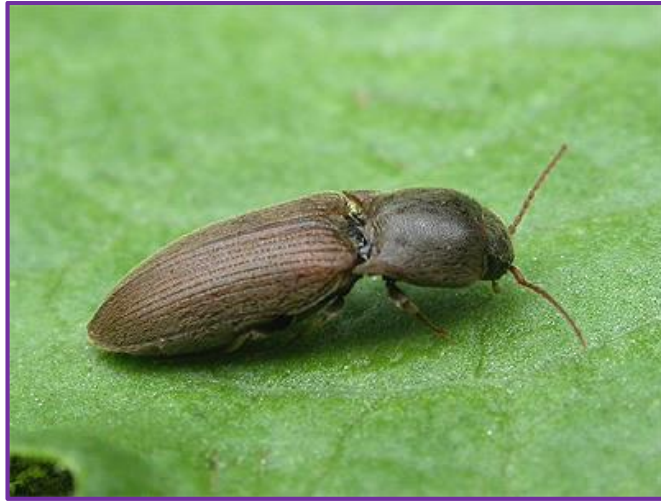
Slika 1. Imago Agriotes obscurus L.