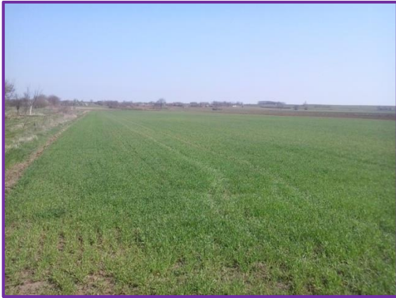
Slika 29. Parcela s ječmom prilikom ulova kukaca u ožujku