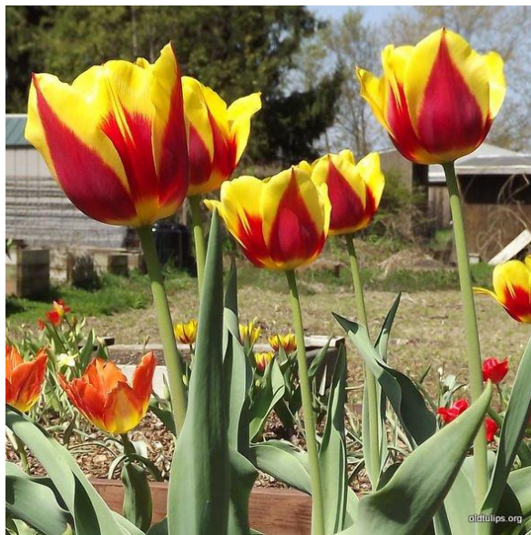
Slika 8. Keizerskroon Tulip

Primjeri: Keizerskroon (žuto-crveni), Brilliant Star (crveni), Bellona (zlatnožuti).