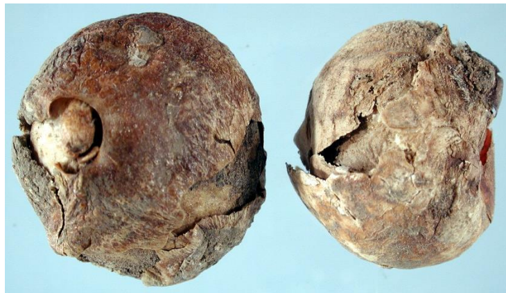
Slika 20. Truljenje lukovica ( Fusarium oxysporum )

Gljivica Fusarium oxysporum uzrokuje truljenje lukovica u skladištu. Pri tome se širi kisel miris i točenje sluzi. Preventivna mjera zaštite protiv napada ove gljivice je držanje na temperaturi od 34°C i relativnoj vlazi vazduha od 80%.