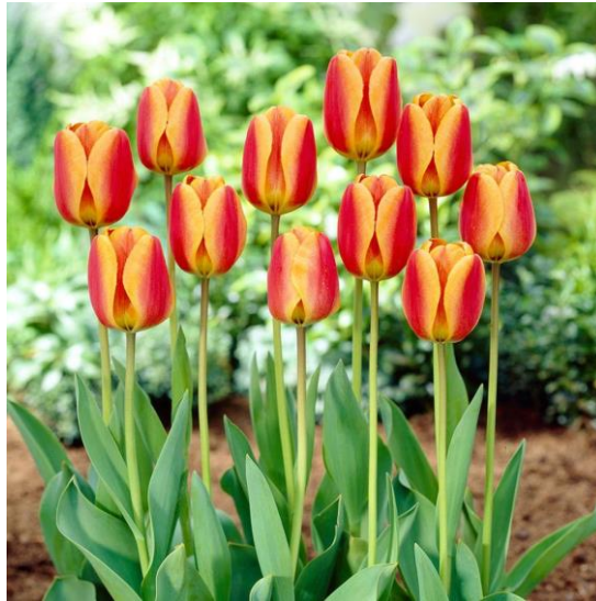
Slika 11. Apeldoorn Tulip

Primjeri: Apeldoorn (narančasto-crveni), Clara Butt (ružičasti), La Tilipe Noire (crnkasto purpurni), Zwanenburg (bijeli), London (ružičasti).