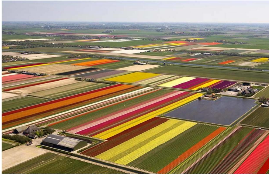
Slika 7. Polja tulipana u Nizozemskoj