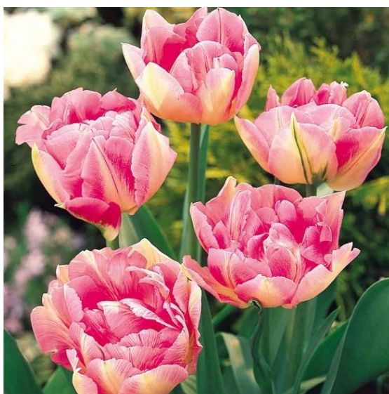
Slika 9. Peach Blossom Tulip