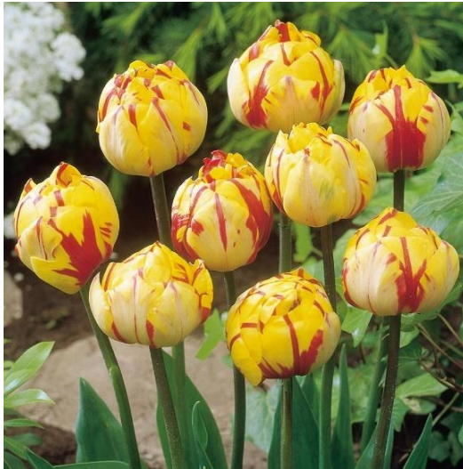
Slika 16. Nizza Tulip

Primjeri: Eros (nježnoružičasti, mirisan), Nizza (žuto-crveni) Moonglow (žuti), Symphonia (crveni).