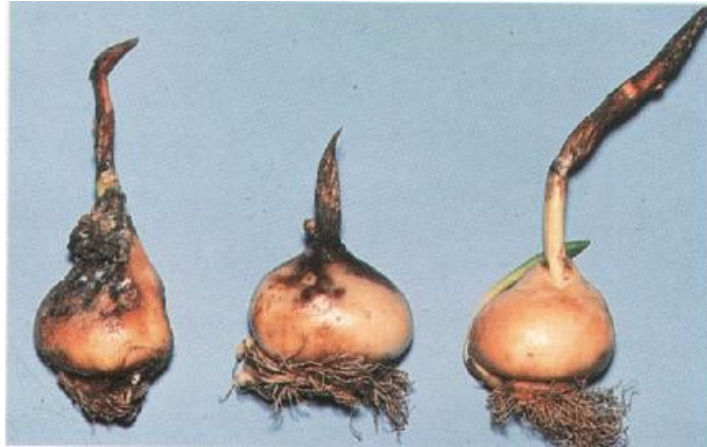
Slika 19. Zaražena lukovica tulipana ( Sclerotium tuliparum )

Siva trulež tulipana ( Sclerotium tuliparum ) može se prepoznati po lukovicama. Iz oboljelih lukovica izbijaju slabi izboji koji se saviju. Budući da se bolest prenosi lukovicama, potrebno je lukovice dezinficirati prije sadnje.