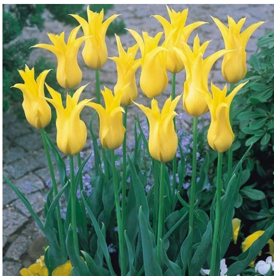
Slika 12. West Point Tulip