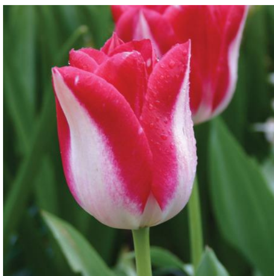
Slika 10. Garden Party Tulip

Primjeri: Garden Party (bijeli s ružičastim rubom), Apricot Beauty (ružičasti boje lososa), Korneforos (crveni), Sulphur Glory (žuti).