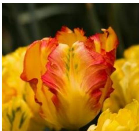
Slika 15. Texas Gold Tulip

Primjeri: Texas Gold (žuti s crvenim rubom), Black Parrot (crnkasto purpurni), Firebird (cinober i bijeli), Fantasy (ružičasti i zeleni).