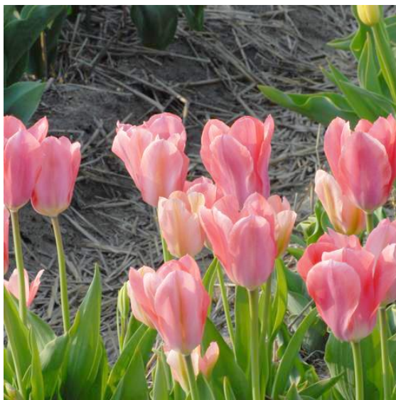
Slika 13. Rosy Wings Tulip

Primjeri: Rosy Wings (ružičasto-bijeli), Golden Harvest (žuti), Marshal Haig (crveni i žuti), Greenland (ružičasti, krem i zeleni).