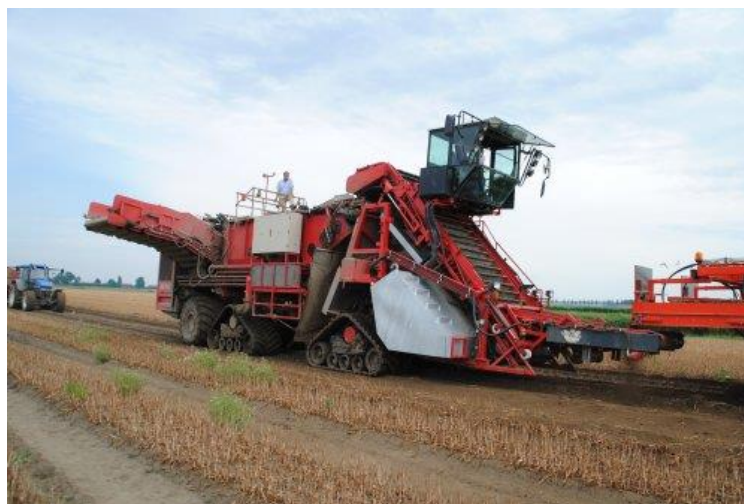
Slika 4. Specijalizirani kombajn za vađenje lukovica tulipana

Lukovice se vade kada vanjska opna poprimi smeđu boju, a nadzemni dijelovi odumru. Tada se lukovice još drže zajedno pa je vađenje jednostavnije. Lukovice se vade plugom ili posebnim kombajnom za vađenje lukovica. Odmah nakon toga, rasprostru se i stave u prozračan prostor. U ovoj fazi ne preporuča se grijanje. Završno, slijedi čišćenje i sortiranje lukovica po veličini.