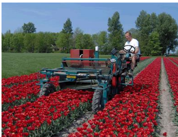
Slika 5. Stroj za rezanje glava tulipana

Cvijet tulipana se reže kada je boja dobro vidljiva, a nije se još potpuno rascvjetao. Pospješivanim tulipanima se cvijet ne reže, već čupa, jer lukovicu više ne trebamo. Inače, cvijet se reže tako da na biljci ostanu još najmanje dva lista (Ahmić, 2016.).