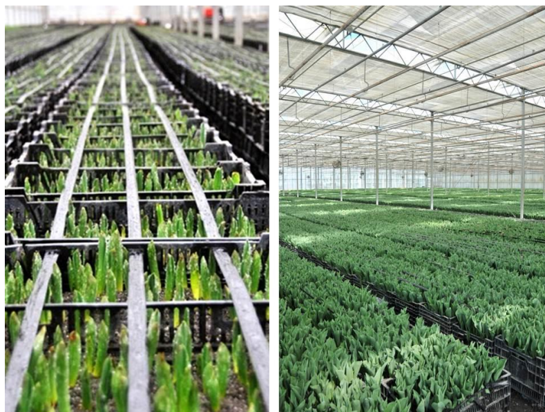
Slika 6. Uzgoj tulipana u zaštićenom prostoru