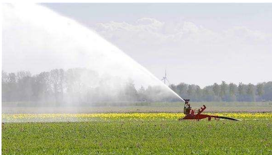
Slika 17. Uređaj za navodnjavanje tulipana

Tulipani su jedni od najjednostavnijih cvjetova za uzgoj. Kod zalijevanja tulipana sve je u minimalizmu. Nakon što se lukovice u jesen polože u zemlju oko njih nema puno posla. Lukovice se polažu u vrlo dobro isušeno, po mogućnosti suho ili pješčano tlo, a vodu trebaju samo da se probude i počnu rasti. Tulipani zahtijevaju vrlo malo vode. Ukoliko na tlu stoji voda to će potaknuti bolest i trulež. Potrebe tulipana za vodom zadovoljavaju se povremenom kišom. Iznimno, tijekom dugog razdoblja suše te vrućih ljetnih dana potrebno ih je zalijevati da tlo ne bi potpuno presušilo. U tom slučaju navodnjavanje na poljima tulipana vrši se pomoću posebnih prskalica (Baessler, 2016.).