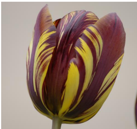
Slika 14. Absalon Tulip

Primjeri: Absalon (žuto-crveni), Cordell Hull (bijeli i crveni), Victory (žuti i smeđi), Glorie de Holland (ljubičasti i bijeli).