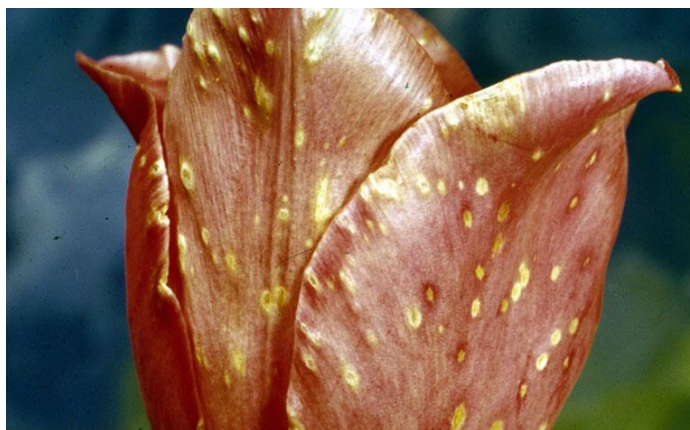
Slika 18. Cvijet tulipana zaražen sivom plijesni

Velike štete na usjevima radi siva plijesan tulipana ( Botrytis tulipae ). Na listovima i cvjetovima se javljaju sive naslage te udubljene pjege. Lišće prijevremeno opada, pa su lukovice sitnije. Sve napadnute biljke treba odstraniti. Zaštita je preventivna, sa „TMTD“, „Captanom“, „Manebom“. Preventivne mjere još se odnose na izbor zdravih sorti i njegu biljke. Tlo treba redovito obraživati, izbjegavati prekomjerno gnojenje, a za uzgoj u zaštićenim prostorima treba ih redovito prozračivati (De Boer, 2011.).