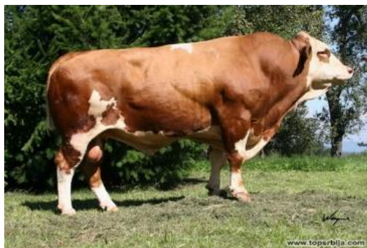
Slika 2. Govedo simentalske pasmine

U svijetu je danas 449 pasmina goveda od čega je 251 pasmina priznata. Dijelimo ih prema proizvodnim sposobnostima goveda. Goveda koja su specijalizirana za proizvodnju mlijeka pripadaju mliječnoj pasmini, dok goveda koja su pogodna za proizvodnju mesa pripadaju mesnim pasminama. Osim prethodno spomenute mliječne i mesne pasmine postoji i kombinirana pasmina u koju pripadaju goveda koja su po svojim proizvodnim sposobnostima prikladne i za proizvodnju mlijeka i za proizvodnju mesa. ( Uremović, 2004.; Caput 1996.)