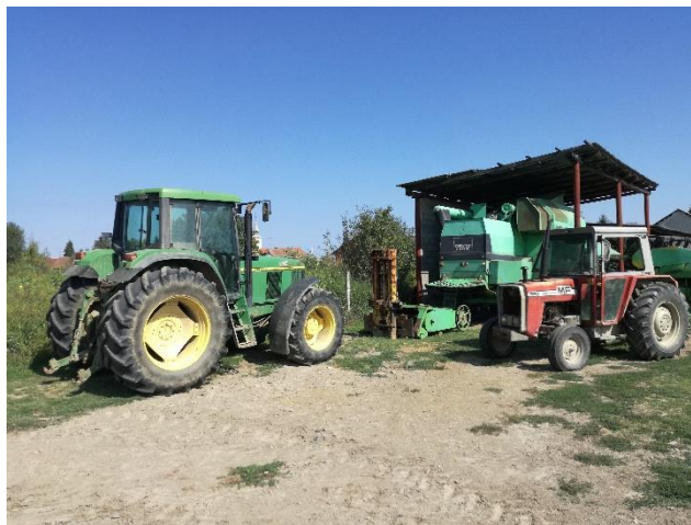
Slika 9. Strojevi na OPG-u Kusturić

Kako bi se zemljište uopće moglo obrađivati, potrebno je posjedovati određene strojeve i uređaje za obradu tla. Na ovoj farmi u tu svrhu koriste se tri traktora, dva kombajna i desetak strojeva za obradu tla poput pluga, drljače, kultivatora, balirke, sjetvospremača i dr.