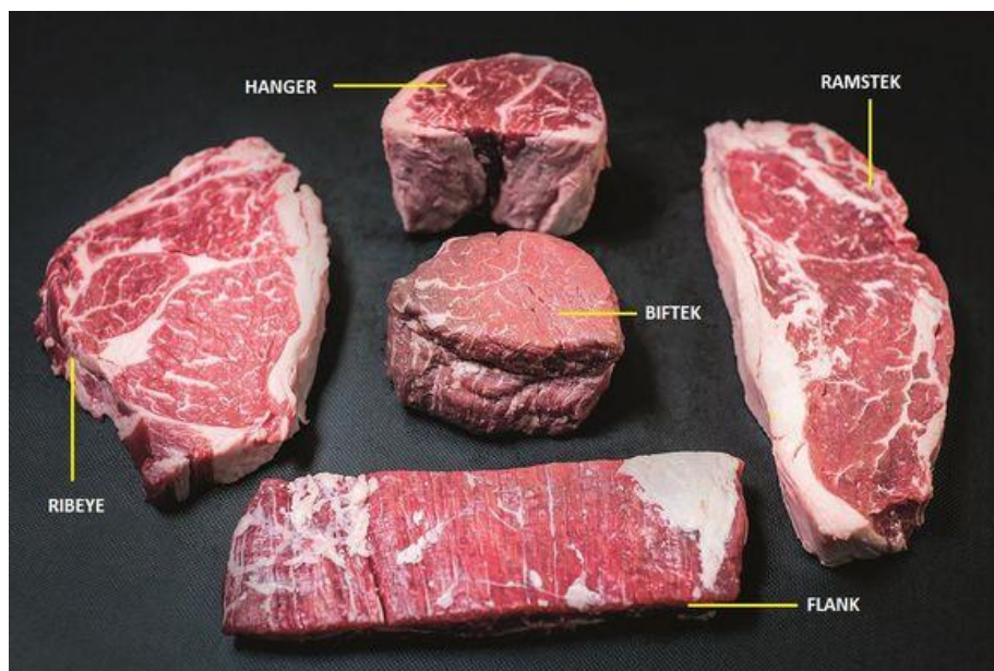
Slika 1. Goveđe meso

Ukoliko želimo postići dobre i konkurentne rezultate u tovu i proizvodnji goveđeg mesa, pozornost moramo obratiti na razno razne faktore koji imaju utjecaj na njih. Tako ću u ovom radu prikazati način rada manjeg obiteljsko poljoprivrednog gospodarstva Kusturić, Golinci koji se bavi tovom junadi. Prikazati ću način hranidbe junadi, sustav držanja grla, proizvodnju hrane te ću pokušati pobliže objasniti razvoj goveda od trenutka ulaska u tov do završne faze tova.