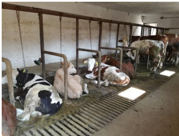
Slika 6. Junad na OPg-u Kusturić

Već ranije smo govorili o čimbenicima koji imaju bitan faktor prilikom odabira grla za tov, tako je pasmina možda i jedan od važnijih čimbenika na koji se obraća pozornost kada je u pitanju tov junadi. Na OPG-u Kusturić, Golinci najbrojniji su križanci simentalske i neke od mesnih pasmina. Osim navedenog tu se može pronaći i simentalac križan sa mliječnom pasminom te smeđe i sivo govedo. Sve detalje o pasmini goveda bilježe se u „Registar goveda na gospodarstvu“ koji je prilog ovom radu kako bismo imali uvid u pasminski sastav roditelja goveda i samog goveda koje boravi na farmi.