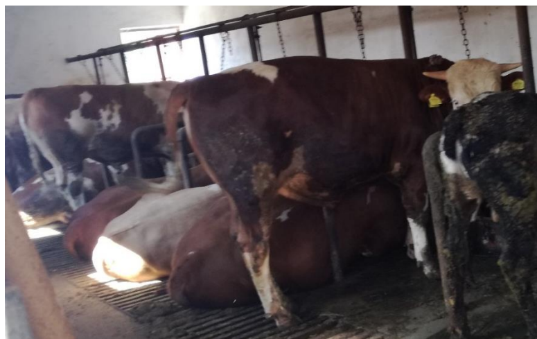
Slika 3. Simentalac na OPG-u Kusturić

Kada govorimo o tovu goveda također treba obratiti pozornost i na kombinirane pasmine koje su specijalizirane i za proizvodnju mesa i za proizvodnju mlijeka. Očekivano, kombinirane pasmine ne postižu tako dobre rezultate kao specijalizirane pasmine, ali dosta često imaju zavidne rezultate koji zadovoljavaju mnoge proizvođače. Najpoznatija kombinirana pasmina je simentalska pasmina. Simentalac je dugovječan, vrlo prilagodljiv na podneblje, tlo i intenzitet iskorištavanja. Proizvodni vijek u intenzivnom iskorištavanju traje pet do sedam godina. Simentalska pasmina je najbrojnija u Hrvatskoj i u proizvodnji mlijeka, ali i u proizvodnji mesa. S obzirom na svoje karakteristike, simentalac je osobito prikladan za manje farme koje se bave kombiniranom proizvodnjom. (Caput, 1996.)