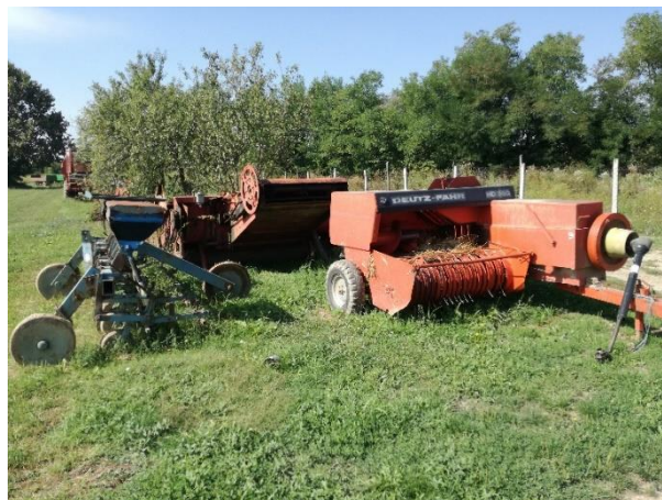
Slika 10. Mehanizacija na OPG-u Kusturić