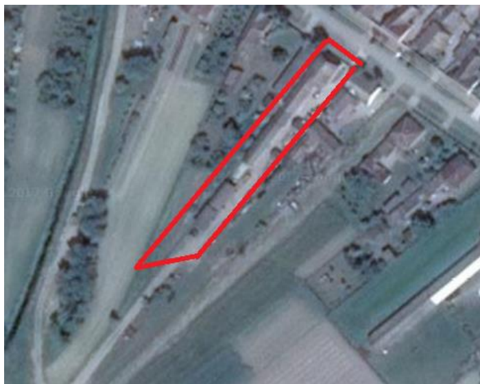
Slika 4. Satelitska snimka OPG-a

Obiteljsko poljoprivredno gospodarstvo Kusturić osnovano je 1.1.1998. godine, osnovao ga je Nikola Kusturić koji je vlasnik i danas. OPG se nalazi u mjestu Golinci, u općini Donji Miholjac, u županiji Osječko-baranjskoj, na županijskoj cesti Miholjački Poreč – Golinci. U sklopu OPG-a nema zaposlenika već se kompletna obitelj uključuje u radove potrebne za normalno funkcioniranje gospodarstva. Osim tova junadi, koje je prioritet na ovom gospodarstvu, obitelj se bavi i uzgojem svinja i nesilica za vlastite potrebe. U prošlosti su se također bavili i proizvodnjom mlijeka, no zbog neisplativosti fokus je zadržan na tovu junadi.