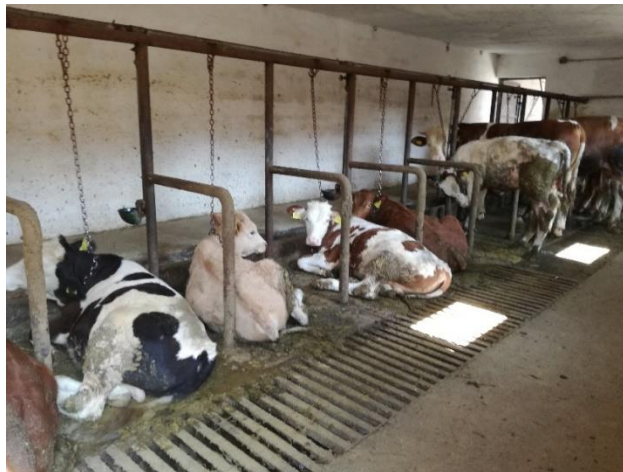
Slika 6. Junad na OPG-u Kusturić

Već ranije smo govorili o čimbenicima koji imaju bitan faktor prilikom odabira grla za tov, tako je pasmina možda i jedan od važnijih čimbenika na koji se obraća pozornost kada je u pitanju tov junadi. Na OPG-u Kusturić, Golinci najbrojniji su križanci simentalske i neke od mesnih pasmina. Osim navedenog tu se može pronaći i simentalac križan sa mliječnom pasminom te smeđe i sivo govedo. Sve detalje o pasmini goveda bilježe se u „Registar goveda na gospodarstvu“ koji je prilog ovom radu kako bismo imali uvid u pasminski sastav roditelja goveda i samog goveda koje boravi na farmi.