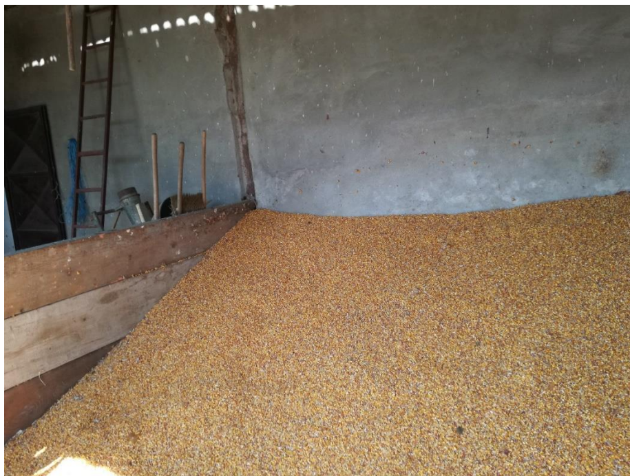
Slika 8. Kukuruz u zrnju

Kukuruz je druga po redu žitarica po zastupljenosti na obradivim površinama, a razlog tome je njegova visoka zastupljenost u krmnoj smjesi namijenjenoj tovu junadi koja iznosi oko 70%. Kukuruz je osnovna krmna kultura u smislu energetskog krmiva.