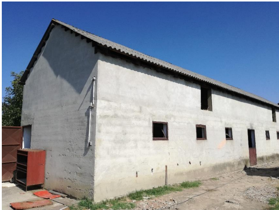
Slika 5. Objekt za tovu junad

Broj junadi da OPG-u je promjenjiv, ali budući da je kapacitet štale 22 grla nikada ih niti nema više u istom trenutku. Na farmi postoji jedan objekt koji je namijenjen isključivo junadi, te dva objekta u kojem se nalaze svinje koje se uzgajaju za potrebe kućanstva. Štala koja je namijenjena tovu junadi izgrađena je 2003. godine. Dužine je 21,5 m, a širine 5,5 m. Junad se drži na vezu, te se ispred junadi nalazi kanal iz kojega uzimaju hranu, tako zvani hranidbeni kanal. Svako grlo ima svoj boks širine 90cm, a na kraju boksa se nalazi rešetkasti pod koji je namijenjen izgnojavanju. Osim već spomenutog prostora za hranidbu bitno za napomenuti je i to da na dva boksa dolazi jedna automatska pojilica što znači da je jedna dostatna za dva grla.