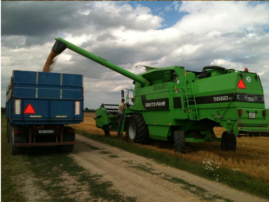
Slike 12, 13: Žetva pšenice.