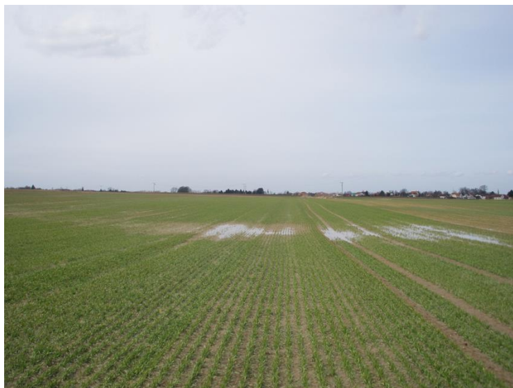
slika 3: Suvišak vode u usjevu pšenice.