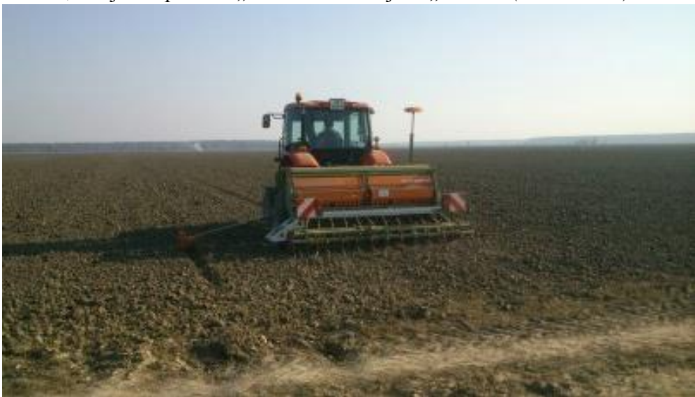
Slika 9: Sjetva pšenice sijačicom „Amazone“.