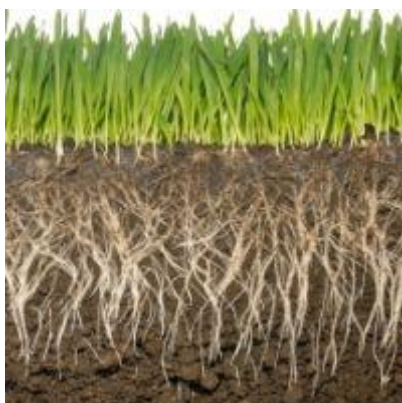
Slika 1: Korijen pšenice.