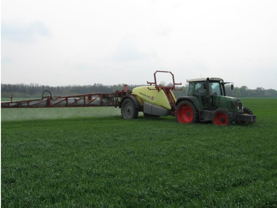
Slika 11: Prskalica.