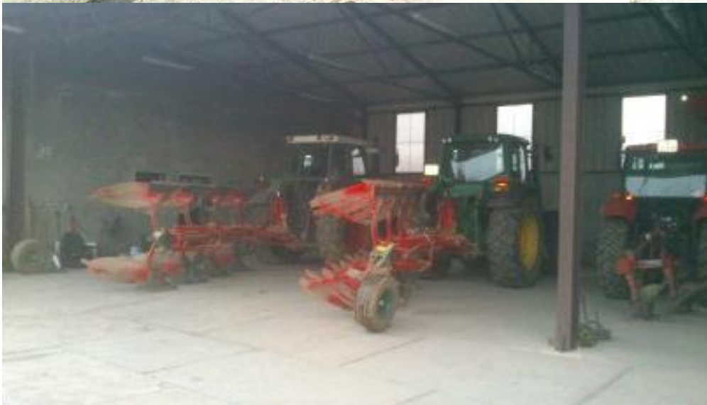
Slike 6, 7: Tanjurača „Quivogne“ i plugovi „Vogel&Noot“.