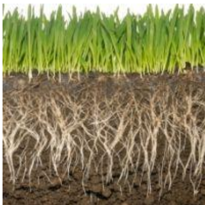
Slika 1: Korijen pšenice.