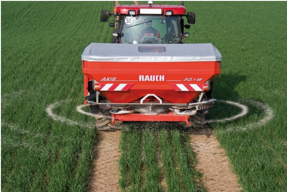
Slika 10: Rasipač umjetnog gnojiva.