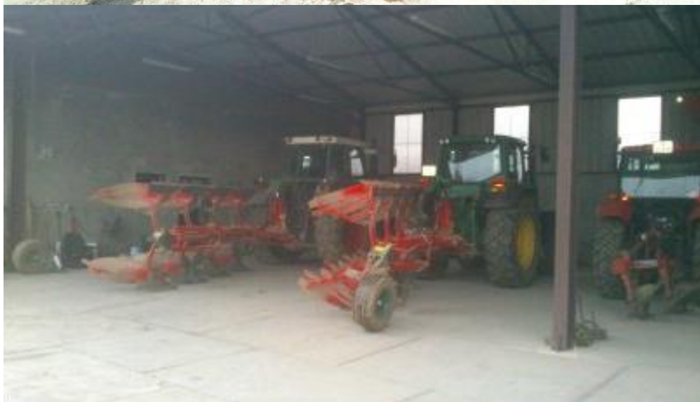
Slike 6, 7: Tanjurača „Quivogne“ i plugovi „Vogel&Noot“.