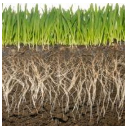
Slika 1: Korijen pšenice.