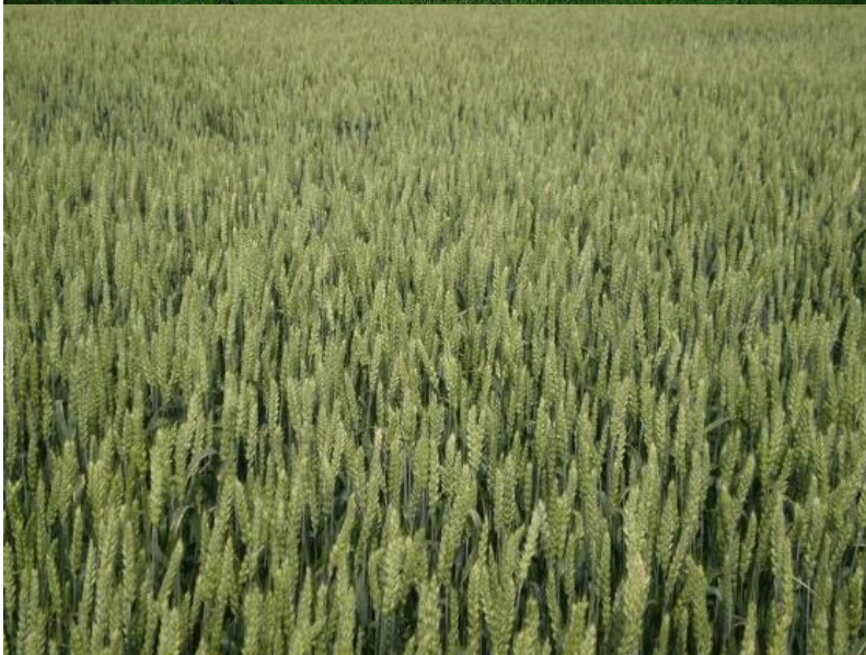
Slike 14, 15, 16: Pšenica u fazi nicanja, busanja i klasanja.