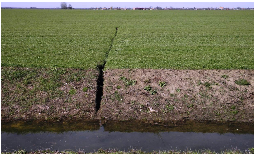
Slika 5: Strojno kopanje kanalića za odvodnju suvišne vode.