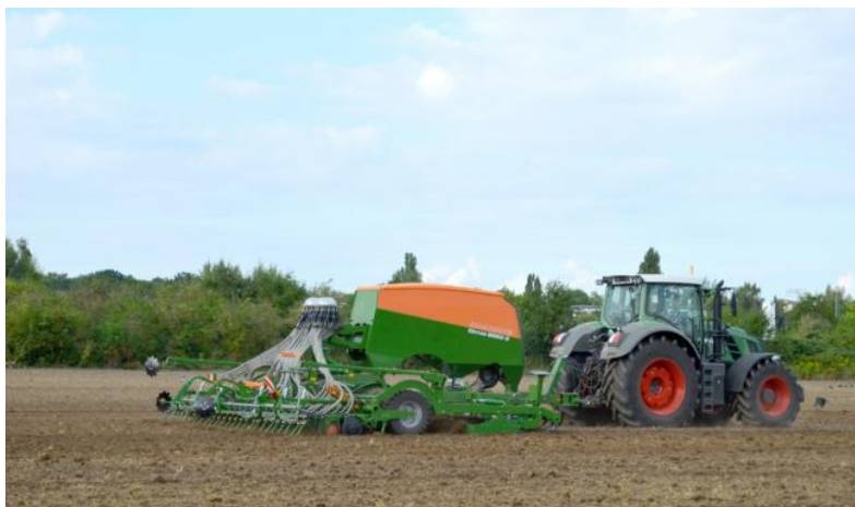
Slika 4: Sjetva pšenice.

vrijednosti. Ukoliko površina za sjetvu nije dobro pripremljena ili kasnimo sa rokom sjetve, dobivenu količinu sjemena za sjetvu možemo povećati. Sjetvu pšenice obavljamo žitnim sijačicama koja ima razmak između redova 12, 5 ili 15 cm. Dubina sjetve je 4 - 6 cm, što ovisi o tlu, temperaturi, vlažnosti te roku sjetve. Na težim i na vlažnim tlima se sije pliće, a na lakšim i plićim tlima dublje. Kod dublje sjetve na težim tlima može doći do raznih deformacija klice, a biljke budu oslabljene i zaostaju u razvoju.