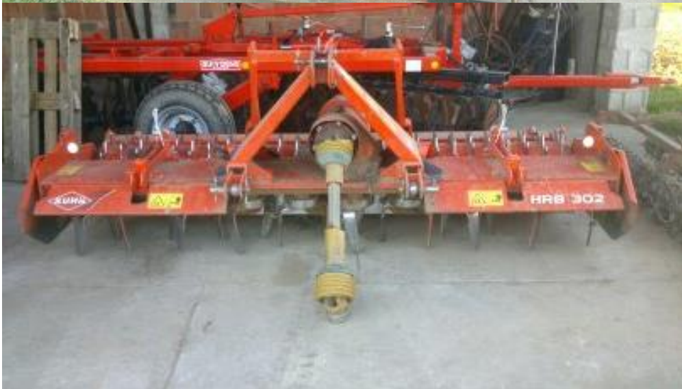
Slike 7, 8: Sjetvospremač „Pecka“ i rotodrljača „Kuhn“.