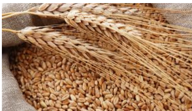
Slika 2: Plod pšenice.

u zrnu je endosperm, a u njemu su smještene hranjive tvari za ishranu klice tijekom klijanja i nicanja. Sastoji se od vanjskog sloja koji sačinjavaju stanice sa zadebljalim staničnim stjenkama i unutrašnjeg sloja. U zadebljalim staničnim stjenkama nalaze se aleuronska zrnca bogata bjelančevinama, a sadrži i ulje koje štiti unutrašnjost zrna od prodiranja vlage. Unutrašnjost zrna čine stanice u kojima se nalaze škrobna zrnca koja su specifičnog oblika i građe te se na osnovu oblika škrobnih zrnaca može odrediti čistoća brašna, odnosno sastav smjese brašna. Zrno je golo, sa izraženom brazdicom i bradicom, najčešće žutosmeđe ili crvenkaste boje, što ovisi o sorti. U presjeku zrno može imati caklavu ili brašnavu građu.