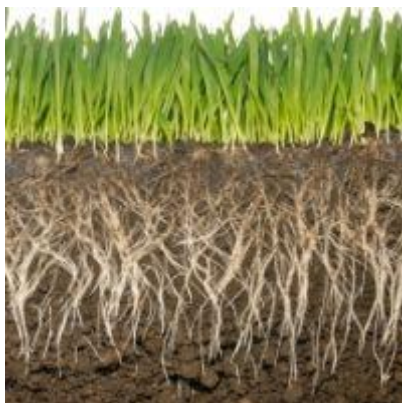
Slika 1: Korijen pšenice.