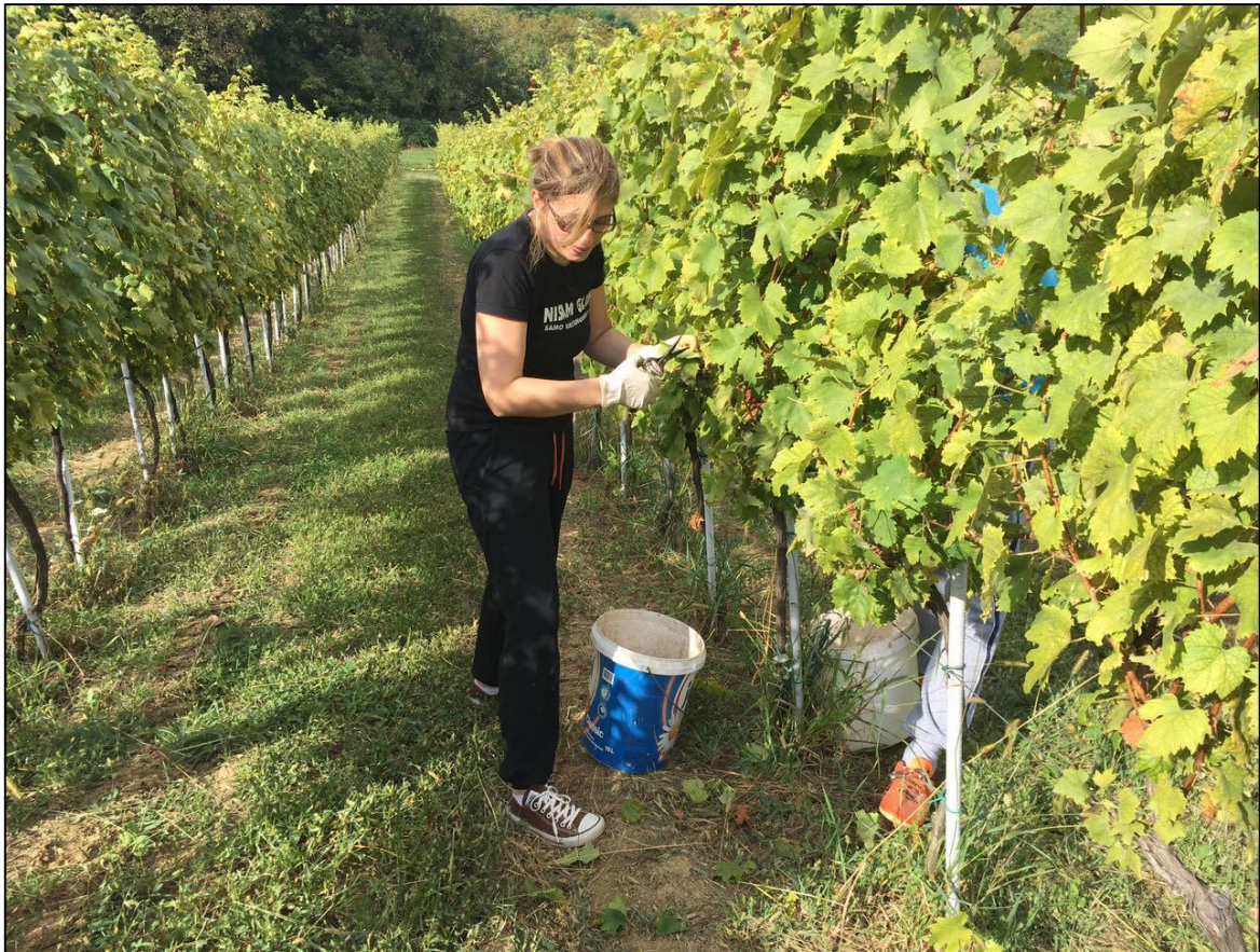
Slika 6. Berba