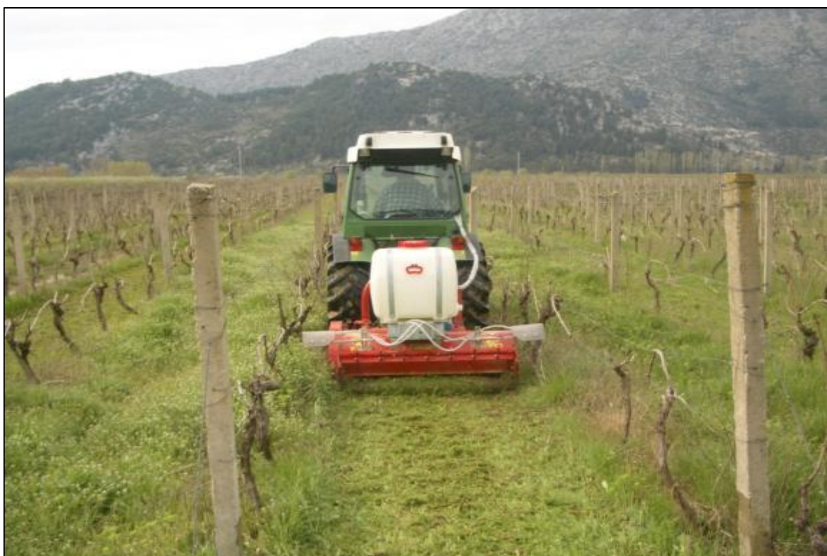
Slika 4. Malčiranje i prskanje korova

Zaštita vinove loze započinje već u zimskim mjesecima i to po obavljenoj rezidbi uporabom zaštitnih sredstava na bazi bakra tako zvana zimska zaštita. U našem nasadu zimsku zaštitu provodimo u fazi mirovanja mladica zaštitnim sredstvom kuprablau u koncentraciji 2-3 puta većoj od propisane. Sljedeća preventivna zaštita obavlja se nakon porasta mladica do dužine 15-20 cm uporabom fungicida namijenjenih zaštiti vinove loze od bolesti plamenjače (peronospore), sive pljesni i crne pjegavosti, te napada grinje.