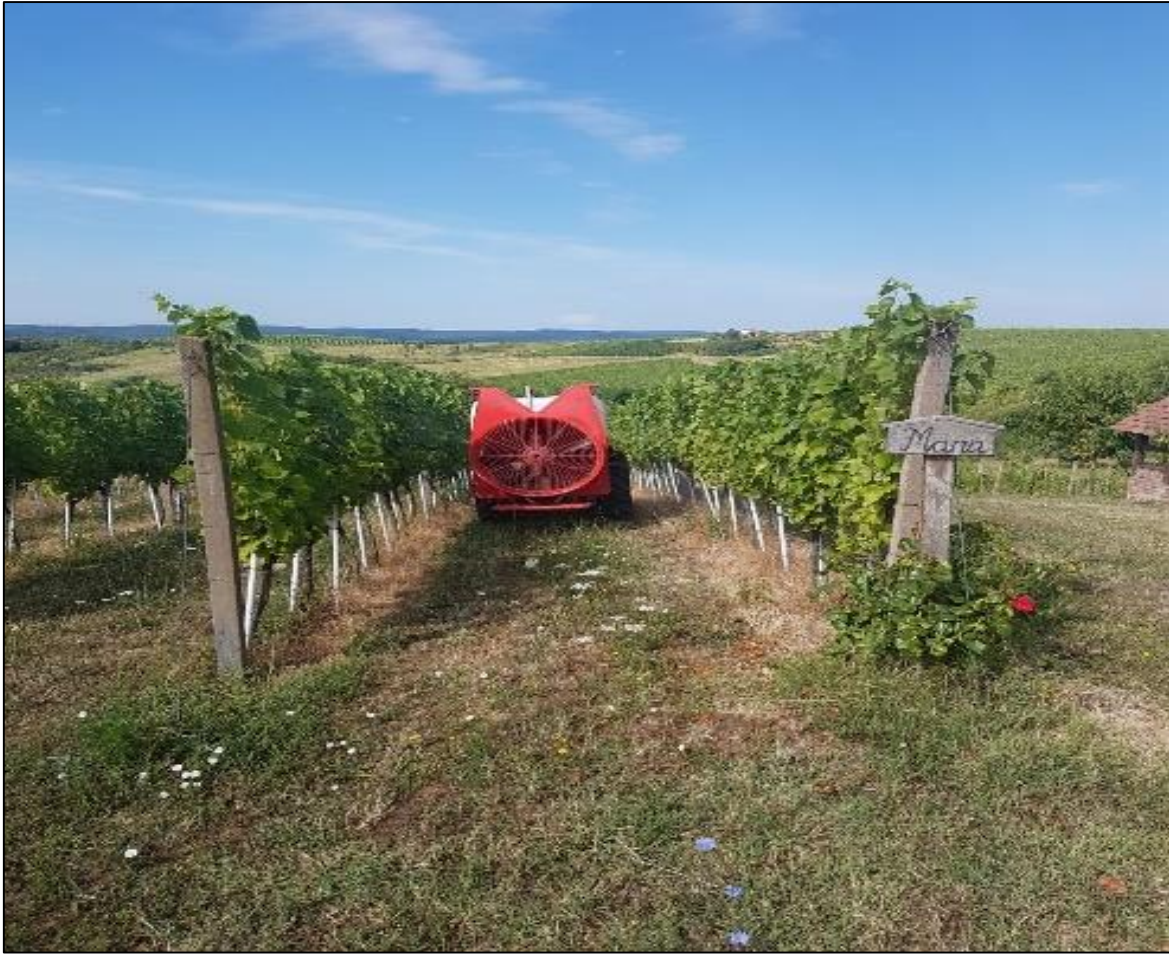
Slika 5. Prskanje vinograda