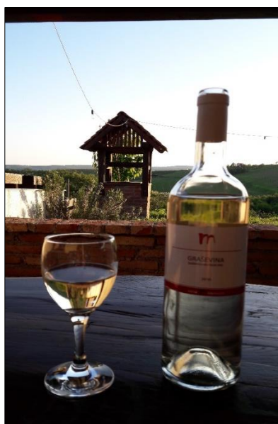
Slika 8. Butelja vina

Na području Đakovštine postoje dva velika proizvođača vina, a to su Misna vina d.o.o. i Đakovačka vina d.d.. Prodaja njihovih vina vrši se na cijelom području Hrvatske i izvan državnih granica. Osim navedena dva velika proizvođača, na području Đakovštine imamo još dva proizvođača čije količine proizvodnje dosežu 400 hl vina godišnje te nekoliko manjih vinara čije su količine do 100 hl vina godišnje. Ispitivanjem lokalnog tržišta i navika potrošača došlo se do zaključka da postoji određeni broj kupaca i konzumenata koji preferira vina koja se proizvode u manjim količinama na tradicionalan način. Iz tog razloga odlučili smo se na proizvodnju vina u kojoj koristimo tradicionalne metode uz primjenu enoloških preparata i modernih tehnologija. Cilj nam je proizvodnja kvalitetnih ili vrhunskih vina koja će se prodavati u buteljama po pristupačnim cijenama na lokalnom tržištu. Želimo postići prepoznatljivost kod lokalnih potrošača bilo krajnjih korisnika ili lokalnih ugostitelja i restorana. Način prodaje planiramo vršiti na vlastitom pragu i direktnom distribucijom prema potrošačima. Način promocije i oglašavanja je sudjelovanje na izložbama, sajmovima te usmenom predajom od usta do usta. S obzirom da planiramo proizvodnju cca 50 - 70 hl godišnje, očekujemo da ćemo za navedene količine pronaći kupce te da neće biti problema u prodaji.