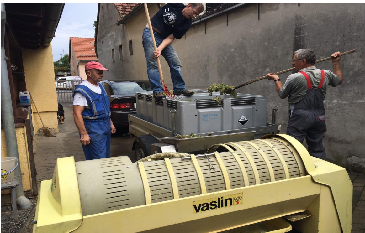
Slika 7. Prerada grožđa (muljanje i prešanje)

proizvodnji imamo Muškat ottonel koji se nakon izvršenog ruljanja i odvajanja peteljki ostavlja na maceraciji koja traje 3 sata uz hlađenje mošta, a nakon čega je daljnji postupak isti kao i kod Graševine.