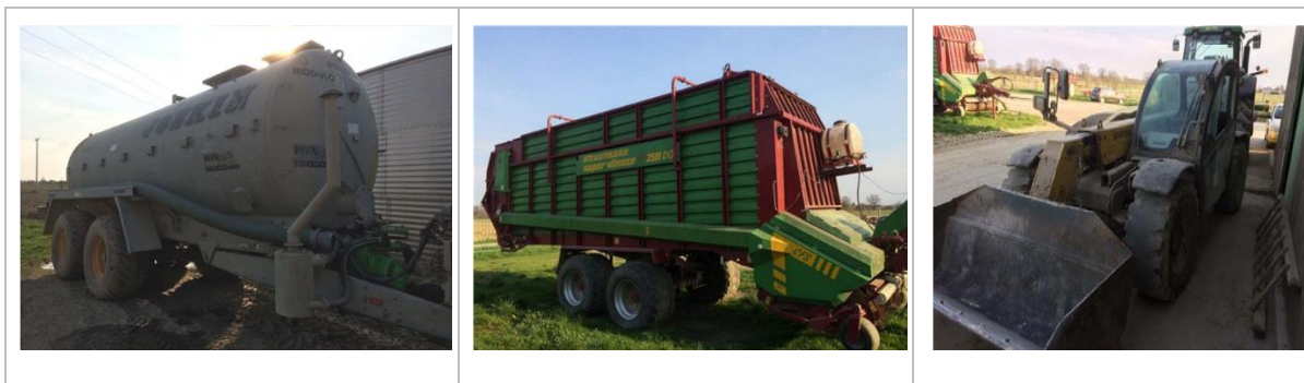
Slika 6. Specijalizirana oprema: cisterna za transport gnoja, samoutovarna prikolica te teleskopski utovarivač.

Vlasnik je potporu iskoristio za ulaganje u specijaliziranu opremu za transport gnoja, teleskopski utovarivač i samoutovarnu prikolicu.