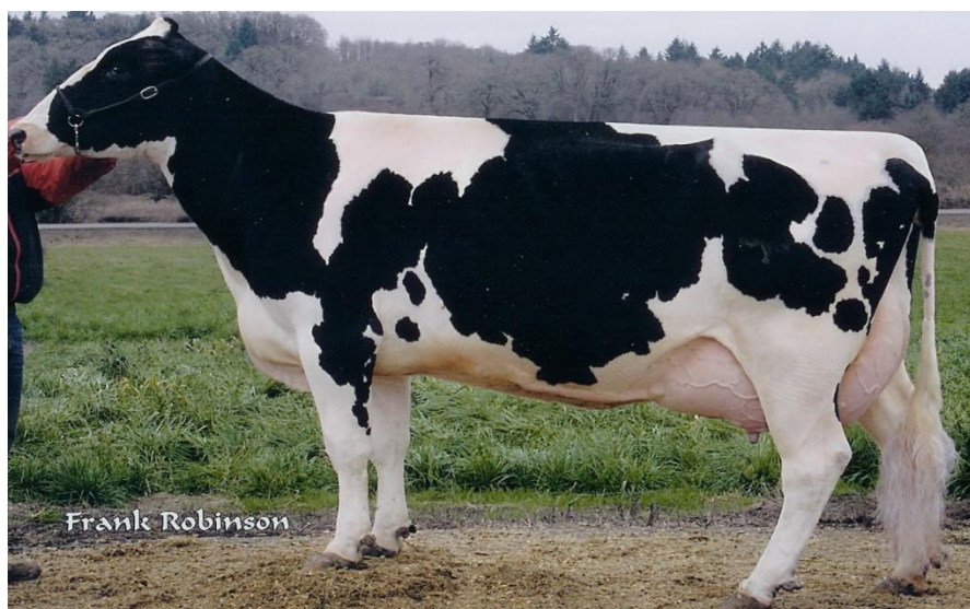
Slika 2. Holstein-friesian pasmina

Na farmi se nalaze krave izrazito mliječne pasmine – Holstein-friesian . Ona je specijalizirana za visoku proizvodnju mlijeka po kravi. Ima smanjenu kvalitetu mesa, a plodnost, dugovječnost i otpornost su joj umanjene. Holstein je srednje zrelo govedo, visoko i duboko, s izraženim i dobro vezanim vimenom. Tipične je mliječne konstitucije, zovu ga i „uglato“ govedo zbog izraženog kostura i sekundarnih mliječnih karakteristika. Uzasle krave imaju proizvodni kapacitet od 8000 do 10000 kg mlijeka. Zahtijevaju velike količine kvalitetne voluminozne krme i dodatnu ishranu izbalansiranu obrokom krepke krme. Podložna je mastitisu, jalovosti i oboljenju nogu što rezultira visokom remontu (do 30 %) stoga je vrlo bitno imati potrebne uvjete njege, hranidbe i držanja krava (Caput,1996.).