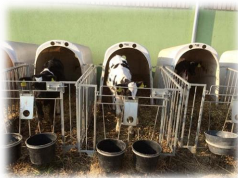
Slika 3. Iglui za telice

Odmah nakon poroda tele se počinje hraniti mliječnom zamjenicom čim je prestalo dobivati kolostrum, a slabija telad nešto kasnije. Uz to se i počinje davati krepka krma, a koja je zapravo smjesa koncentriranih krmiva i sadrži 16 do 18% sirovih proteina tzv. Starter. Uz njega se daje i sijeno po volji. Sijeno je važno jer djeluje pozitivno na razvoj predželuca, regulira i ubrzava probavu, sprečava nadimanje. Nakon hranidbe teladi sa starterom prelazi se na smjesu Grower s time da se pazi da je prijelaz postupan. Silaža se počinje davati nakon trećeg mjeseca starosti. Telad se polako počinje privikavati na silažu uz male količine. Daje se travna silaža jer sadrži više bjelančevina i karotina od kukuruzne silaže. Nakon 3 tjedna telad se premješta u skupni boks po 10 komada ili u iglue za telad gdje se drže do 2 mjeseca starosti, nakon toga telad se premješta u poseban objekt. Muška telad se tovi 14 mjeseci cca 500 kg te se stavlja na slobodnu prodaju.