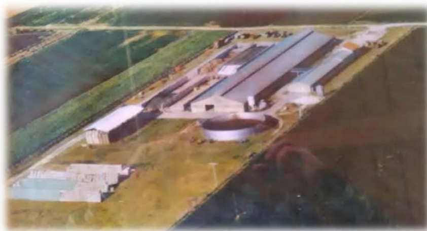
Slika 1. OPG Glavaš

Trenutno imaju 149 muznih krava od kojih su 22 krave u suhostaju i 30 telića. Na gospodarstvu je zaposleno 7 radnika koji su raspodijeljeni u dvije smjene od kojih je jedan veterinar koji je prisutan na farmi radi pregleda krava ili bilo kakve intervencije oko liječenja i umjetnog osjemenjivanja. Također su radno aktivni i članovi obitelji.