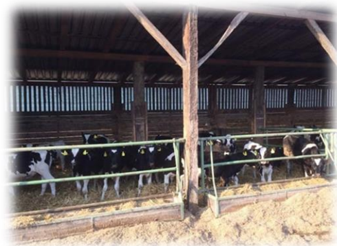
Slika 4. Objekt za telice