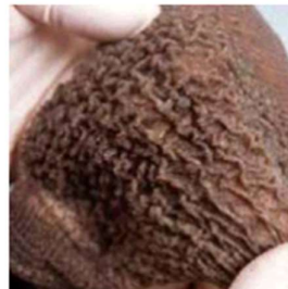
Slika 2. Prikaz razvoja papila buraga ovisno o režimu hranidbe