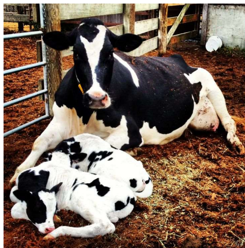
Slika 4. Krava Holstein pasmine sa teladi

Smanjenjem životne dobi junica pri prvom teljenju moguće je povećati profit tijekom vijeka iskorištenja junica, uz uvjet da se izbjegne prekomjerno povećanje masnog tkiva u trupu junica.