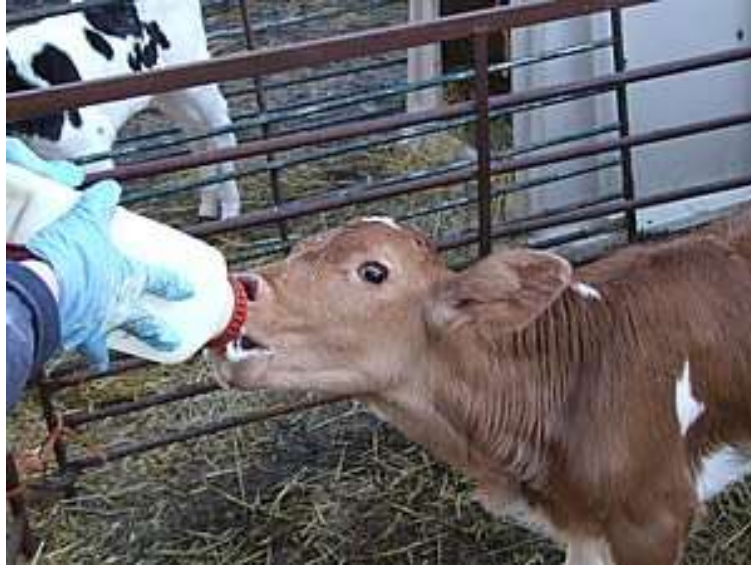
Slika 3. Napajanje teleta punomasnim mlijekom