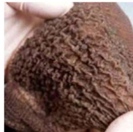
Slika 2. Prikaz razvoja papila buraga ovisno o režimu hranidbe