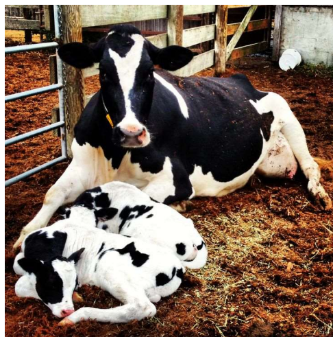
Slika 4. Krava Holstein pasmine sa teladi

Smanjenjem životne dobi junica pri prvom teljenju moguće je povećati profit tijekom vijeka iskorištenja junica, uz uvjet da se izbjegne prekomjerno povećanje masnog tkiva u trupu junica.