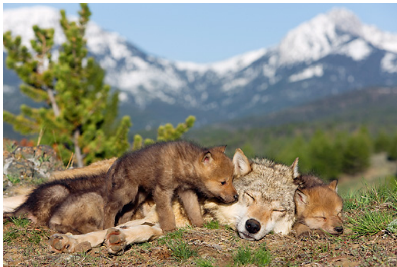
Slika 5. Vučica sa štencima

vučice u brlog koji je sama priredila za njih. Mladunci uglavnom budu teški oko 500 g i dugački oko 15 cm, a u leglu obično bude od 4 do 7 štenaca. Mladi ostaju slijepi i gluhi do dva tjedna, a sišu do 2 mjeseca. Oči su im plave boje prva tri mjeseca, zatim poprimaju žutu boju. Kada navršše mjesec dana, uz majčino mlijeko, često se hrane i poluprobavljenom hranom, koju im povrate stariji članovi čopora (Štrumbelj, 2012.). Kada se približe ljetni mjeseci, mladi se skupa s ostatkom čopora sele na tzv. okupljališta gdje odrastaju. Tijekom svog odrastanja mogu promijeniti nekoliko mjesta, odnosno okupljališta ukoliko dođe do nedostatka hrane ili postoji opasnost od drugog čopora. Početkom zime, postanu dovoljno veliki te se mogu kretati skupa s čoporom po njihovom cijelom teritoriju.