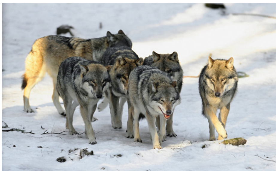
Slika 6. Čopor vukova

Kada sustignu plijen, najbliži vuk će ga napasti. Uhvaćenim plijenom se prvo hrani dominantni par, zatim njihovi ovogodišnji mladi, a na posljednjem mjestu potomci iz prijašnjih godina. Alfa par se hrani najboljim dijelom plijena. Ukoliko je plijen bio velik, čopor će se zadržati u njegovoj blizini dok ga cijeloga ne pojede. Ako se dogodi da hrane nema dovoljno za sve članove čopora, tada dolazi do disperzije (pojedini članovi napuštaju svoj matični čopor).