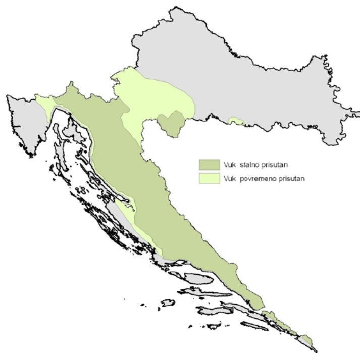
Slika 1. Rasprostranjenost populacije vuka u Hrvatskoj prema podacima do 2009. godine