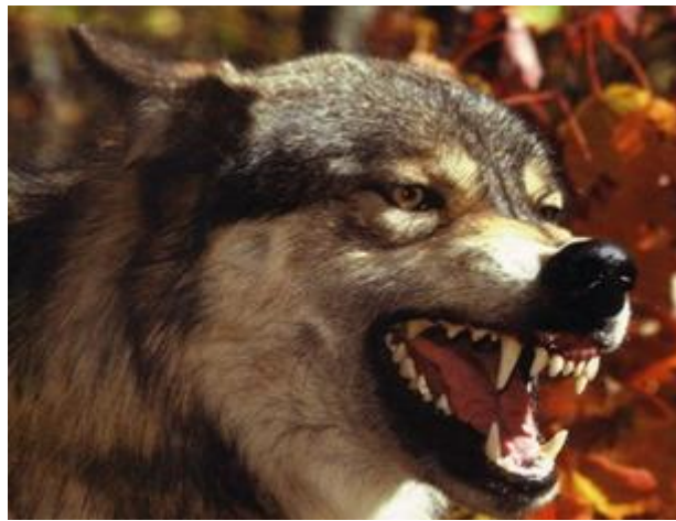
Slika 4. Sivi vuk s prepoznatljivom zubnom strukturom

Glava vuka prilagođena je hvatanju i jedenju plijena. Izdužena je prema naprijed, u prosjeku je duga 25 cm, a široka do 14 cm (Kusak, 2004.). Na vučjoj vilici odnosno čeljusti su smješteni snažni žvačni mišići i ukupno 42 specijalizirana zuba, zubne formule I: 3/3, C: 1/1, P: 4/4, M: 2/3 (Štrumbelj, 2012.). Vuk ima tipično mesoždersko zubalo, u kojem dominiraju očnjaci i pretkutnjaci. Očnjaci služe za hvatanje i usmrćivanje plijena, dok četvrti gornji pretkutnjak skupa s prvim donjim kutnjakom čine „škare“ koje vuku omogućuju lako rezanje, odnosno usitnjavanje komada mesa. Za lomljenje kostiju, vuk se koristi kutnjacima. Posljednji kutnjak na vilici je zakržljao ( http://www.life-vuk.hr ; Kusak, 2004.).