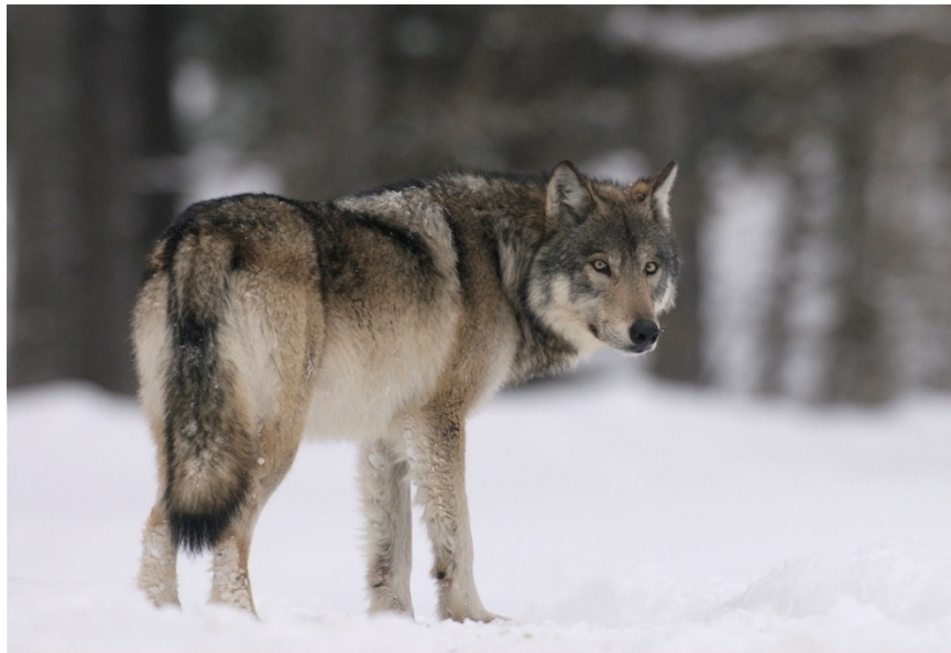
Slika 2. Sivi vuk, Canis lupus L.