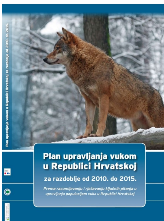
Slika 7. Naslovnica Plana upravljanja vukom u Republici Hrvatskoj za razdoblje od 2010. do 2015.

Budući da se smatra kako brojnost populacije vukova u Hrvatskoj oscilira, njime se lovno ne gospodari odnosno nije uvršten na popis divljači. Kako bi se očuvala i nadzirala populacija vukova, početkom trećeg tisućljeća donesena je odluka o izradi planskog akta pod nazivom „Plan upravljanja vukom u Republici Hrvatskoj“. U izradi ovog planskog dokumenta sudjelovali su znanstvenici, stručnjaci, lovačka društva, predstavnici ministarstava, odnosno svi koji su bili izravno ili neizravno povezani s bilo kakvim informacijama vezanih uz populaciju vuka na našem području. Prikupljanje podataka, analiza, rasprava, donošenje odluka odnosno stvaranje ovog dokumenta se provodilo kroz višegodišnje razdoblje. Prvi plan je donesen za petogodišnje razdoblje od 2005. do 2010. godine, a drugi za razdoblje od 2010. do 2015. godine ( http://www.min-kulture.hr/userdocsimages/priroda/Plan_upravljanja_vukom_2010_rev_final_21042010_final%20MK%2016%207%202010.pdf ).