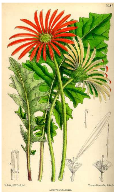
Slika 1. Prva ilustracija gerbera u boji

Gerberi potječu iz južne Afrike i Azije, a 1737. godine otkriveni su u južnoj Africi. Pronašao ih je Nizozemac Jan Frederik Gronovius. Rod je dobio ime Gerbera u čast njemačkom prirodoslovcu Traugott Gerberu, a vrsta je nazvana po Robertu Jamesonu koji je skupljao žive primjerke tijekom ekspedicije 1884. godine u okrugu Barberton. Prva ilustracija u boji pojavila se u Botanical Magazine u 1889. (slika 1), a vrstu je opisao J. D. Hooker. Nedavno je otkriveno da je čak godinu dana ranije vrstu opisao R.W. Adlam pa je naknadno izmijenjeno ime autora. Križanje gerbera započelo je u 19. stoljeću u Cambridgeu u Engleskoj, kada je Richard Lynch križao G. Jamesonii sa G. Viridifolia . Najčešći komercijalno uzgojeni varijeteti potječu od ovog križanca. Ovaj prelijep cvijet iz Barberton područja u Northern Provinceu danas je popularna vrtna biljka u cijelom svijetu i jedan je od roditelja mnogih divnih hibrida gerbera koje možemo naći u cvjećarnicama (Parađiković, 2009.).