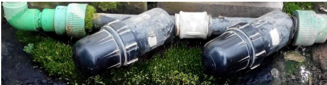
Slika 11. Filteri za pročišćavanje vode