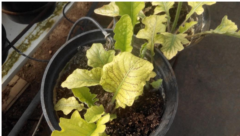
Slika 7. Napad kalifornijskog tripsa

Tijekom uzgoja provode se mjere njege neophodne za pravilan rast i razvoj biljaka. Obavlja se plijevljenje biljaka te skidanje starih listova. Prozračivanje se obavlja u proljetnim i ljetnim mjesecima ovisno o svakodnevnim vremenskim prilikama. Uz navedene mjere provodi se i zaštita nasada od bolesti i štetnika. Postavljaju se žute ljepljive ploče na kojima je uočen napad kalifornijskog tripsa ( Frankliniella occidentalis ). Suzbijanje se provodi insekticidom Laser (aktivna tvar spinosad). Primjenjuje se uz dva tretiranja u razmaku 3 do 4 dana.