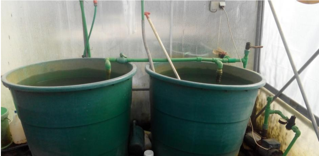
Slika 9. Plastične posude volumena po 1000 L