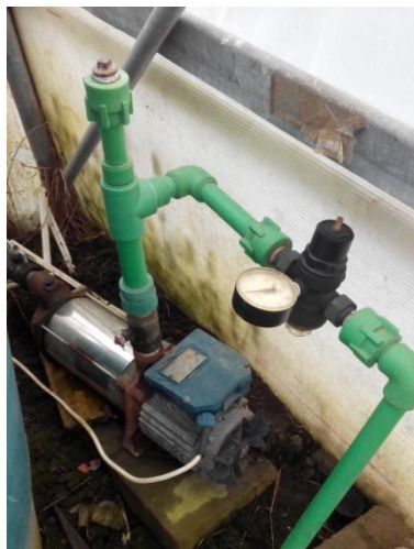
Slika 10. Crpka