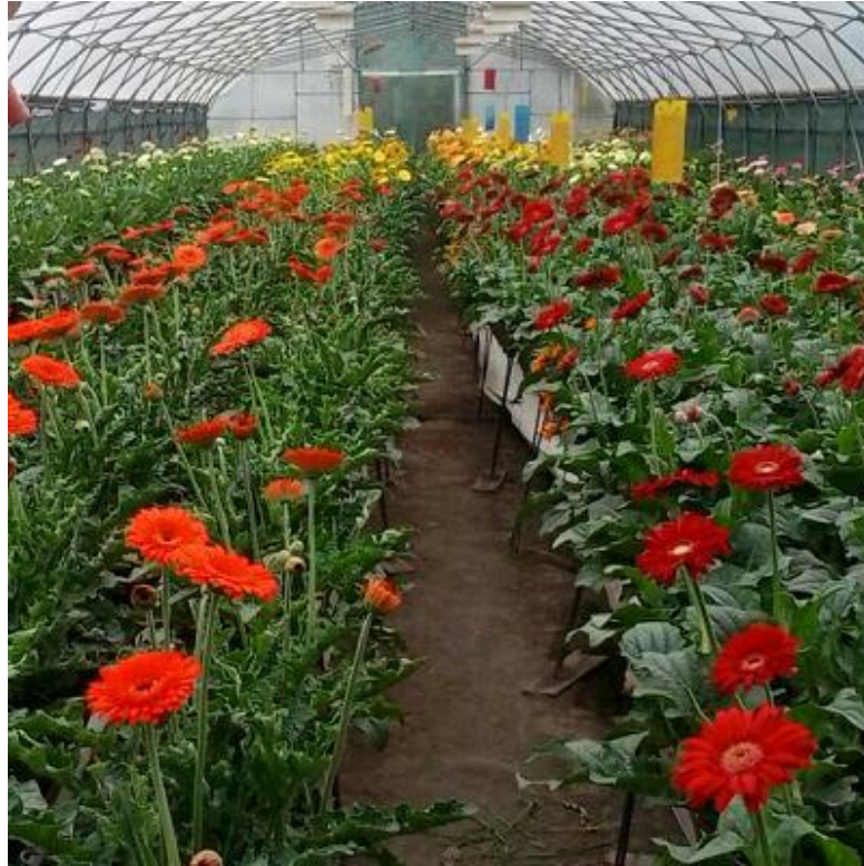
Slika 13. Gerberi