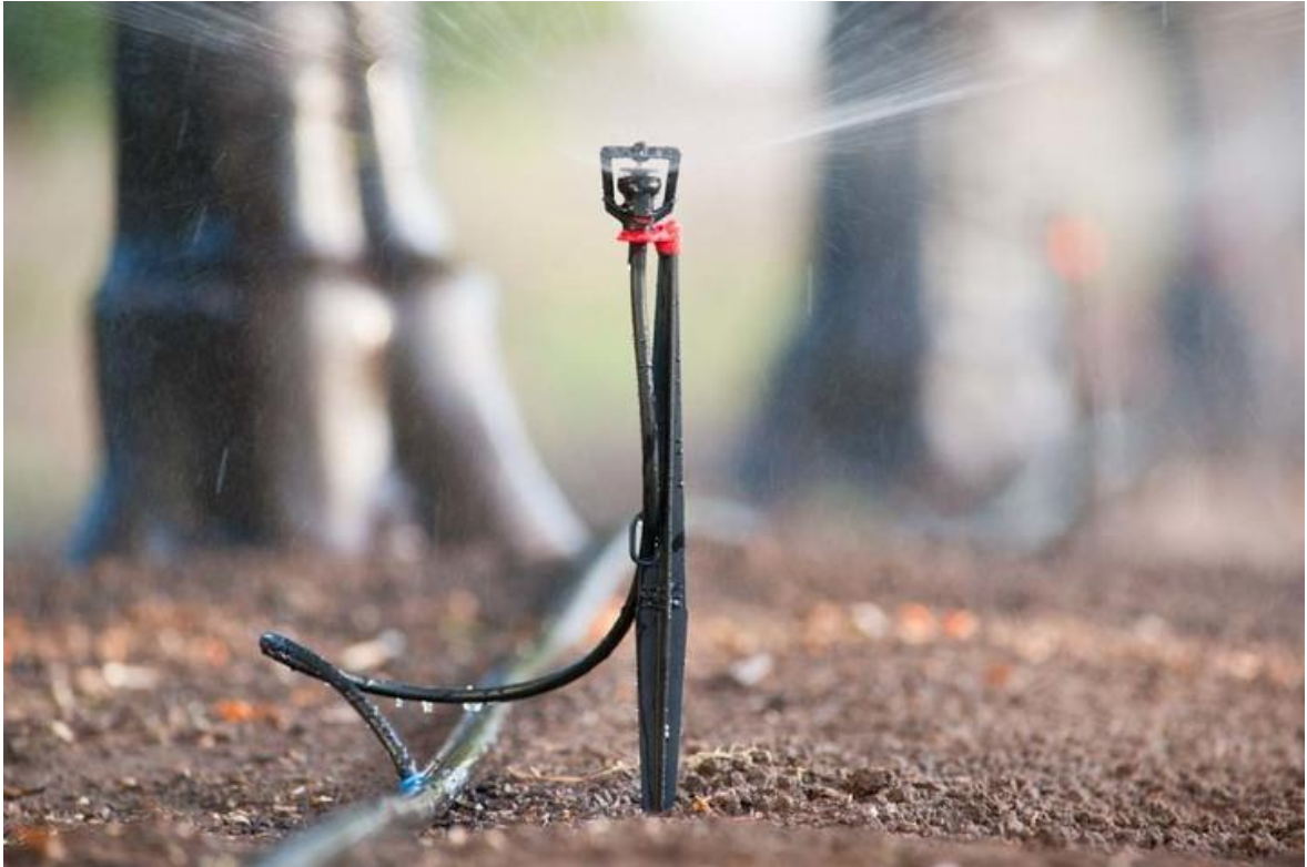
Slika 5. Mini rasprskivač