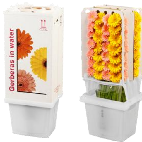
Slika 2. Pakiranje gerbera

Gerber prve cvjetove daje već 7 do 9 tjedana nakon sadnje. Cvijet se bere ručno i vrlo pažljivo. Ako se bere ranije, cvijet neće dugo trajati u vazi. Trajnost za krupni cvijet gerbera je 7 do 12 dana na temperaturi od 22 ° C, a kod 18 ° C trajnost može biti i duža, do 16 dana. Ubrani cvijet gerbera prvo se stavlja u vodu i tek 24 sata kasnije ocijedi i pakira u posebne kutije (slika 2). Cvijet se ulaže u specijalne kartonske podmetače koji čuvaju cvijet od loma tijekom transporta. Često se cvijet otprema i u kontejnerima s vodom u specijalnim auto – hladnjačama do kupca, pri čemu temperatura hladnjače treba biti 6 do 8 °C (Parađiković, 2009.).