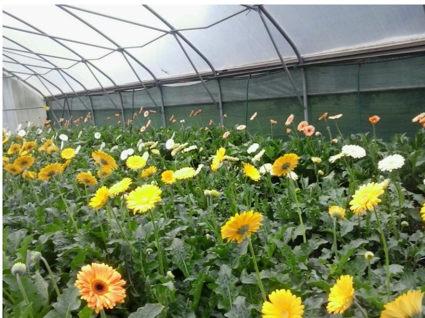
Slika 6. Različite sorte gerbera

Obitelj Maltar iz Valpova bave se već 10 godina proizvodnjom cvijeća. Osim gerbera, proizvode ruže i kale. Na površini od 600 m 2 nalaze se tri plastenika. Plastenici su opremljeni uređajima za zagrijavanje, navodnjavanje „kap po kap“ te se prilikom navodnjavanja obavlja i prihrana „fertigacija“. Za zagrijavanje plastenika koristi se peć na kruta goriva. Sadnice gerbera nabavljaju se iz Nizozemske (veličine Jiffy 4 cm i Jiffy 6 cm). Gerberi se sade tijekom polovice mjeseca lipnja u plastične lonce volumena 5 L. Za sadnju se koristi supstrat klasman TS 3 (mješavina bijelog treseta, mljevenih tresetnih vlakana – 20 %, vodotopivog gnojiva i mikroelemenata), a kao drenaža služi ekspandirana glina. Plastični lonci se nalaze na metalnom postolju, a ispod njih su žlijebovi u kojima se nakuplja drenažna voda. U plasteniku se nalazi 13 sorti gerbera, a to su: Zembla, Greeny, Enjoy, Pre extase, Alma, Mirandita, Carambole, Entourage, Candela, Wake up, Panama, Inferno i Goldstrike.