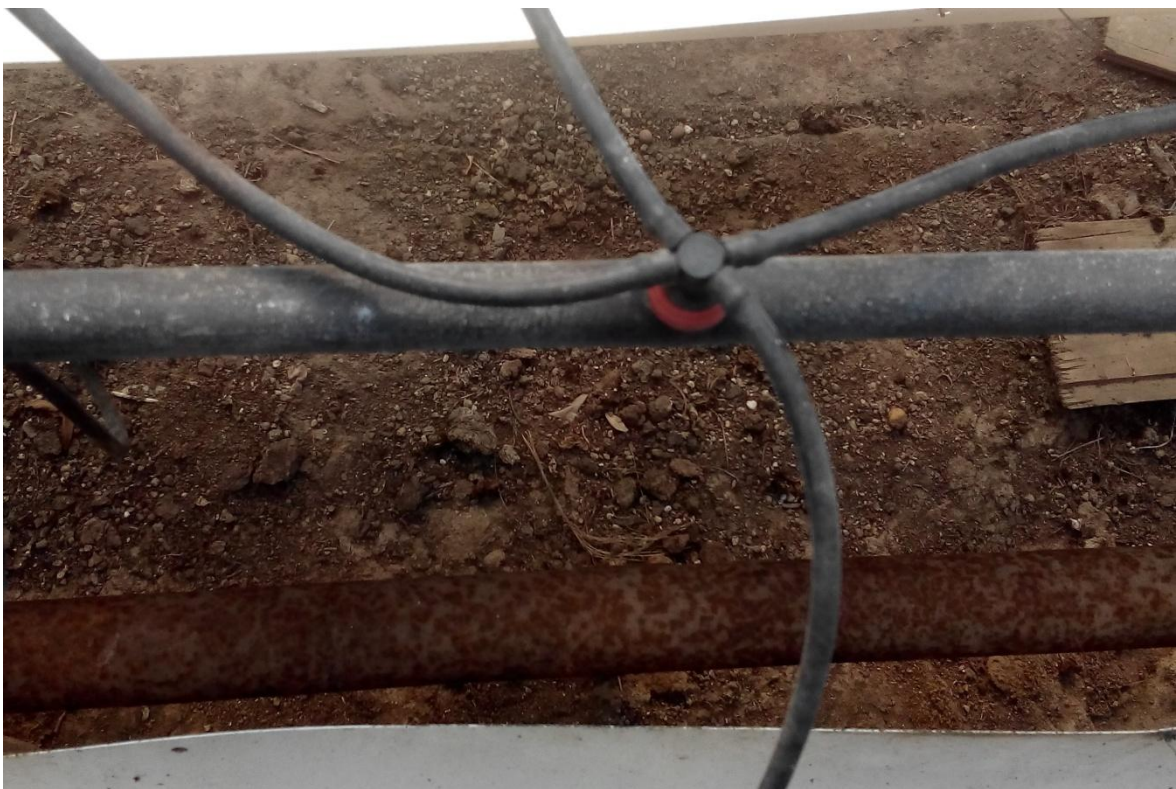
Slika 12. Lateralna cijev i spoj za kapljače

Dnevna količina vode za navodnjavanje je od 4 do 6 m 3 /1000 m 2 . Tijekom jednog dana navodnjavanje može biti od 5 do 15 puta, a intenzitet navodnjavanja može biti od 50 do 100 ml hranjive otopine po loncu, što zavisi o starosti biljke i sortimentu.