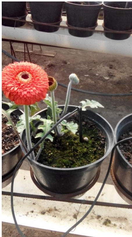
Slika 8. Ubodni kapljači

Za navodnjavanje gerbera u plasteniku je postavljen sustav „kap po kap“ – ubodni kapljači (slika 8) kako bi svaka biljka dobila istu količinu vode. U samom plasteniku su 2 plastične posude volumena po 1000 l (slika 9) na kojem je spojena crpka za zahvaćanje vode (slika 10). Na crpki se nalazi mjerač protoka vode koji služi za automatsku regulaciju kontrole protoka vode, a u sustavu filtri za pročišćavanje vode (slika 11). Na crpku su spojene glavne cijevi na koje su spojene lateralne cijevi (slika 12) koje se nalaze na tlu između redova te se putem njih dovodi voda do kapljača.