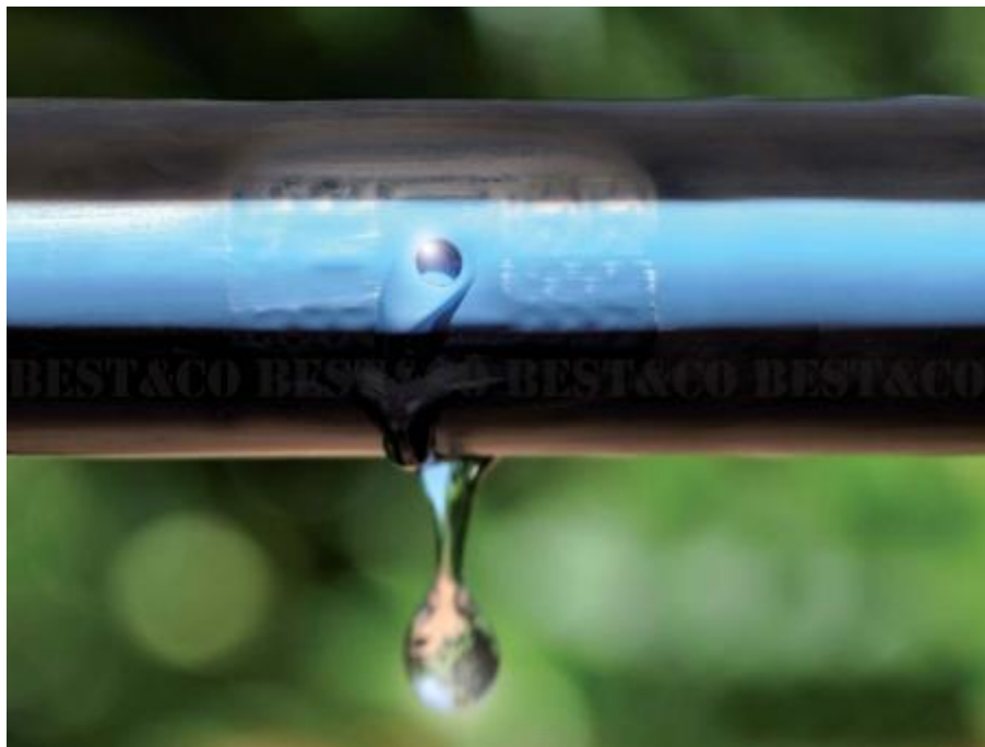
Slika 4. Navodnjavanje „kap po kap“