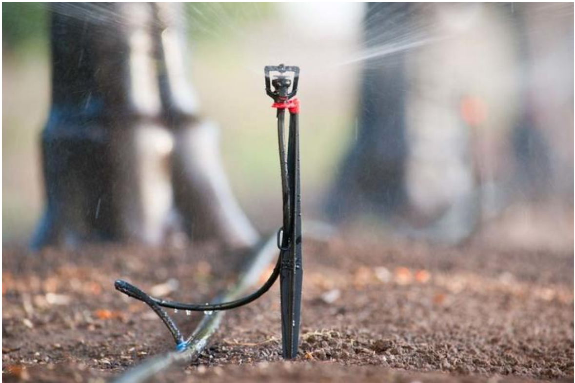
Slika 5. Mini rasprskivač