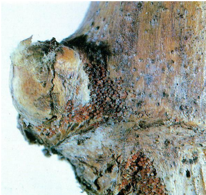
Slika 9. Jaja crvenog voćnog pauka

Zimska jaja prezimljuju na rozgvi, pogotovo oko pupova i na raspucalim mjestima kore, najčešće na dvogodišnjoj rozgvi. Ličinke iz jaja izlaze u travnju, ispočetka su narančaste, a kasnije pocrvene. Izlaženje ličinki ovisi o vremenskim uvjetima i može varirati od 3 do 5 tjedana, ali se većina ličinki pojavi u razdoblju od 10-15 dana. Početkom svibnja pojave se odrasle ženke te nakon kopulacije odlažu ljetna jaja na naličju lista, najčešće smještene uz žile. Crveni voćni pauk godišnje ima 6-8 generacija (Slika 8.). Ženke zadnjih generacija obično u kolovozu počinju s odlaganjem zimskih jaja, a intenzitet odlaganja istih se povećava kada se dan skрати ispod 13 sati (Slika 9.). Suho i toplo vrijeme pogoduje razvoju ovih štetnika, pa u povoljnim godinama dolazi do maksimalne brojnosti. (navesti lit)