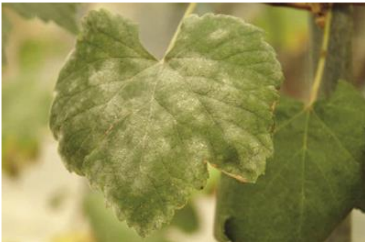
Slika 3. Pepelnica vinove loze na listu

Uzročnik bolesti je gljiva ( Uncinula necator ) koja je ektoparazit što znači da štete radi na površini organa. Simptomi su vidljivi na svim zelenim dijelovima biljke.