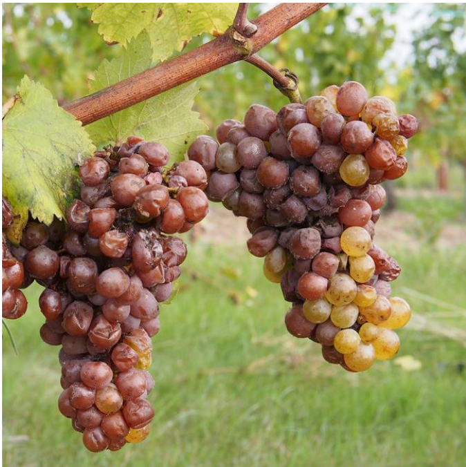
Slika 7. Grožđe zaraženo sivom plijesni

Simptomi su vidljivi najčešće pred berbu izazivajući trulež bobica (Slika 7.), odnosno cijelih grozdova. Međutim, simptomi na listovima se mogu uočiti već na proljeće u vidu žućkastih pjega koje kasnije posmeđe. Za vrijeme vlažnih dana dolazi do napada na cvatove. Pri visokoj relativnoj vlazi zraka i temperaturi oko 15°C dolazi do sporulacije, odnosno do razvoja spora gljiva. Zaraženi cvjetovi se ne otvaraju te se suše i otpadaju. Najopasnije vrijeme za zarazu je tijekom dozrijevanja grožđa. Za vlažna vremena površinu bobica, pa i unutrašnjost grozda prekriva siva paučinasta prevlaka.