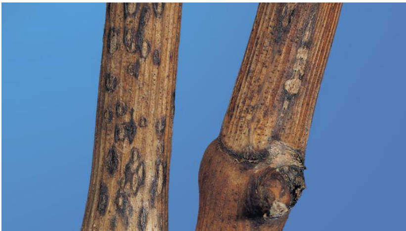
Slika 5. Rozgva zaražena crnom pjegavosti

Simptomi zaraze se uočavaju na svim zelenim dijelovima biljke (mladice, rozgva, listovi, peteljke) dok je na bobama manje uočljiva. Zaražene mladice poprimaju sivo-pepeljastu boju sa crnim pjegicama (piknidi) odakle i sam naziv bolesti (Slika 5.). Takve mladice u proljeće najčešće ne potjeraju ili potjeraju samo pojedini pupovi.