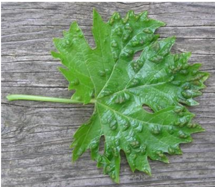
Slika 10. Erinoza