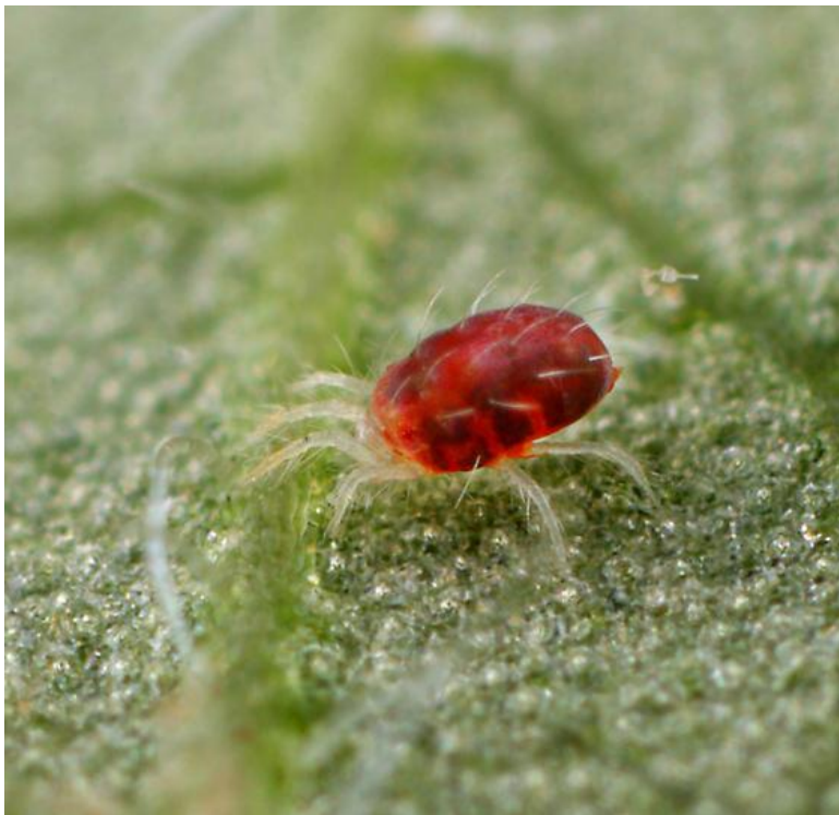
Slika 8. Crveni voćni pauk

Simptomi napada crvenoga voćnog pauka se javljaju u vidu crvenkasto-ljubičastih točkica koje su smještene uz žile listova, te se kasnije spajaju. Lišće se suši, zatim i deformira.