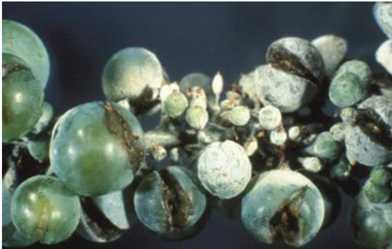
Slika 4. Pepelnica vinove loze na bobama