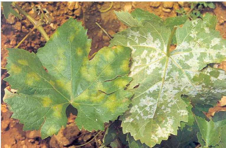
Slika 6. Listovi zaraženi plamenjačom

Simptomi plamenjače su vidljivi na svim zelenim dijelovima, najčešće na listovima i bobama, a rjeđe na cvijetu. Prvi donji listovi, odnosno lice lista je zaraženo u vidu žućkasto-zelenih mrlja koje se postupno povećavaju. Tijekom vlažnih noći na naličju lista se pojavljuje bijela prevlaka, što zapravo predstavlja konidije (Slika 6.). Zaraženo lišće izgleda kao da je spaljeno odakle i naziv bolesti.