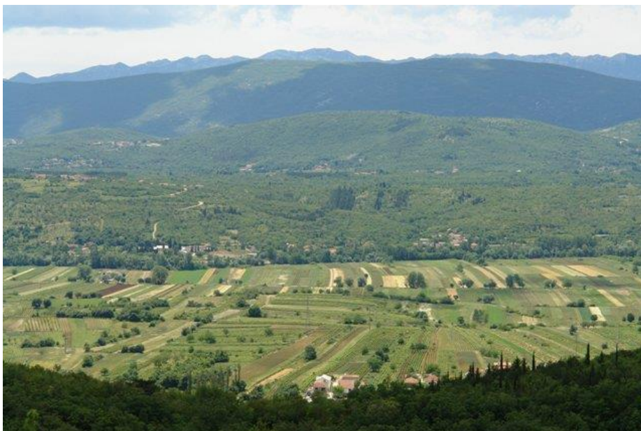
Slika 1. Imotsko polje