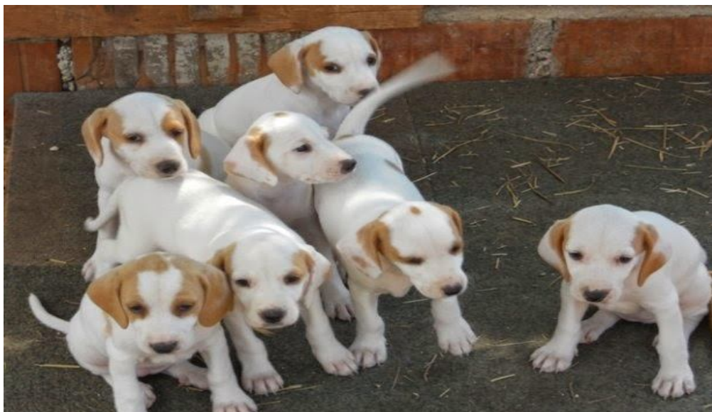
Slika 7. Štenci kratkodlakog varijeteta