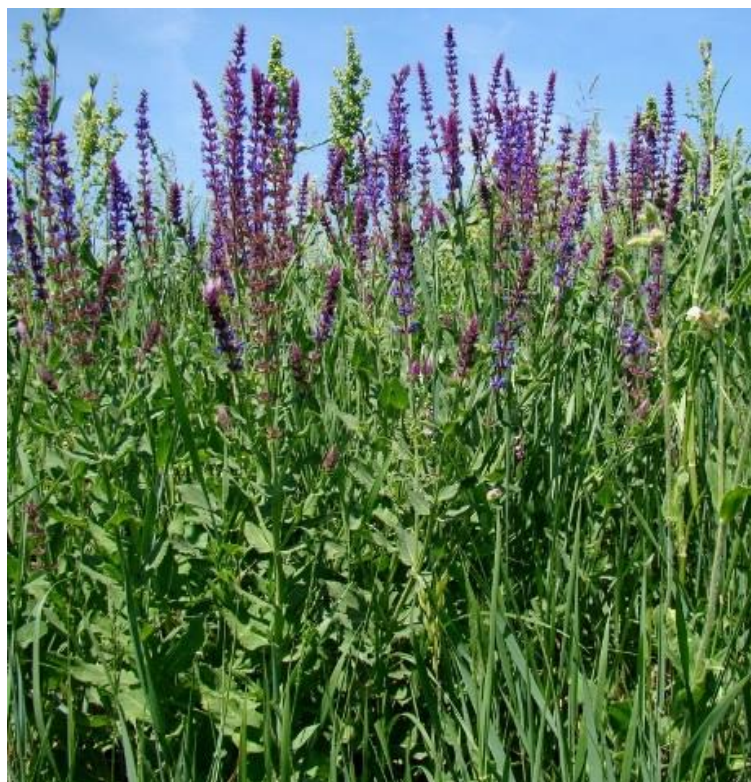
Slika 11. Stepska kadulja.