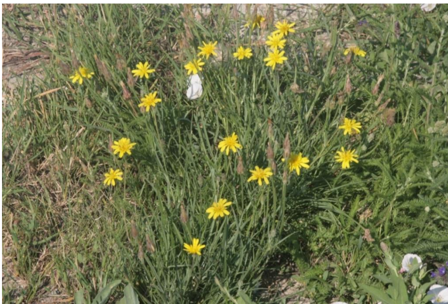
Slika 9. Sivi politovac.

Sivi politovac je višegodišnja biljka, čija rasprostranjenosti obuhvaća područja Irana, Kavkaza, Iraka, Sirije, Turske, istočne Europe, istočne Srednje Europe, Austrije, Apeninskog poluotoka i Balkanskog poluotoka (Erhardt i sur., 2008). Biljke dosežu visinu od 10 do 45 cm, ima jednostavne listove koji su linearni i cjeloviti. Ima žute, mnogobrojne cvjetove koji cvjetaju od svibnja do kolovoza (Slika 9).