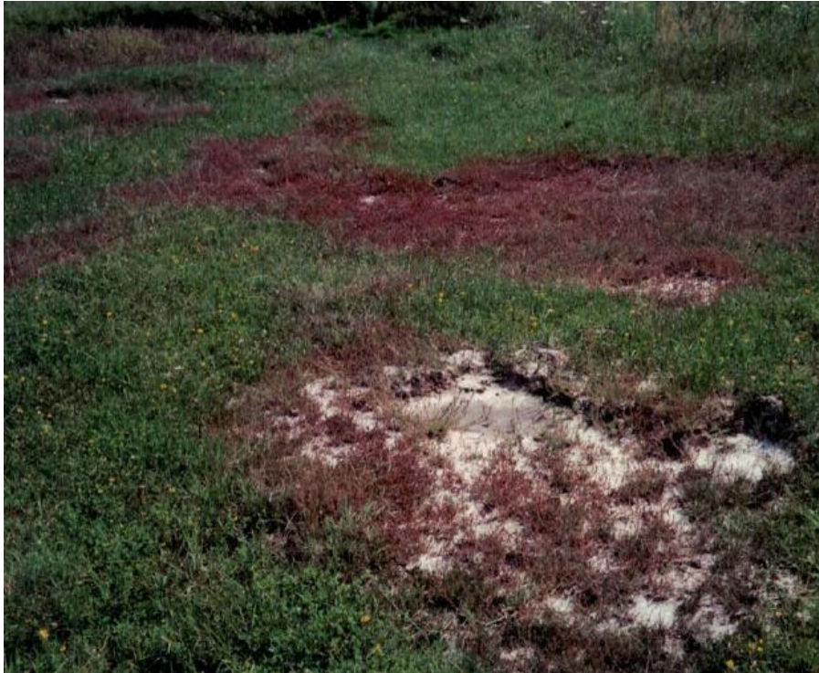
Slika 2. Zaslanjeni dijelovi pašnjaka u Trpinji.

Klima u kontinentalnoj Hrvatskoj općenito je vlažnija nego u tipičnim stepskim područjima te su stoga flora i vegetacija halofilnih travnjaka iznimno rijetke i ugrožene. Prije samo pedesetak godina površine slatina bile su veće nego što su danas. Nakon izvršene odvodnje kopanjem kanala spuštena je razina podzemne vode, pa je prestalo zaslanjivanje površinskih slojeva tla, a nekadašnje su slatine uglavnom pretvorene u oranice. Preostale su jedino vrlo male površine. Jedna od poznatih kontinentalnih slatina nalazi se u blizini naselja Trpinja, u široj okolici Vukovara (Slika 3). Ondje se održava kao pašnjak na kojem je razvijena slatinska biljna zajednica jednogodišnje kafranke siromašna sastava (Slika 4). Mjestimično je, zbog površinske koncentracije soli, do 50 % površine tla neobraslo, a broj biljnih vrsta je malen (Nikolić i sur., 2010.).