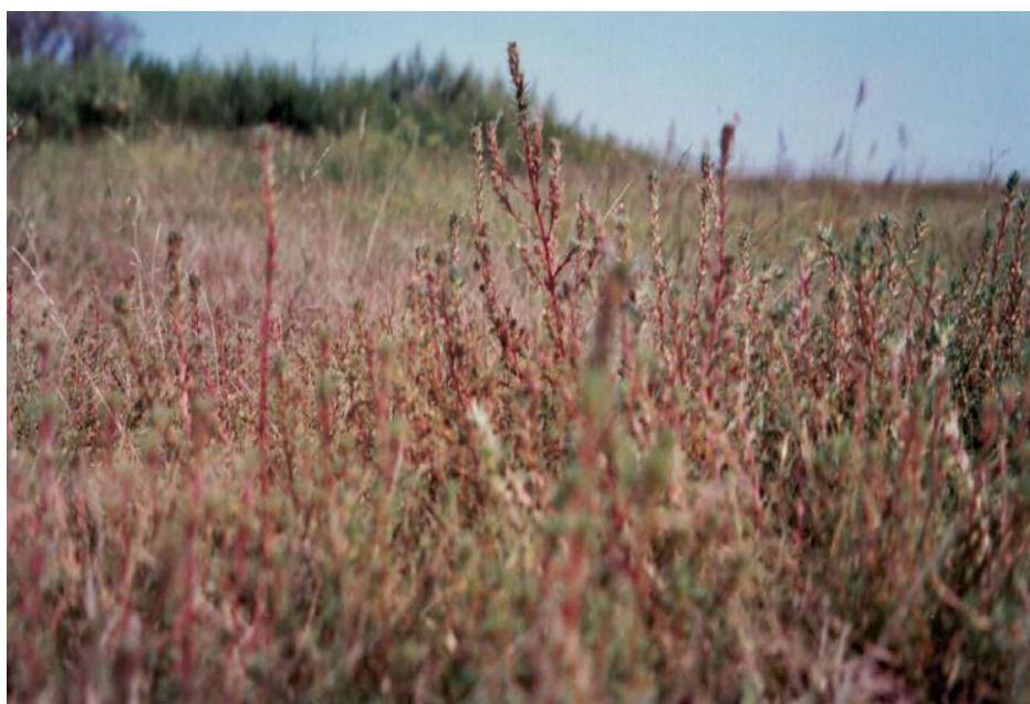
Slika 6. Jednogodišnja kafranka.

Jednogodišnja je ili višegodišnja biljka, gola ili rijetko obrasla dlakama koje luče lako hlapljive tvari koje mirišu na kamfor. Korijen je vretenast. Zeljaste stabljike su do 30 cm duge, uspravne ili polegnute i već od baze razgranjene. Stabljike su isprva zelene, a kasnije crveno nahukane i nose na sebi više izmjeničnih listova. Mesnati su listovi, veličine 5–15 mm, linearni su ili končasti i privrhu šiljasti (Slika 6).