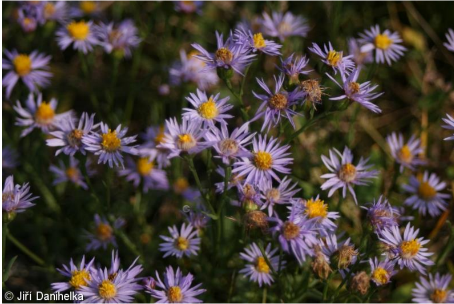
Slika 10. Panonski zvjezdan.