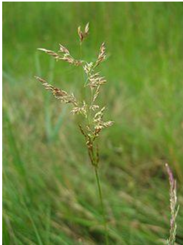
Slika 8. Slatinska bezbridnjača.

Slatinska bezbridnjača je trava koja može rasti na suhim i slanim tlima. Višegodišnja je vrsta koja proizvodi šuplje stabljike visine od 40 do 60 cm (Slika 8). Najčešće se nalaze u slanim livadama, alkalnim pijeskom i šljunkom, duž cesta, u oazama i blizu izvora. U ranijim istraživanjima pokazalo se da ima dobru toleranciju na sol, sušu i druge abiotske stresne uvjete (Hughes i sur., 1975).