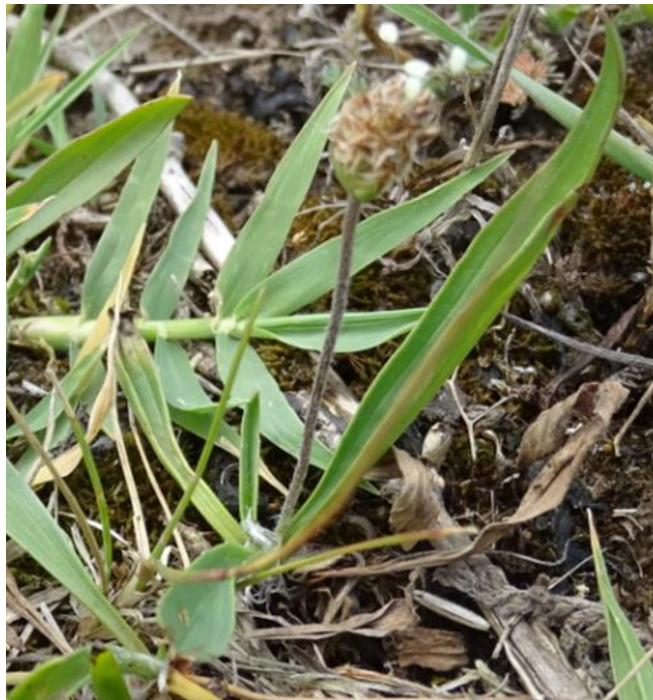
Slika 7. Sitnocvjetni trputac.

Sitnocvjetni trputac je niska jednogodišnja biljka. Batvo je približno iste dužine kao i listovi, oblo je i plitko izbrazdano. Svi su listovi skupljeni u prizemnoj rozeti, linearni i dugi 2–15 cm (Slika 7). Uz svaki cvijet nalazi se gola, jajasta ili jajasto-suličasta brakteja, duga 1,5–2 (–3,5) mm. Četveročlano ocvječje sastavljeno je od čaške i vjenčića. Lapovi su 1,5–2 mm dugi, zeleni, sa širokim kožičastim rubom. Bjelkaste latice su gole i međusobno srasle u cijev dužine 2 mm- Prašnici imaju bjelkaste prašnice, a prirasli su prašničkim nitima za cijev vjenčića. Plod je jajasti tobolac, 3–4 mm dug, dvostruko duži od čaške, sa 6–10 (–15) sjemenaka veličine 1–1,5 mm ( http://hirc.botanic.hr/fcd/ ).