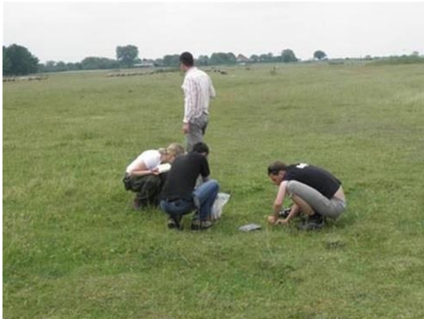
Slika 5. Botaničko istraživanje pašnjaka u Trpinji.

Vaskularnu floru pašnjaka u Trpinji istraživali su tijekom 2011. botaničari iz Državnog zavoda za zaštitu prirode, u suradnji s Javnom ustanovom za upravljanje zaštićenim prirodnim vrijednostima na području Vukovarsko-srijemske županije (Slika 5).