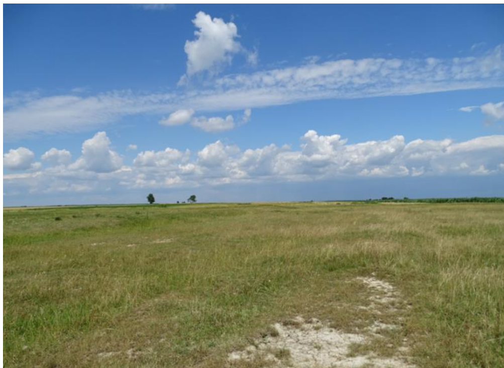
Slika 4. Pašnjak u Trpinji, u lipnju 2015.