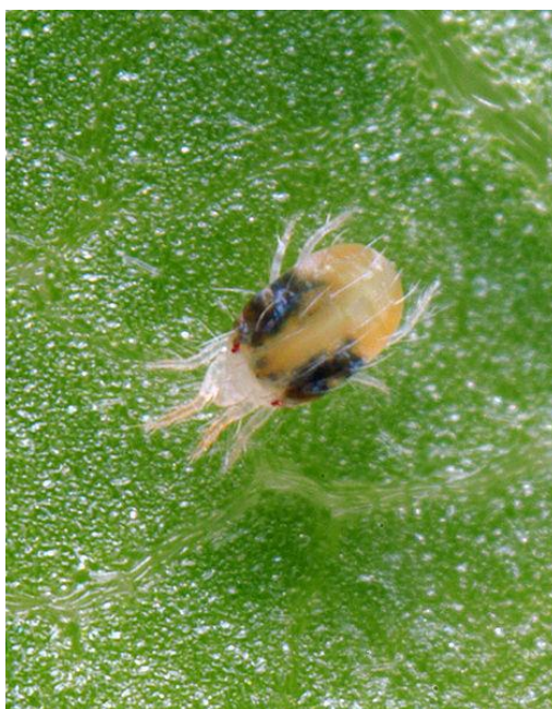
Slika 8. Koprivina grinja ( https://upload.wikimedia.org )