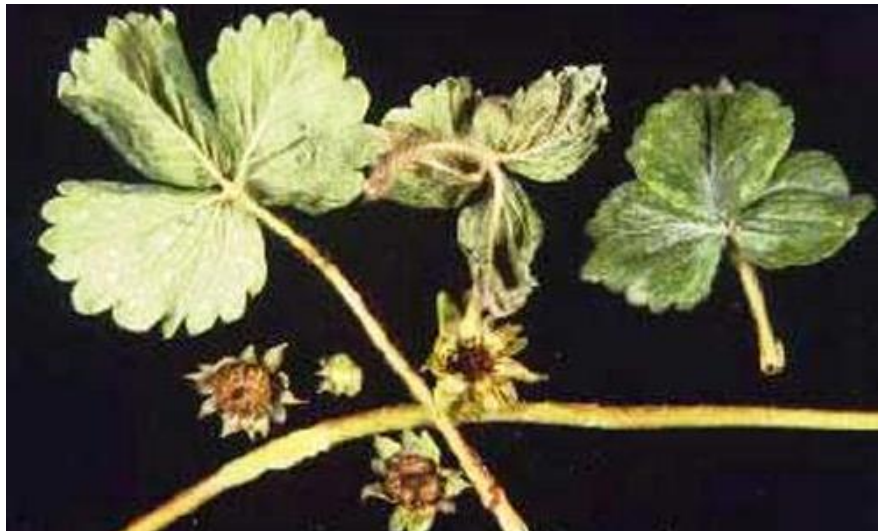
Slika 7. Simptomi napada jagodine grinje ( http://entnemdept.ufl.edu )

Prema Maceljskom (1999.) najbolji načini zaštite od ovih grinja je preventivna mjera sadnje zdravih i nezaraženih sadnica. Biološka zaštita se provodi unošenjem korisnih grinja kao što su vrste iz porodice Phytoseidae . Predatorska grinja Neoseulus cucumeris vrlo je učinkovita u suzbijanju jaja i odraslih oblika grinje ako se unese u jagodnjak dok je grinja raširena u maloj populaciji (Petrović, 2012.). U Hrvatskoj ne postoje registrirana sredstva za zaštitu od jagodine grinje ( https://fis.mps.hr ).