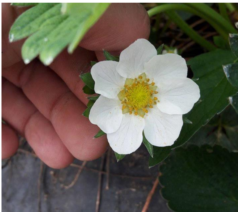
Slika 2. Cvijet sorte Joly

U radu Ostojić i sur. (2016.) utvrđeno je da termalna svojstva i toplinska stabilnost svježe jagode i jagodinog soka sorte Joly koji su uzgojeni pod različitim uvjetima uzgoja utječu na toplinsko ponašanje jagoda sorte Joly. Uzorci su testirani na temperaturama od -100^{\circ}\text{C} do 250^{\circ}\text{C} te je zaključeno da svježa jagoda ima slična termalna svojstva kao i jagodin sok te autori smatraju da su manja odstupanja nastala zbog različitog načina uzgoja.