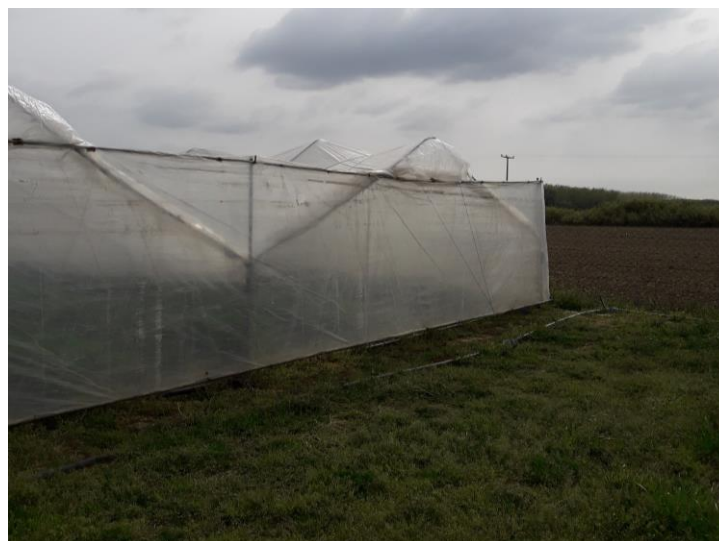
Slika 15. „Veronez“ tip plastenika

Gospodarstvo ima 14 plastenika za uzgoj jagoda. Plastenici su višetunelski „Veronez“, demontažni radi lakšeg preseljenja plastenika na novi nasad jer se u pravilu jagoda ponovo sadi svake 2-3 godine. Plastenici su postavljeni na ravnoj površini bez depresija. Dimenzije plastenika su 65m×5m površine 325 m 2 (Slika 15.).