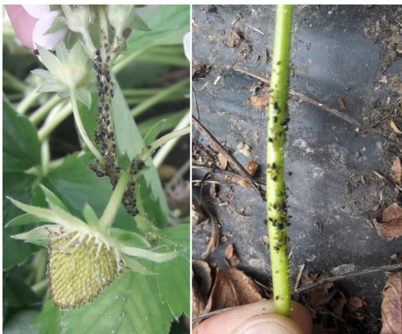
Slika 6. Lisne uši na jagodi

Kod suzbijanja lisnih uši vrlo je važno redovito pregledavati nasade jer one u kratkom vremenu mogu učiniti velike štete (Gotlin-Čuljak, 2015.). Dozvoljeno sredstvo u Hrvatskoj za suzbijanje lisnih uši u zaštićenom prostoru je Movento, a kod uzgoja na otvorenom dozvoljeno sredstvo je Pirimor ( https://fis.mps.hr ).